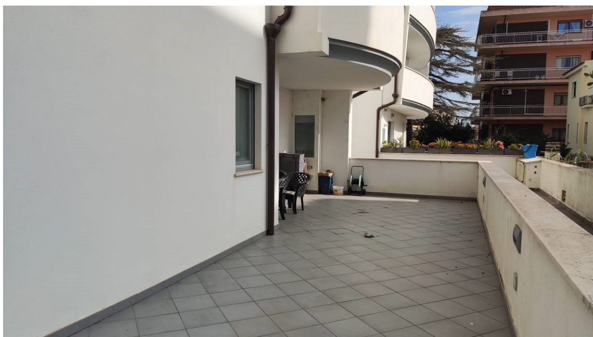
Figura 27: Cortile nel lato sud dell'unità immobiliare e veranda