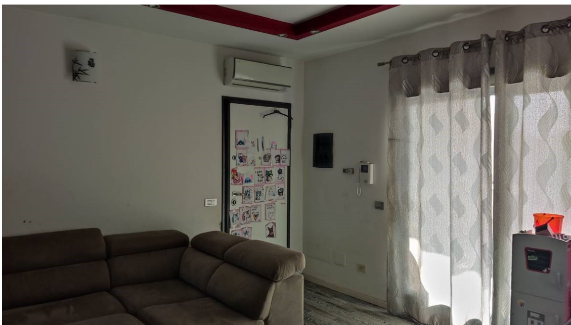
Figura 9: Soggiorno – vista portone di ingresso e porta finestra sul lato sud