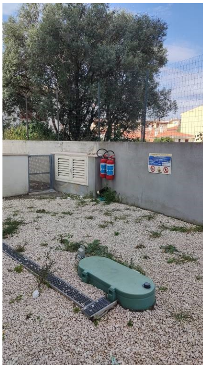
Figura 32: dettaglio cisterna di accumulo del gas interrata ad uso condominiale, accessibile dal cortile sul lato nord dell'unità immobiliare