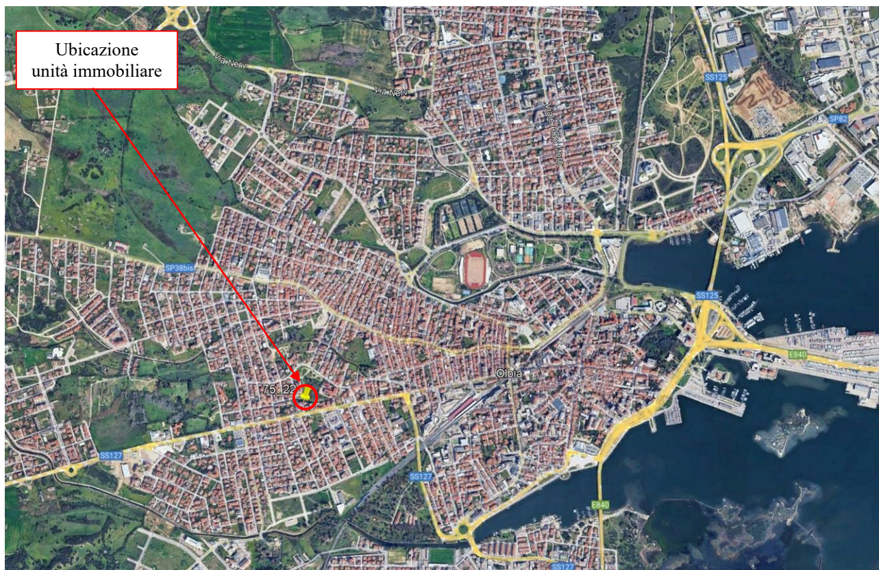
Figura 1: Inquadramento su vista satellitare Per le autorizzazioni all'utilizzo si rimanda al link: https://www.google.com/intl/it_it/permissions/geoguidelines.html