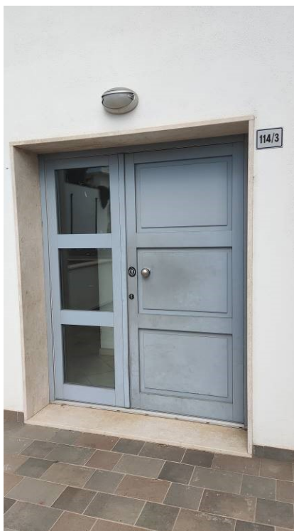
Figura 6: Portone d'accesso al fabbricato