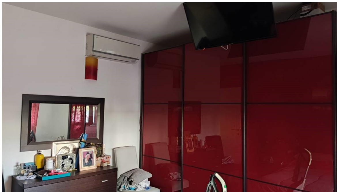
Figura 20: Camera matrimoniale