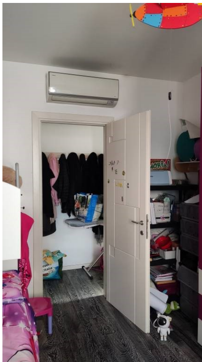
Figura 18: Camera 2