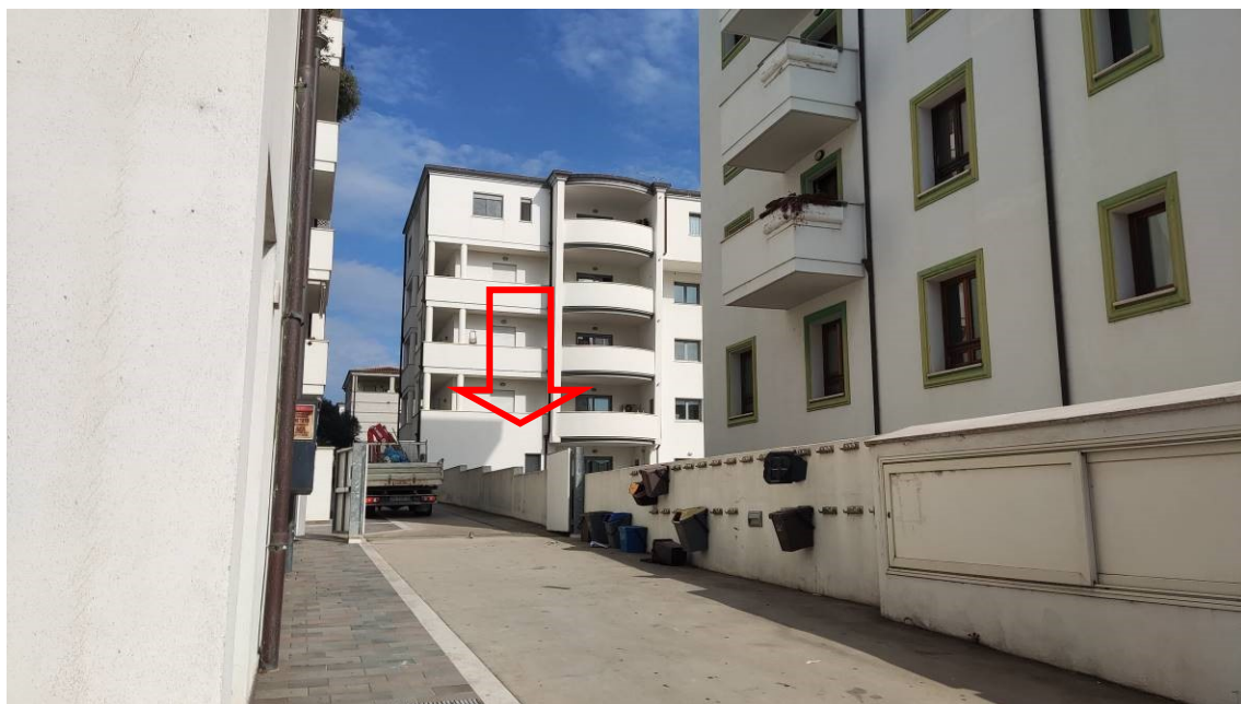
Figura 3: Vista dell'immobile da Corso Vittorio Veneto, lato sud