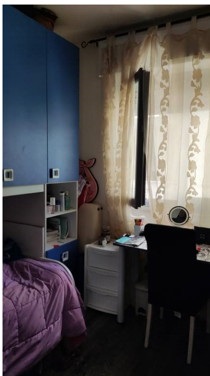
Figura 15: Camera 1