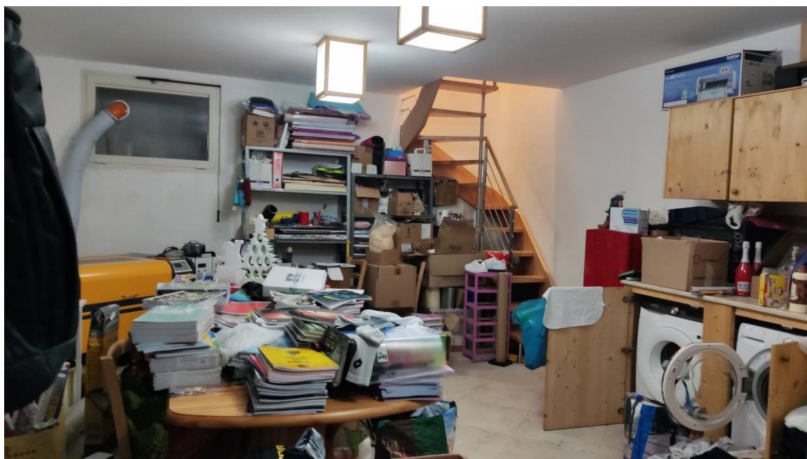
Figura 23: Cantina