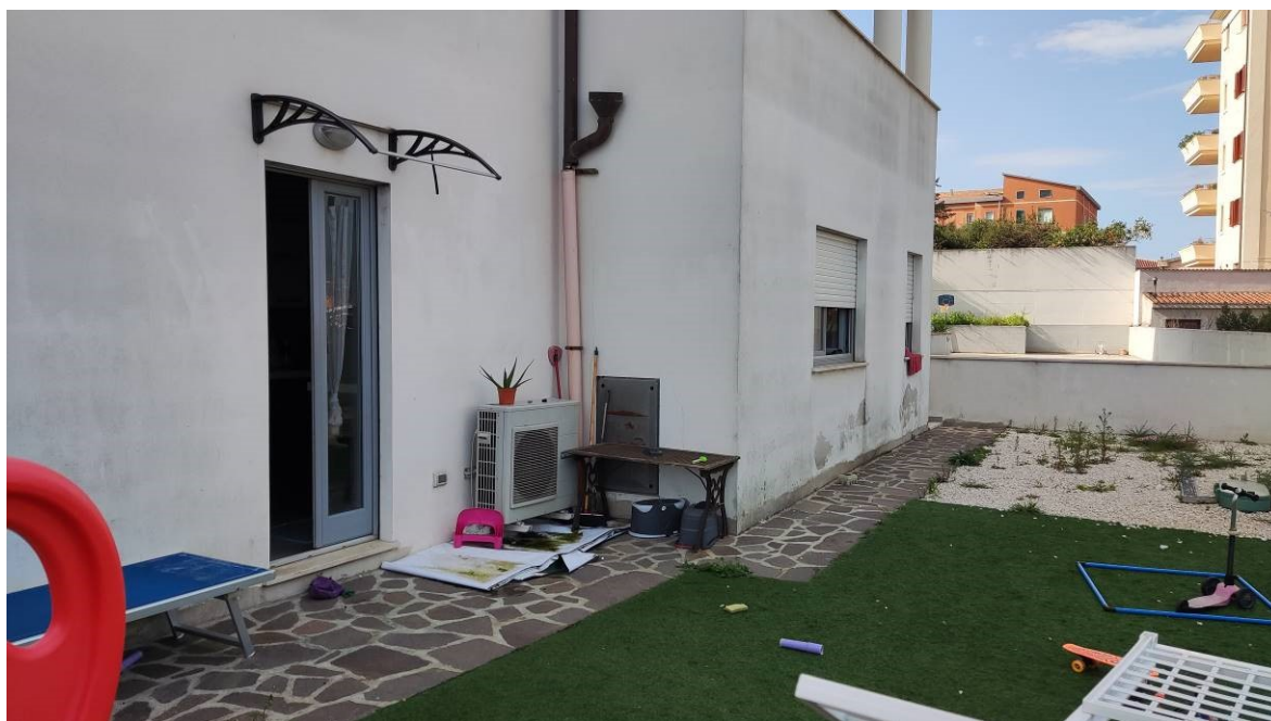
Figura 25: Cortile nel lato nord dell'unità immobiliare e cisterna di accumulo del gas interrata ad uso condominiale