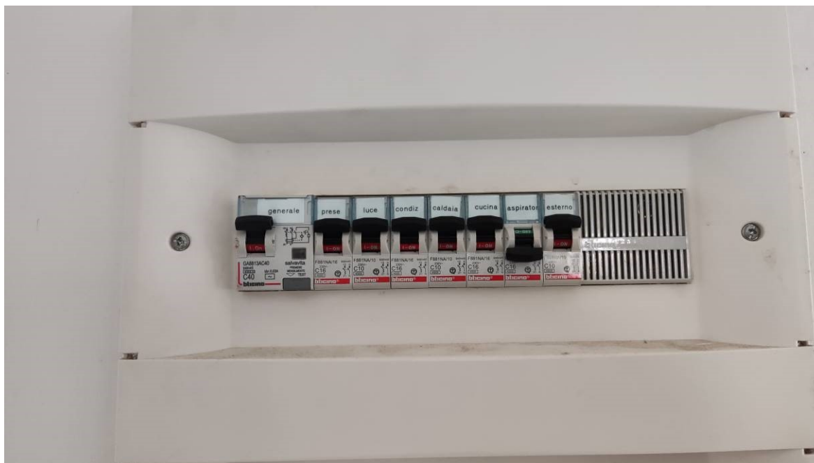
Figura 28: dettaglio quadro elettrico nel soggiorno