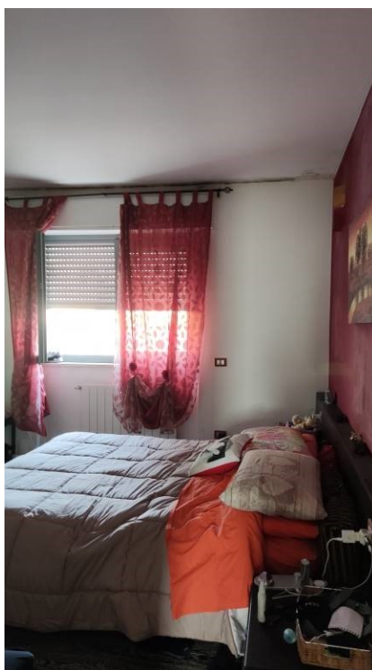
Figura 19: Camera matrimoniale