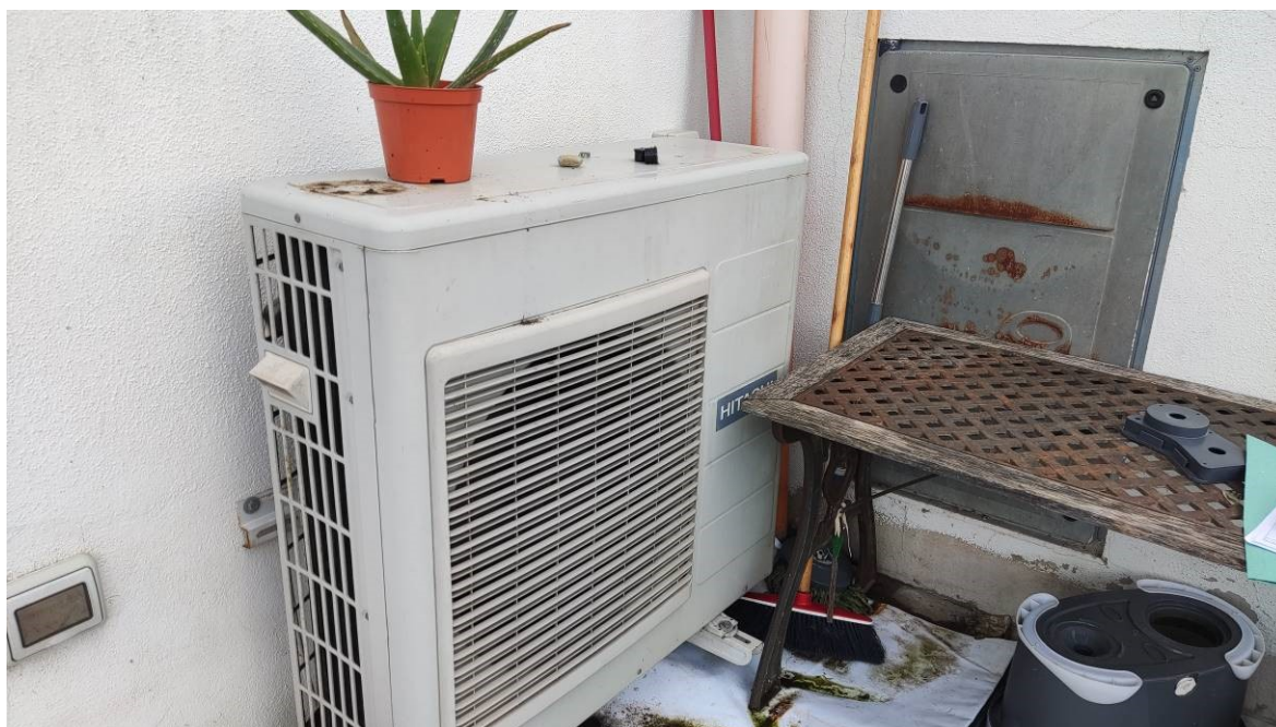
Figura 31: dettaglio impianto di climatizzazione e di aspirapolvere centralizzato nel cortile a nord dell'unità immobiliare