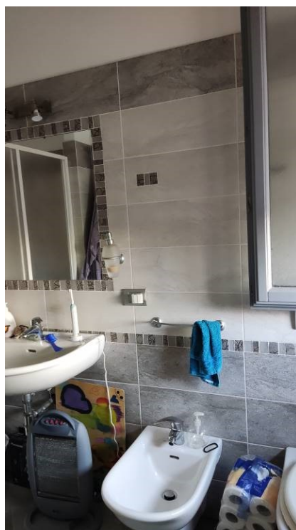
Figura 21: bagno padronale