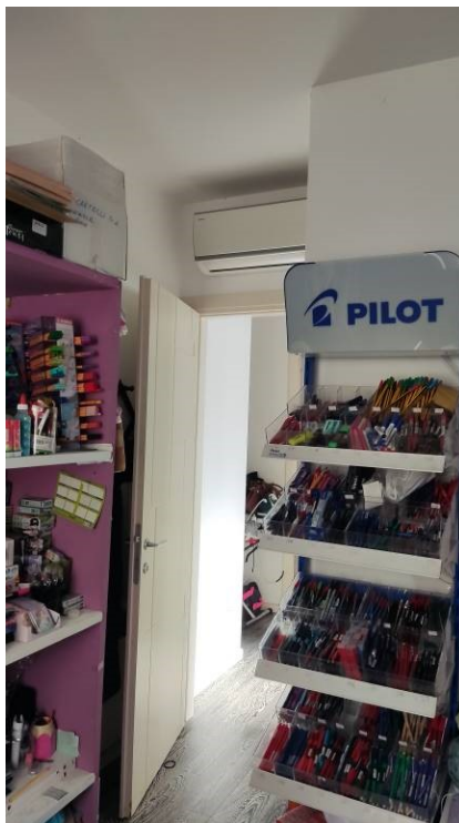
Figura 16: Camera 1