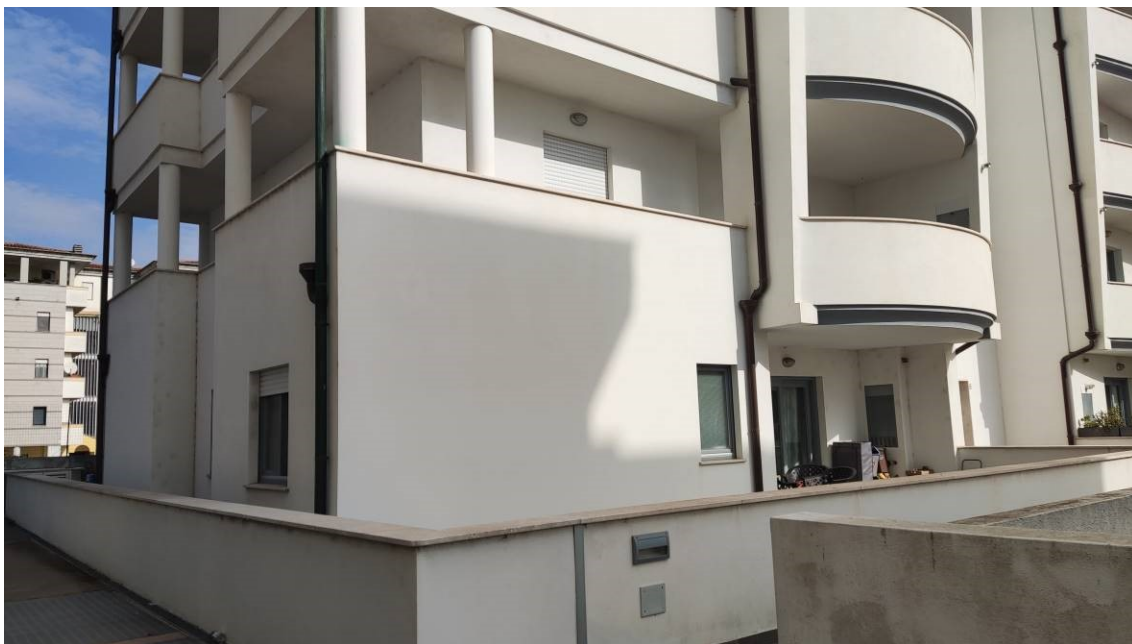
Figura 4: Vista dell'unità immobiliare dal cortile condominiale, lato sud