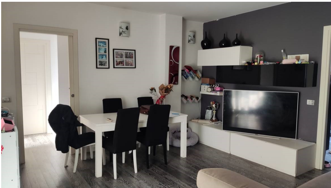
Figura 10: Soggiorno – vista portone porta del disimpegno nella zona notte