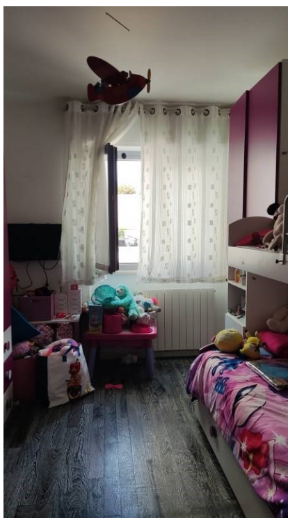
Figura 17: Camera 2