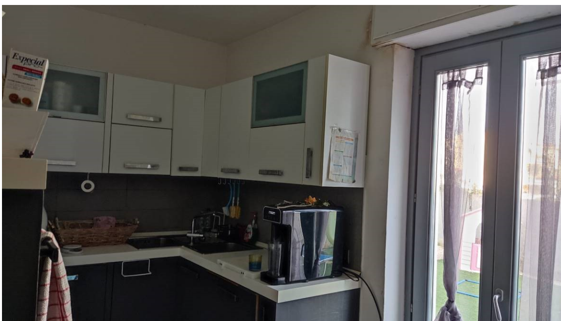
Figura 11: Cucina