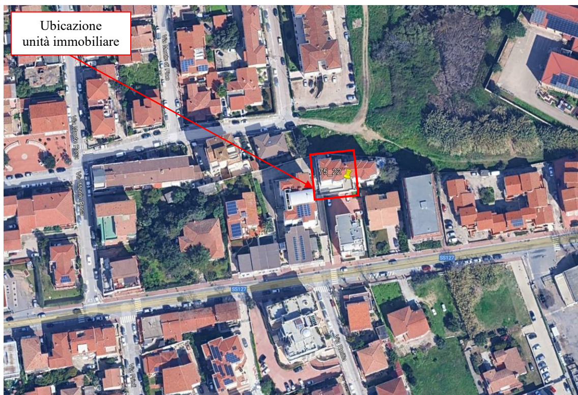
Figura 2: Dettaglio su vista satellitare