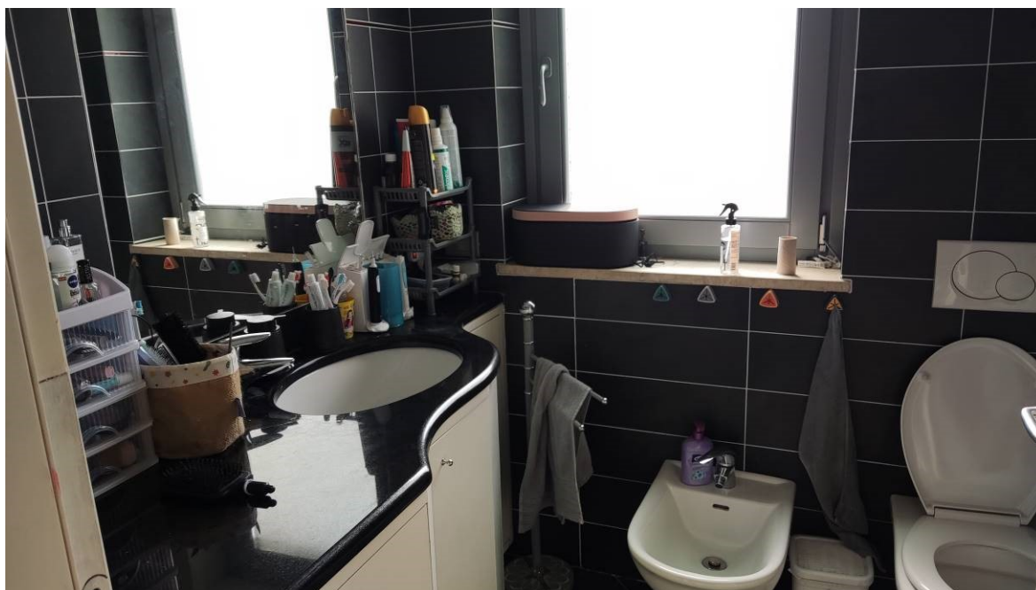
Figura 13: Bagno principale