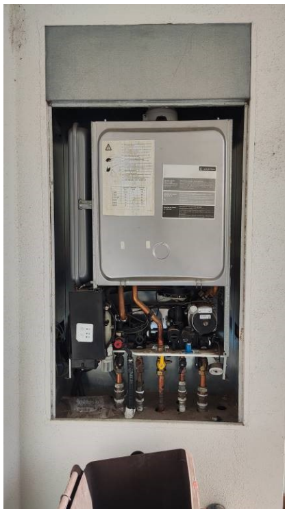
Figura 30: dettaglio caldaia a gas nella veranda a sud dell'unità immobiliare