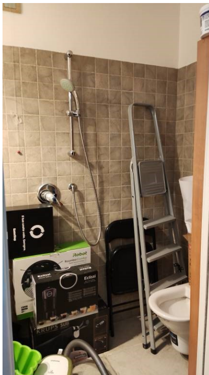
Figura 24: bagno cantina