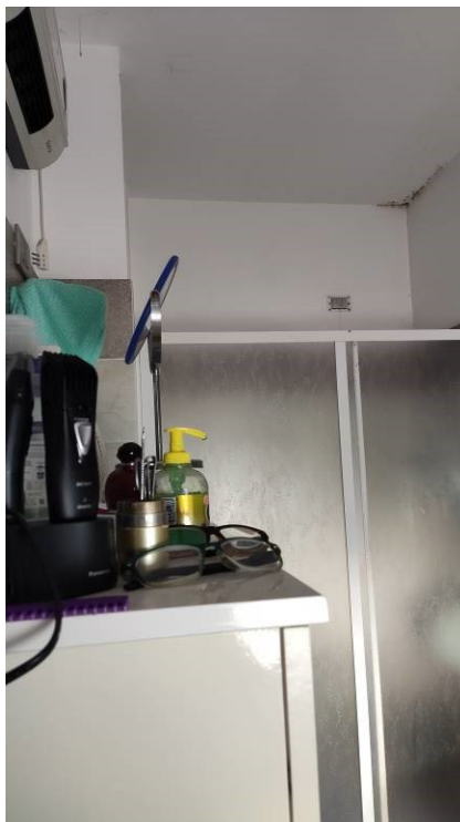
Figura 22: bagno padronale