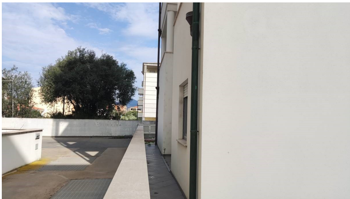
Figura 26: Cortile nel lato ovest dell'unità immobiliare e corte condominiale