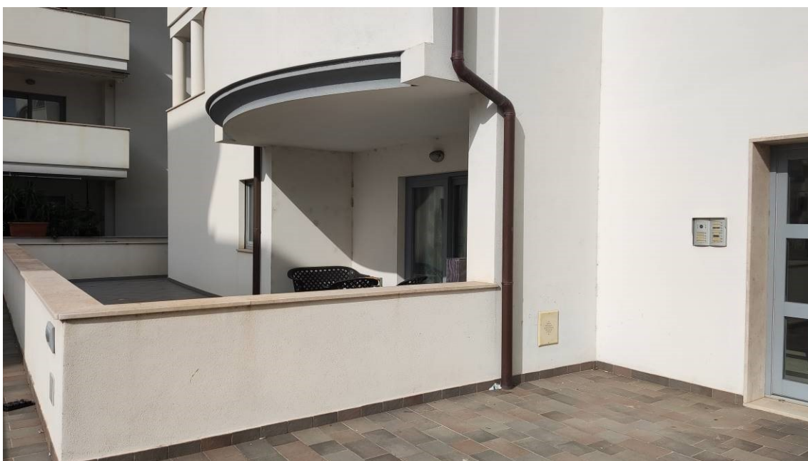
Figura 5: Vista del cortile esclusivo dell'unità immobiliare e del portone di accesso al fabbricato