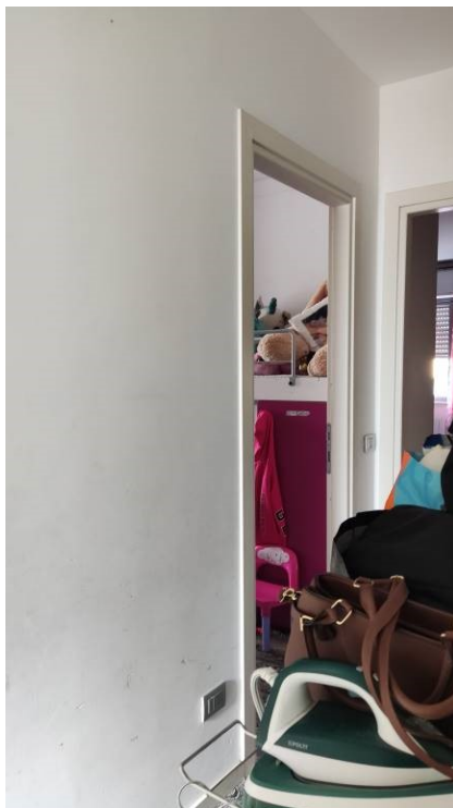
Figura 12: disimpegno zona notte