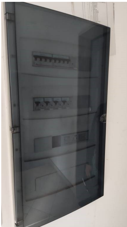
Figura 8: Quadro elettrico nel vano scala condominiale