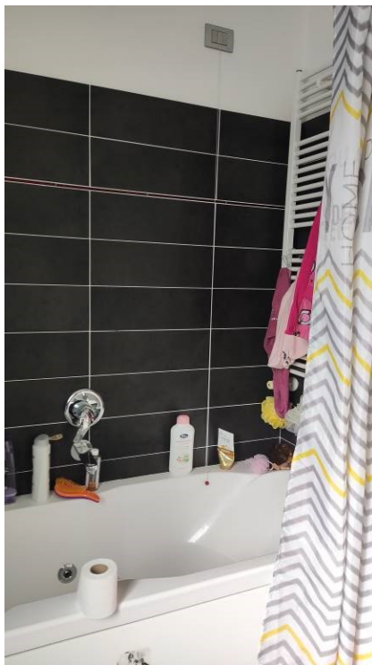
Figura 14: Bagno principale