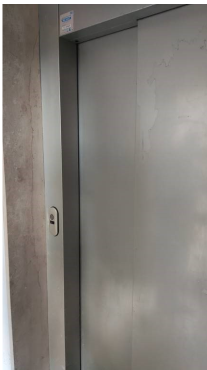
Figura 7: Ascensore condominiale