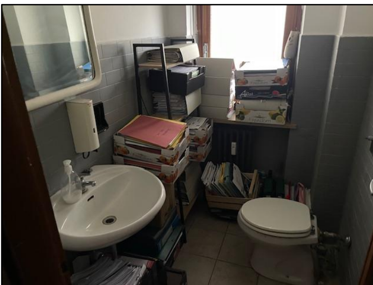
Fotografia n. 5: il bagno