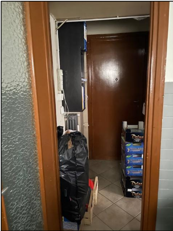
Fotografia n. 7: disimpegno