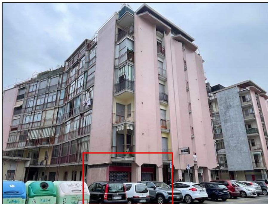
Fotografia n. 1: L'edificio residenziale sito in via Antica di Grugliasco, 7

Immobile in Rivoli (To), via Antica di Grugliasco n. 7