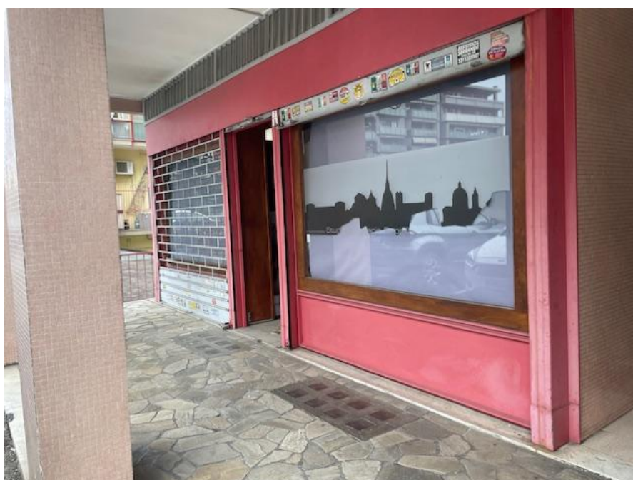
Fotografia n. 2: Facciata Sud fronte via Antica di Grugliasco