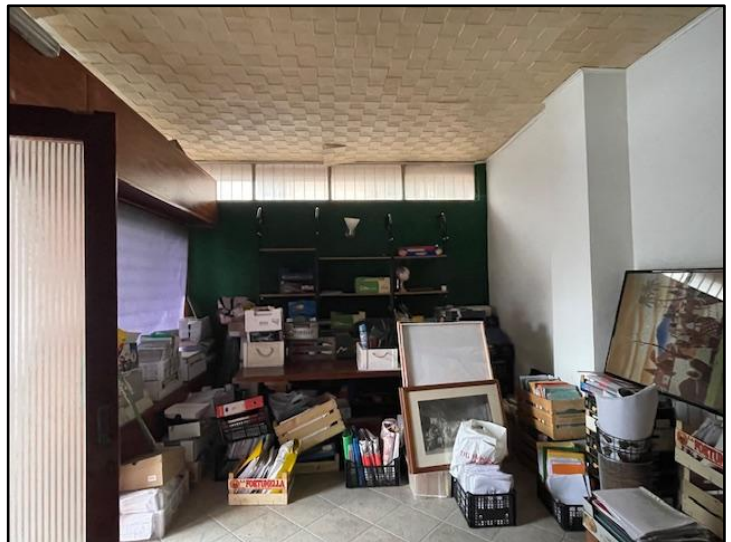
Fotografia n. 4: il negozio