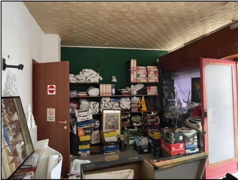
Fotografia n. 3: il negozio