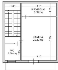
PIANO SECONDO H=3.00 m