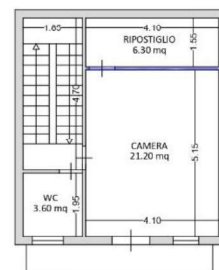
PIANO PRIMO H=3.00 m