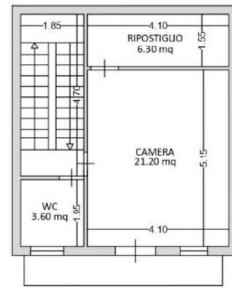
PIANO PRIMO H=3.00 m