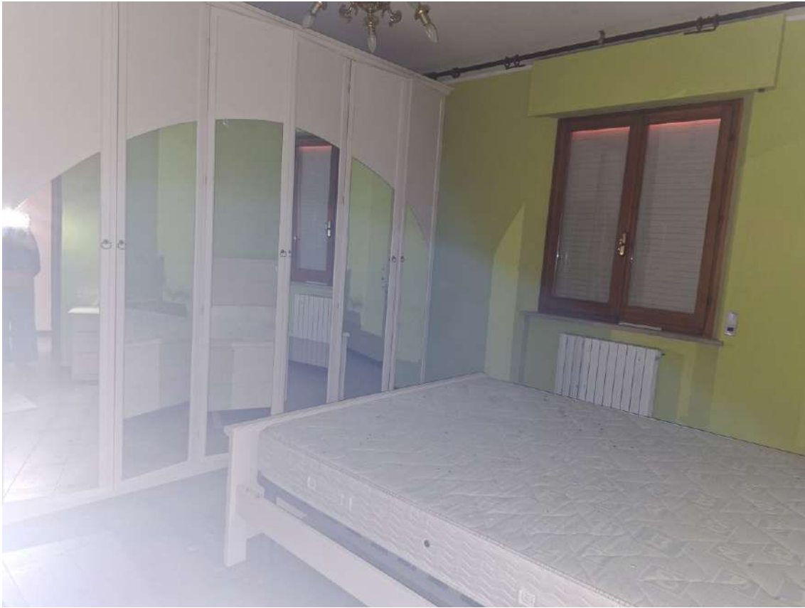
13 – camera doppia