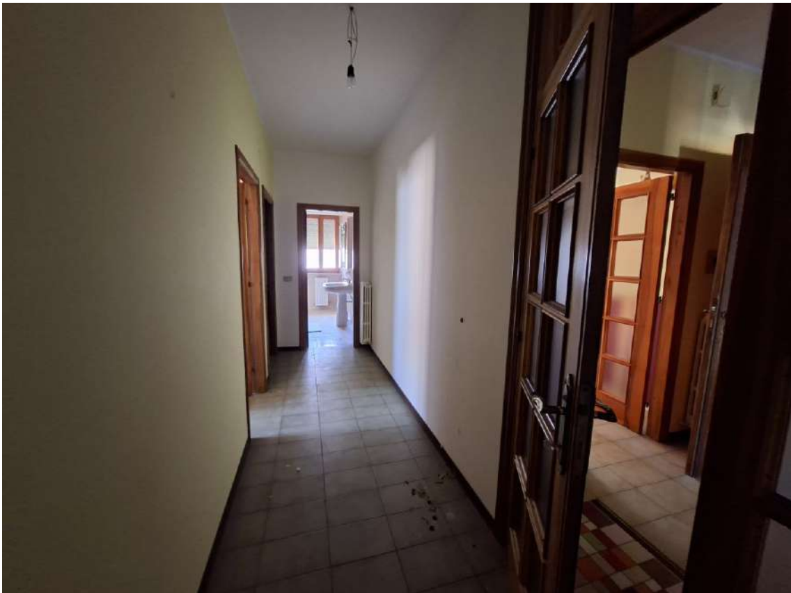
12 – disimpegno zona notte