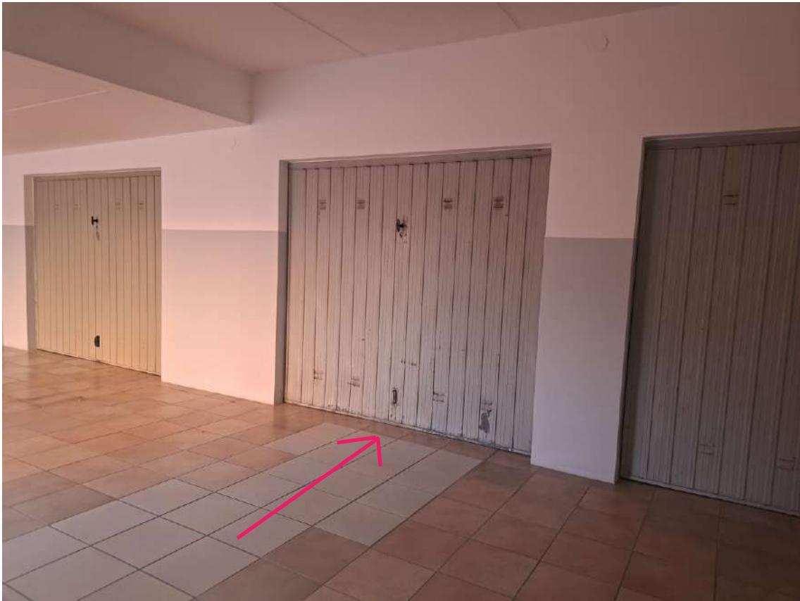
25 - autorimessa