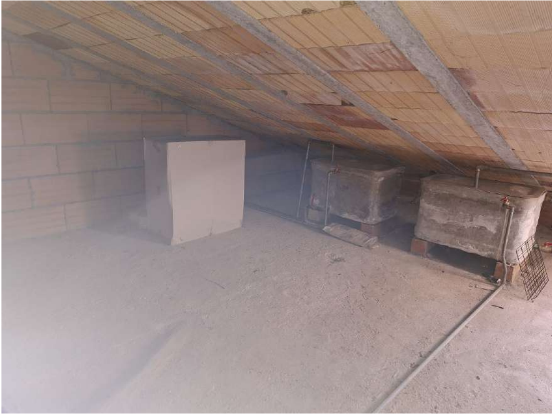
22 - soffitta