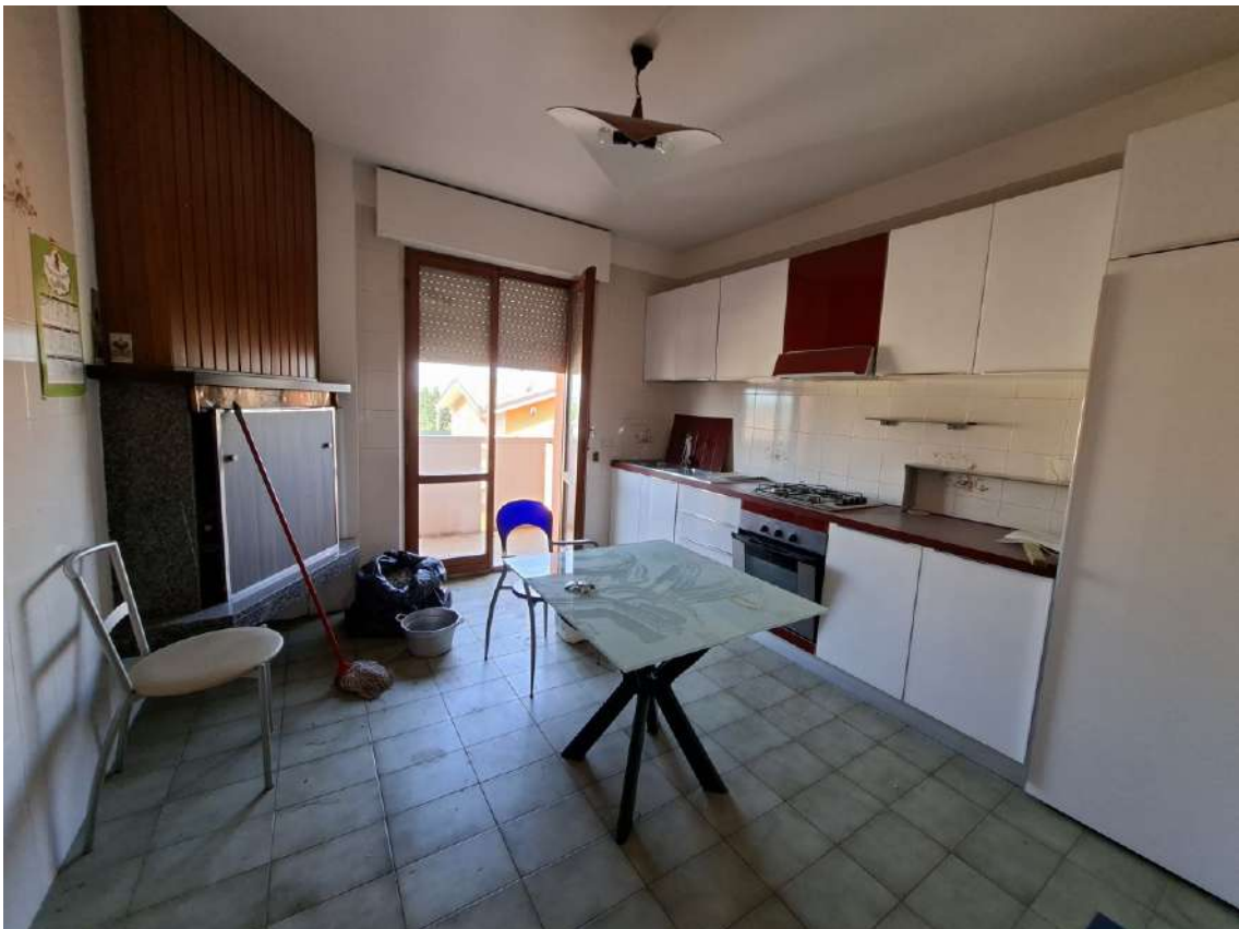
10 - cucina