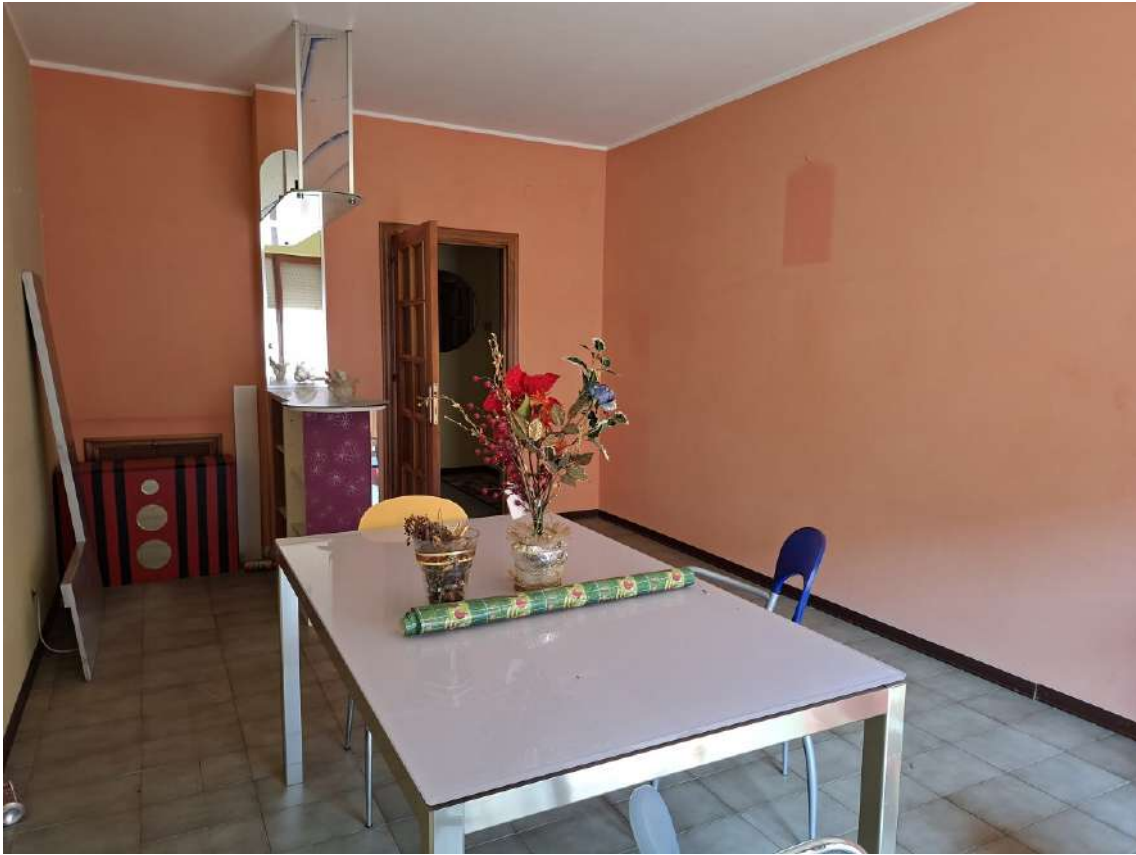
09 - soggiorno