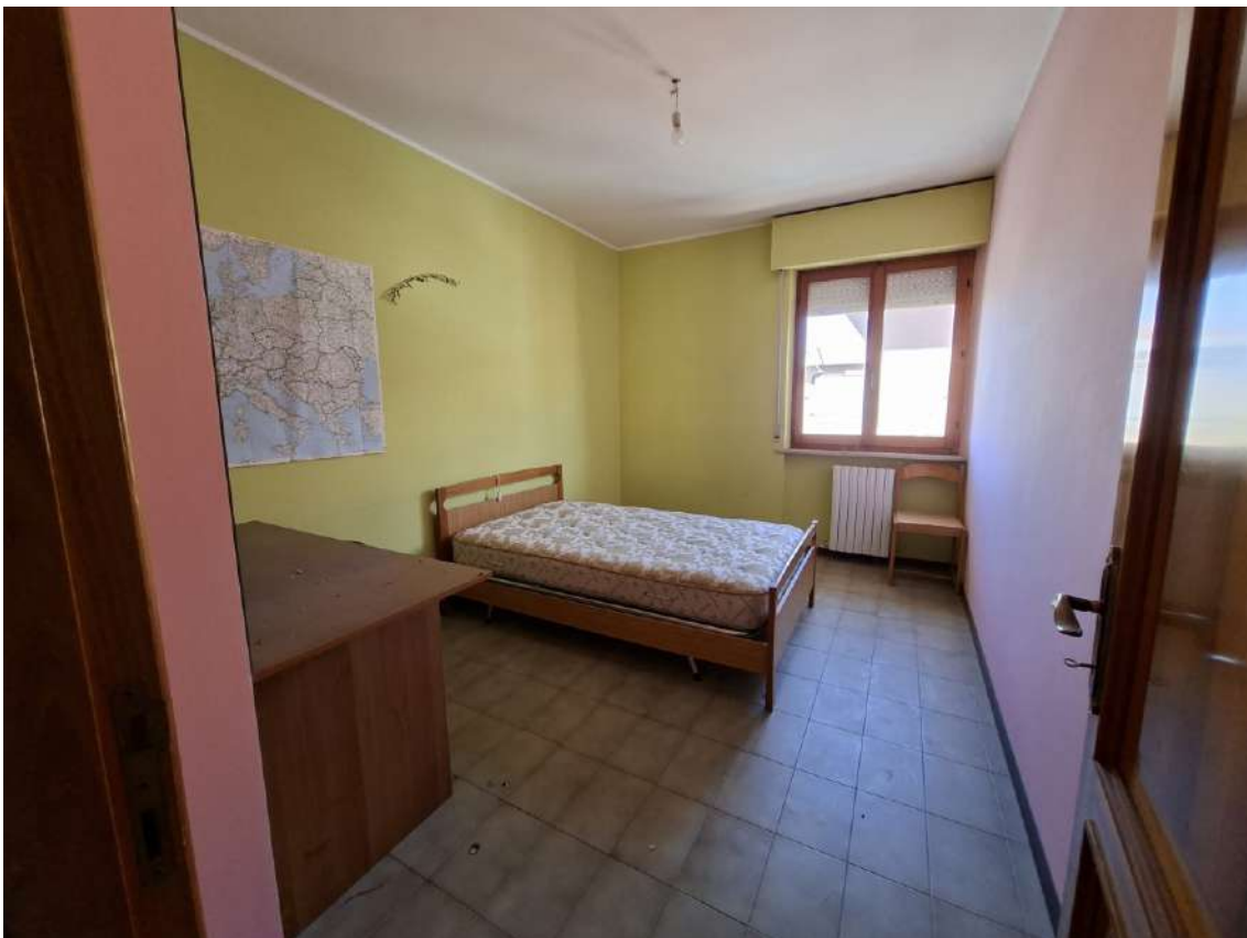
14 - camera singola