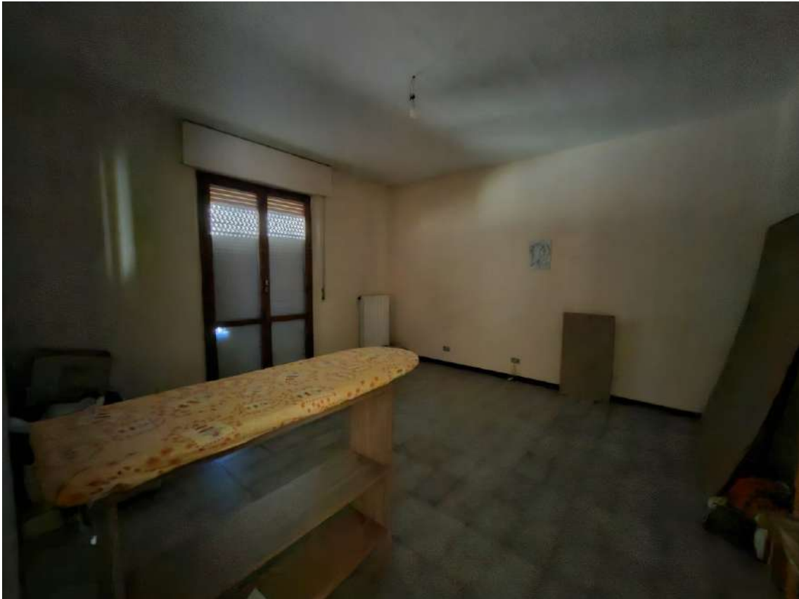
15 – camera doppia