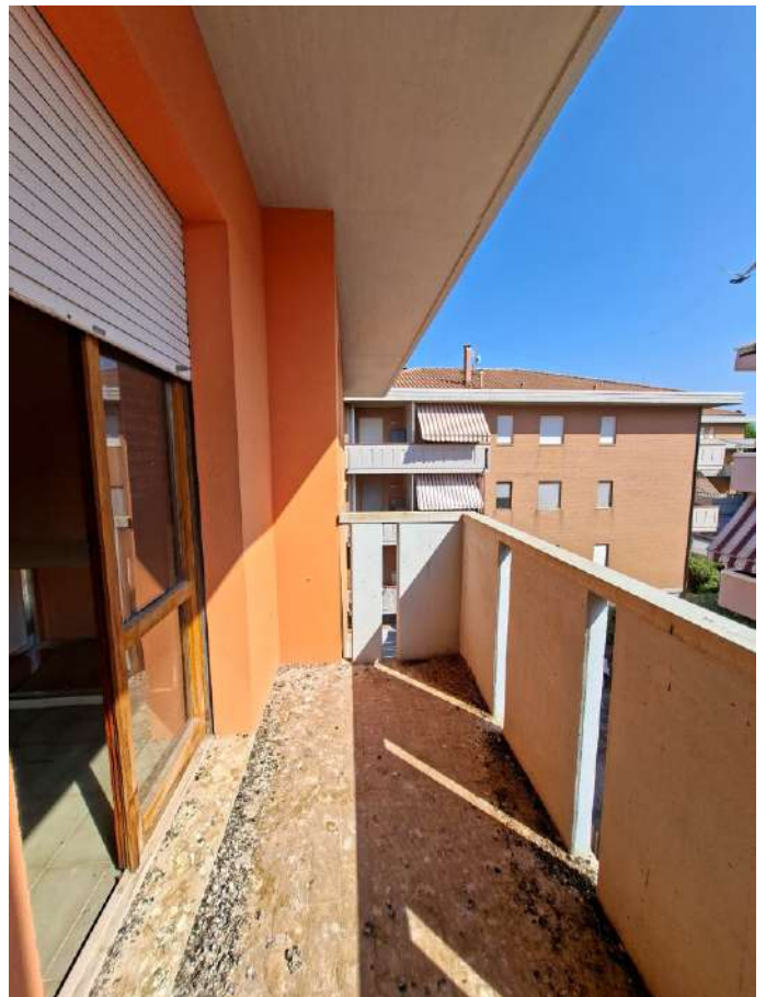
19 – balcone soggiorno