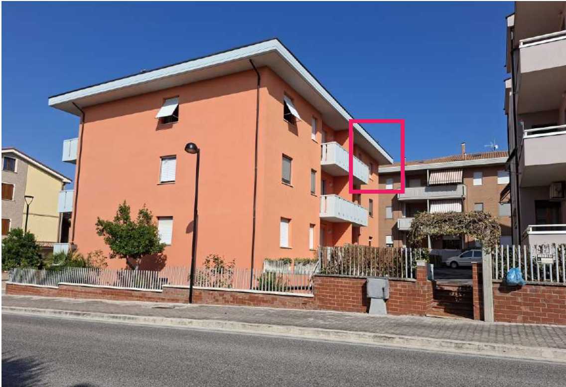
01 - Vista dalla strada provinciale