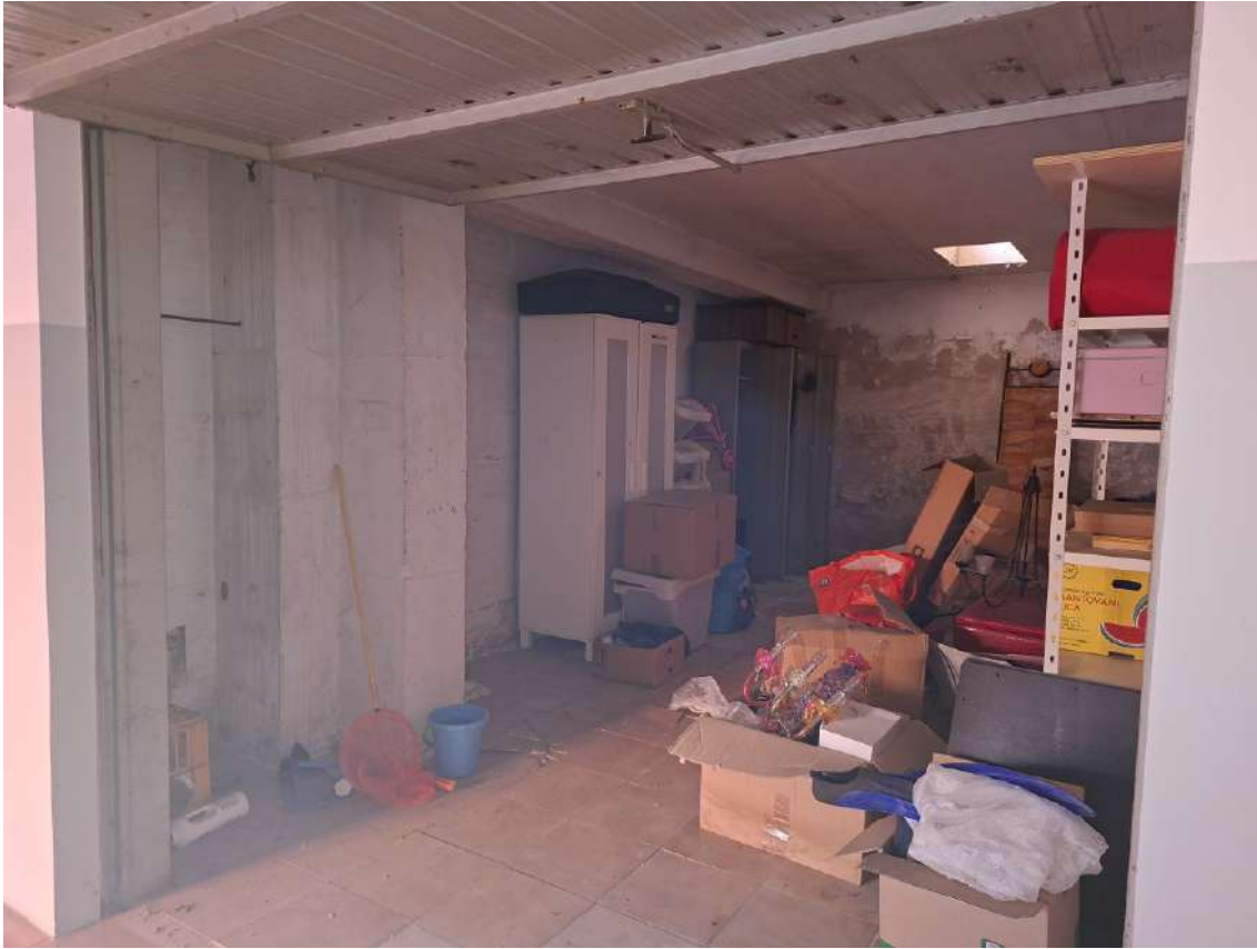
26 - autorimessa