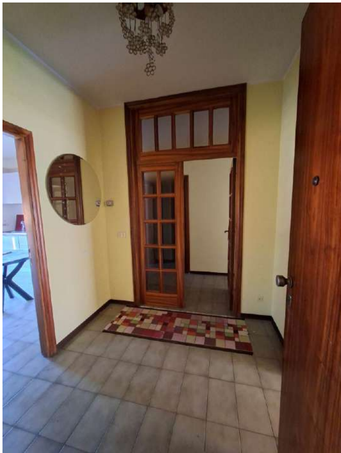
07 – ingresso