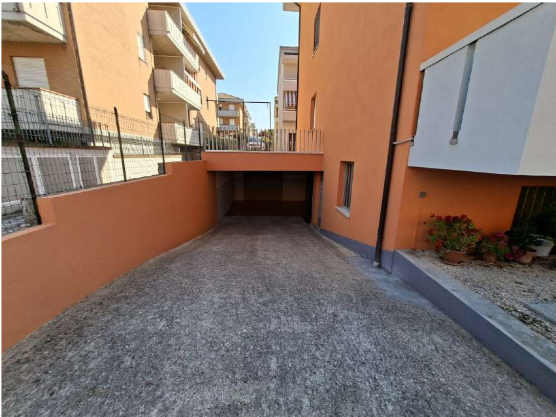
23 – rampa di accesso alle autorimesse