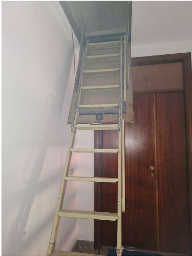
20 – accesso alla soffitta