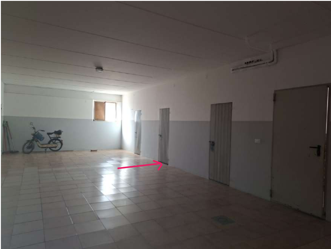
27 - cantina