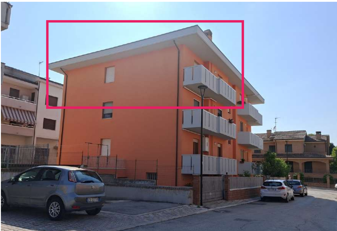
02 - Vista da via Paolo VI