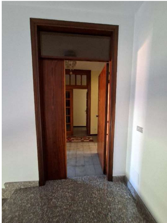
05 – scala condominiale e ingresso dell'immobile