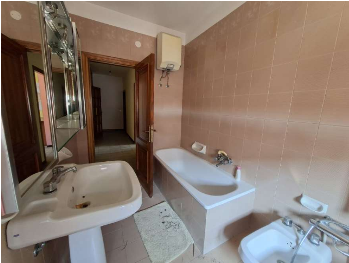
17 - servizio igienico