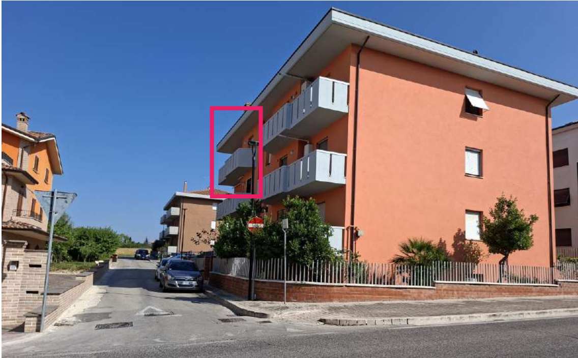
03 - Vista dalla strada provinciale