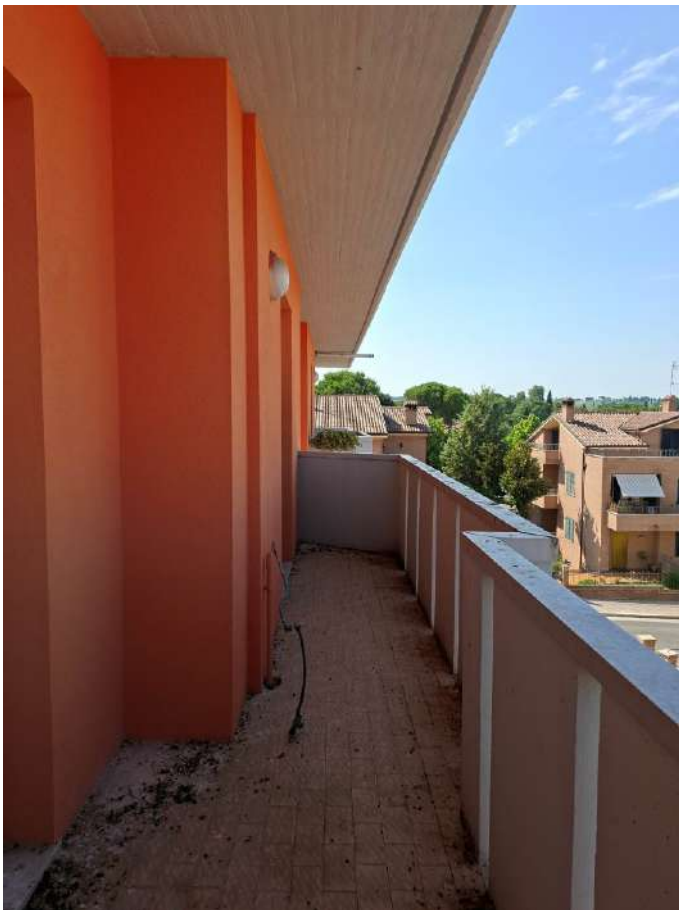
18 – balcone cucina