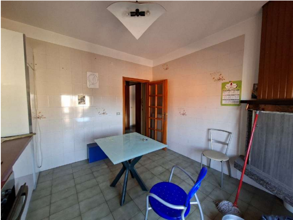
11 - cucina