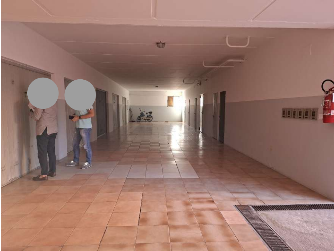
24 – corsia autorimesse