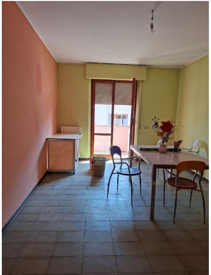
08 - soggiorno