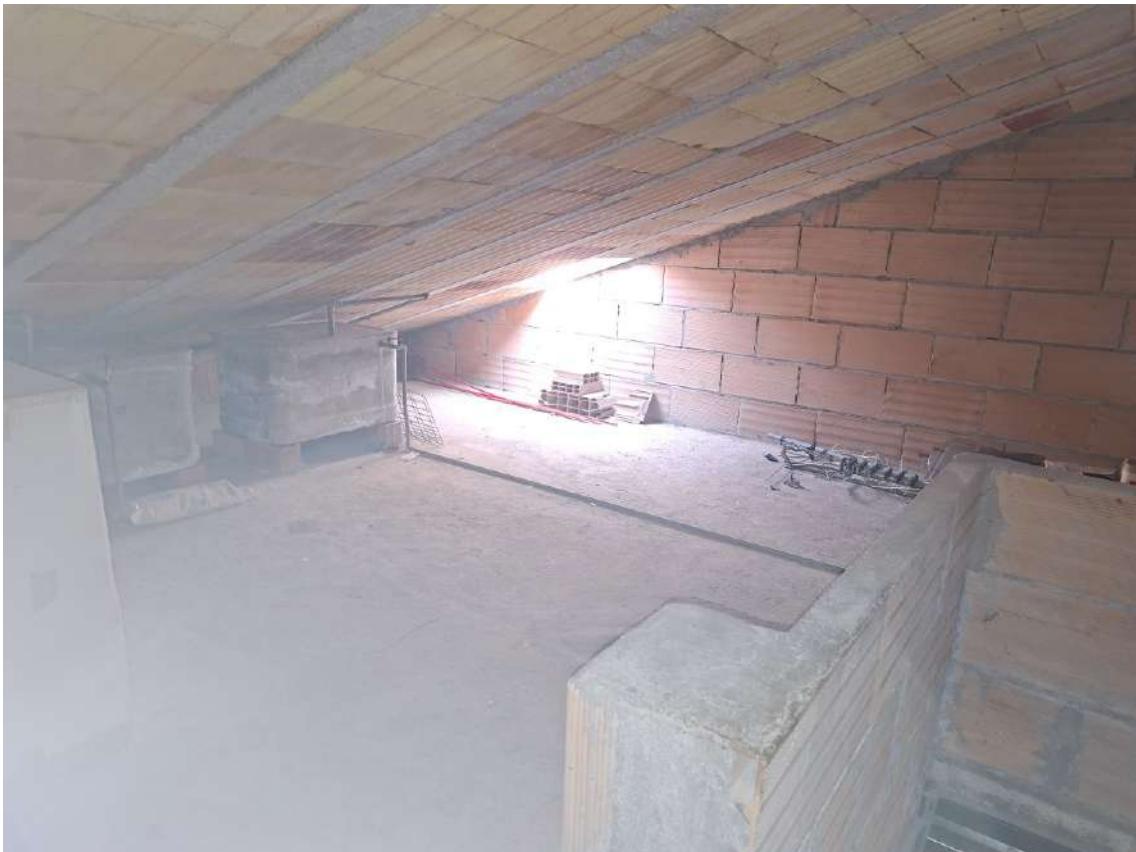
21 - soffitta