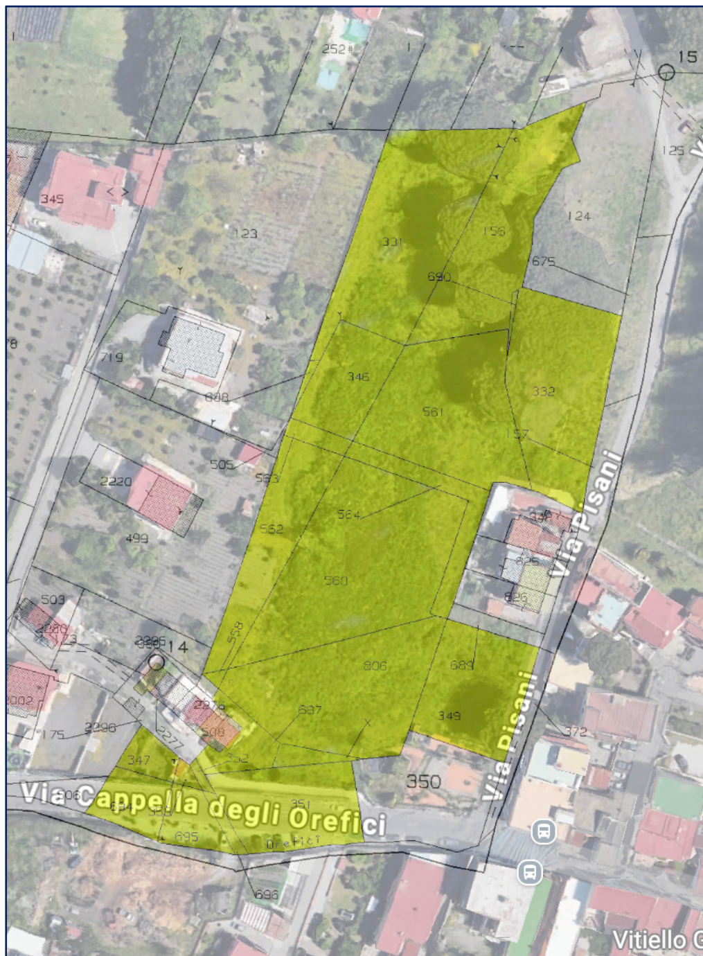
Figura 2 – Sovrapposizione del rilievo aerofotogrammetrico con l'estratto Mappa Catastale del Foglio 17, con indicazione delle particelle costituenti il compendio immobiliare oggetto di accertamento.

via G. Palermo 112 - 80131 NAPOLI | tel./fax: 081-5455003 | cell.: 328-6232920 | e-mail: ingcaprio@tiscali.it