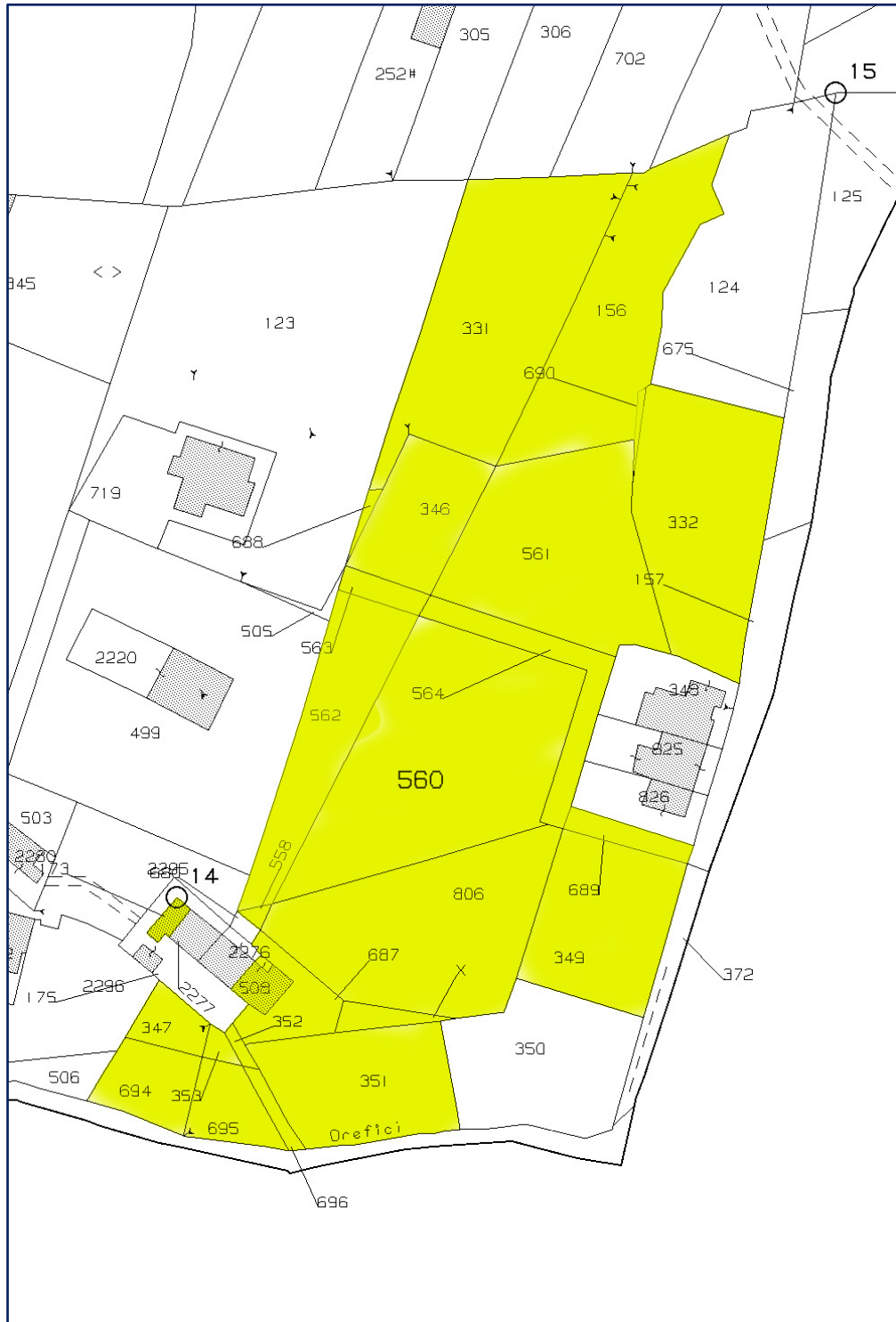
Figura 3 – Estratto di Mappa Catastale del Foglio 17, con indicazione delle particelle costituenti il compendio immobiliare oggetto di accertamento.

via G. Palermo 112 - 80131 NAPOLI | tel./fax: 081-5455003 | cell.: 328-6232920 | e-mail: ingcaprio@tiscali.it