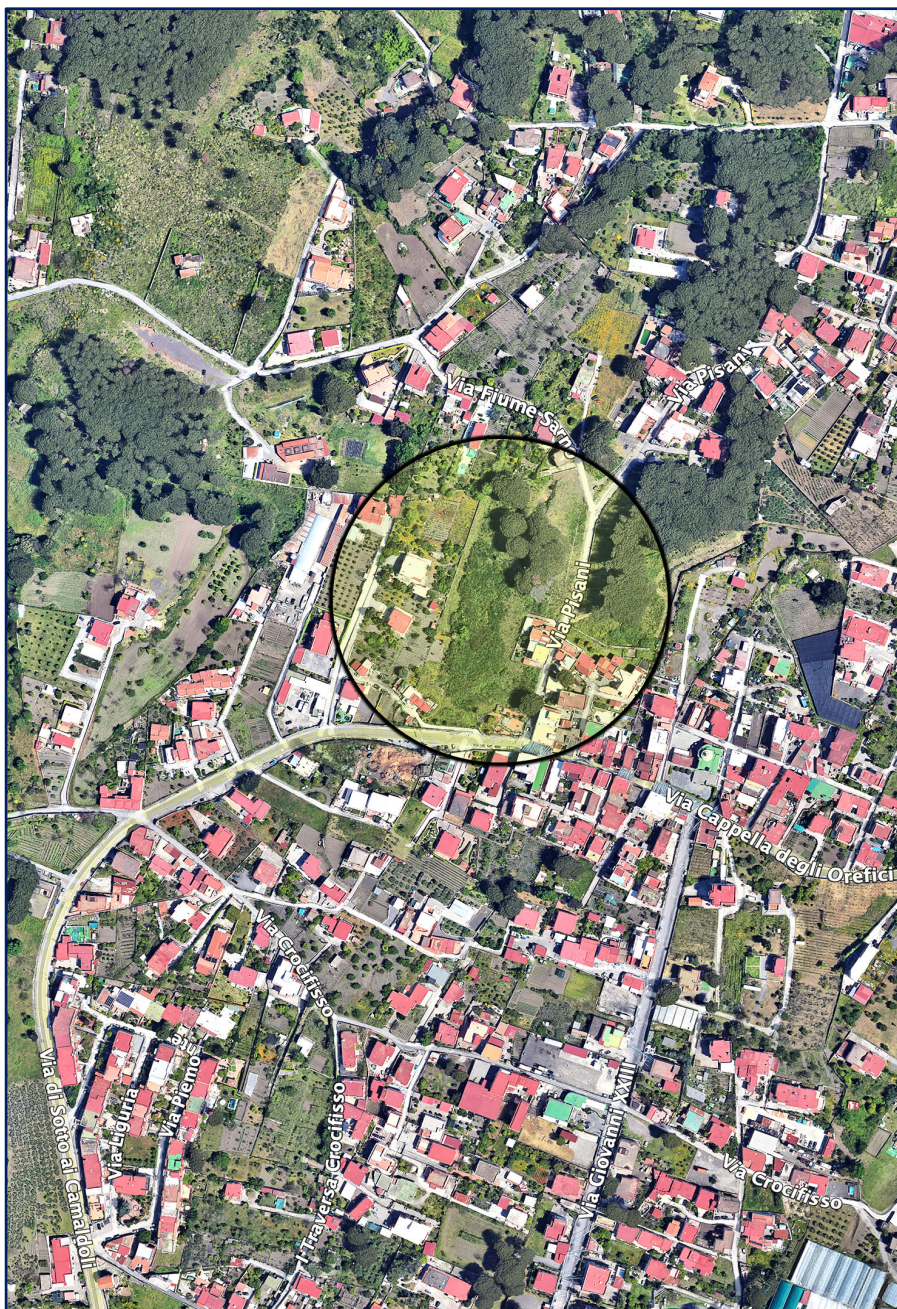
Figura 1 – Fondo rustico in Torre del Greco, alla Via Cappella degli Orefici - Mappa satellitare di zona.

costituenti i beni relitti. Si rinvia, inoltre, al seguente indirizzo internet: https://skfb.ly/pv6DW , dove è possibile consultare un "modello tridimensionale interattivo" dello stato dei luoghi, effettuato mediante dispositivo SAPR ed idoneo software per rilievo aerofotogrammetrico 1 .