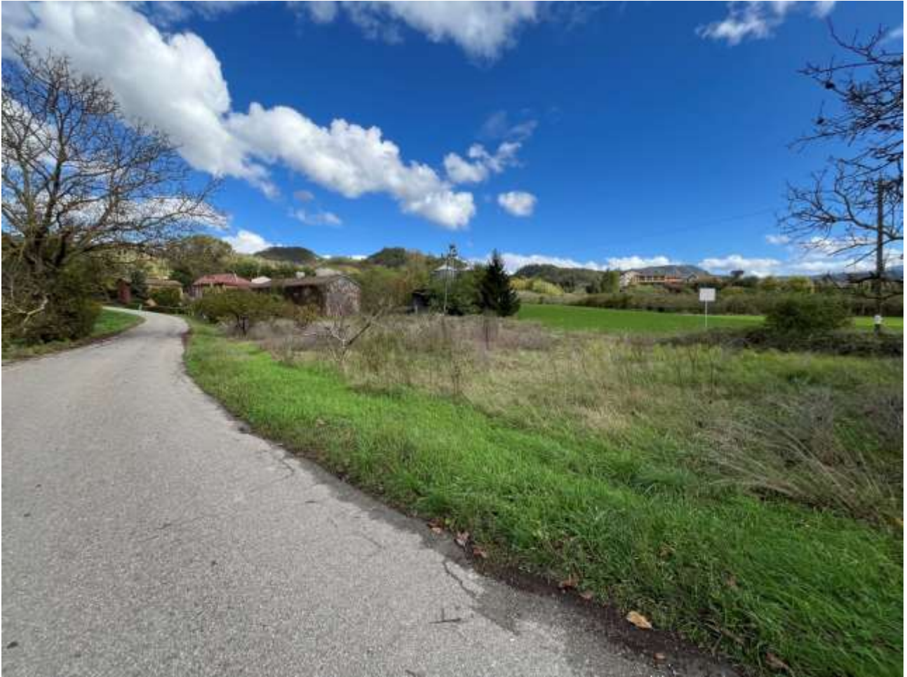
Terreno Foglio 5 mappale 284