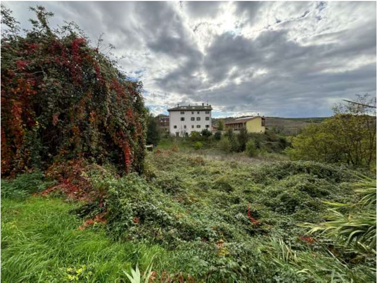
Pesa pubblica presente sul mappale 301