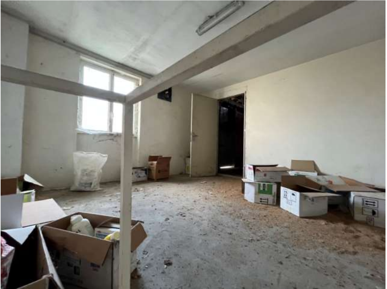
Fabbricato Foglio 5 mappale 299