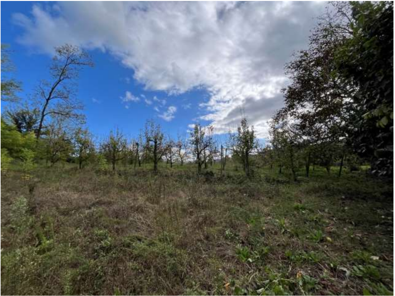
Terreno Foglio 6 mappale 21-37