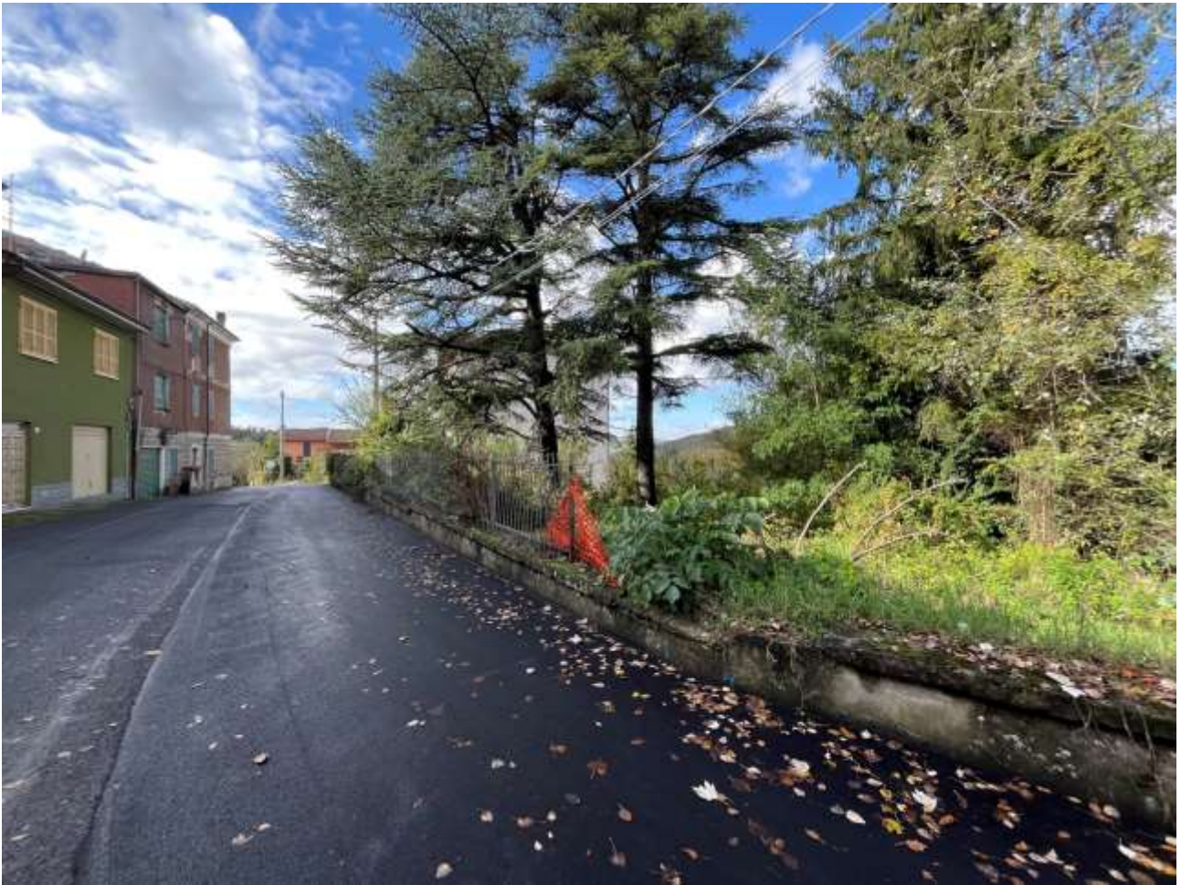
Terreni Foglio 6 mappale 301