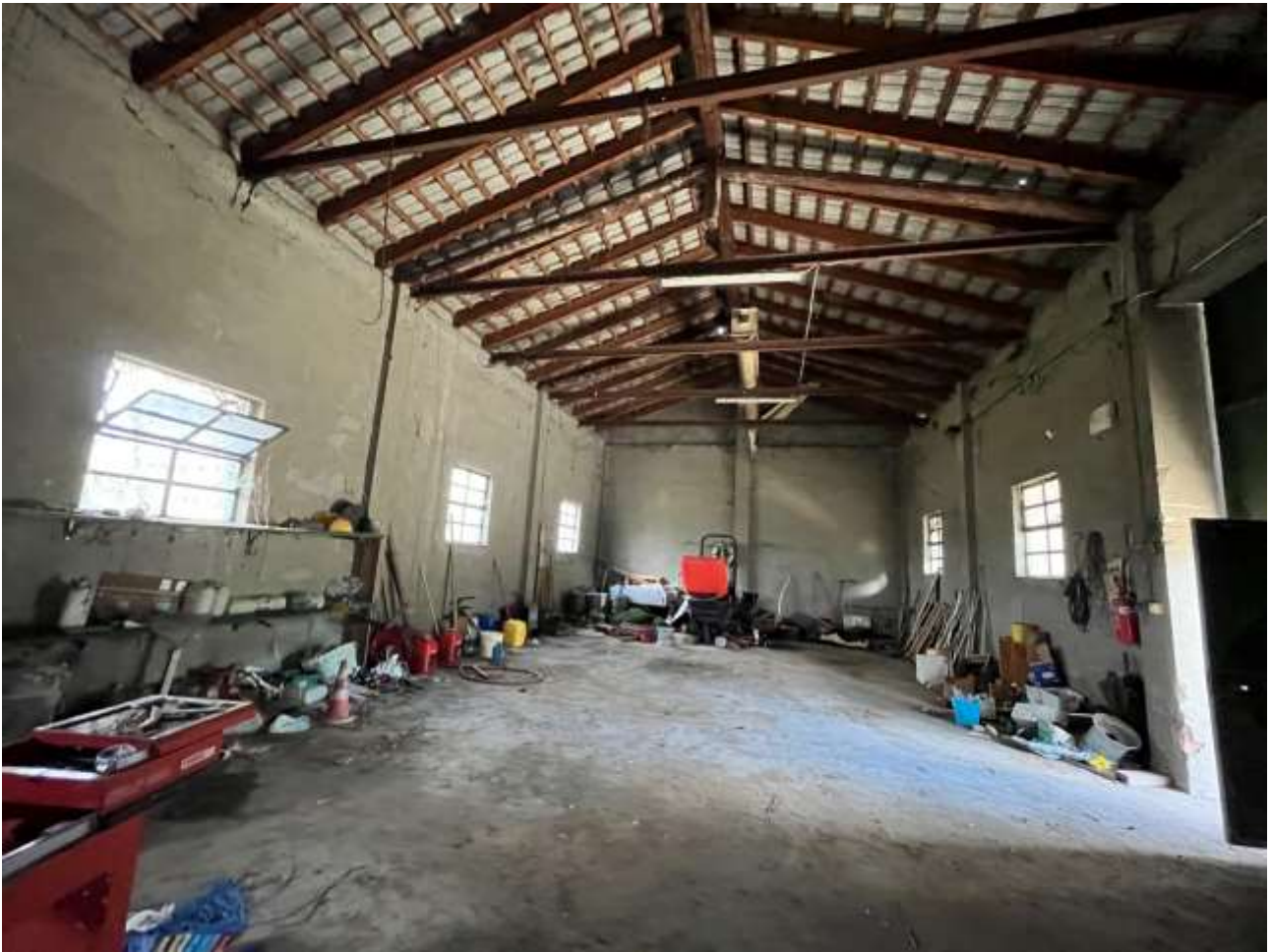
Terreno Foglio 5 mappale 313