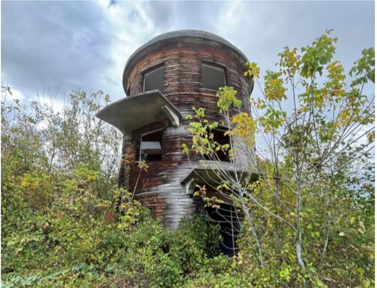
Terreni Foglio 4 mappale 134, 86