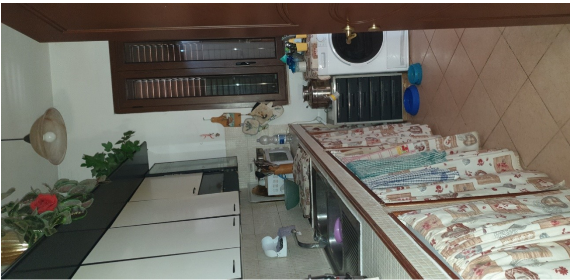
2- Ingresso –cucina