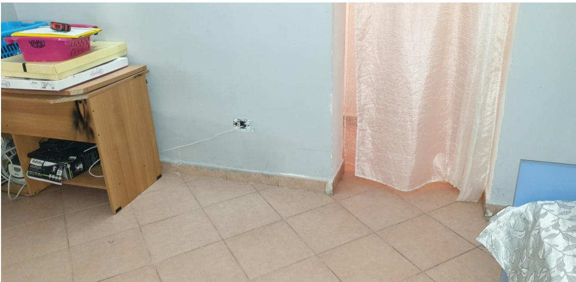
8- Camera centrale