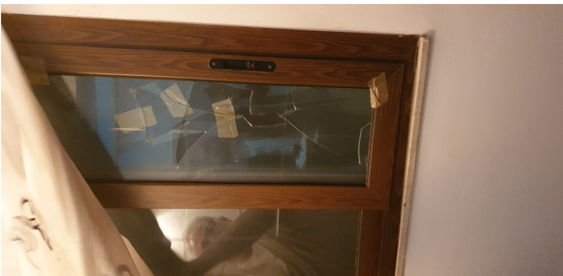
9- Finestra pozzo luce