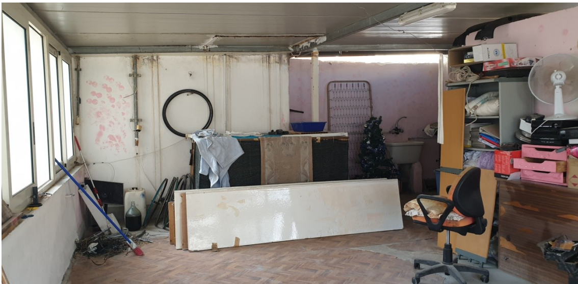
17- piano terrazza, pozzo luce