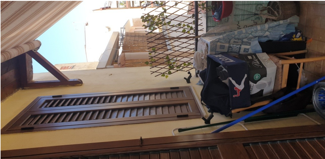
5- Balcone su via Tedeschi