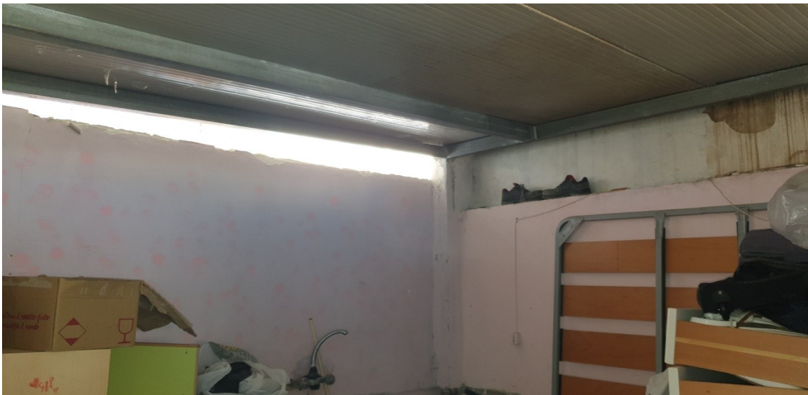
20- piano terrazza, copertura tecnica