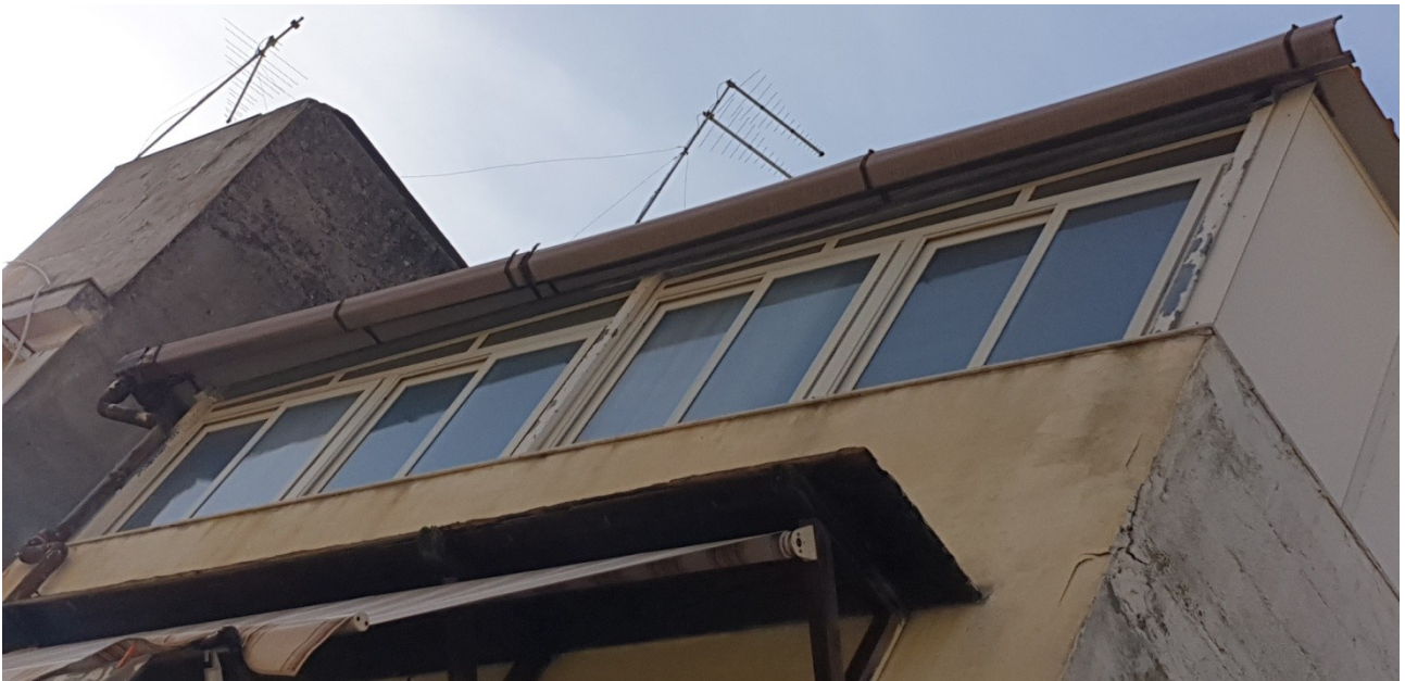
Prospetto su via G. Tedeschi, piano terrazza