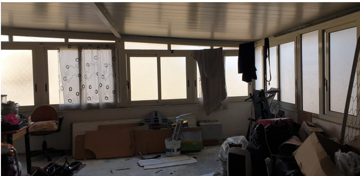
21- piano terrazza, pareti finestrate