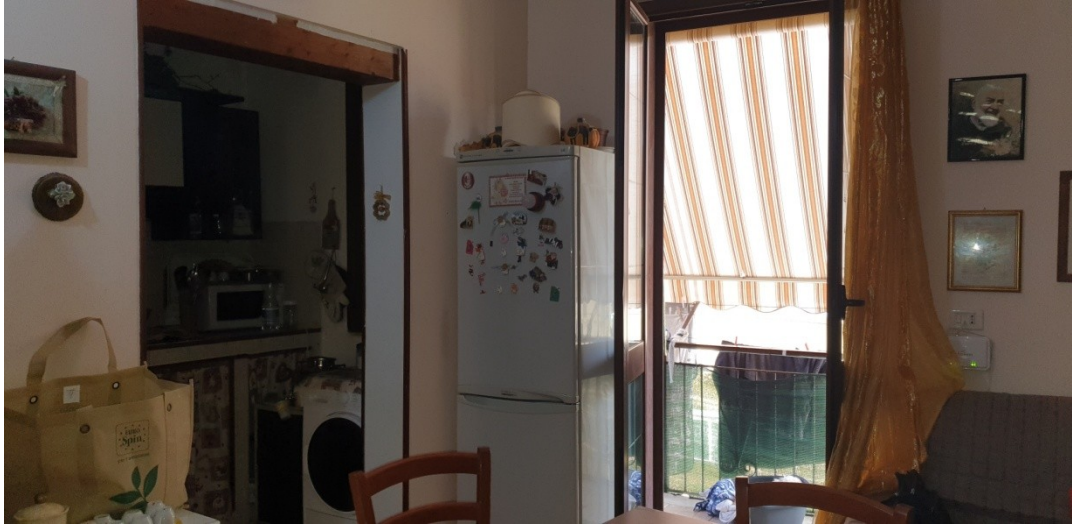
4- Soggiorno vista portafinestra balcone su via Tedeschi