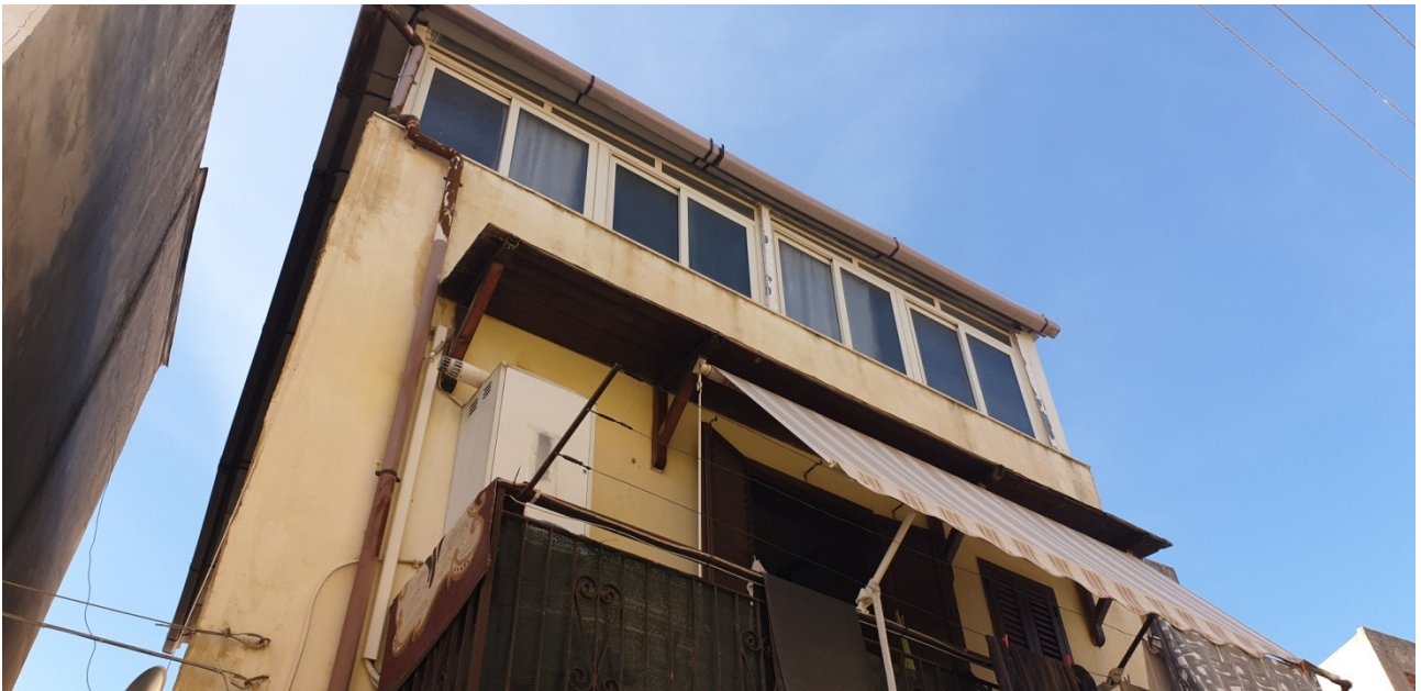
Prospetto su via G. Tedeschi