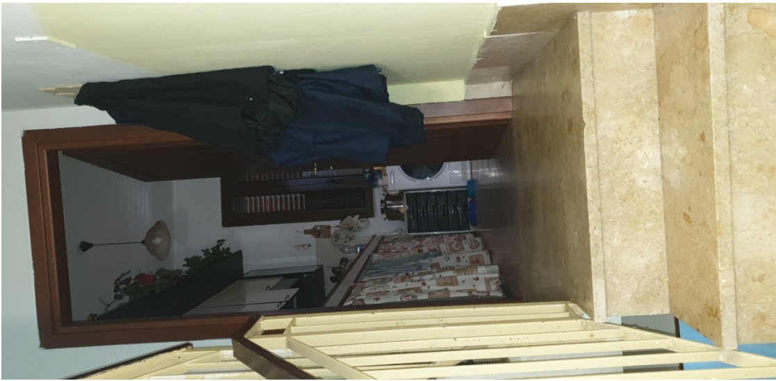
1- Ingresso appartamento piano primo