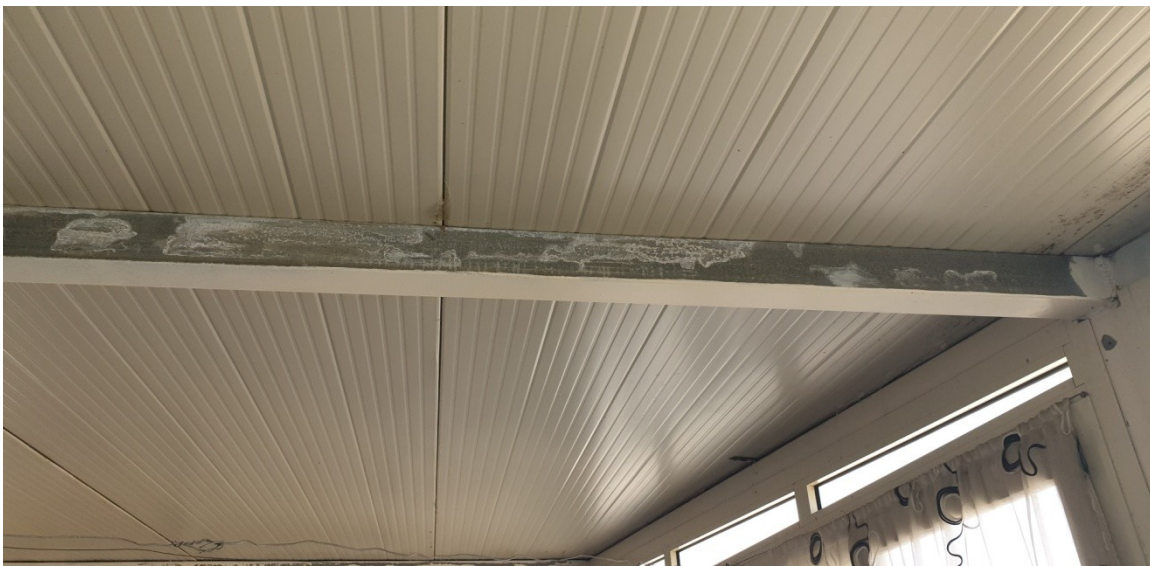
19- piano terrazza, copertura tecnica e sostegni in ferro zincato