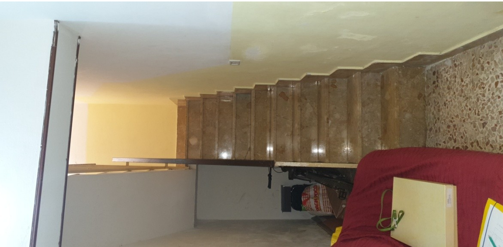
Scala al piano primo