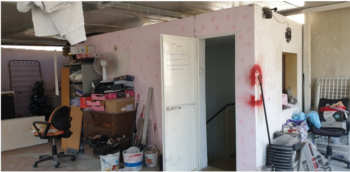
16- piano terrazza, torrino scala e copertura tecnica