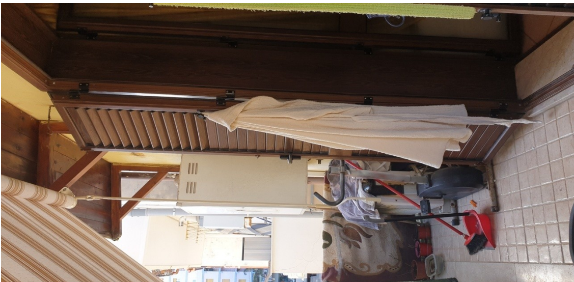
6- Balcone su via Tedeschi