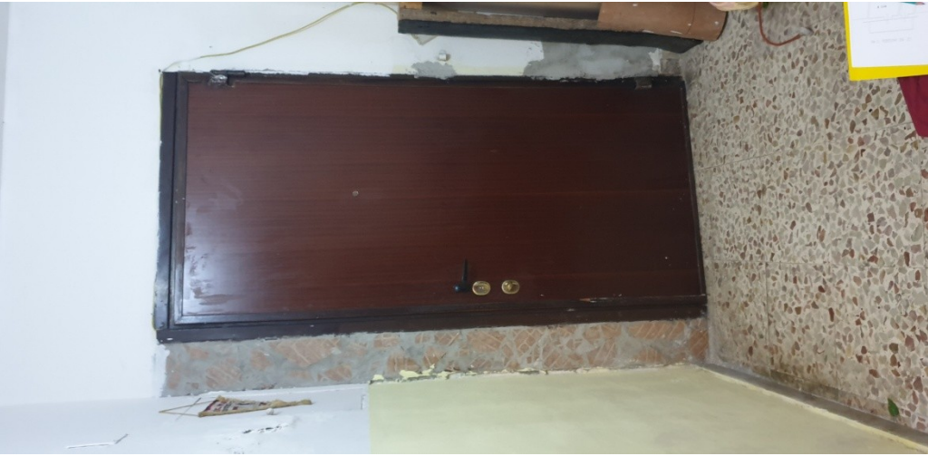
Portoncino ingresso interno