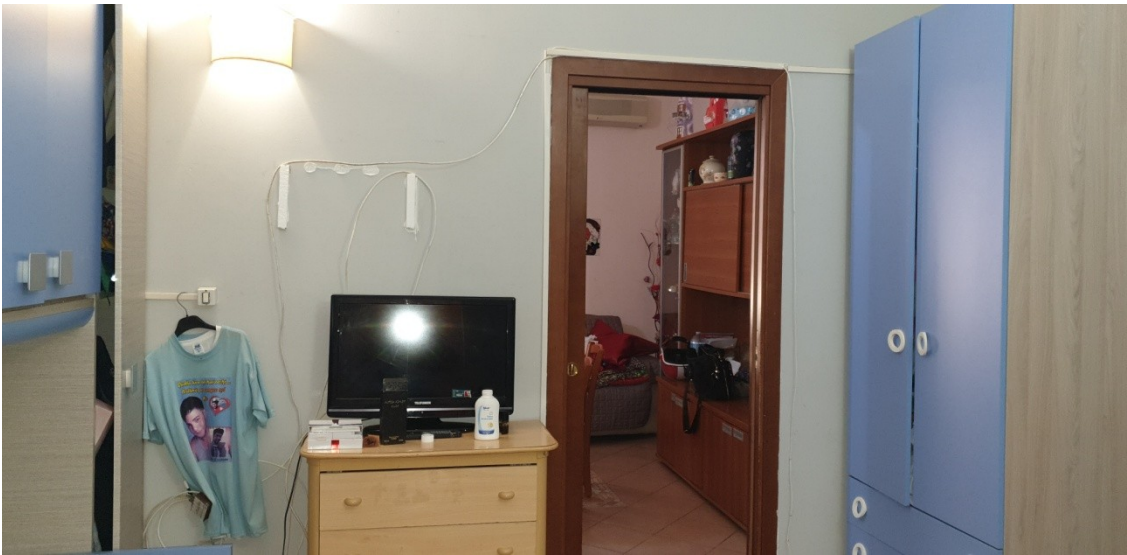
7- Camera centrale