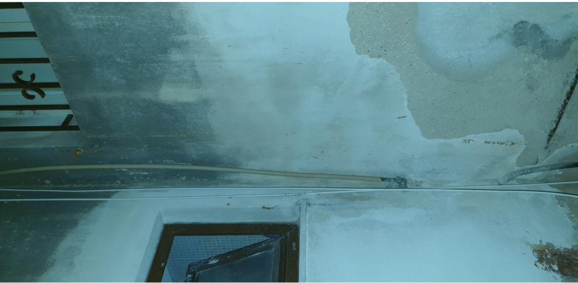
14- pozzo luce