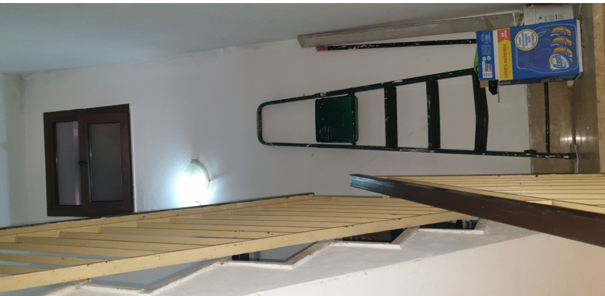
15- corpo scala per il terrazzo