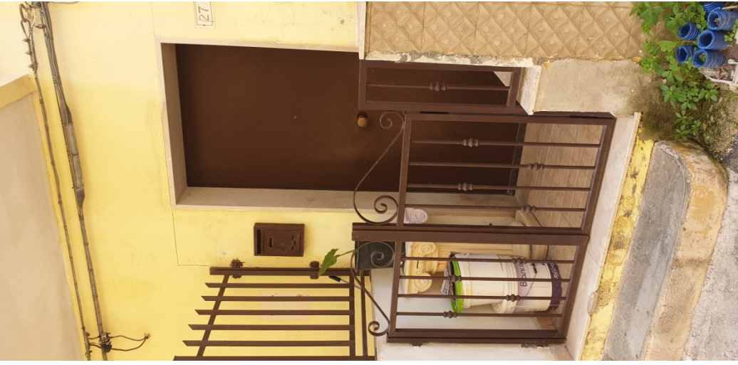
Portoncino ingresso su via G. Tedeschi