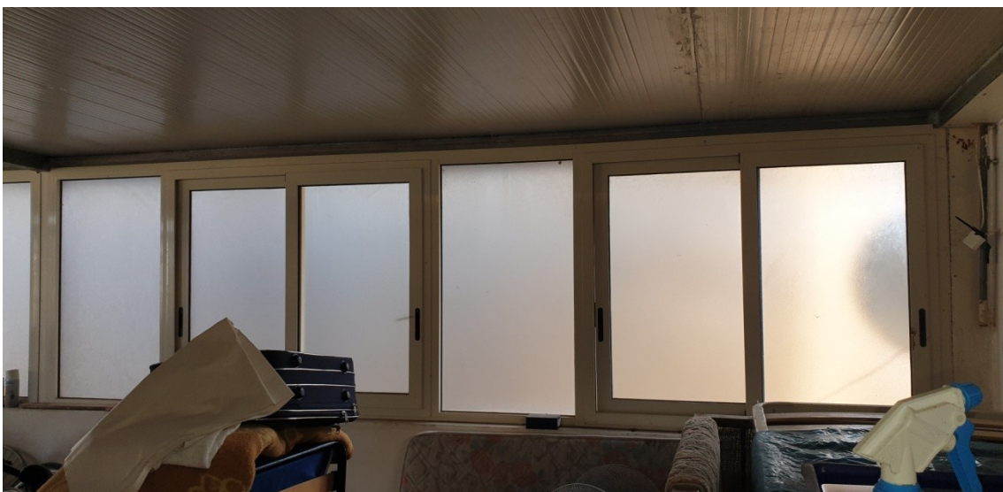
18- piano terrazza, parete finestrata sotto copertura tecnica