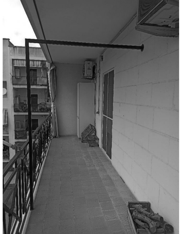
FOTO 17. Balcone a ovest