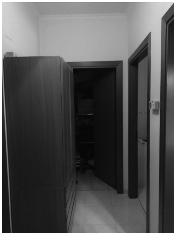
FOTO 11. Corridoio