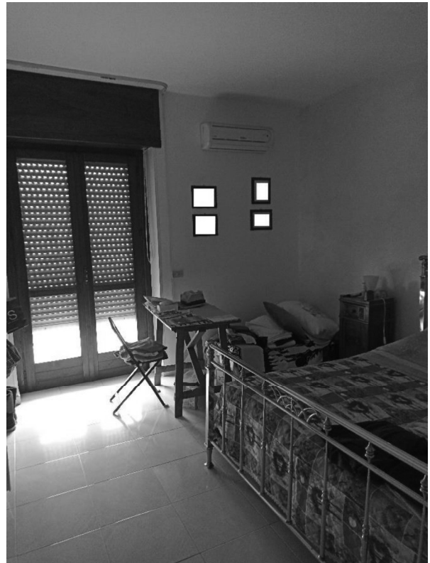
FOTO 15. Letto 1