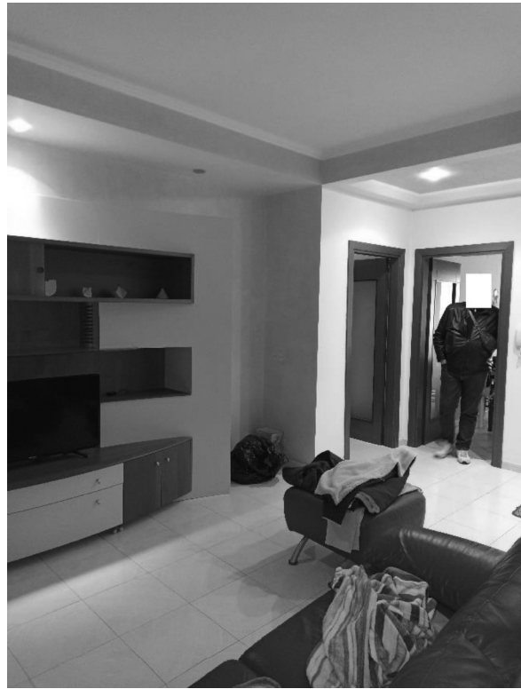
FOTO 5. Soggiorno