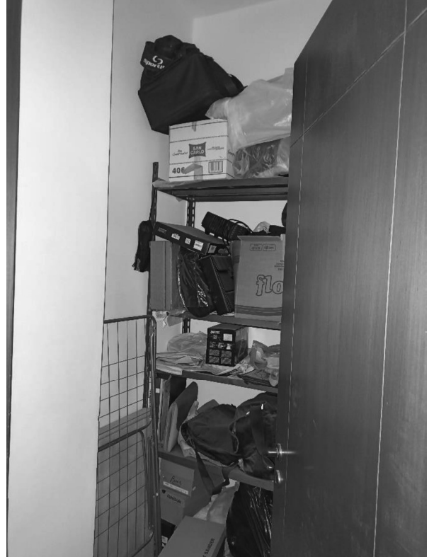
FOTO 13. Ripostiglio