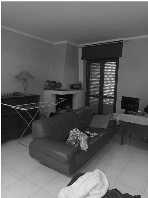
FOTO 6. Soggiorno