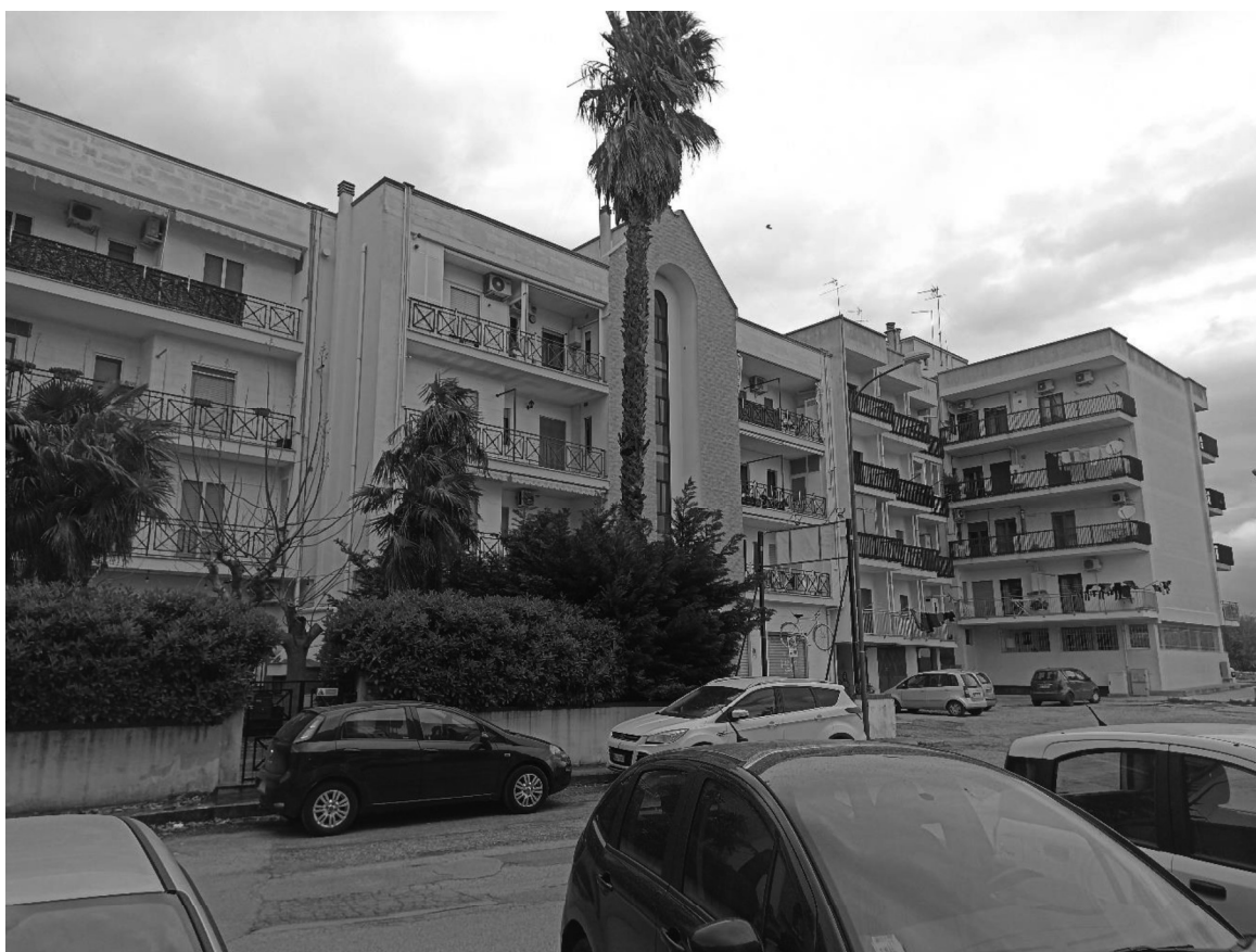
FOTO 1. Prospetto principale edificio condominiale