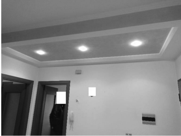
FOTO 4. Soggiorno