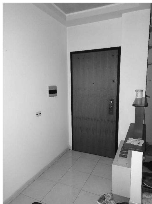
FOTO 3. Ingresso