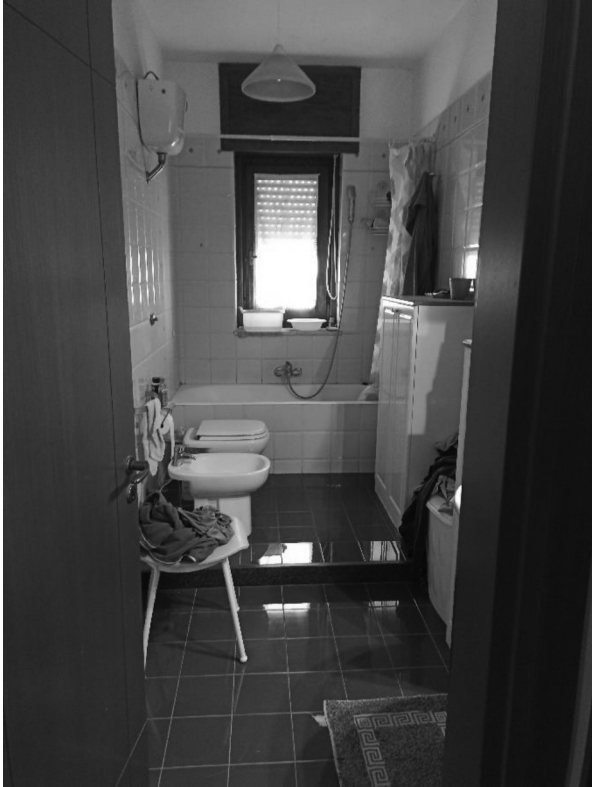
FOTO 12. Bagno