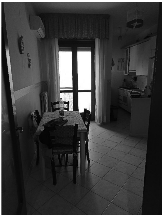
FOTO 8. Cucina/pranzo