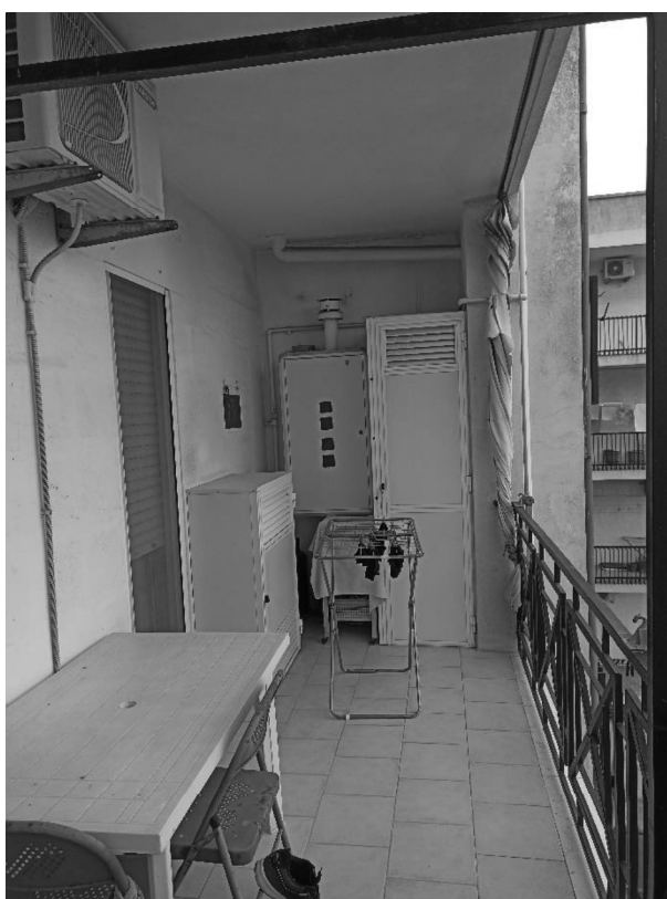
FOTO 10. Balcone a est