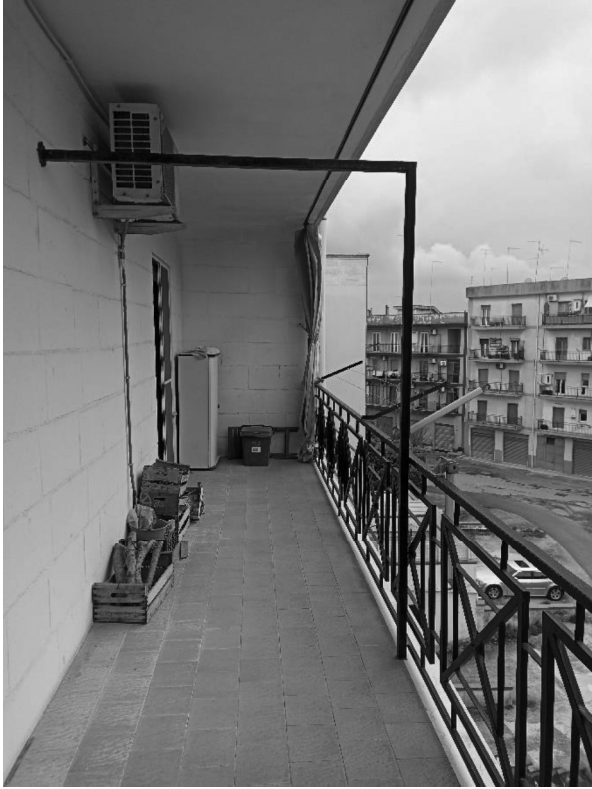
FOTO 16. Balcone a ovest