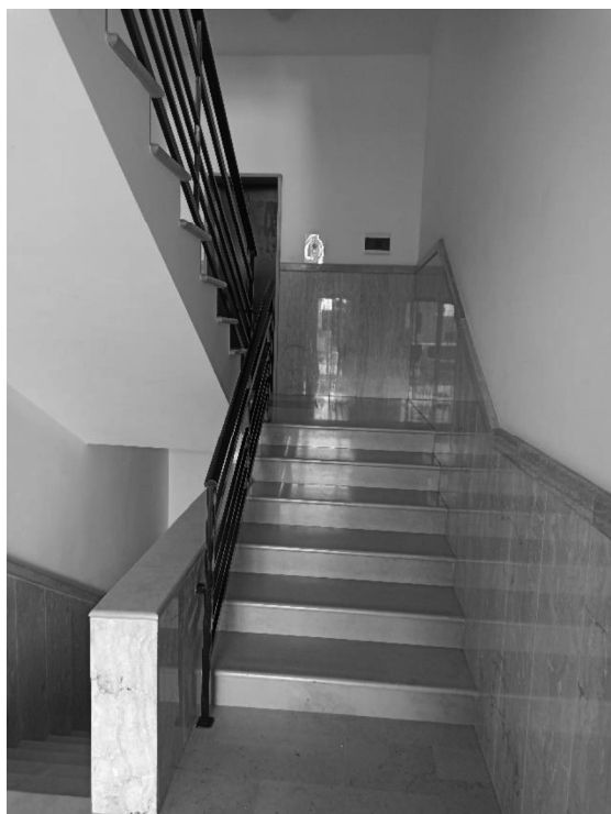
FOTO 2. Vano scala