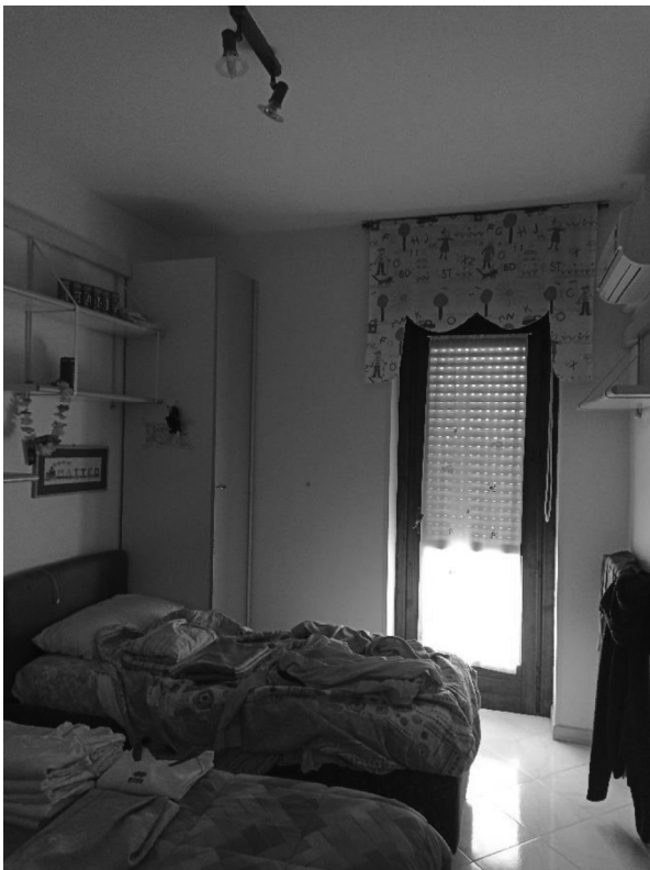
FOTO 14. Letto 2