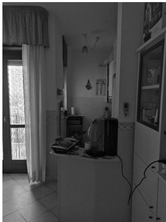
FOTO 9. Cucina/pranzo