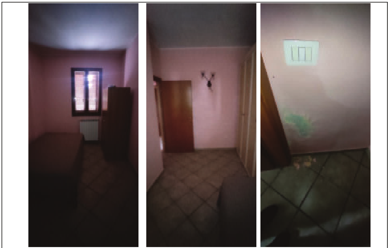
Figura 7 – interno unità immobiliare Sub503 piano terreno-camera- Via Tosca Fiesoli n.107 Firenze