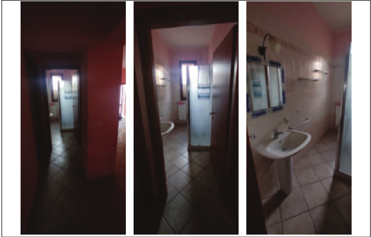
Figura 6 – interno unità immobiliare Sub503 piano terreno-bagno- Via Tosca Fiesoli n.107 Firenze