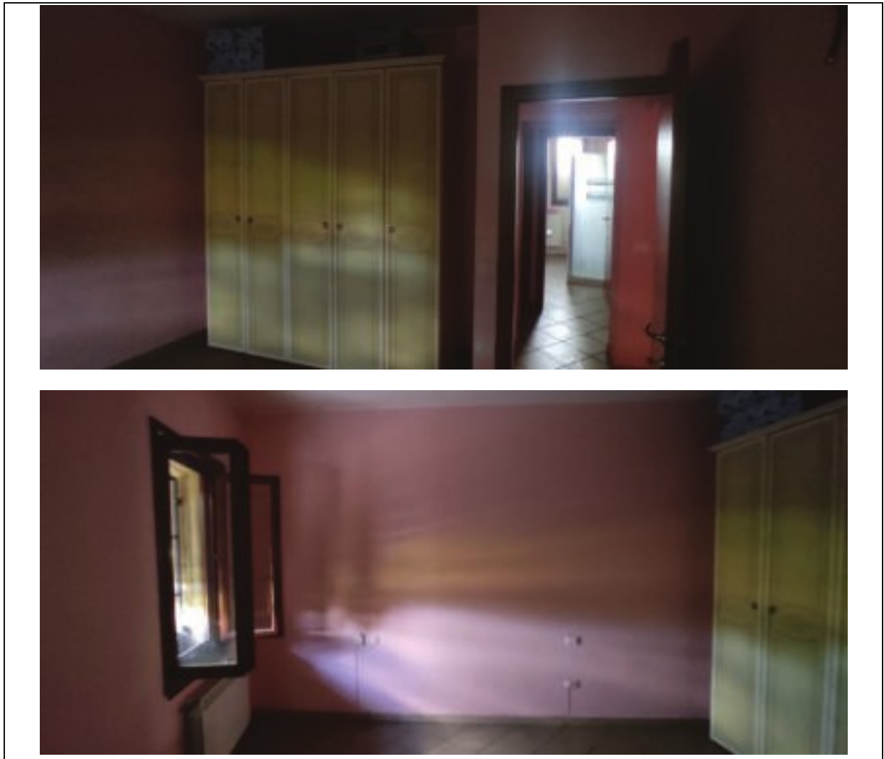
Figura 5 – interno unità immobiliare Sub503 piano terreno-camera- Via Tosca Fiesoli n.107 Firenze