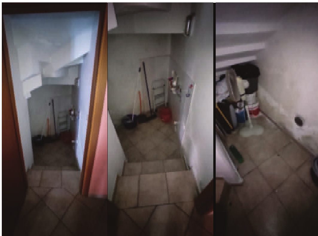
Figura 4 – interno unità immobiliare Sub503 piano terreno-accesso a sotto scala/ripostiglio- Via Tosca Fiesoli n.107 Firenze