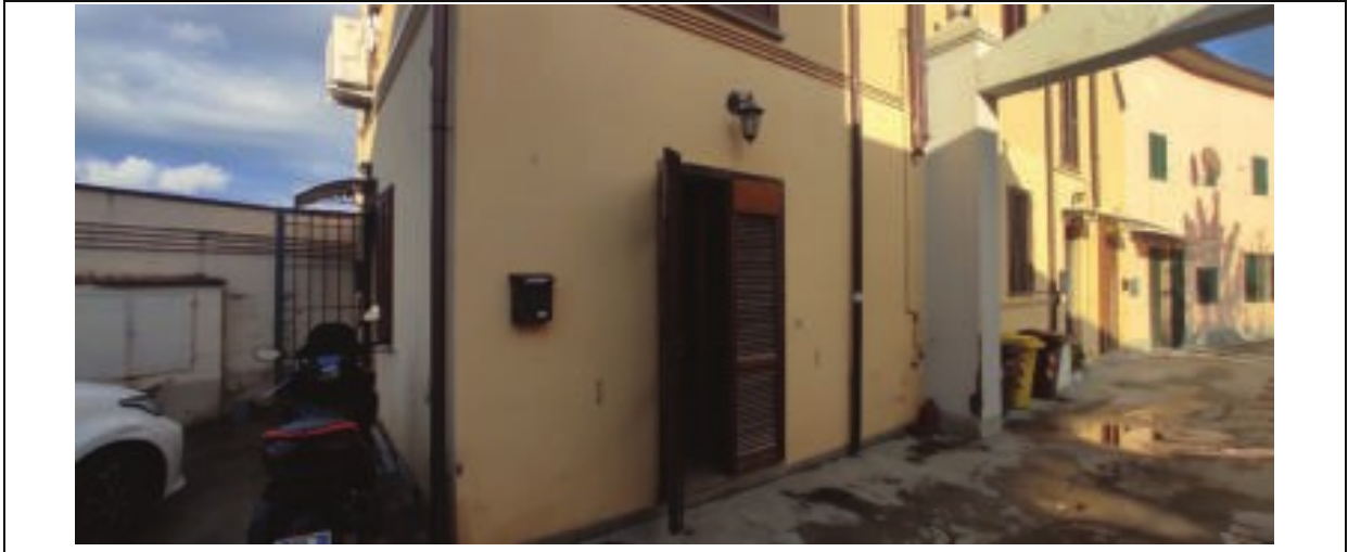
Figura 2 – ingresso principale unità immobiliare Sub503 piano terreno, Via Tosca Fiesoli n.107 Firenze