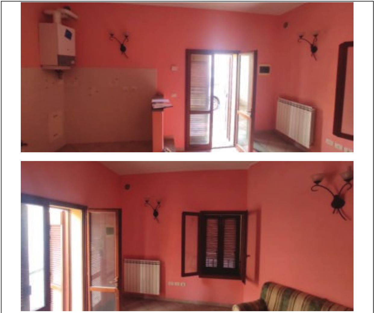
Figura 3 – interno unità immobiliare Sub503 piano terreno-sala da pranzo, cucina- Via Tosca Fiesoli n.107 Firenze