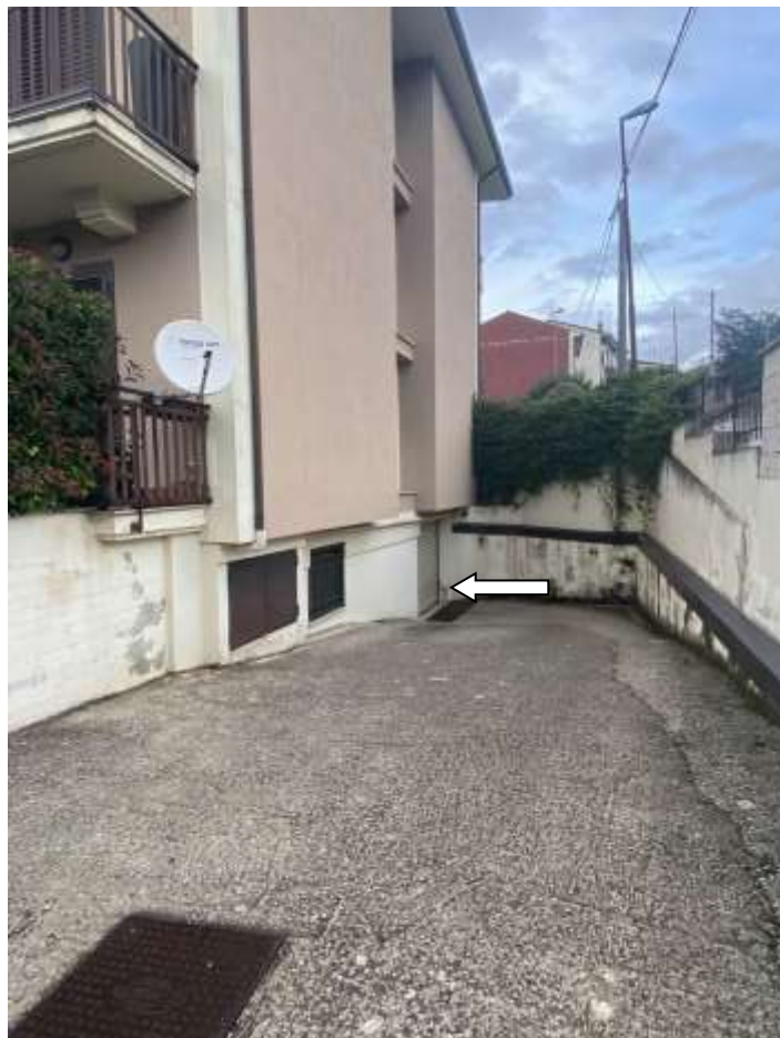
Ingresso dell'edificio ed accesso al piano S1 (garages)