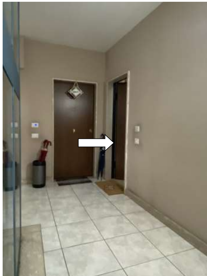
Ingresso all'appartamento (1° piano)