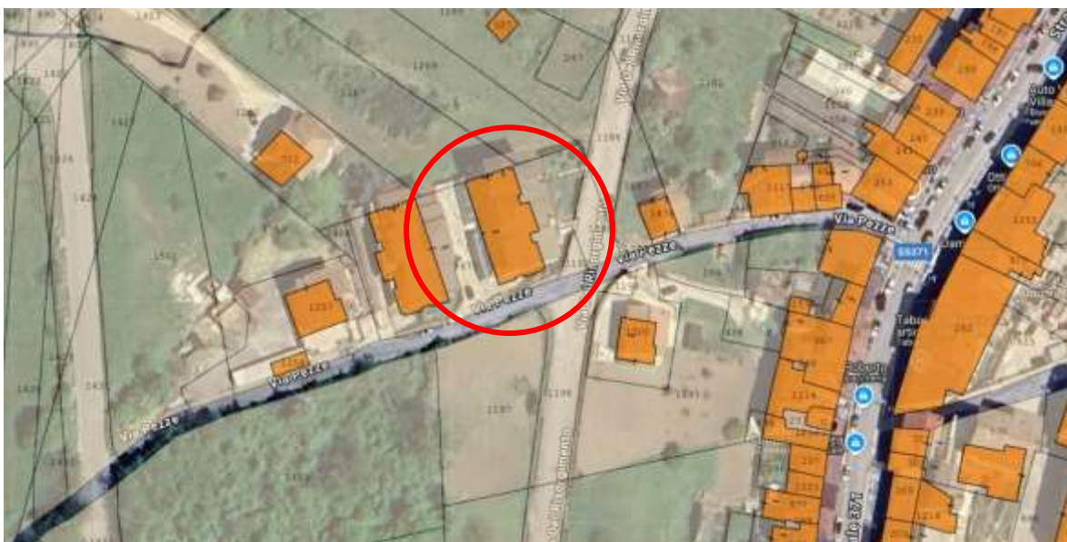
Riferimento aereo dell'area in rapporto con il centro del Comune di Pratola Serra e sovrapposizione catastale