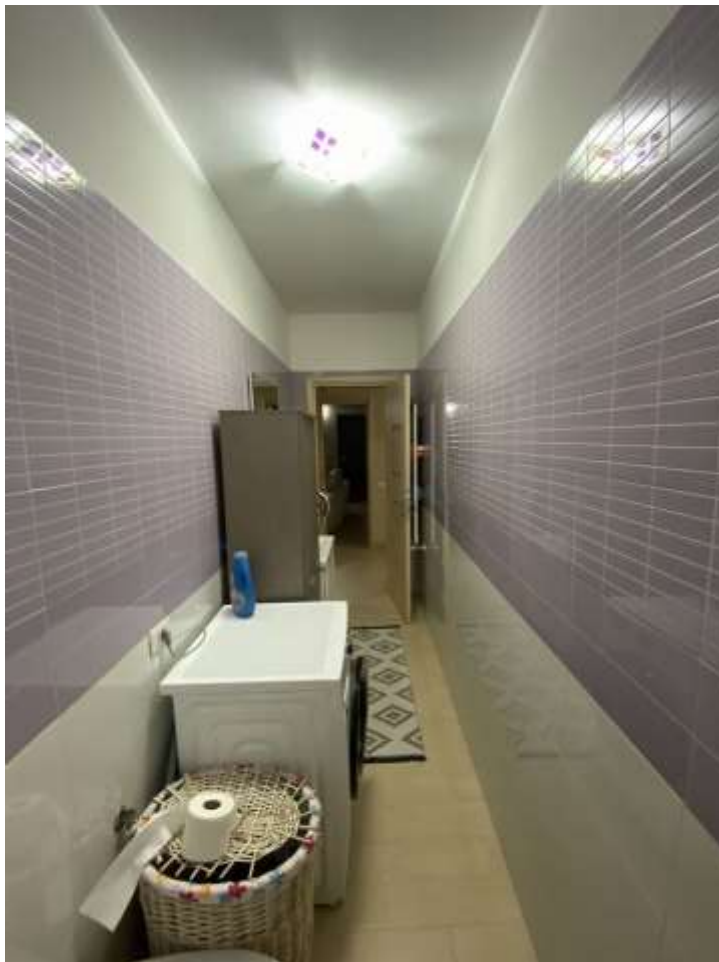
Bagno di servizio (2)