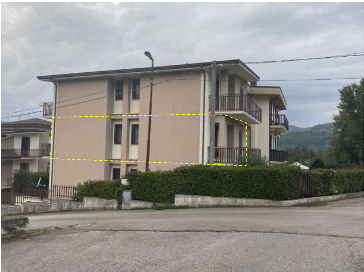
Vista esterna dell'edificio (con l'individuazione dell'appartamento)