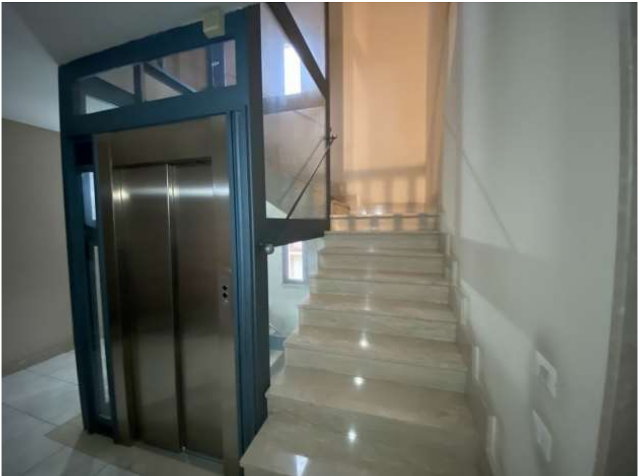
Androne d'ingresso a vano scala