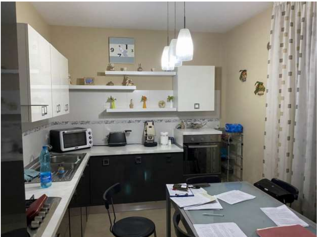
Ingresso/soggiorno e cucina