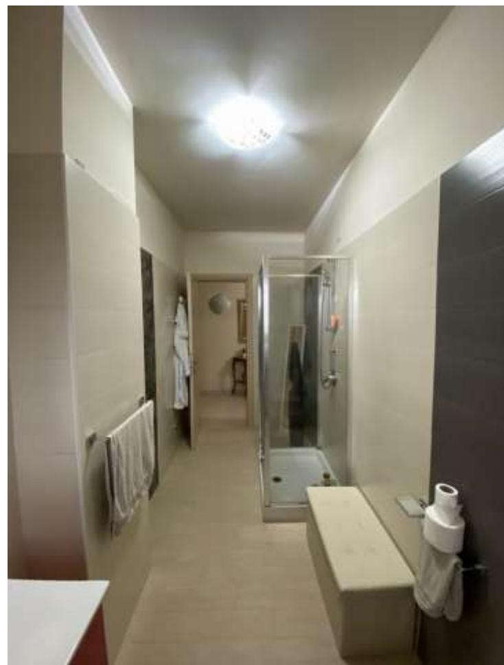
Bagno principale (n.1)