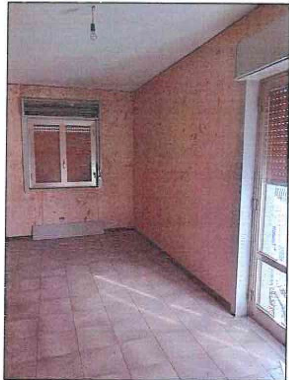
Foto 42-43 - Foto del balcone (sul quale si affaccia la camera 1) in mediocre stato conservativo e con cornicione a rischio di crollo di intonaco e parti strutturali. Vista della camera 2 con macchie di sporco nelle pareti e non in buono stato conservativo. Sono necessari lavori di manutenzione.