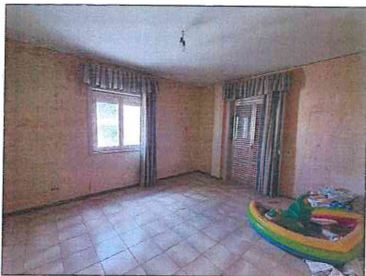
Foto 44-45 - Foto della camera 3 con affaccio con balcone su via Eschilo. Le pareti presentano macchie di sporco e necessitano di rifinitura con idropittura. Wc 2 rifinito ed in buono stato conservativo.