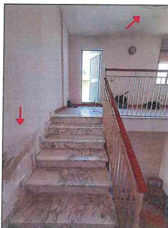
Foto 46-47 - Foto del wc 1 di piccole dimensioni. Vista del vano scala di accesso alla terrazza di copertura con evidente degrado di umidità.