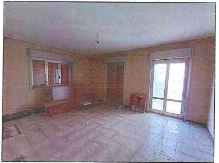
Foto 40-41 - Viste della zona giorno dell'appartamento costituito da cucina-pranzo e camera 1, entrambe rifinite e in discreto stato conservativo.