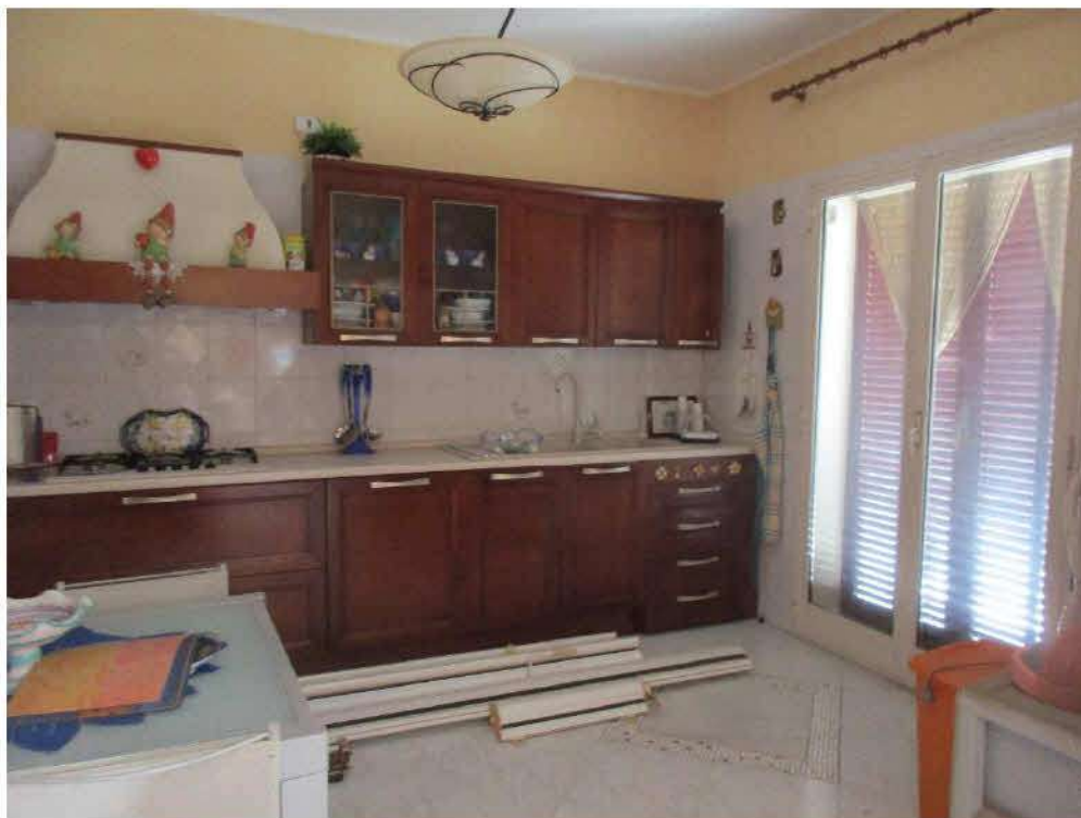
Foto n.5/8: Nola, via Saviano n.317, parco NapolitanoIII. Proprietà Omissis Interno appartamento, particolari