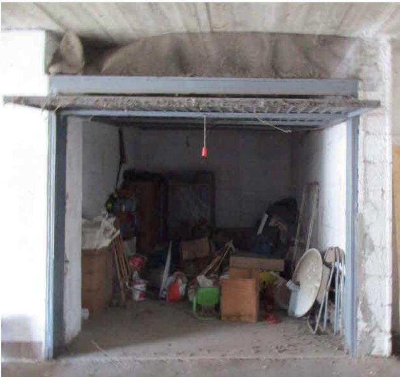
Foto n.8/10: Nola, via Saviano n.317, parco NapolitanoIII. Proprietà Omissis Interno appartamento e box