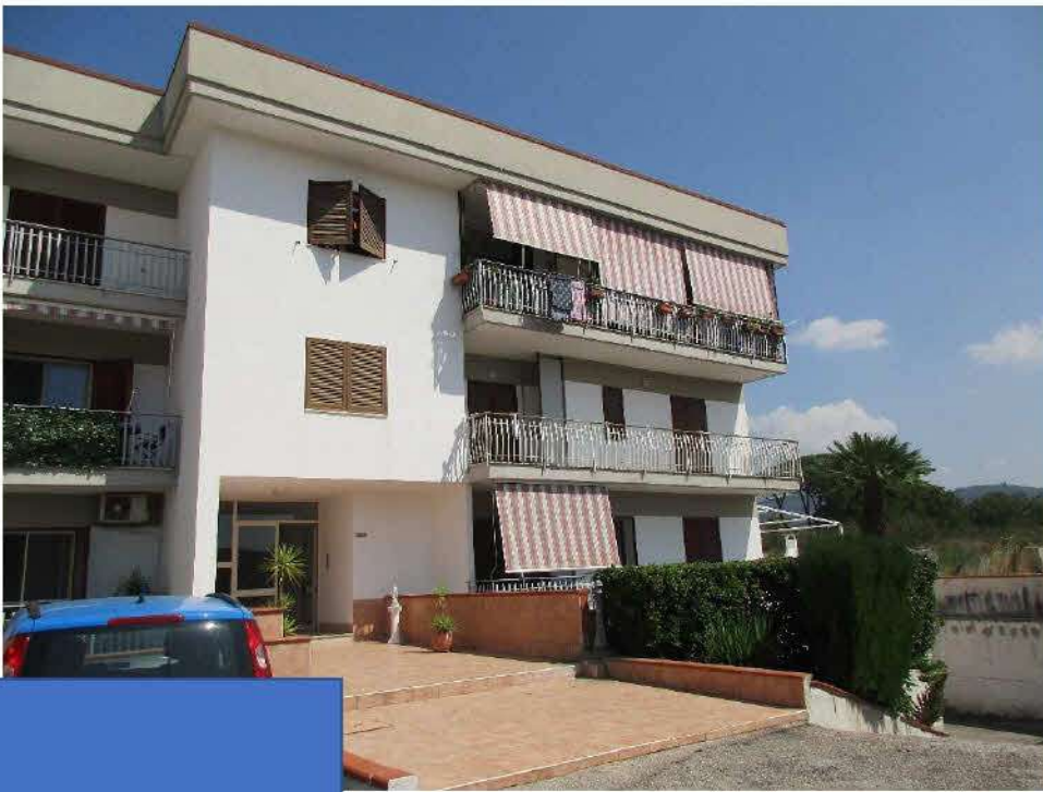
Foto n.1/2: Nola, via Saviano n.317, parco NapolitanoIII. Proprietà Omissis Esterno del parco ed estrno del fabbricato. particolari