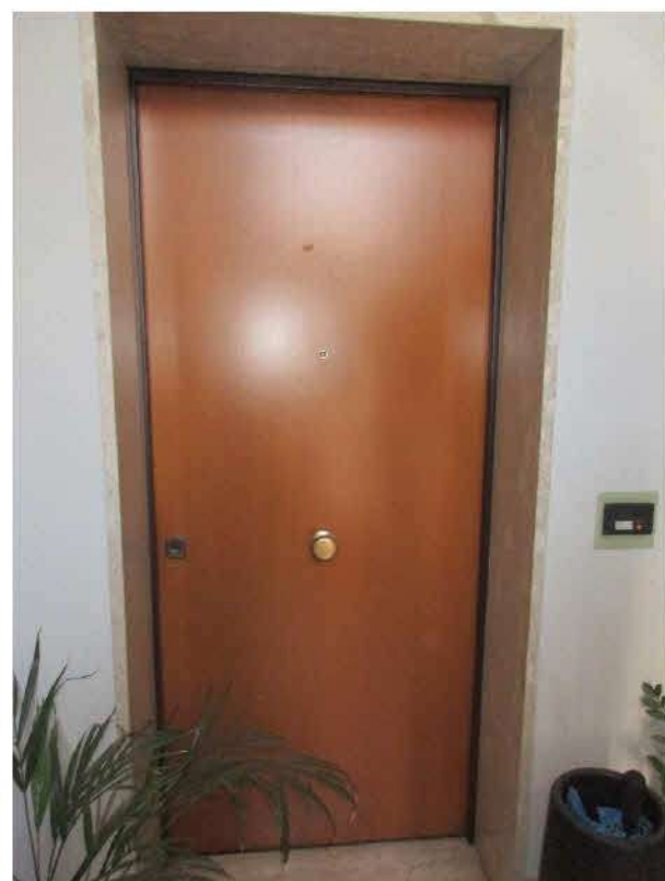
Foto n.3/5: Nola, via Saviano n.317, parco NapolitanoIII. Proprietà Omissis Esterno del fabbricato, ingresso fabbricato e ingresso appartamento. particolari