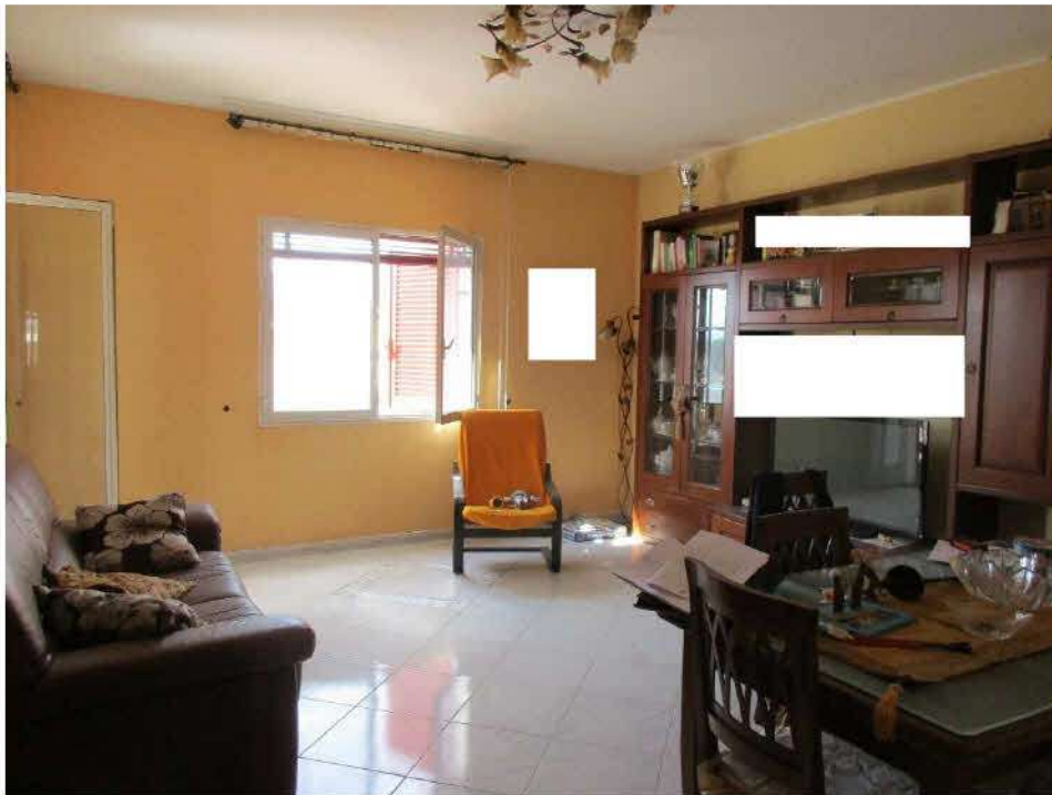
Foto n.6/8: Nola, via Saviano n.317, parco NapolitanoIII. Proprietà Omissis , interno appartamento appartamento. Particolari