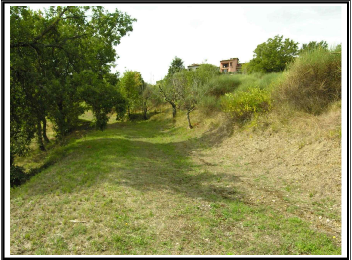
Geom. RAOUL LACCHI STUDIO DI PROGETTAZIONE E CONSULENZA