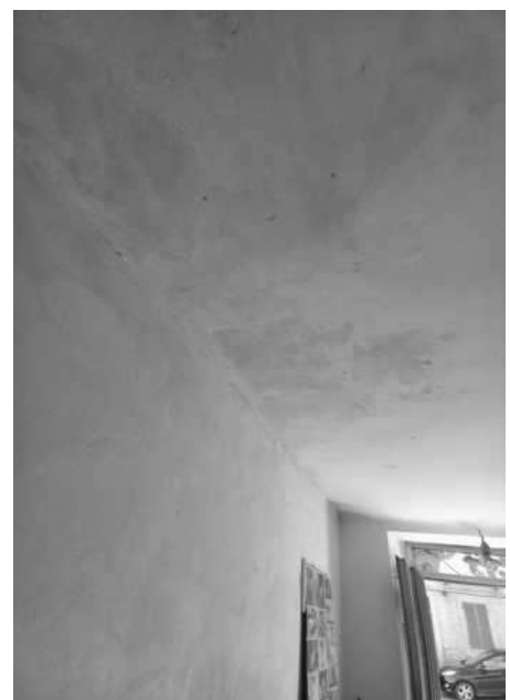
dettagli stato conservazione