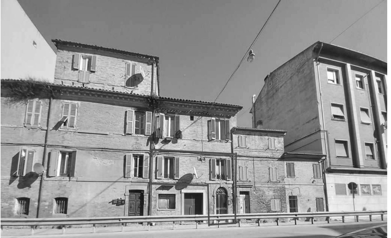
prospetto su Corso G. Garibaldi