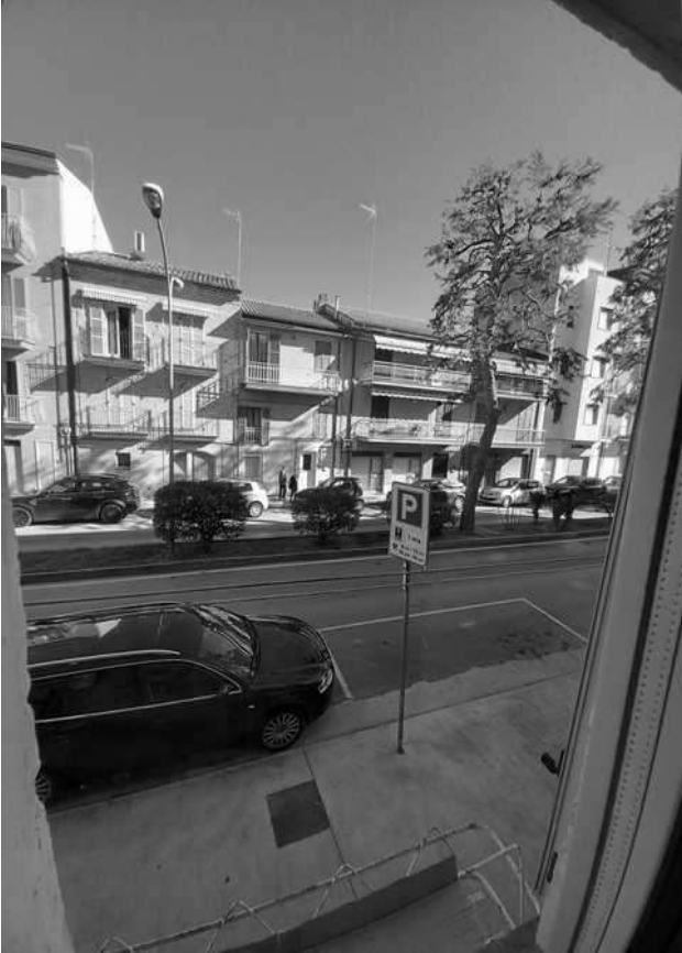
affaccio su Via Giordano Bruno