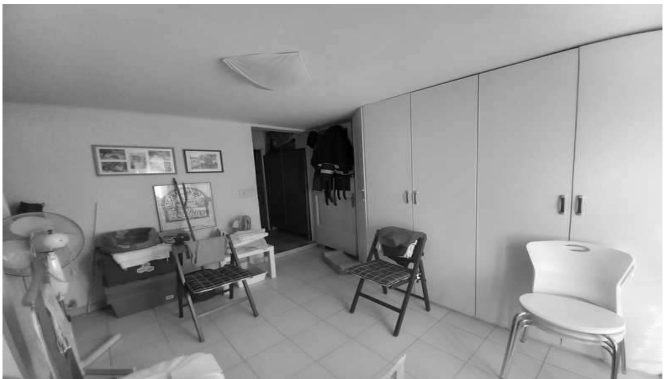
camera angolo sud