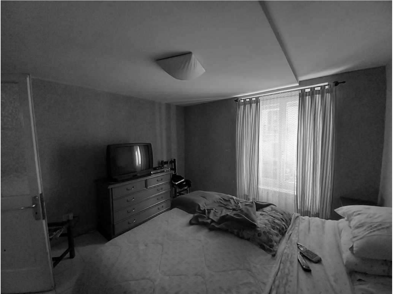
camera angolo nord