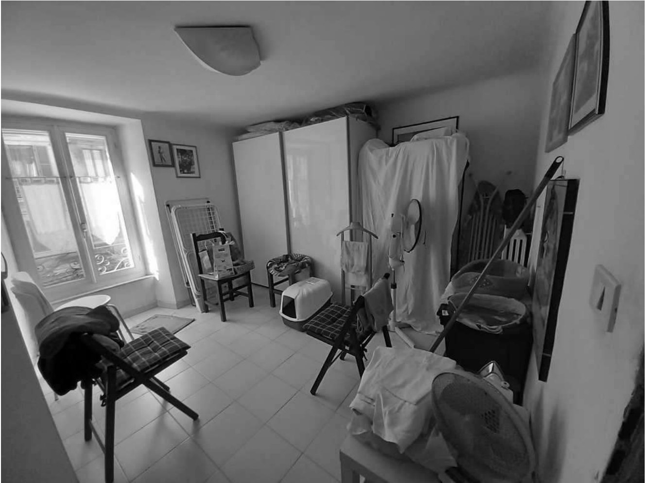
camera angolo sud