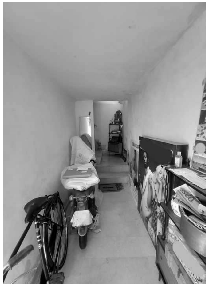
accesso dal n. 202 - portone di ingresso e vano al piano terra