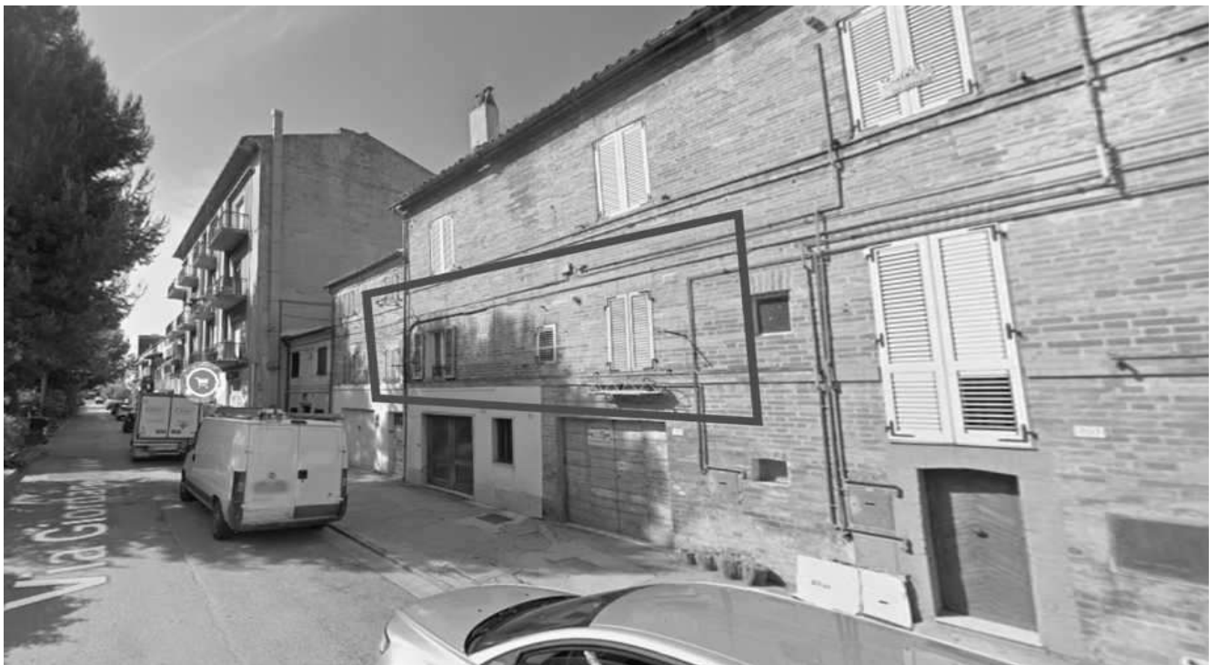
prospetto su Via Giordano Bruno