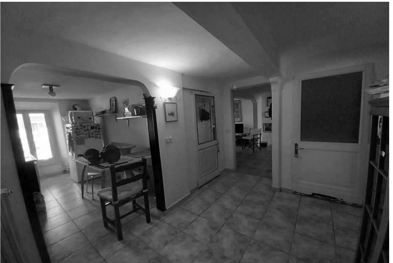
piano primo- ingresso disimpegno