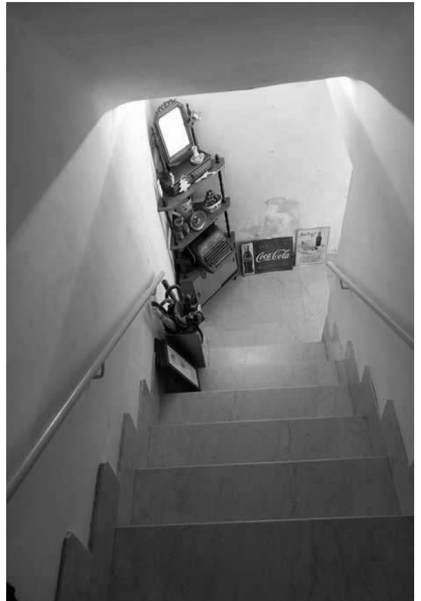
scala di accesso all'appartamento piano primo