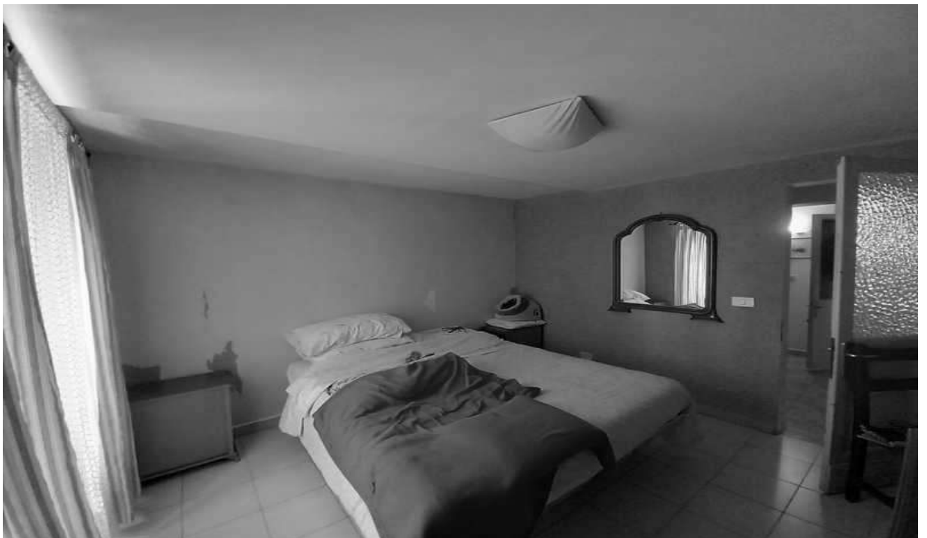
camera angolo nord