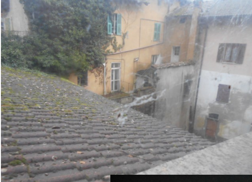
manto e coibentazione della copertura