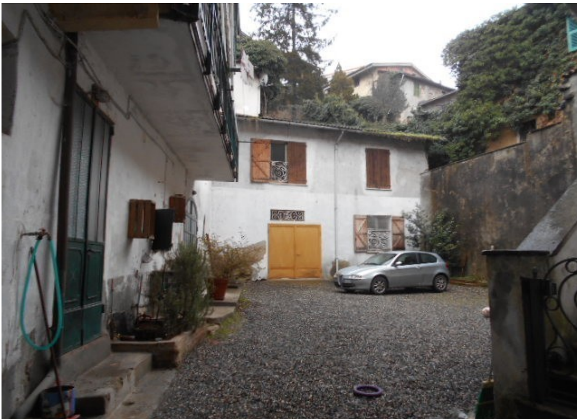
il fabbricato in procedura sul fondo della corte