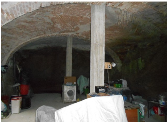
il piano terreno