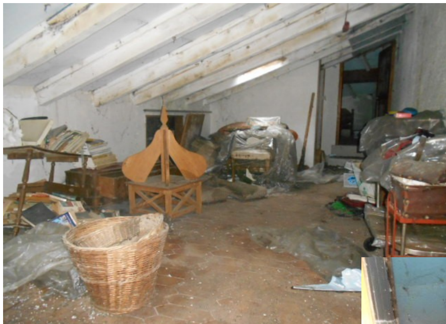
il piano soppalcato e il secondo servizio igienico