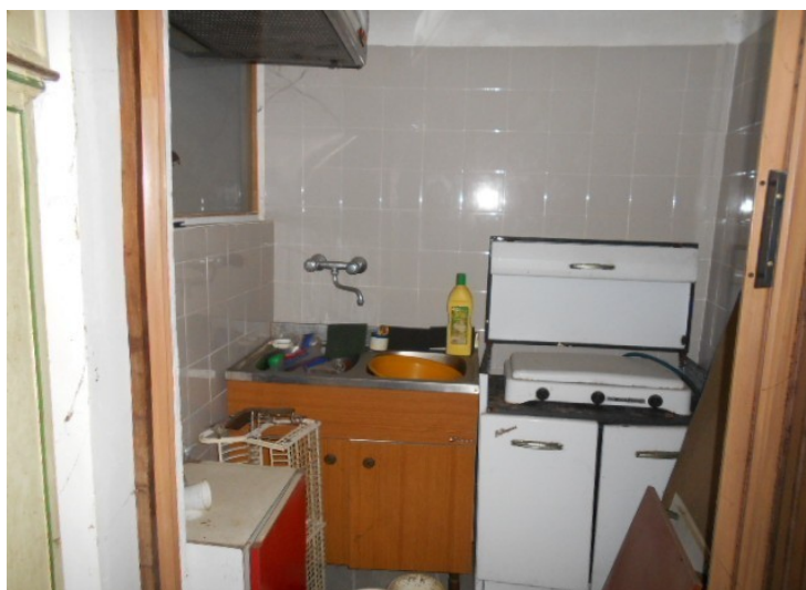
e angolo cottura