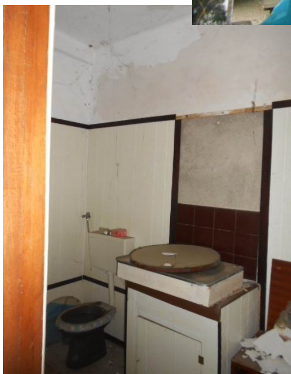
con servizio igienico