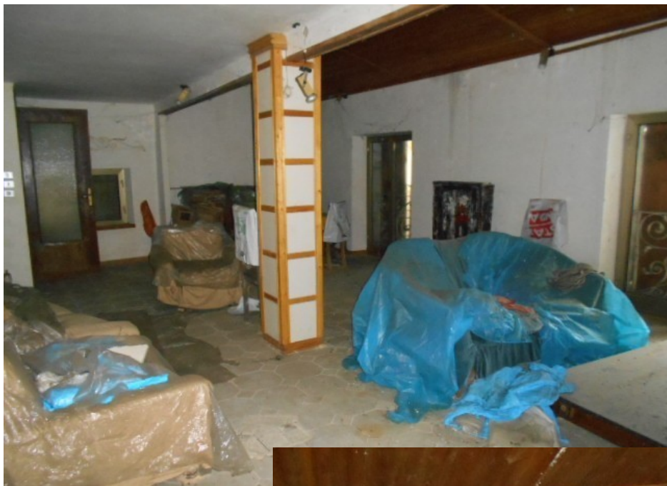
il primo piano parzialmente soppalcato