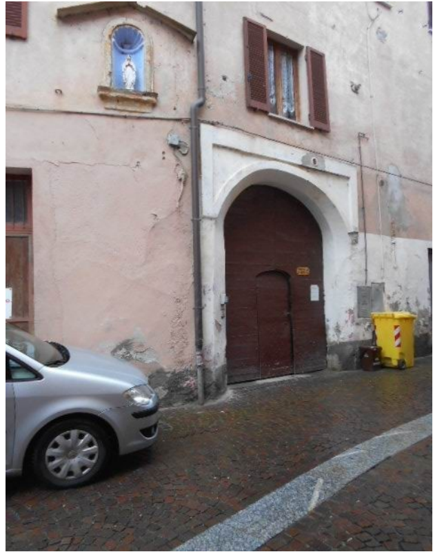
i fabbricati principali della corte sull'angolo via Visconti / via del Forno e il portone di ingresso al civico 5