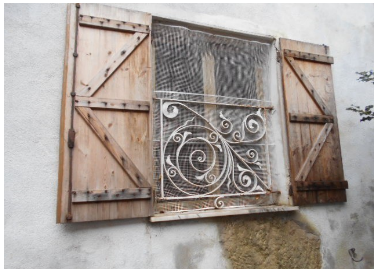
serramenti in alluminio (a filo pavimento a 1P) protezione e scuri esterni