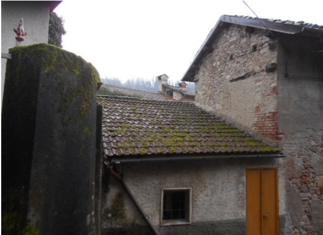
la testata nord con l'accesso da via del Forno direttamente al primo piano