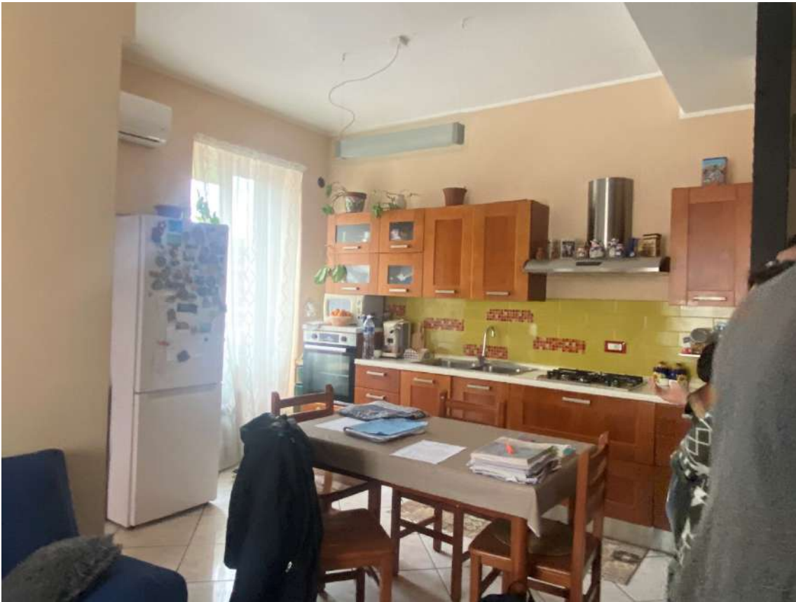
Foto 7: Vista open space cucina-soggiorno con particolare angolo cottura