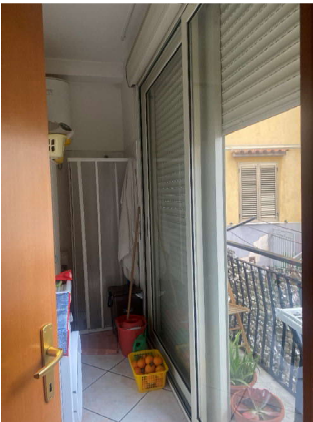
Foto 12: Vista balcone chiuso a vetri, ove si prevede la rimozione dei sanitari