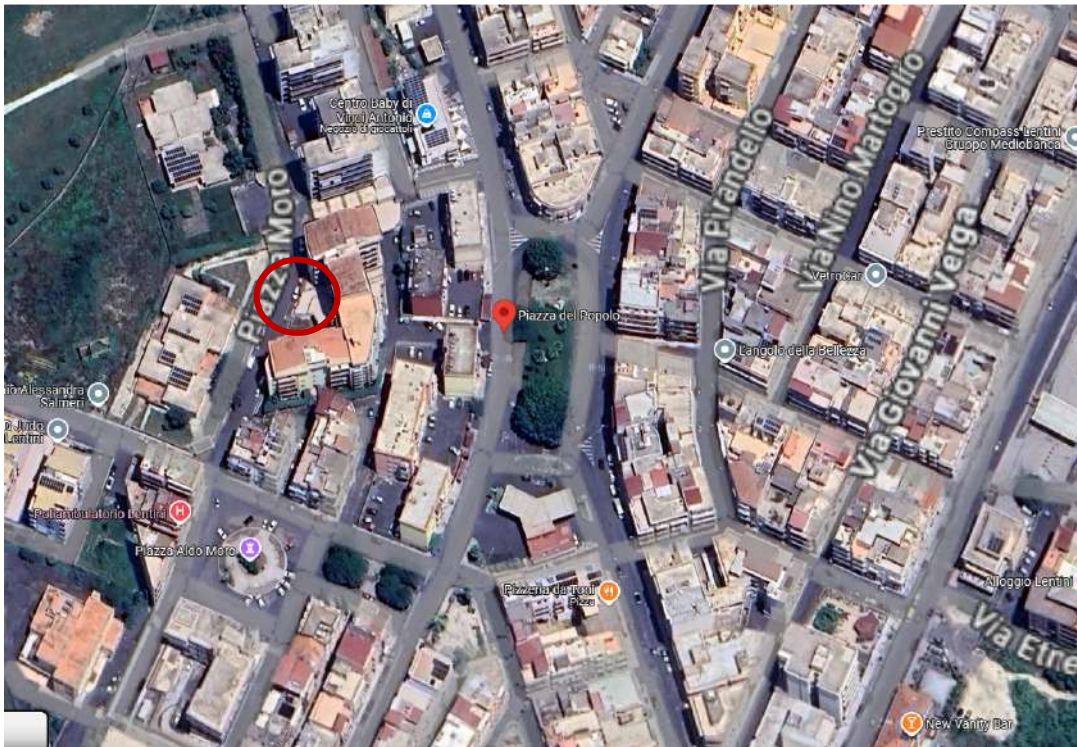
Foto1: Aerofoto immobile oggetto di stima in Lentini, Piazza del Popolo n°1 – coordinate 37°17'35.15"N; 14°59'54.28"E.