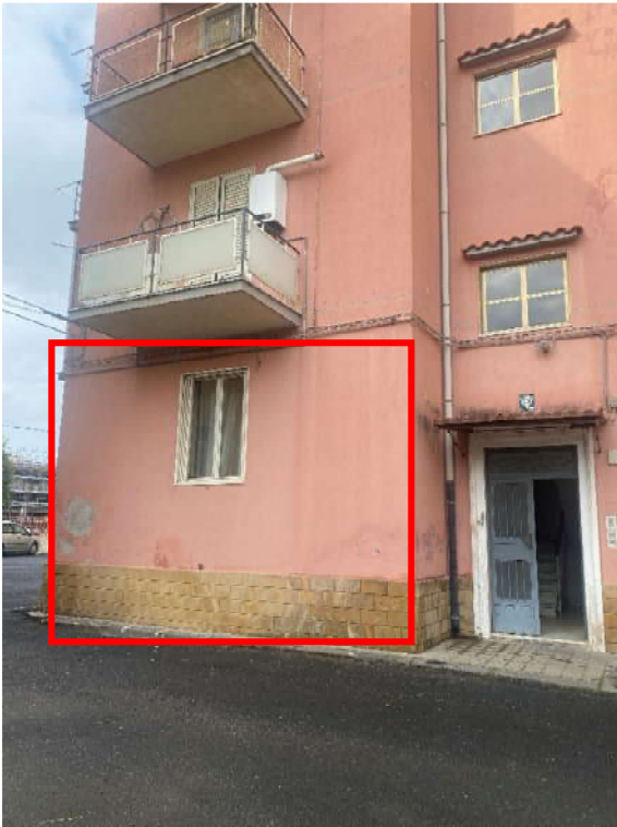
Foto 3: Vista portone condominiale di ingresso sul prospetto principale