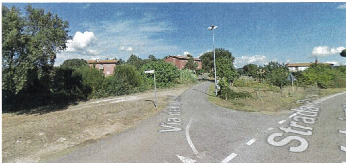
Prospetto su via Firenze