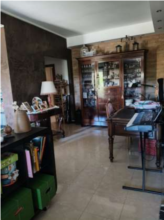
Foto n. 11 salapranzo-salotto