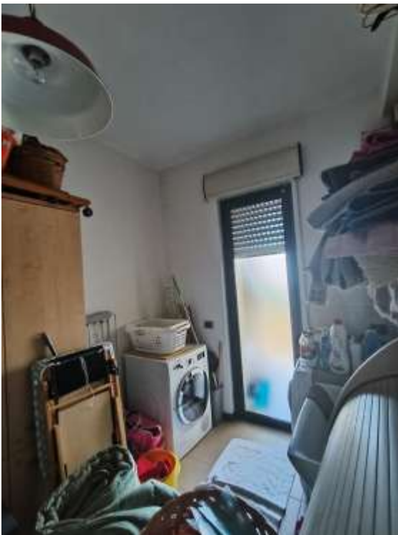
Foto n. 14 lavanderia