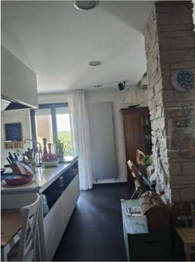
Foto n.9 Cucina