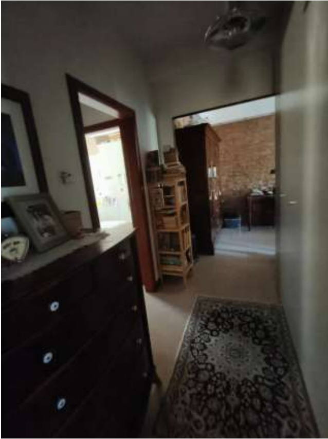
Foto n. 22 disimpegno