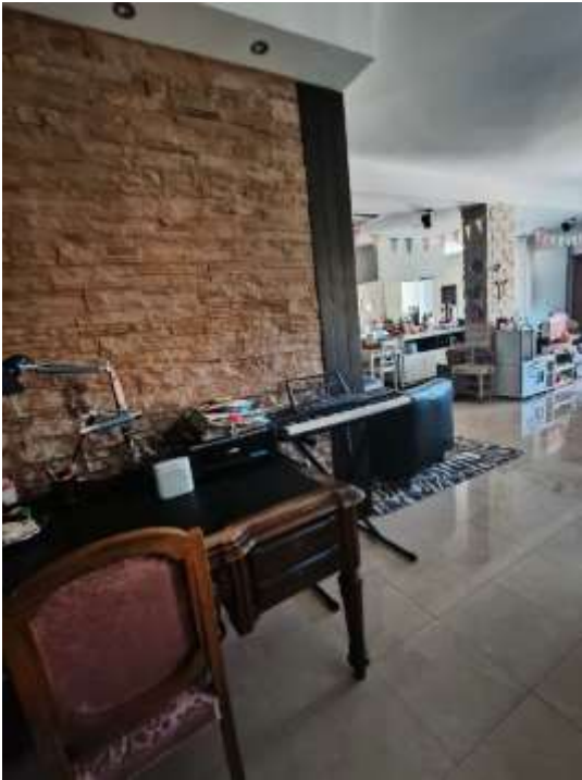
Foto n. 13 salapranzo-salotto