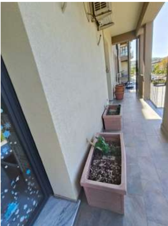
Foto n. 23 Balcone