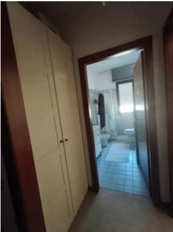
Foto n. 19 Disimpegno