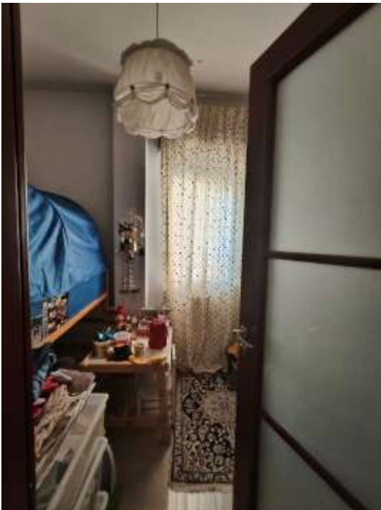
Foto n.18 Ripostiglio