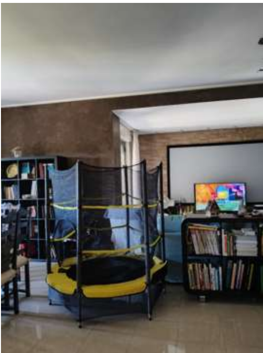
Foto n. 12 salapranzo-salotto