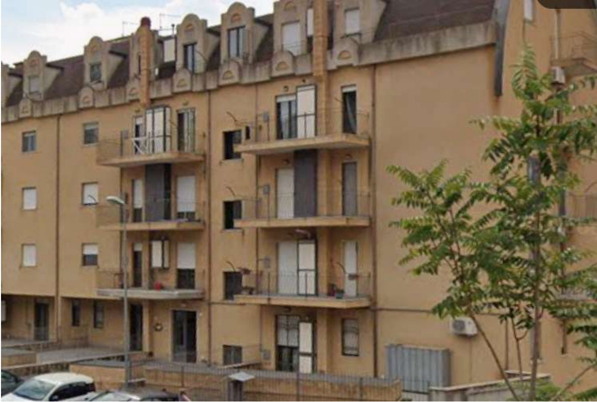
Accesso da corte comune