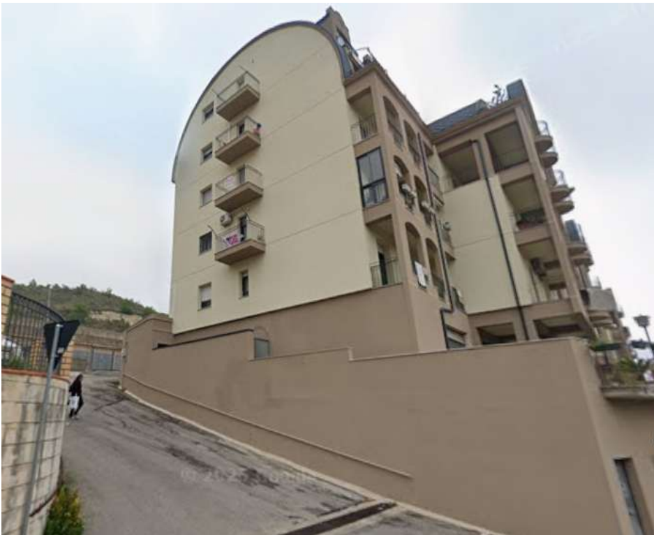
Foto n. 6 Prospettiva nord del fabbricato