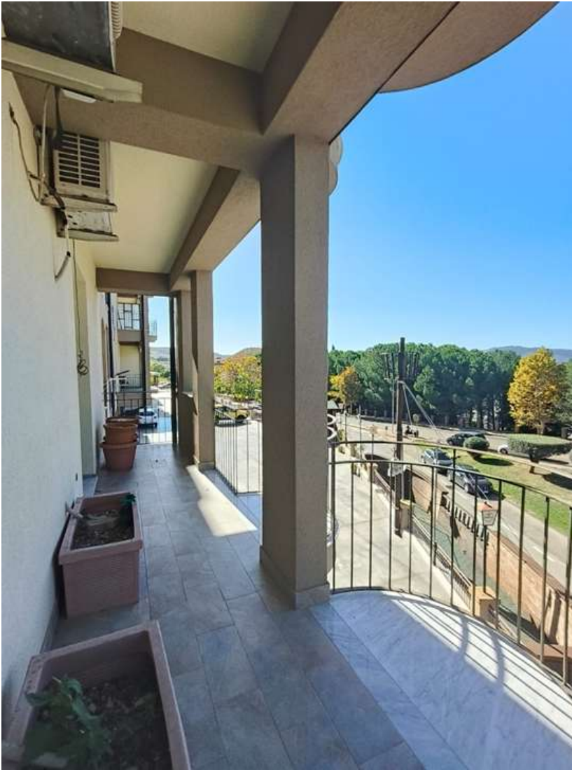
Foto n. 24 Balcone