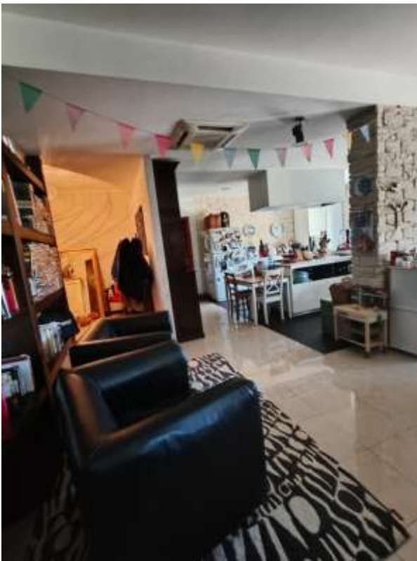
Foto n. 10 sala pranzo- salotto