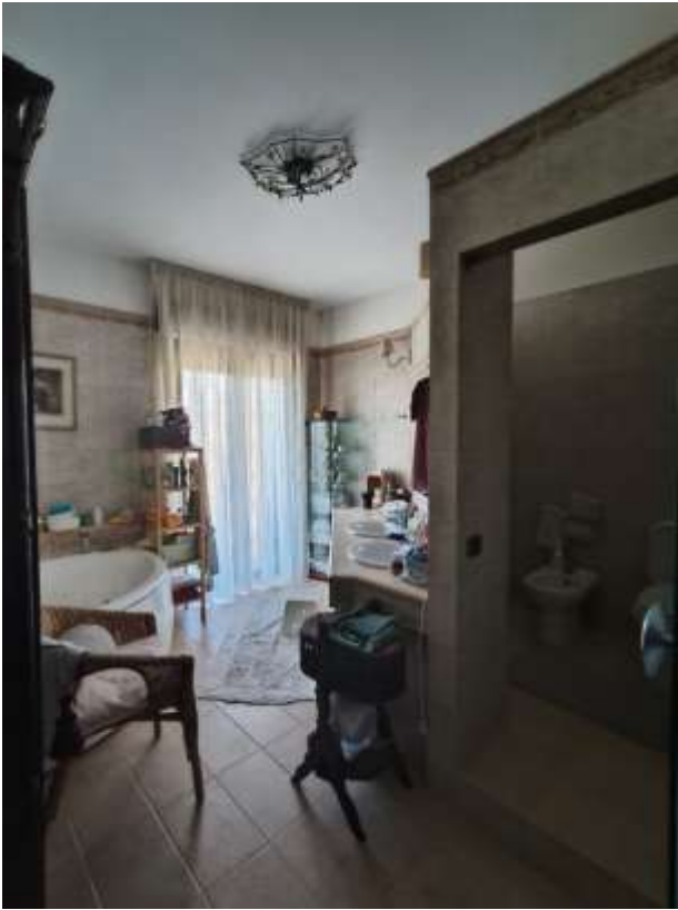
Foto n.17 bagno