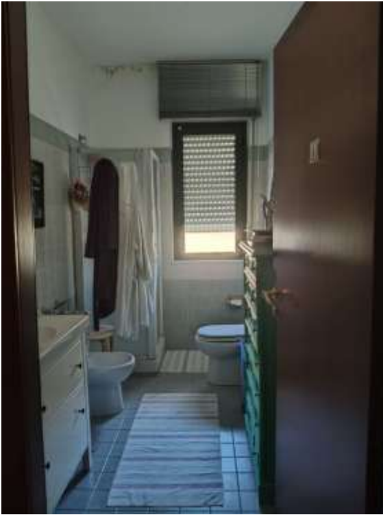
Foto n. 20 Bagno secondario