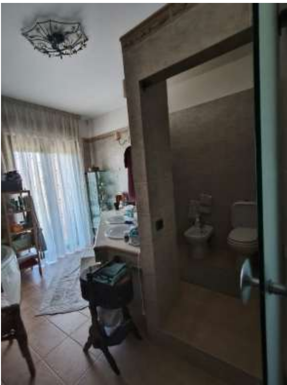
Foto n. 16 Bagno