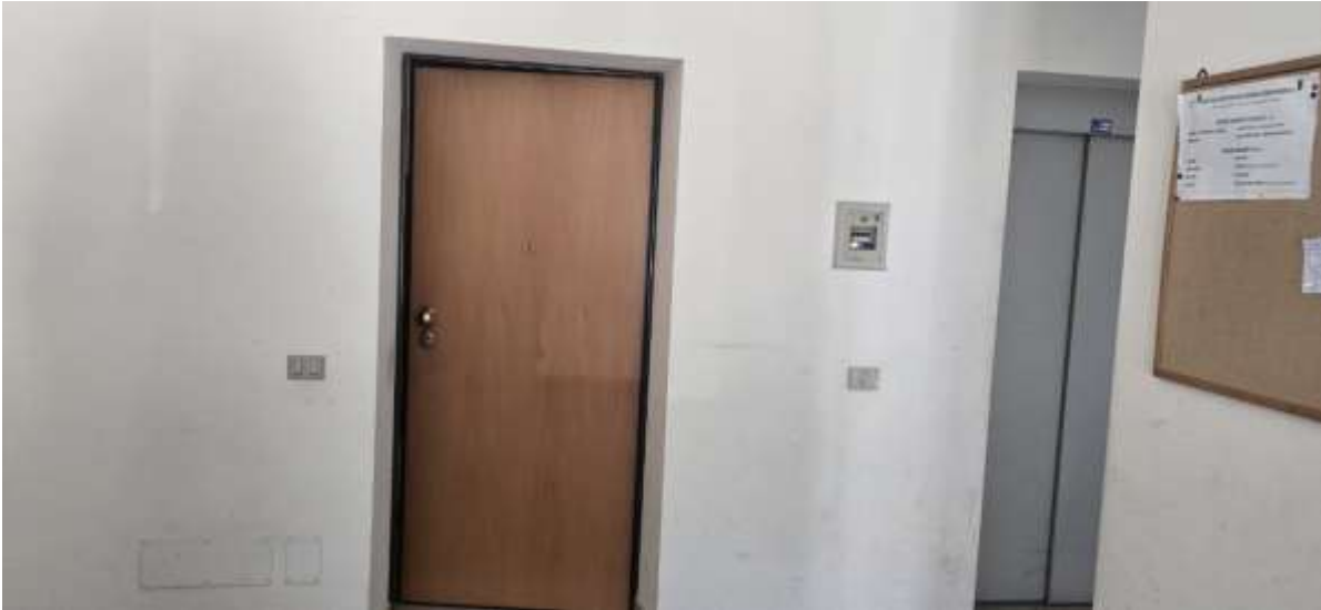
Foto n. 7 Accesso immobile pt, vano scala