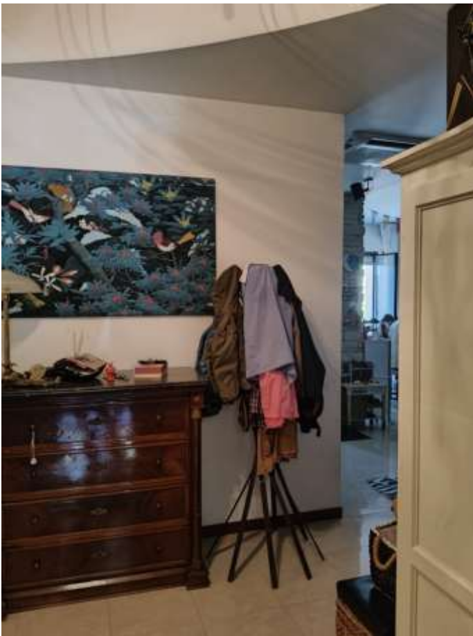
Foto n.8 ingresso