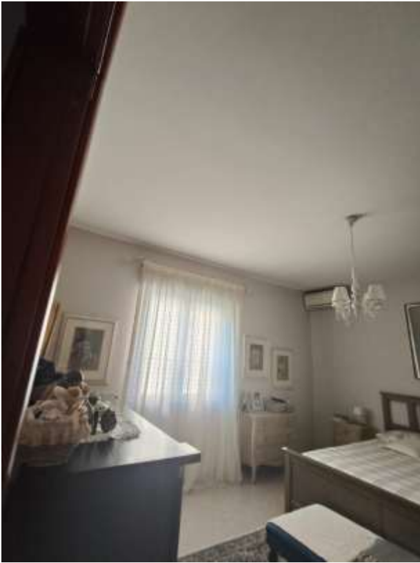
Foto n. 19 camera da letto