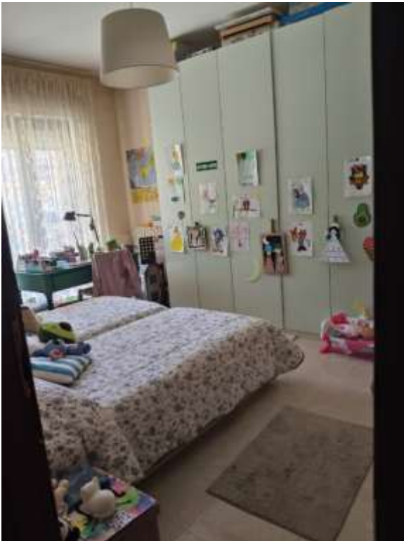
Foto n. 21 Cameretta