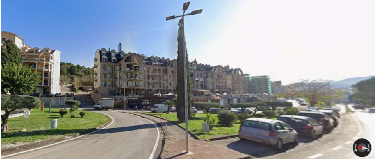
Foto n. 3 Prospettiva Complesso Condominiale