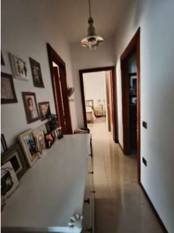
Foto n.15 Disimpegno