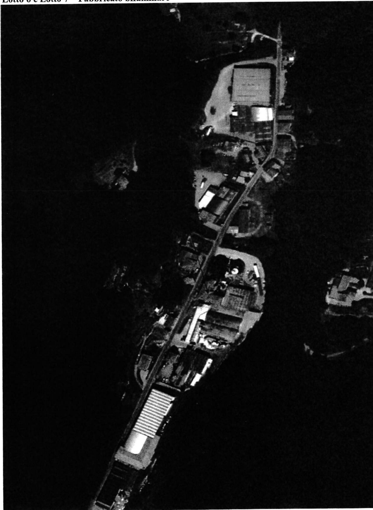
Ripresa satellitare "E"