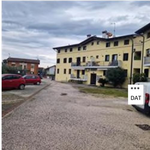
vista facciata interna Condominio LA LUNA