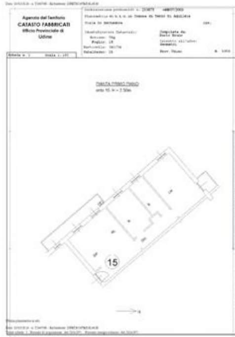
ABITAZIONE - Planimetria Catastale - foglio n. 2 mappale n. 740/34 sub. 15