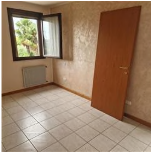
camera da letto