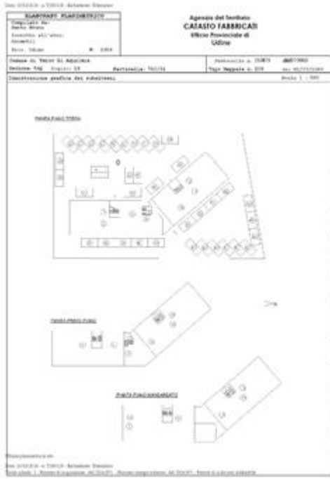
Elaborato Planimetrico - foglio n. 2 mappale n. 740/34