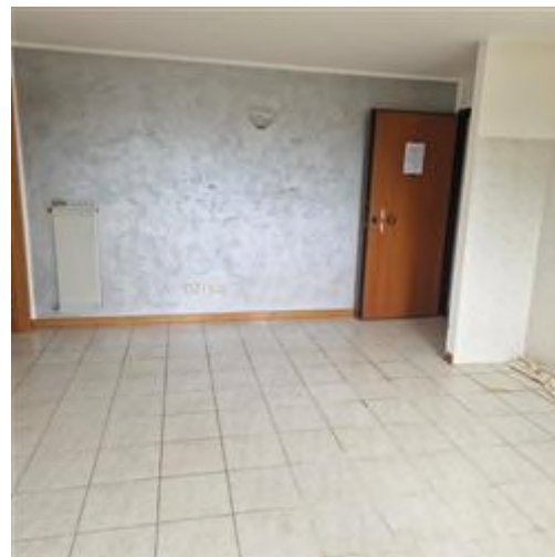
soggiorno-pranzo con angolo cottura