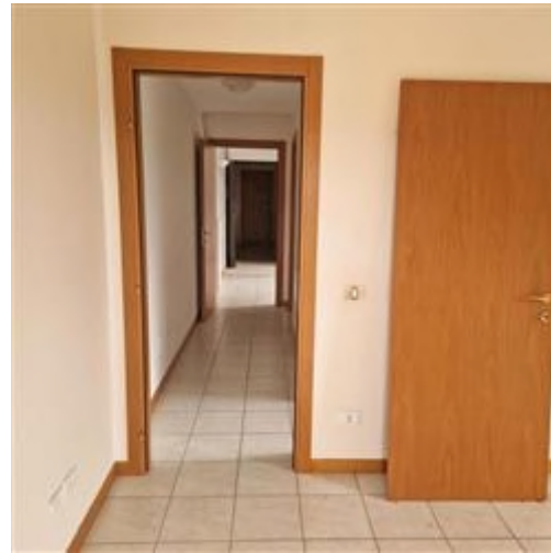
corridoio - disimpegno