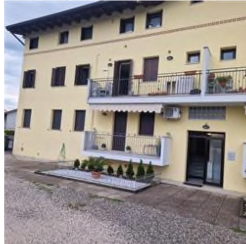
vista ingresso vano scale condominiale e vista appartamento