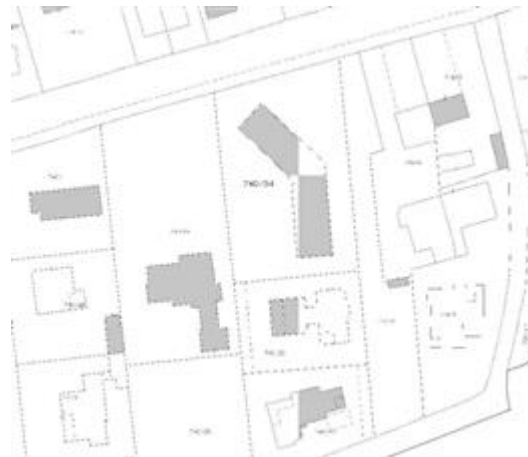
stralcio estratto di mappa