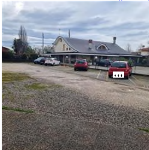
vista area esterna e posti auto scoperti