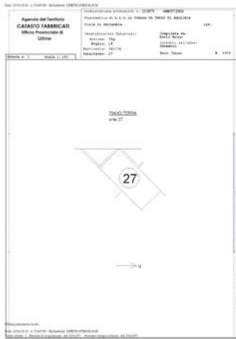
POSTO AUTO-SCOPERTO - Planimetria Catastale - foglio n. 2 mappale n. 740/34 sub. 27