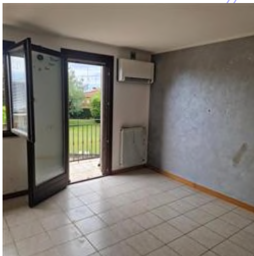
soggiorno-pranzo con angolo cottura

termico: con alimentazione in gas metano conformità: riferita all'epoca di realizzazione. caldaia da sostituire al di sotto della media ★★☆☆☆☆☆☆☆☆