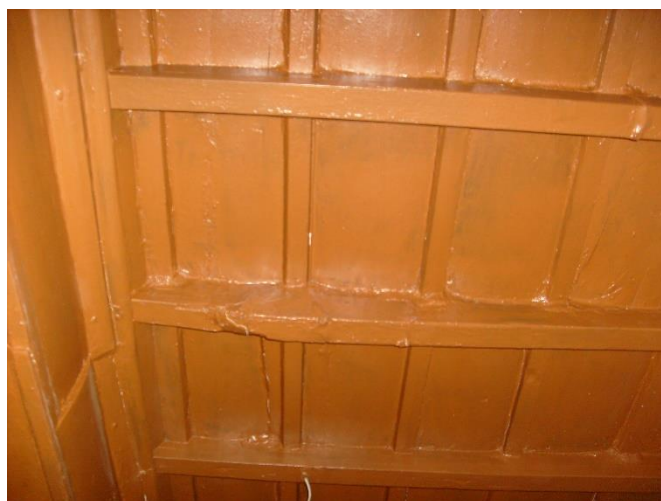
Particolare soffitto ambiente soggiorno/pranzo