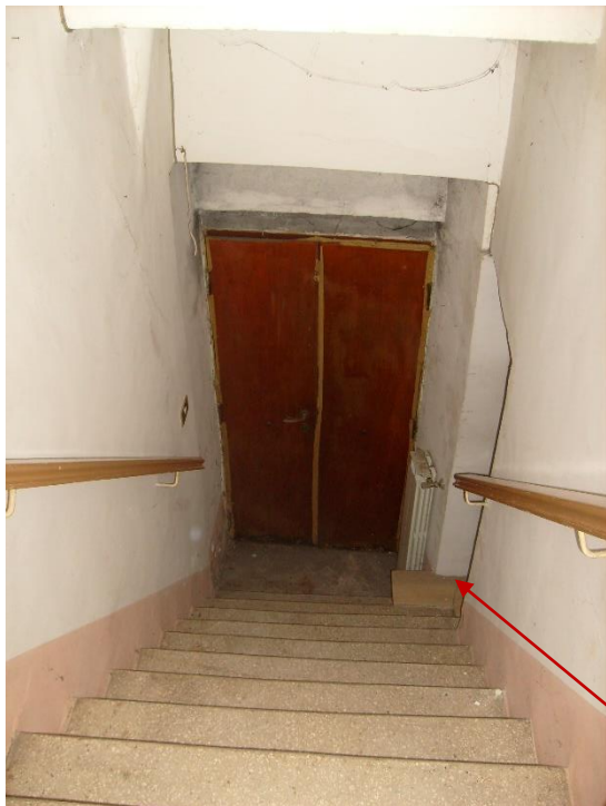
Scala di accesso al piano primo con portone di accesso dall'esterno