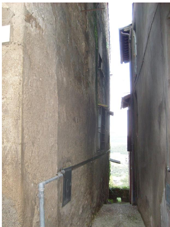
Lato su vicolo