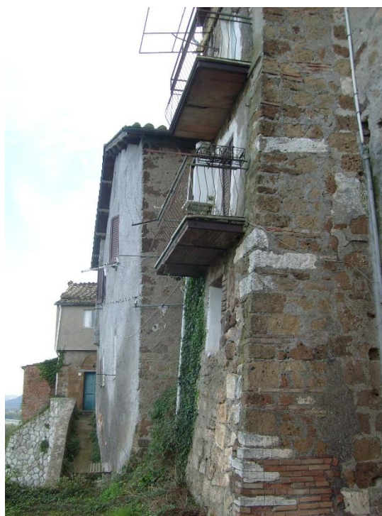
Retro fronte Rupe