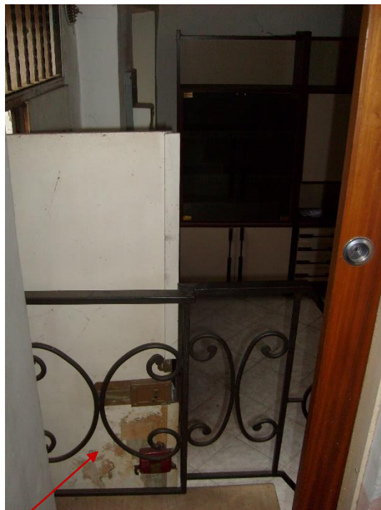
Collegamento dalla cucina posta al piano terra alla scala di accesso al piano primo, tramite la porta posta nel pianerottolo