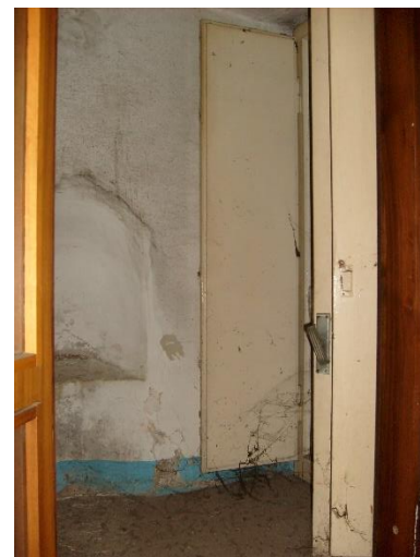
Areazione da finestra sopra le scale di collegamento con il piano primo