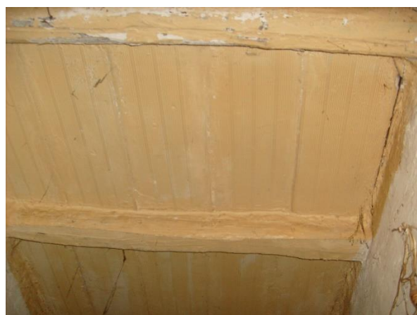
Particolare soffitto nel Ripostiglio