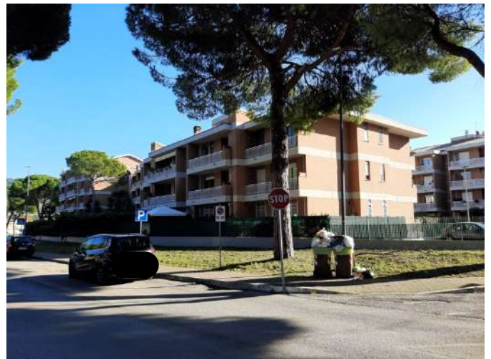
Foto n° 1: Vista dalla strada del Condominio Edilparco Palazzina A ed area verde Visibili le tre palazzine a schiera (A1_A2-A3).