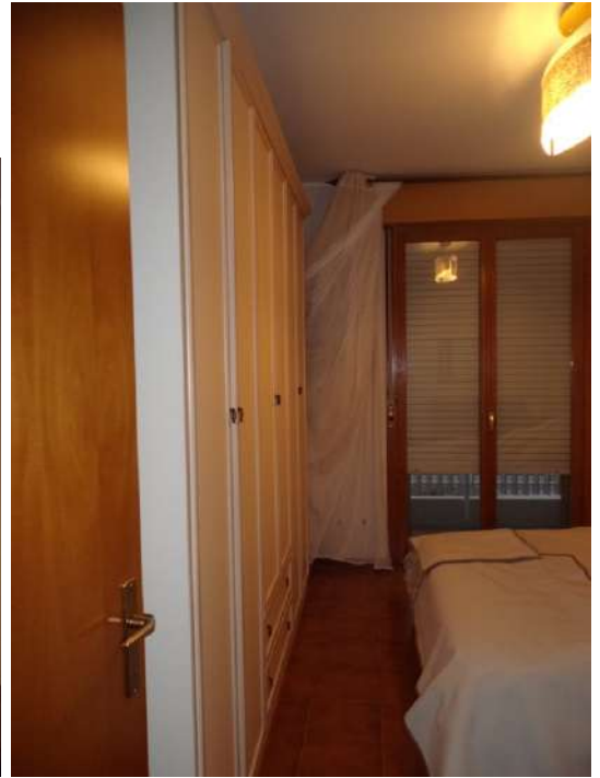
Foto n° 10: Camera matrimoniale con finestrone di accesso sul terrazzino