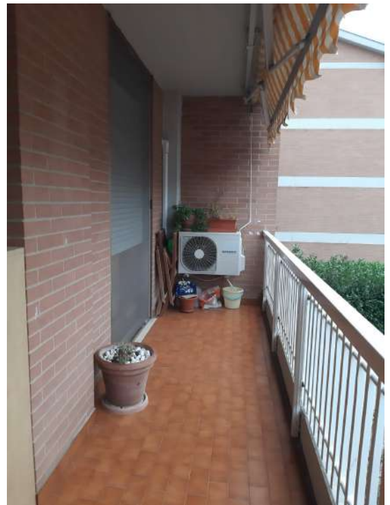
Foto n° 7: Terrazzo cucina e soggiorno, visibile la porta in ferro del locale caldaia e lavatrice