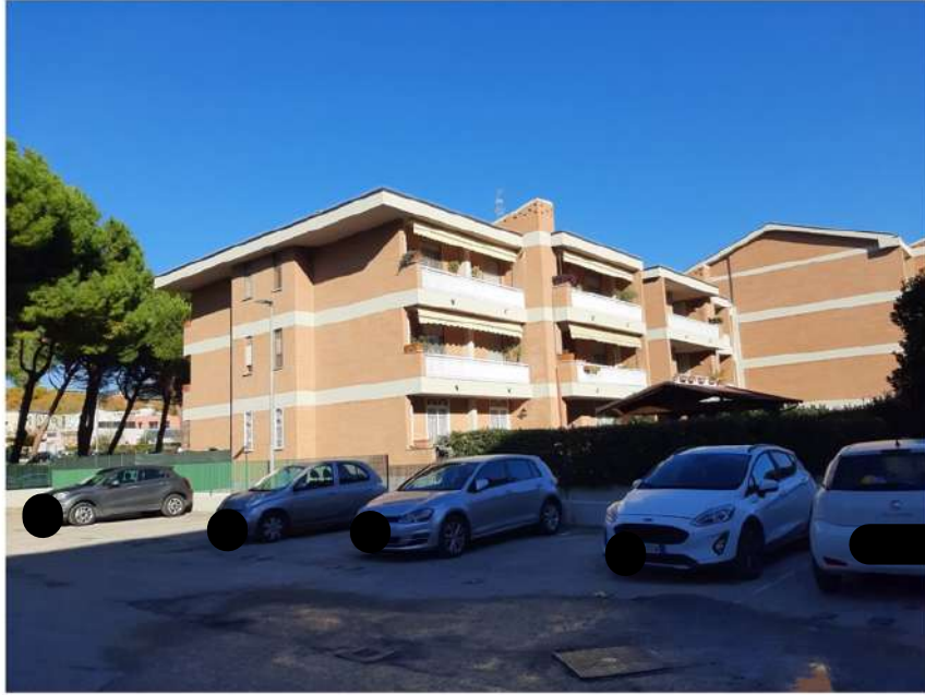
Foto n° 2/A: La Palazzina A3 del Condominio Edilparco: corte esterna con posto auto.