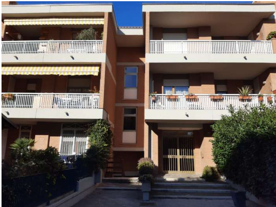
Foto 2/B: Ingresso Palazzina A3 - Visibile appartamento proprietà [redacted] al P1 sulla sinistra.