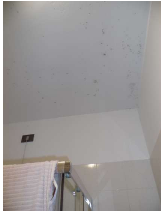
Foto n° 8: Bagnetto con box doccia. Sono presenti di chiazze di umidità nella parete soffitto