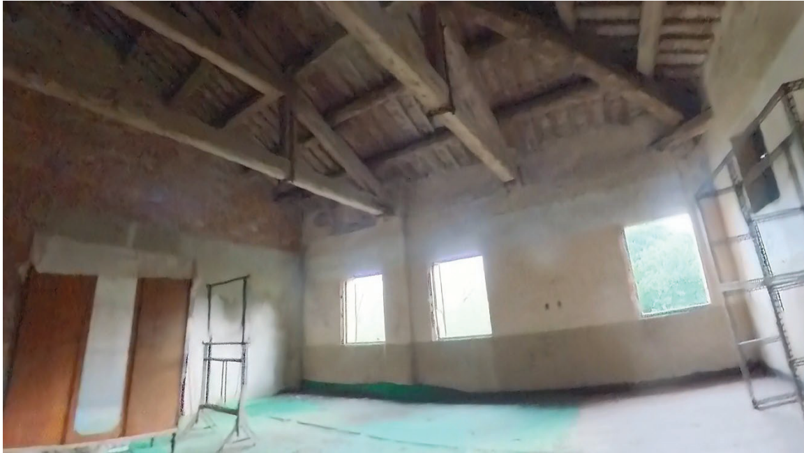
24 Interni mappale 91/1 p1 sottotetto