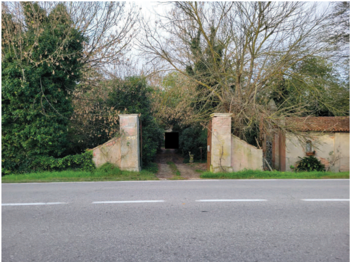
Figura 3 Cannello d'ingresso alla proprietà