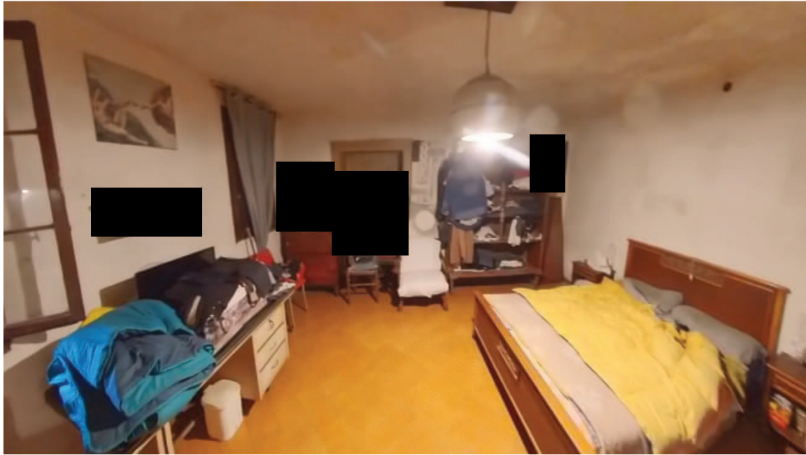
16 Interni mappale 91/1 piano terra