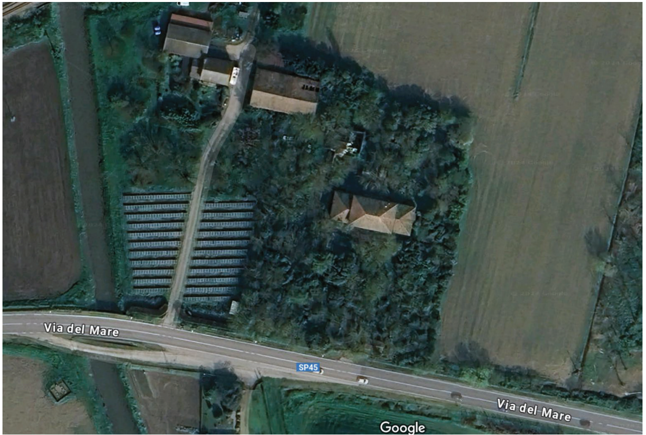
Figura 2 Particolare veduta aerea della zona