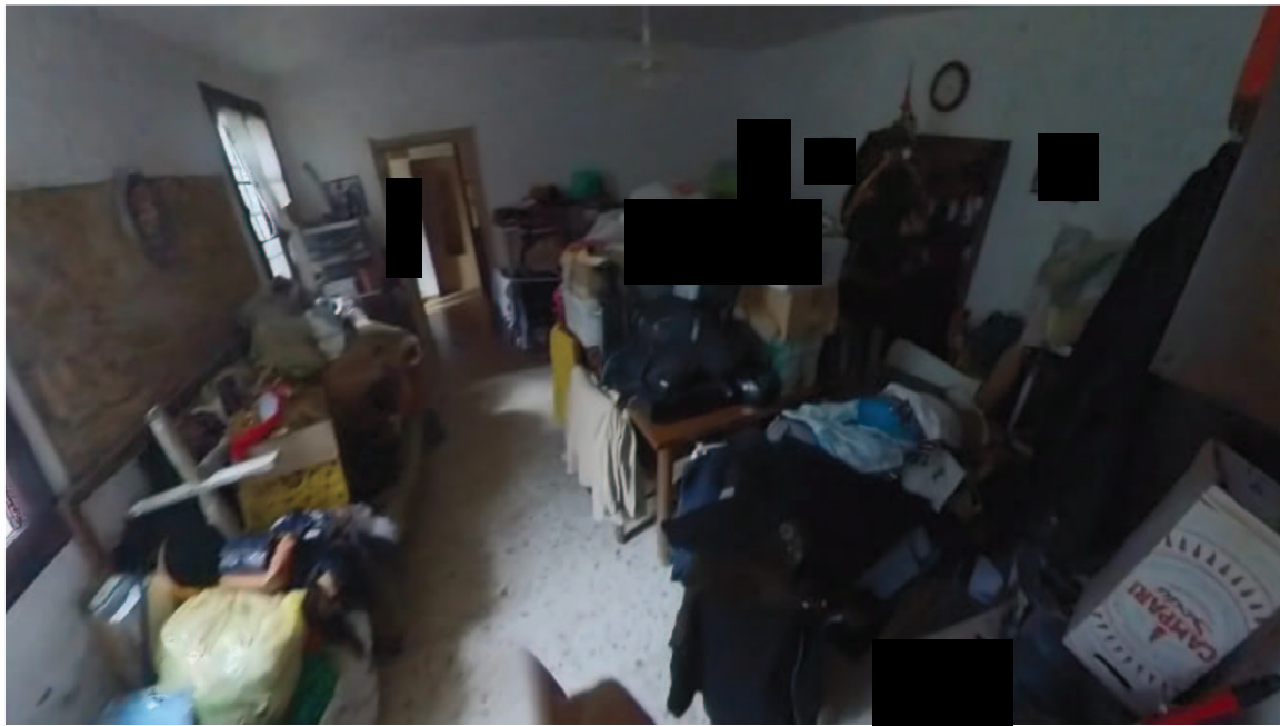
17 Interni mappale 91/1 pt ripostiglio