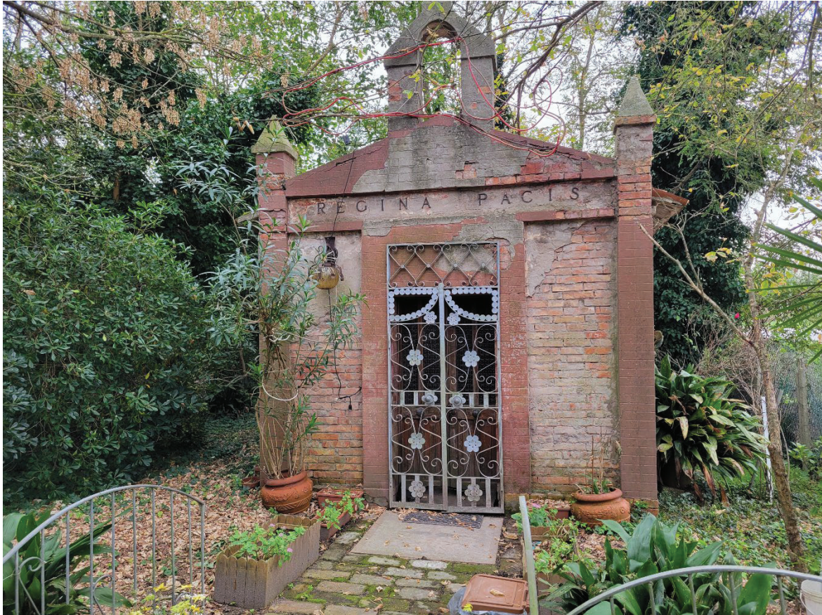
Figura 6 Saciello situato nelle vicinanze del cancello d'ingresso