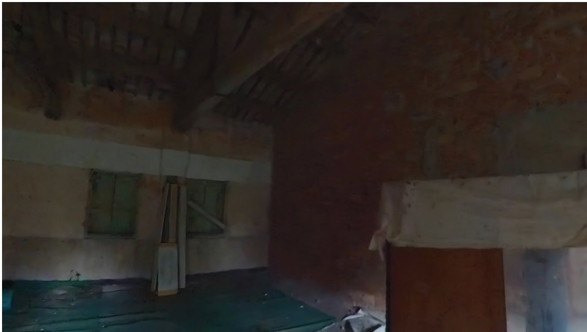
25 Interni mappale 91/1 p1 sottotetto