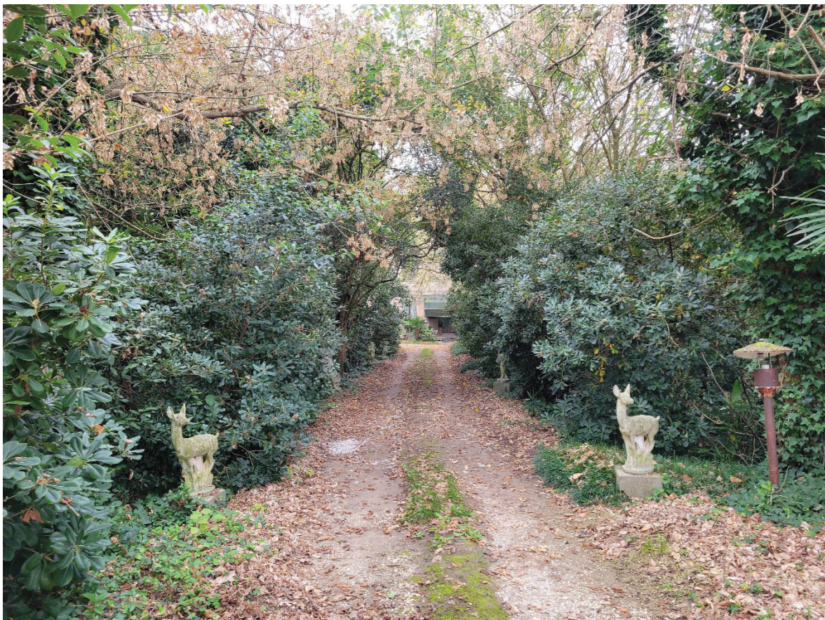
Figura 5 Vi ha detto d'accesso