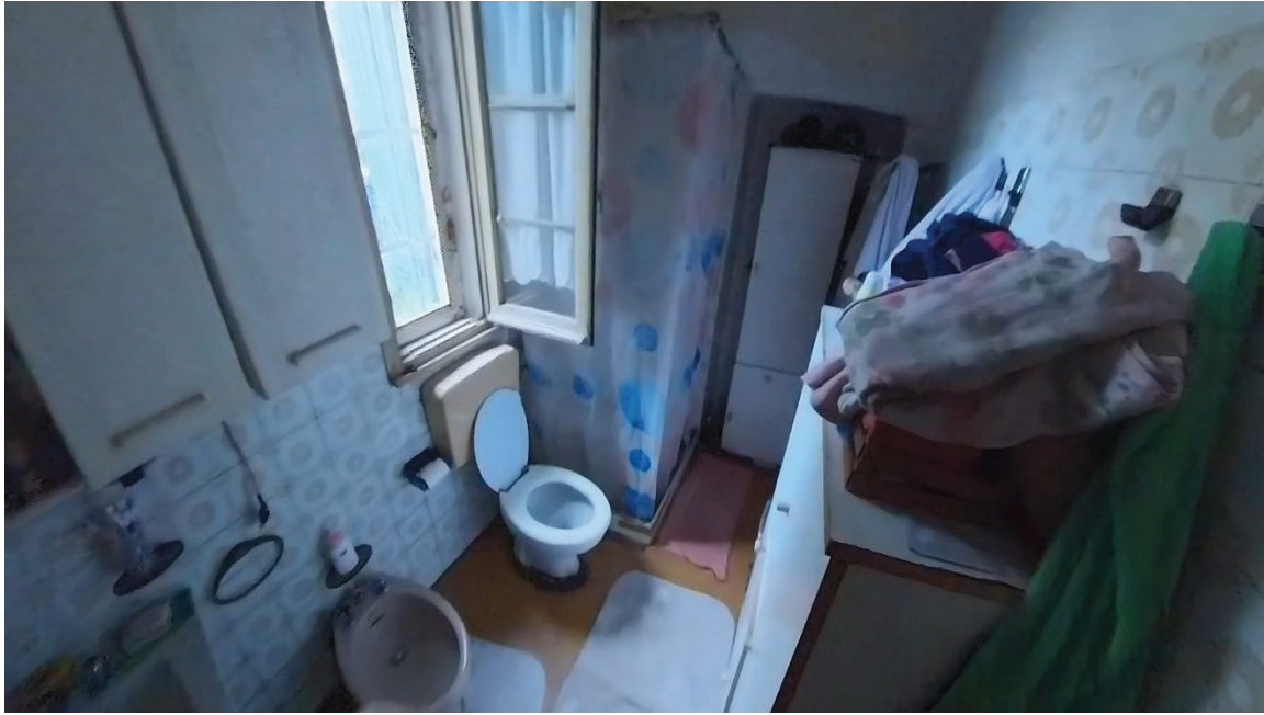
18 Interni mappale 91/1 pt wc