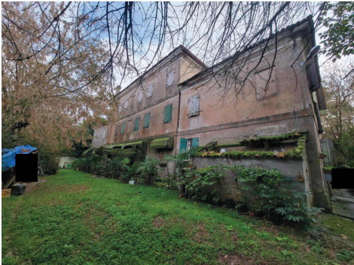
11 Veduta esterna da Nord-Ovest