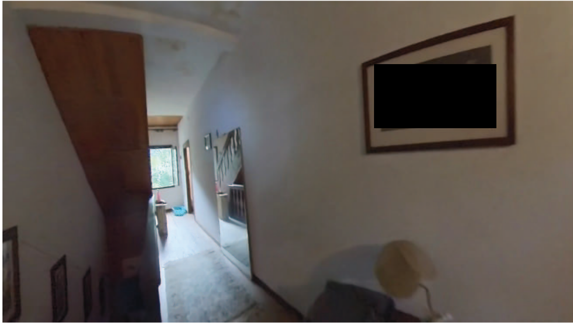
20 Interni mappale 91/1 p1 corridoio