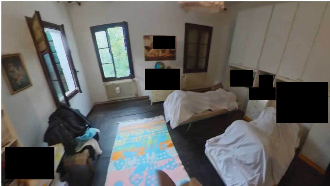
21 Interni mappale 91/1 p1 letto 1