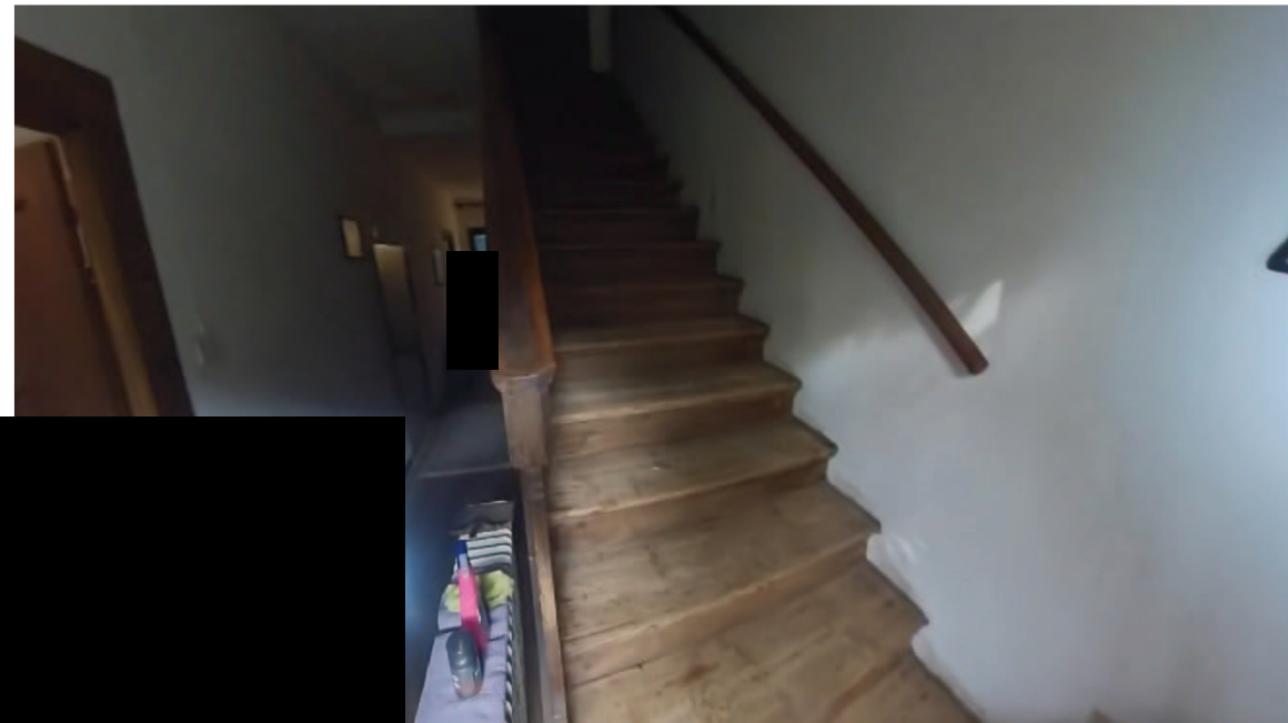
23 Interni mappale 91/1 p1 scala d' accesso al sottotetto