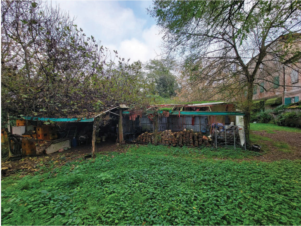
12 Pertinenza diroccata mappale 91 subalterno 3