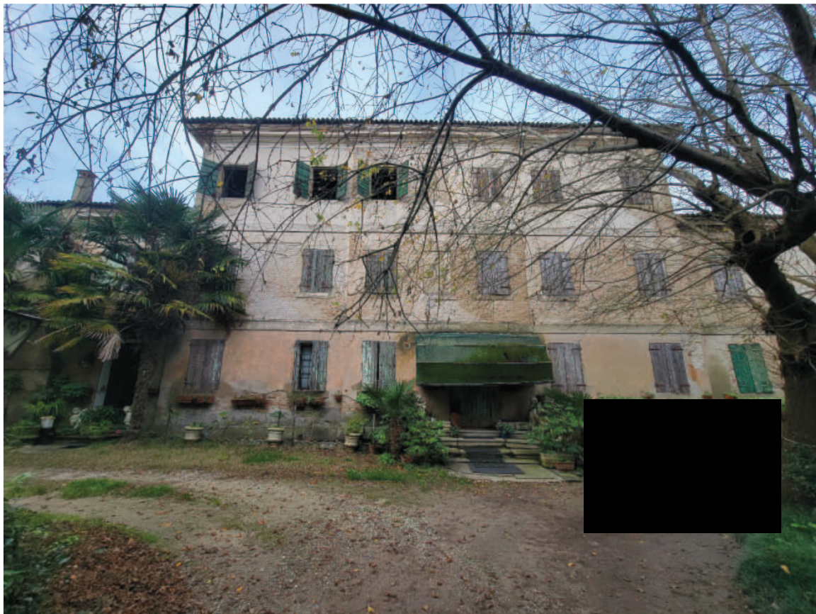
Figura 7 Veduta esterna della casa padronale lato sud