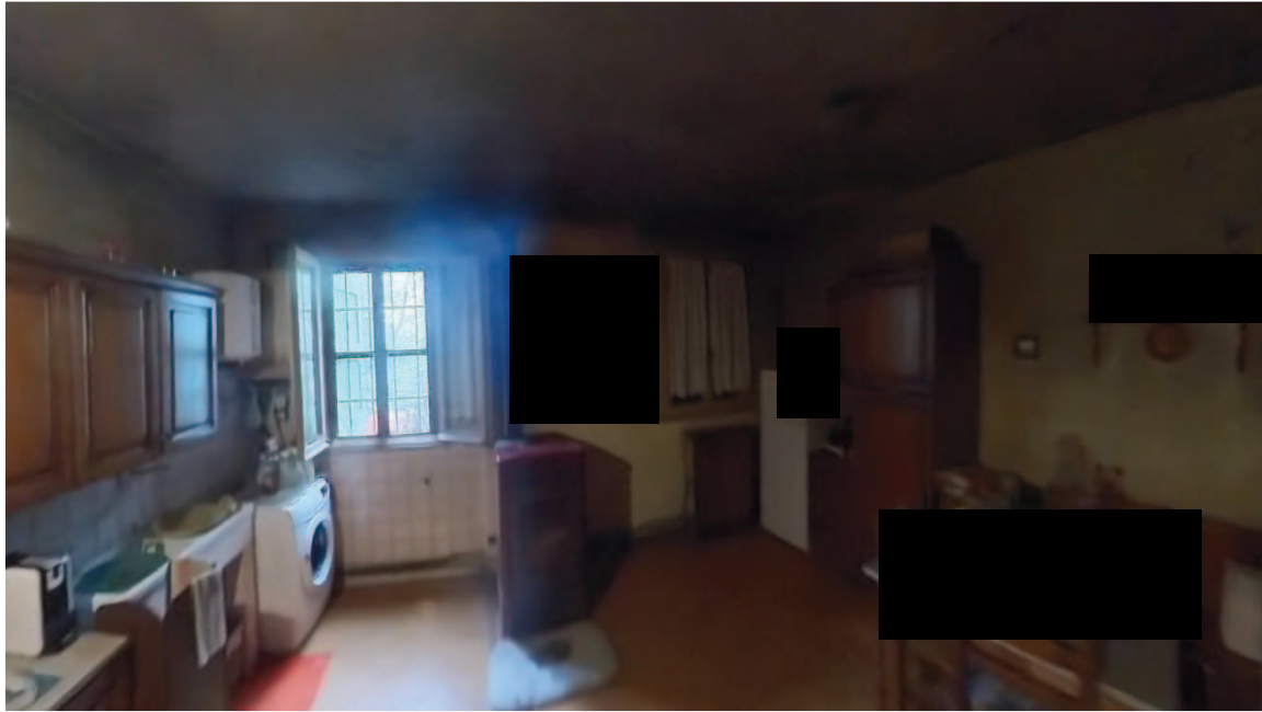
14 | Interni mappale 91/1 cucina