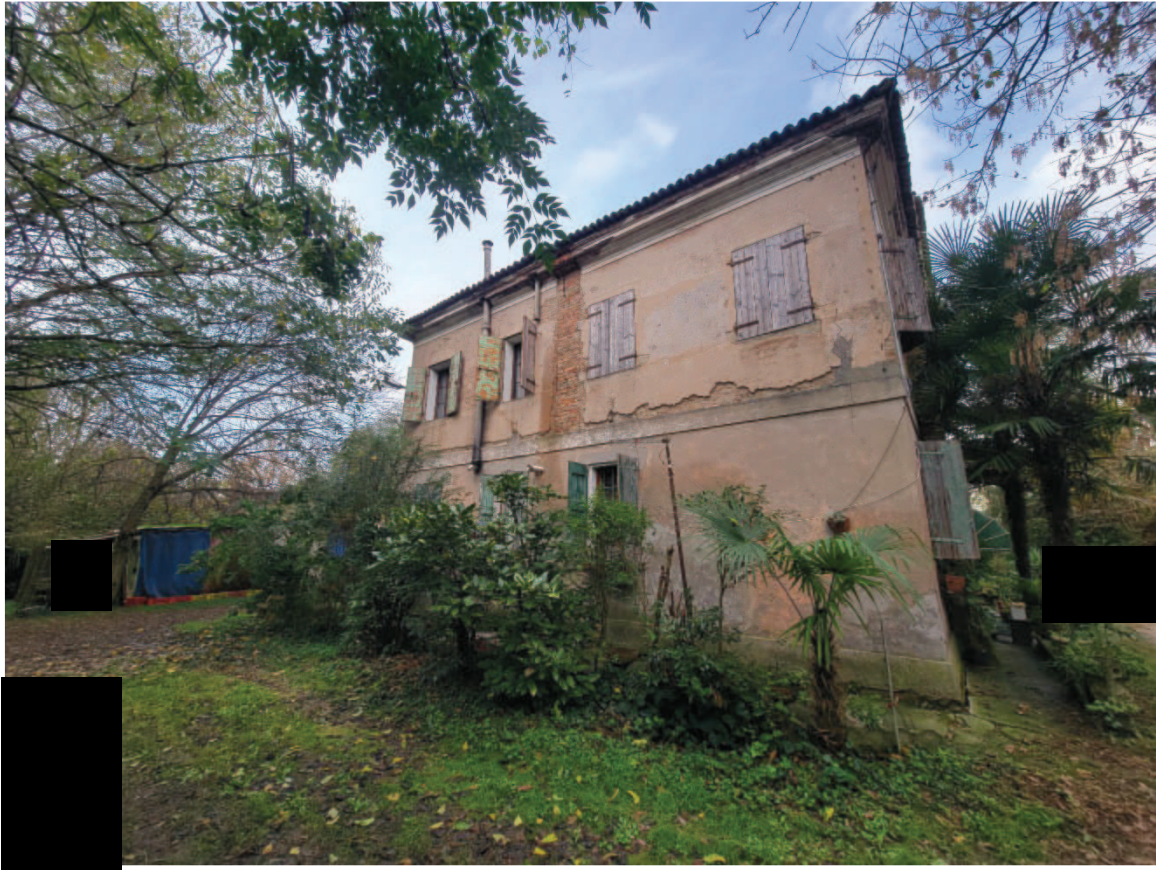
10 Veduta esterna lato Ovest