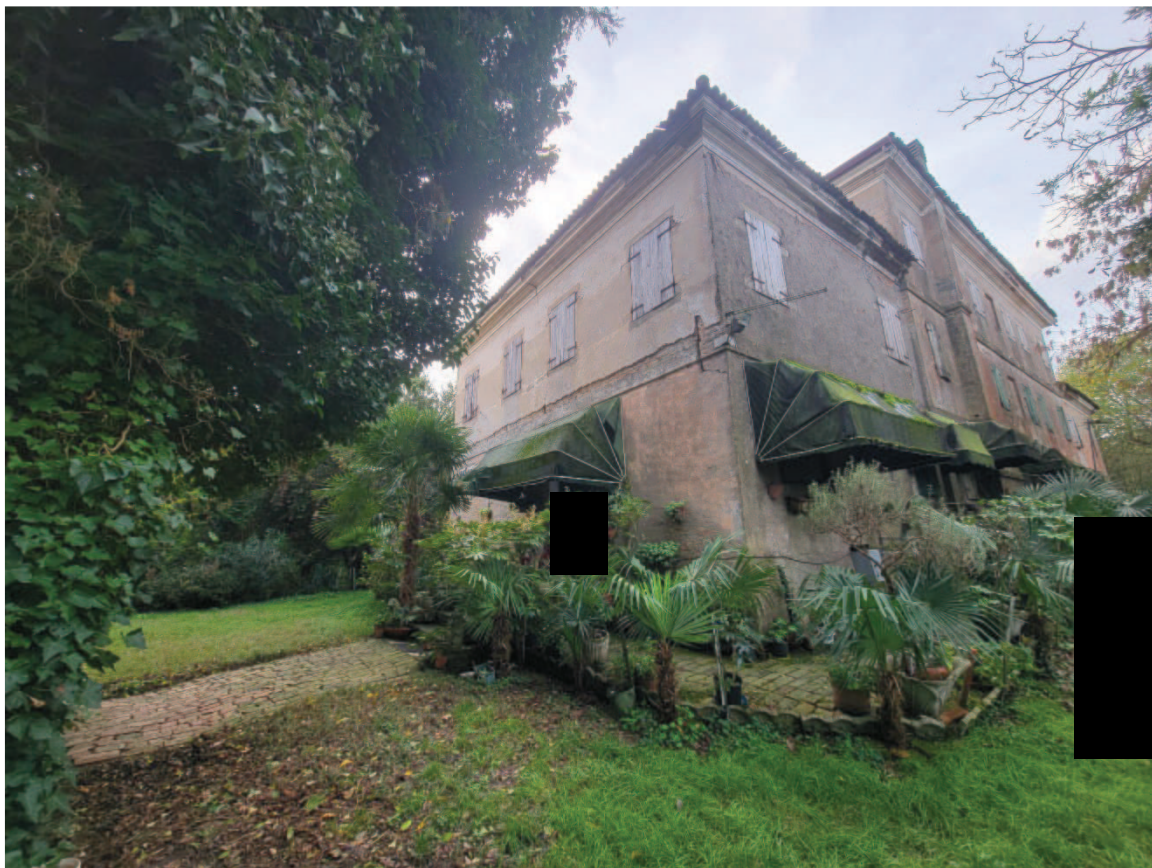
Figura 9 Veduta esterna lato Nord – Est