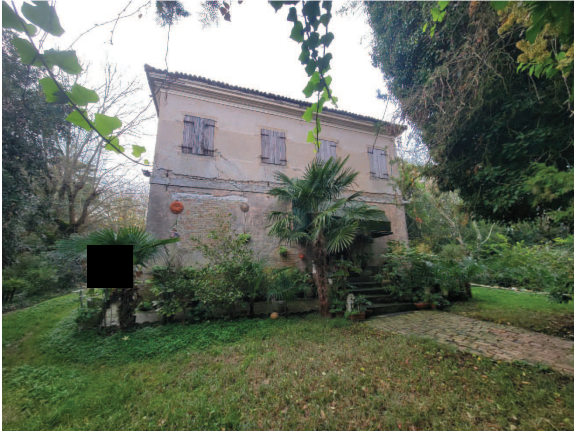
Figura 8 Veduta esterna lato Est