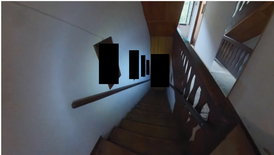
19 Interni mappale 91/1 corridoio p1 e scala