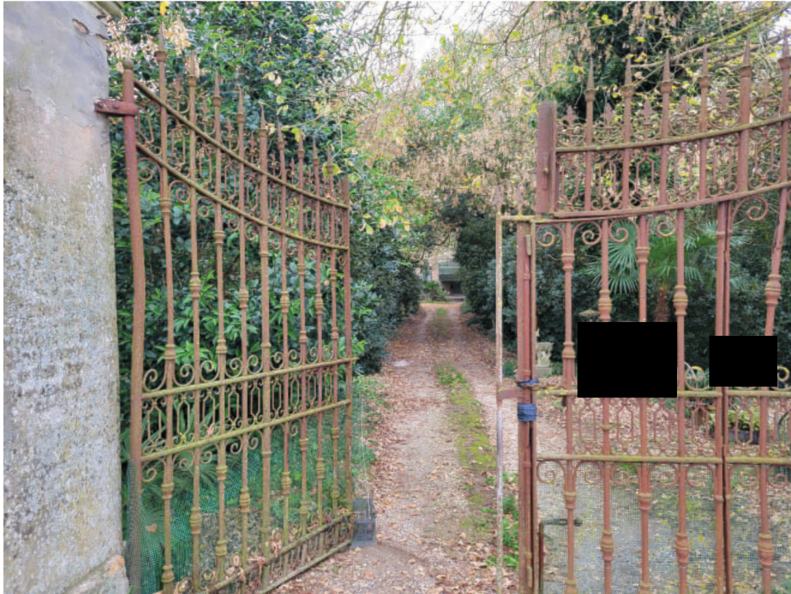
Figura 4 Particolare cancello l'ingresso