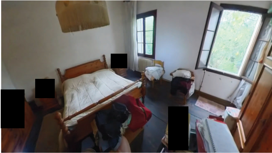
22 Interni mappale 91/1 p1 letto 2