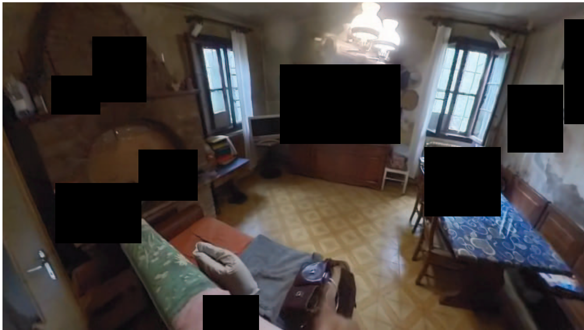
15 | Interni mappale 91/1 cucina pranzo