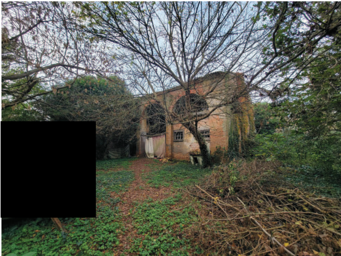
13 Pertinenza stalla fienile a mappale 91 sub 4