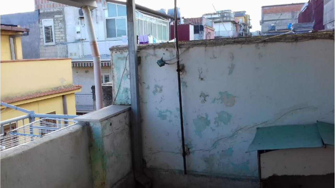
FOTO ESTERNA N. 4