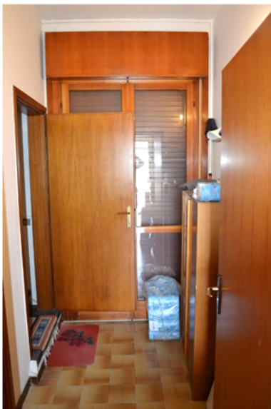
foto 9 - sub 7 (giro scala) - Disimpegno non pignorato; vi si imbocca la scala verso la taverna.