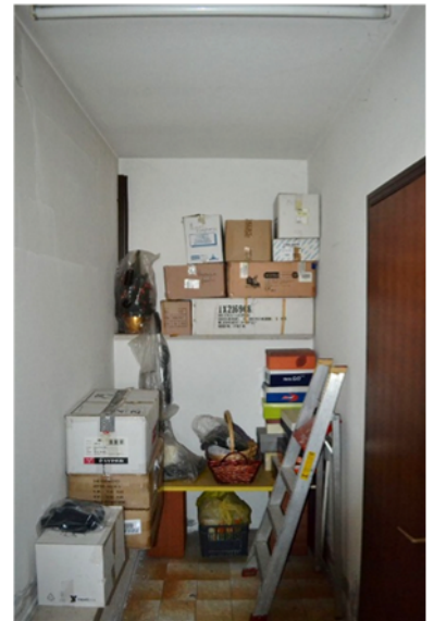
foto 14 - sub 4 (ripostiglio) - Gli accessori al seminterrato cominciano con un ripostiglio fronte servizi.