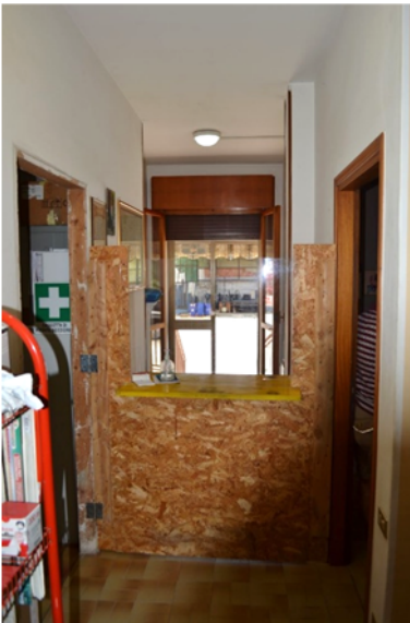
foto 13 - sub 1 (ingresso lato) - all'occorrenza la reception si può ribaltare con un banco girevole.