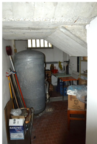
foto 24 - sub 4 (vano tecnico) - Ulteriore elemento di difformità rilevato è la presenza di un locale sottoscala, recante un accumulo idrosanitario.