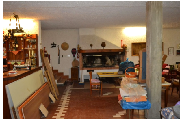
foto 21 - sub4 (taverna) - Un altro elemento architettonico assente dalle rappresentazioni grafiche è il caminetto a braciere in muratura davanti alla scala.