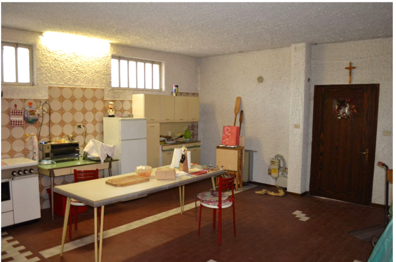
foto 19 – m.n. 93 sub 4 (taverna) – La superficie adiacente all'unica entrata diretta dall'esterno – ossia dal cavedio di cui alla foto esterna n. 6 – è attrezzata a cucina con forno e lavello. Il pilastro fuori spessore di muro, fianco porta, non risulta negli elaborati grafici agli atti.