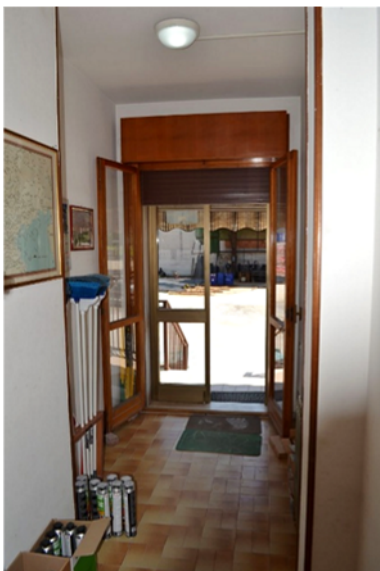
foto 12 - sub 1 (ingresso lato) - L'ingresso più frequentato dalla clientela è quello laterale.