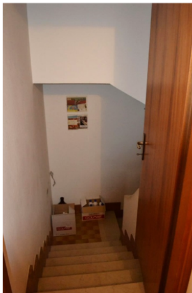
foto 10 - sub 7 (scala) - Solo la prima rampa di scale verso la taverna è attribuita al sub 7.