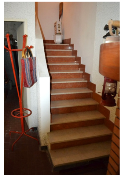
foto 11 - sub 4 (scala) - La gradinata sbarcante in taverna, invece, fa parte del sub 4.