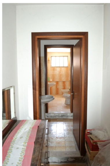
foto 15 - sub 4 (rip.) - I servizi si attestano su tre altezze utili.