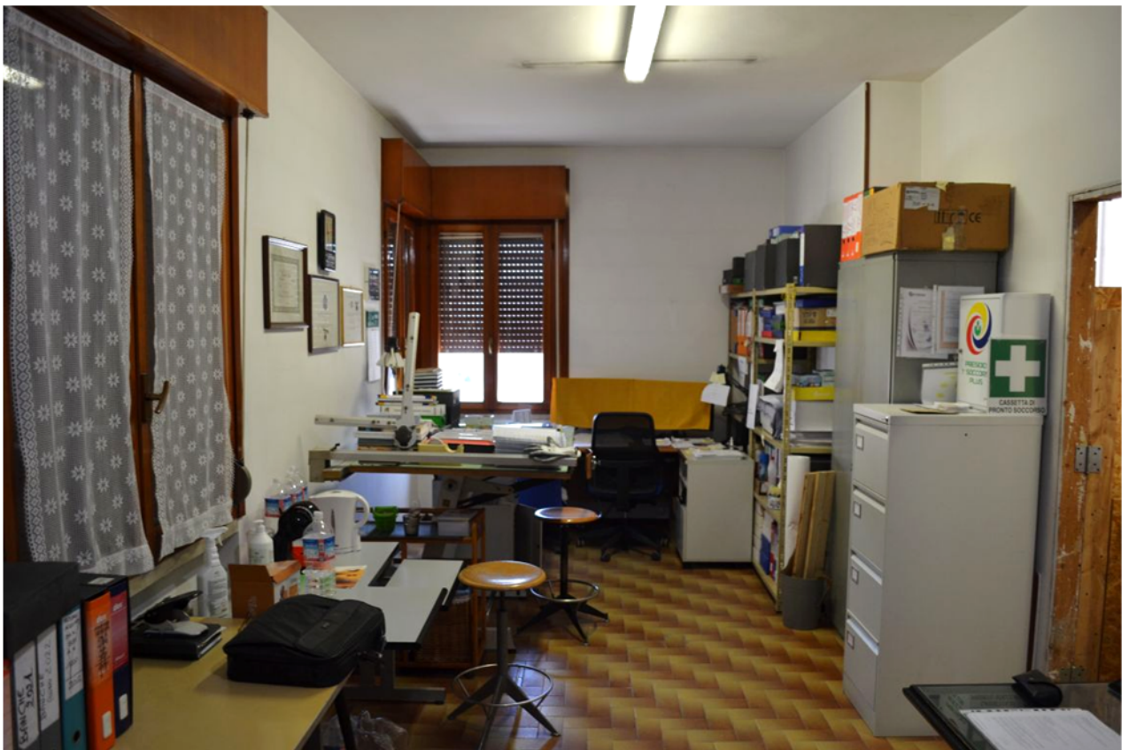
foto 6 - m.n. 93 sub 1 (ufficio 4) - Il più ampio dei vani a uso ufficio ha tre finestre e misura poco meno di ventisette metri quadri. A destra si vede il banco reception girevole di cui anche alla successiva foto n. 13.