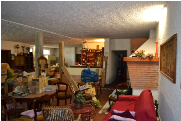
foto 20 - sub 4 (taverna) – Il seminterrato è in parte arredato a bar, con un bancone d'angolo in legno massiccio e piano di lavoro su pedana rialzata.