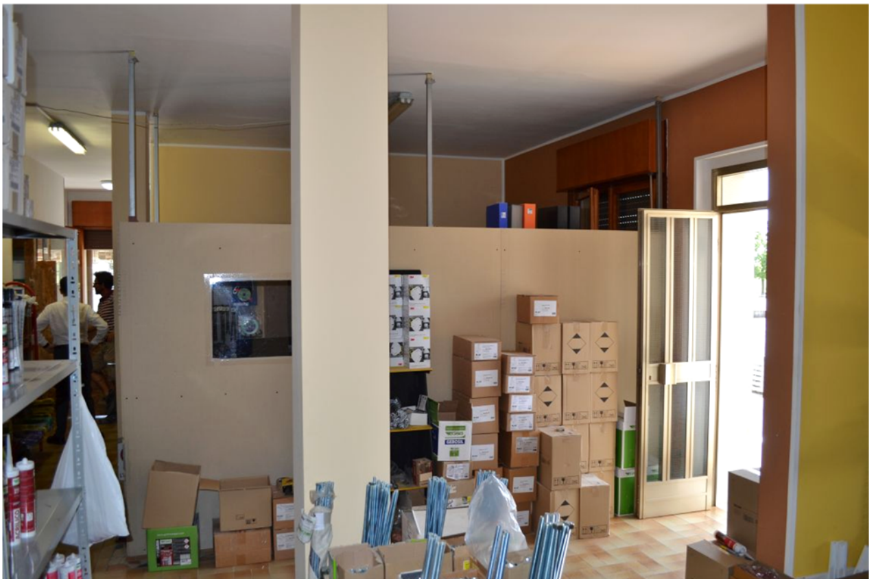
foto 2 – m.n. 93 sub 1 (negozio, ingresso-disbrigo) – La configurazione delle partizioni interne, nella parte di negozio compresa tra l'ingresso, la prima esposizione del negozio, l'ufficio n. 1 e il ripostiglio, si presenta difforme da quella deducibile in margine agli elaborati catastale e amministrativi, dove in luogo degli ultimi tre vani elencati si trova solo un unico ambiente denominato ufficio .