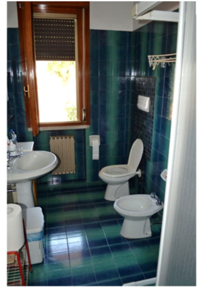
foto 5 - sub 1 (bagno) - Dotato di doccia, bidet, wc e lavandino.