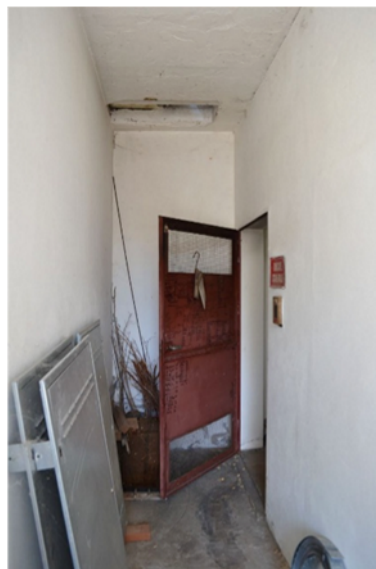
foto 25 - sub 4 (cavedio) - L'ingresso alla centrale termica è garantito da una porta in ferro cava stampato, con prese d'aria superiore e inferiore.