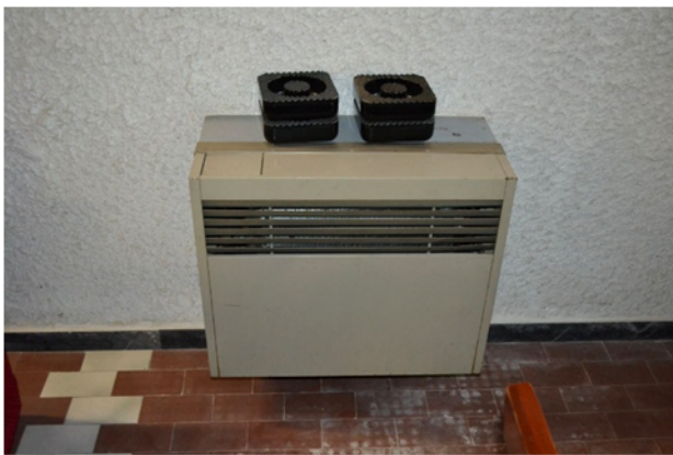
foto 22 - sub 4 (taverna) - A conferma del livello di finitura complessivo a servizio dei vani al seminterrato, si ha la climatizzazione invernale, garantita da vecchi ventilcoventtori.