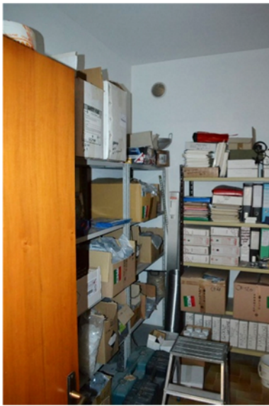
foto 3 - sub 1 (ripostiglio) - Questo è un locale assente in atti.