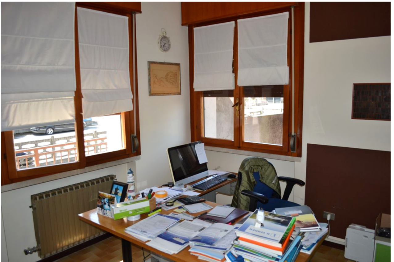
foto 1 – m.n. 93 sub 1 (ufficio 1) – L'unità attestata al piano rialzato dell'edificio fronte strada, accessibile dalla pubblica via durante i consueti orari di apertura di un esercizio aperto alla clientela, al primo e al secondo accesso risultava condotta dalla [REDACTED]. La stessa persona giuridica, dal Gennaio 2020, è locatrice dell'ente urbano m.n. 428. Il negozio costituisce la sede amministrativa dell'attività commerciale, che consiste in un magazzino edile con servizi di assistenza tecnica integrata.