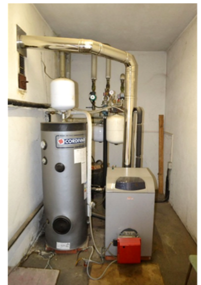
foto 26 - sub 4 (C.T.) - Il generatore di calore, centralizzato, è una caldaia a bruciatore Ferroli modello ATLAS D 50, con fuoco Riello mod. GULLIVER RG1NR.