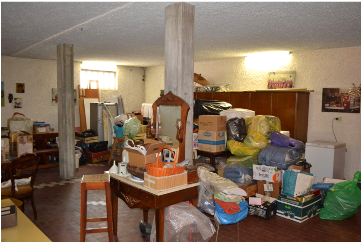
foto 18 – m.n. 93 sub 4 (taverna) – Il principale dei vani abitabili al seminterrato ha tre pilastri interni in cemento armato, pavimenti in cotto e pareti d'ambito con intonaco picchiettato tintegeggiato di bianco, oltre a finestre apribili a wasistas verso l'immediato piano di campagna esterno. Benché catastalmente allibrato come cantina , l'ampio locale (quasi 118 m 2 contando anche la cucina di cui alla foto successiva), per livello di finiture e dotazioni, ha rango di spazio abitabile e non accessorio, se non in ridotta parte (i servizi).