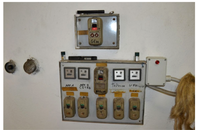
foto 23 - sub 4 (centrale termica) - Il quadro elettrico di centrale è dotato di interruttori obsoleti, di valore caratteristico i_{\Delta n} e/o curve d'intervento non meglio specificati.