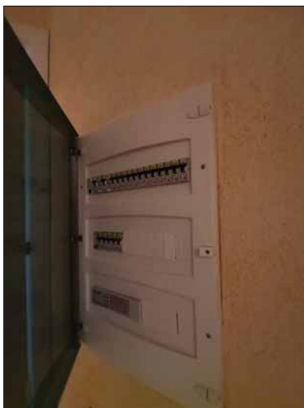
FOTO 12 - Quadro elettrico.