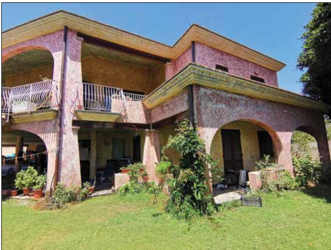
FOTO 4 - Vista dal cortile.