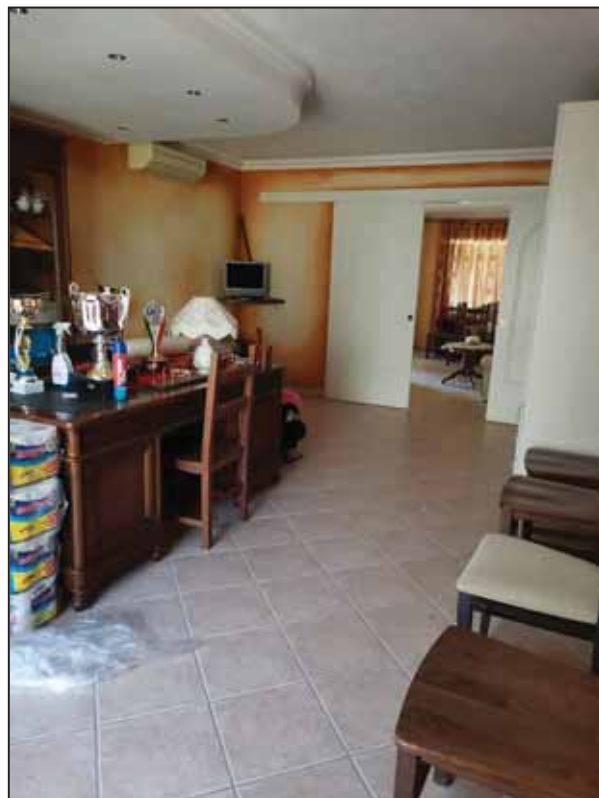
FOTO 26 - Piano terra - Ufficio.