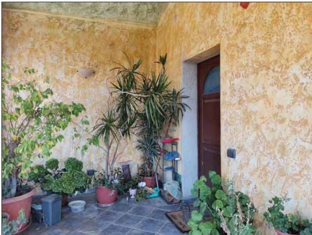
FOTO 32 - Piano primo - Porticato 2.