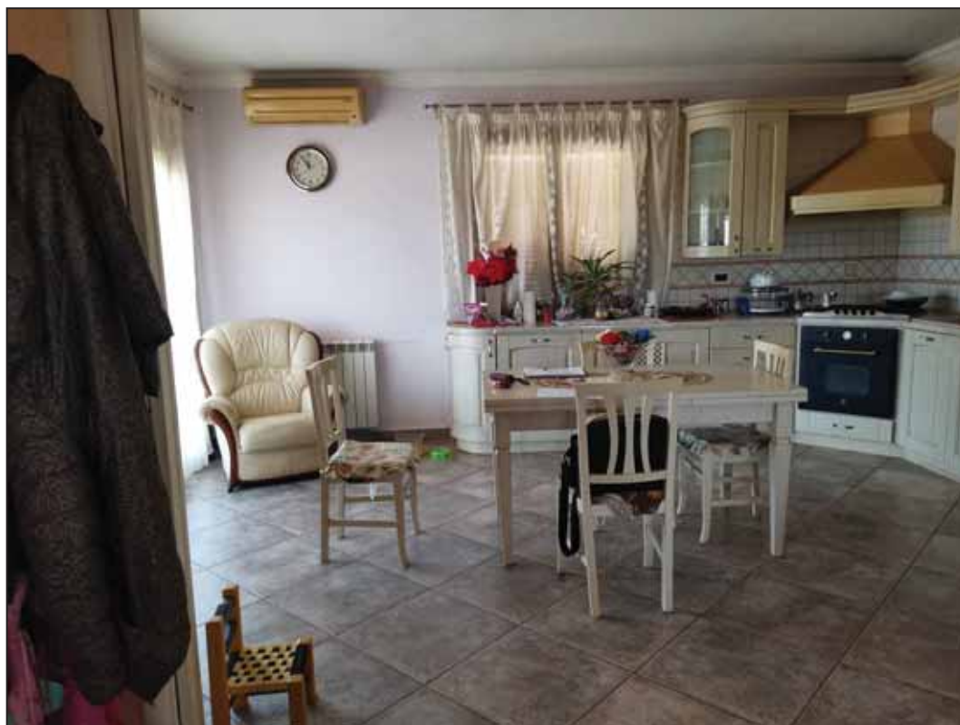
FOTO 38 - Piano primo - Cucina.