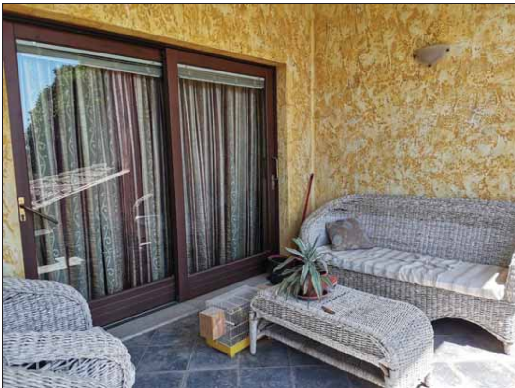
FOTO 34 - Piano primo - Porticato 2.