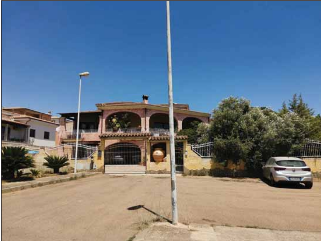
FOTO 1 - Vista da Via Ariosto.