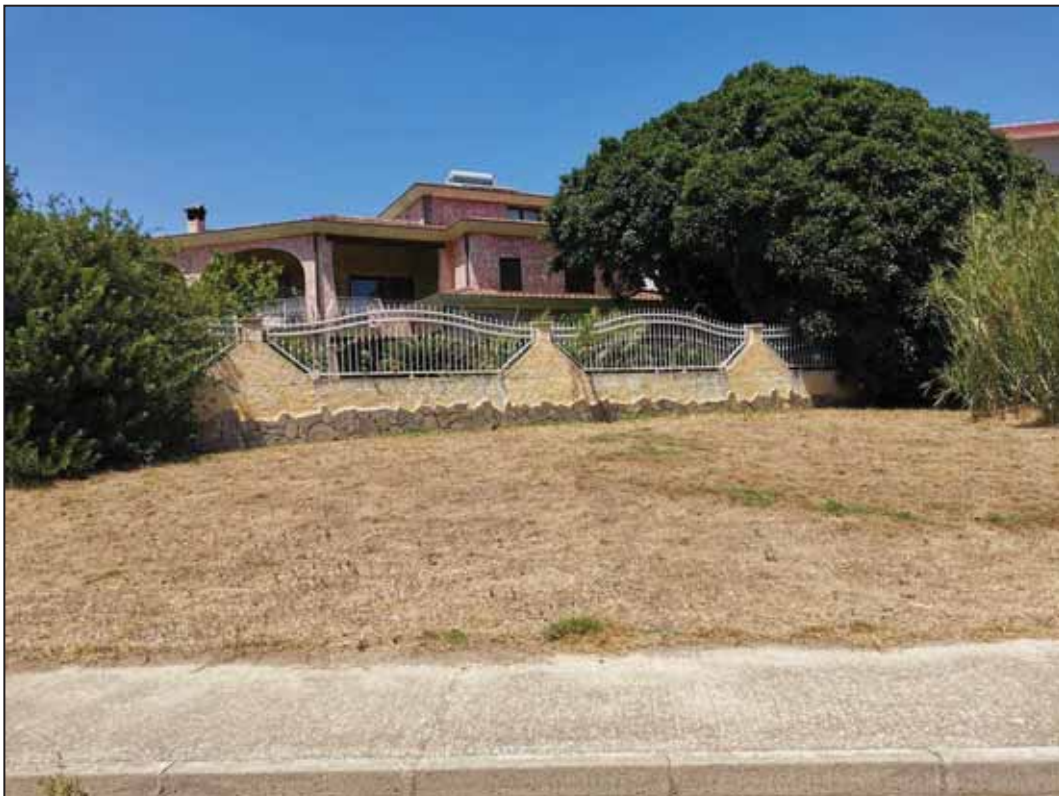
FOTO 2 - Vista da Via Ariosto.