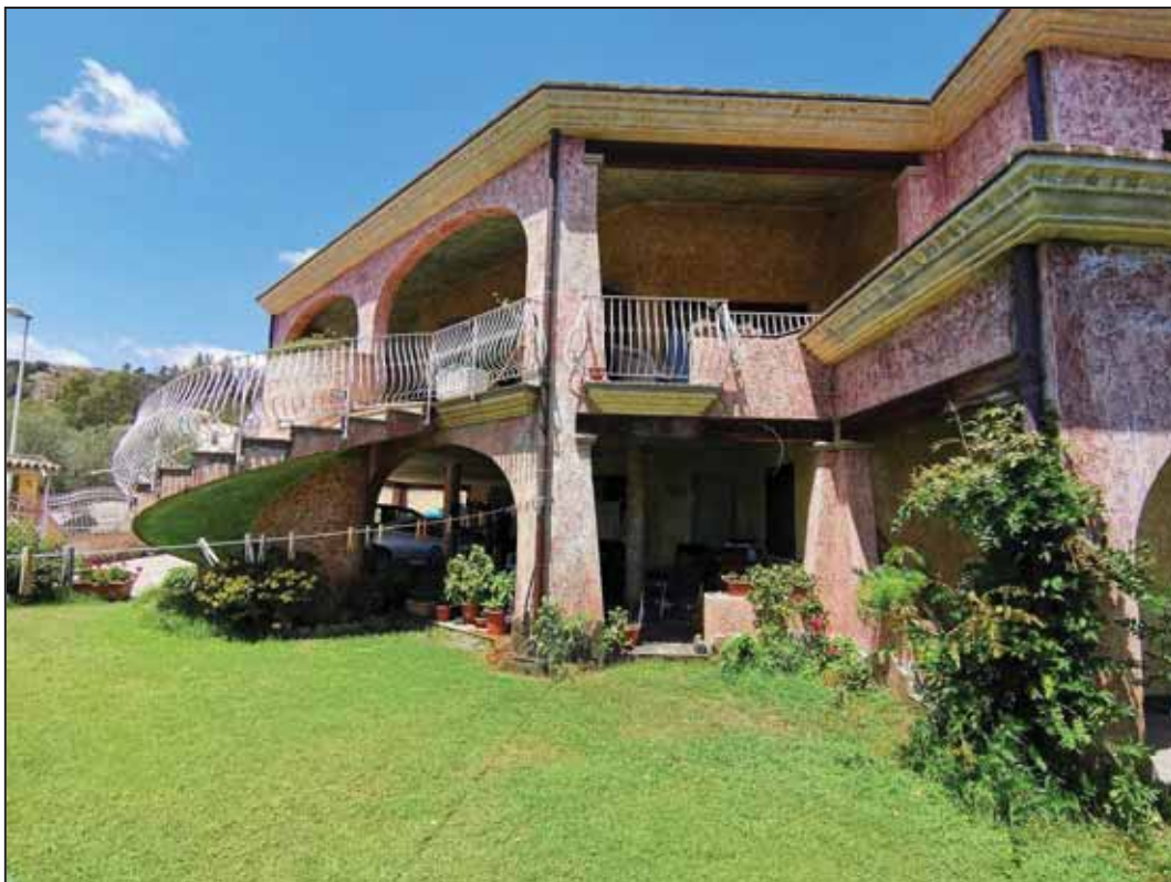
FOTO 3 - Vista dal cortile.