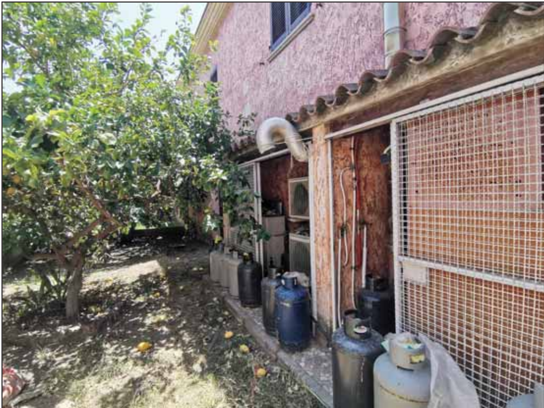
FOTO 5 - Piano Terra - Vista dal cortile.