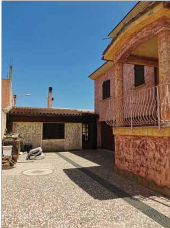
FOTO 7 - Vista dal cortile.