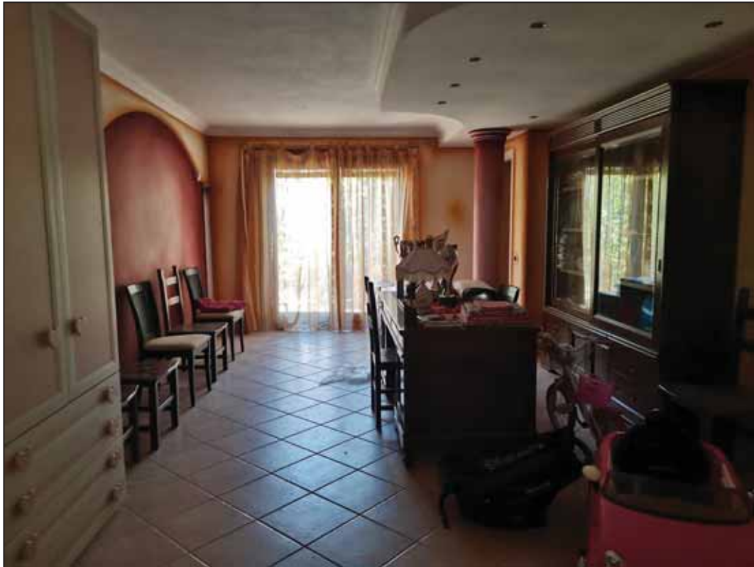
FOTO 25 - Piano terra - Ufficio.