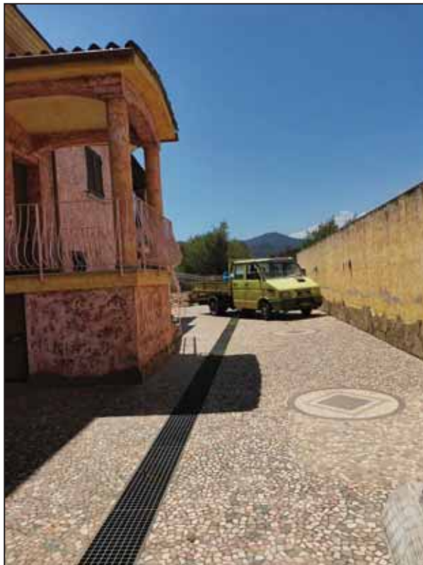
FOTO 8 - Vista dal cortile.