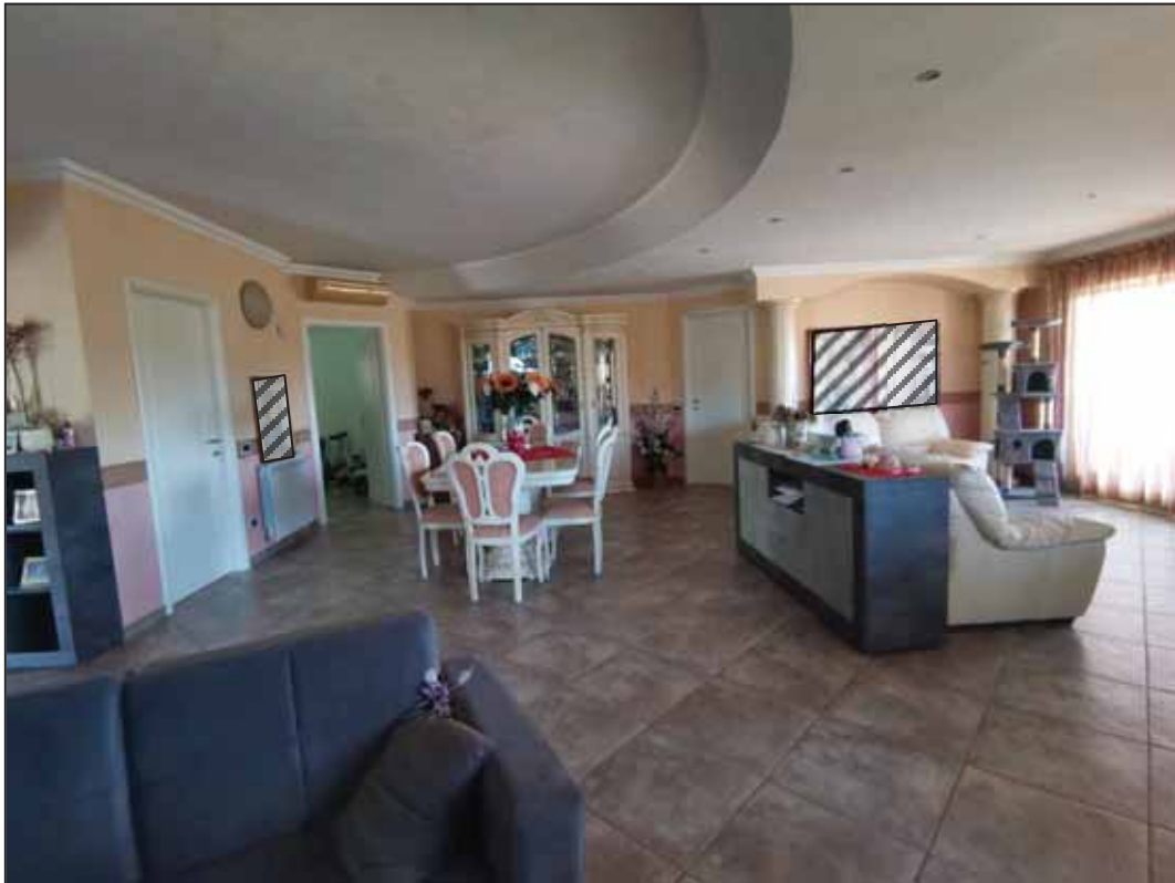
FOTO 35 - Piano primo - Soggiorno.