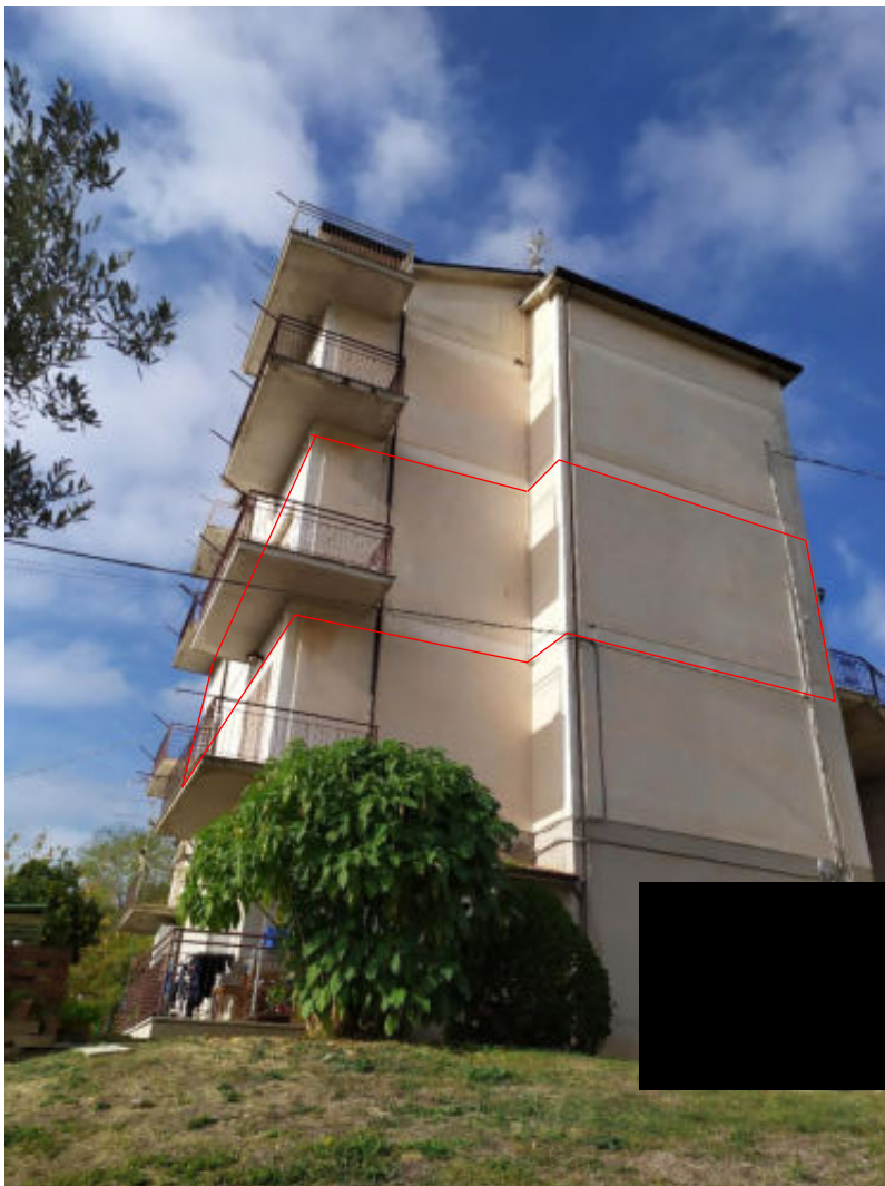
Foto 2 – Vista facciata est dell’edificio – Ingresso al Piano Terra da strada comunale