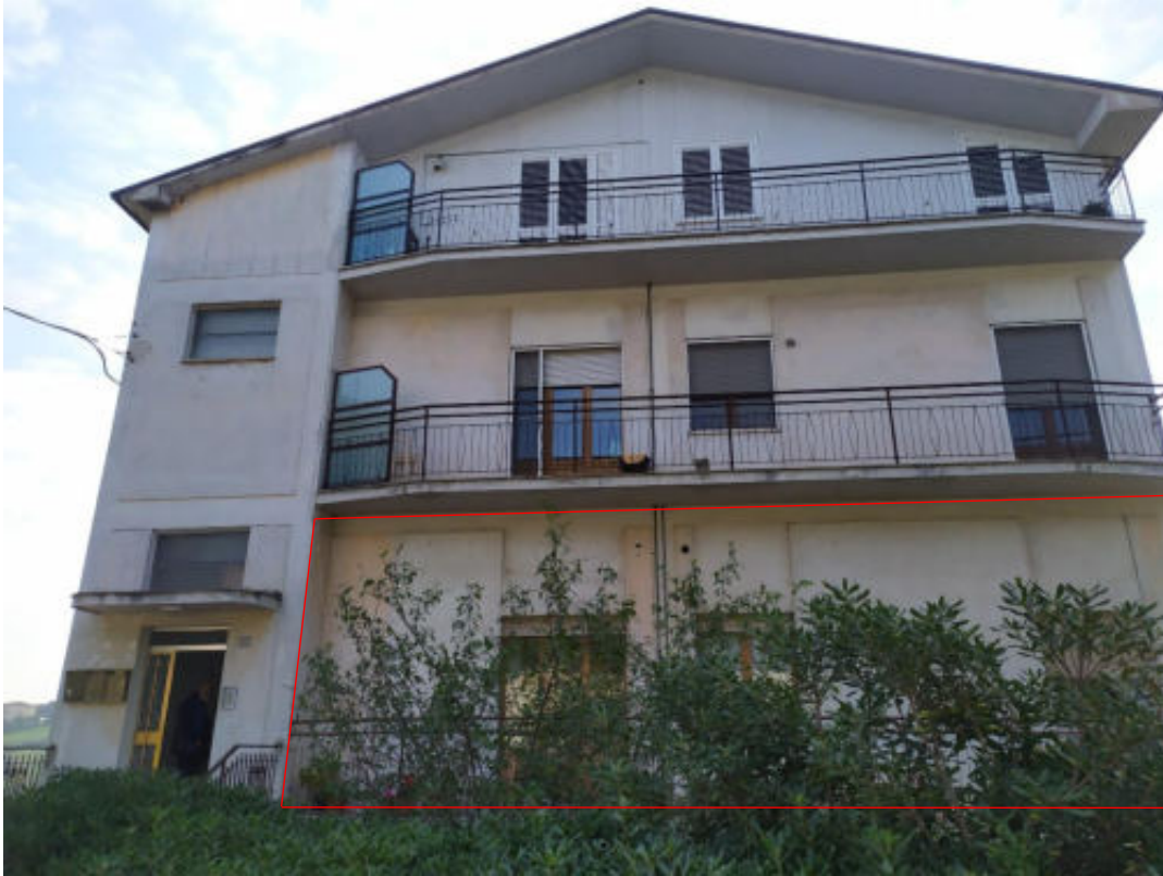
Foto 1 – Vista facciata nord dell’edificio – ingresso da strada provinciale Fermana