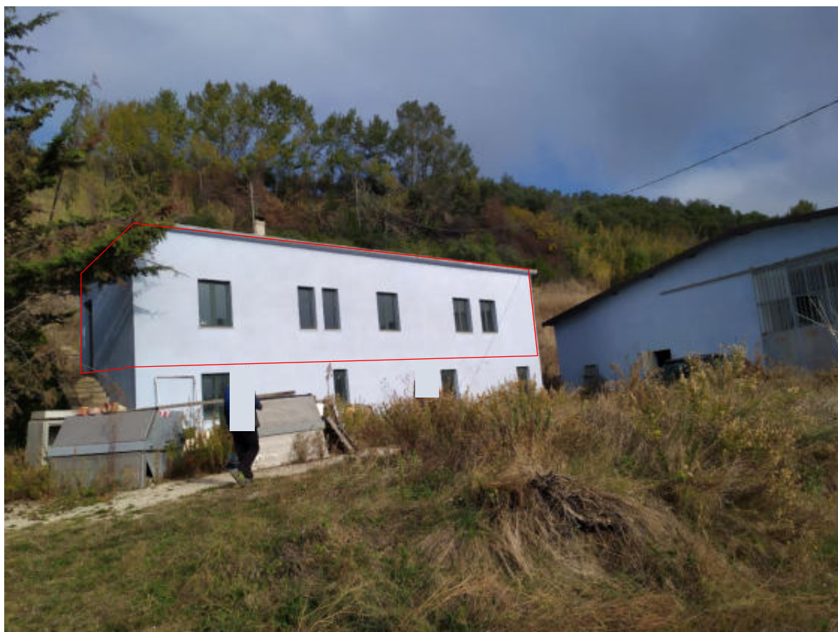
Foto 2 – Vista sud ovest edificio abitazione al PT (uffici al PT lotto n° 2)