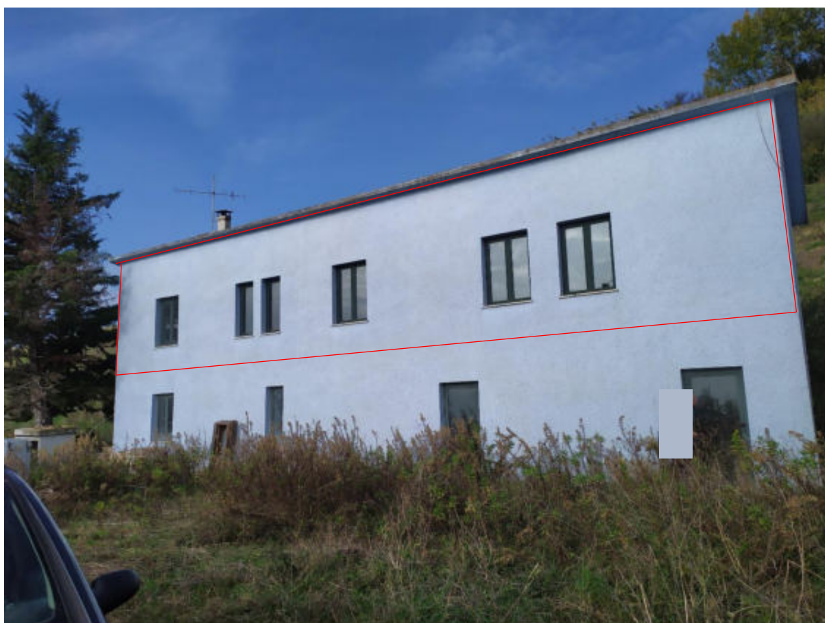
Foto 4 – Vista edificio appartamento al P1 (uffici al PT lotto n° 2) – Facciata sud