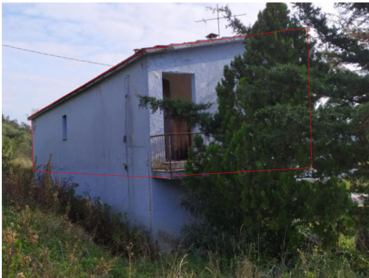
Foto 3 – Vista angolo nord ovest edificio appartamento al PT - Ingresso