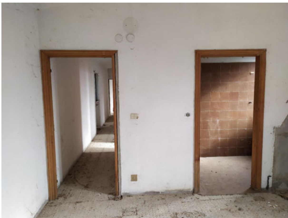
Foto 6 – Vista dall’ingresso-soggiorno-pranzo verso accesso cucinino (Dx) e corridoio (Sx)