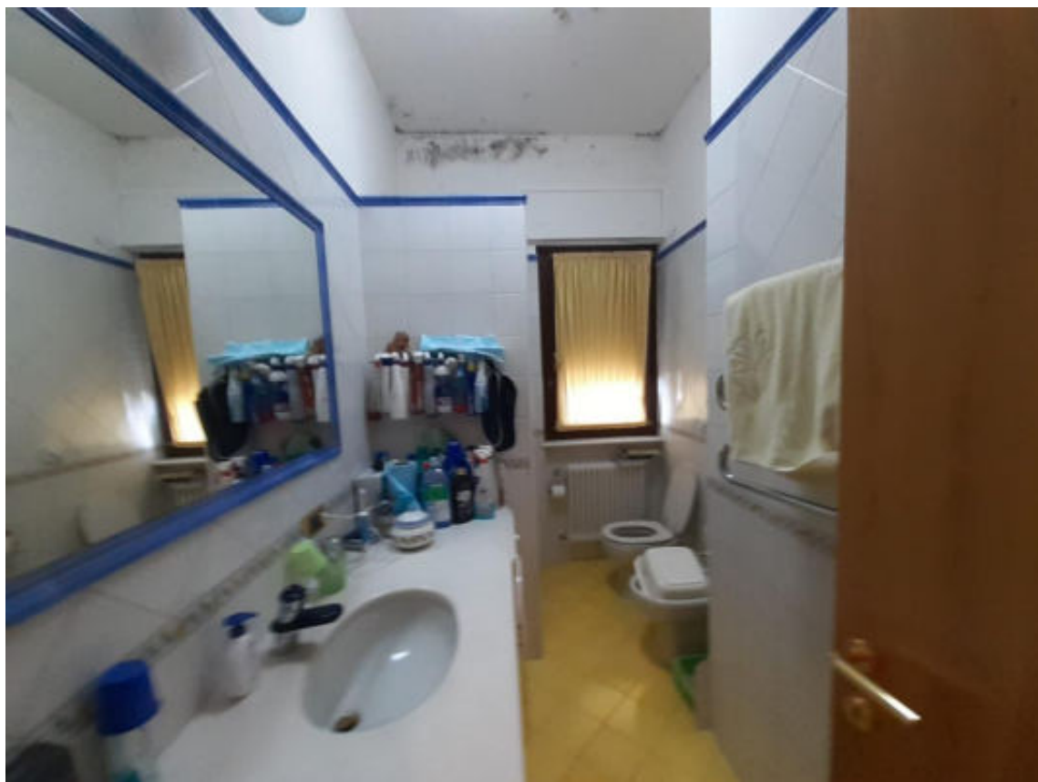
Foto 9 – Vista del bagno ovest con evidenti tracce di umidità da condensa