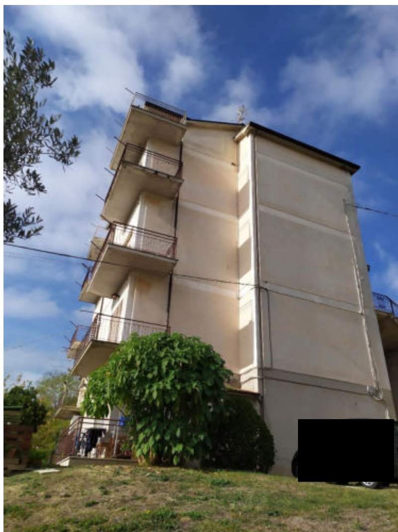
Foto 2 – Vista facciata est dell'edificio – Ingresso al Piano Terra da strada comunale