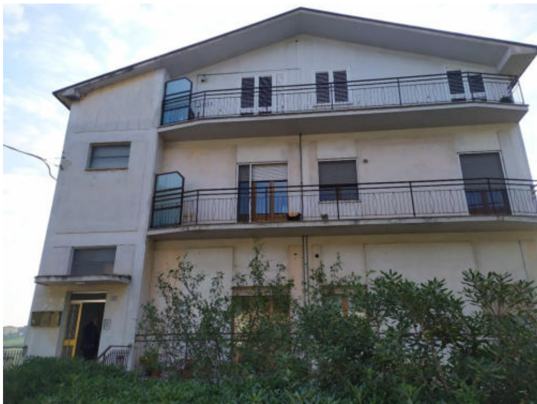
Foto 1 – Vista facciata nord dell'edificio – ingresso da strada provinciale Fermana