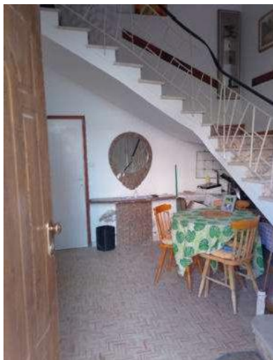
Foto 52 e 53 : Ingresso con scale per accesso al sub. 6 - Soggiorno