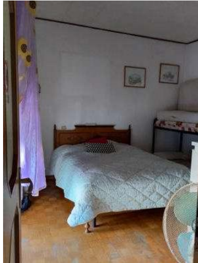
Foto 46 e 47: Sala da pranzo ad uso camera e balcone fronte fabbricato