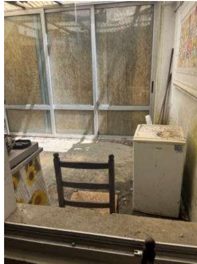
Foto 61 e 62: Corte sul retro – Tettoia precaria legno/pvc e tamponatura con infisso scorrevole legno/alluminio non legittimate