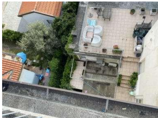
Foto 66 e 67: Copertura non accessibile dello studio utilizzata impropriamente come “terrazza”