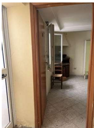
Foto 59 e 60: Ambienti e wc ricreati all'interno della tavernetta