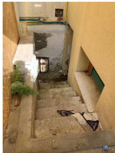
Foto 36, 37 e 38: Locali cantine con ingombranti e infiltrazioni - Scala di accesso in colleg. con sub. 5 – corpo A