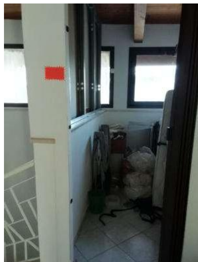
Foto 26 e 27: Porzione Vano scale e incremento volumetrico P4-Non legittimato