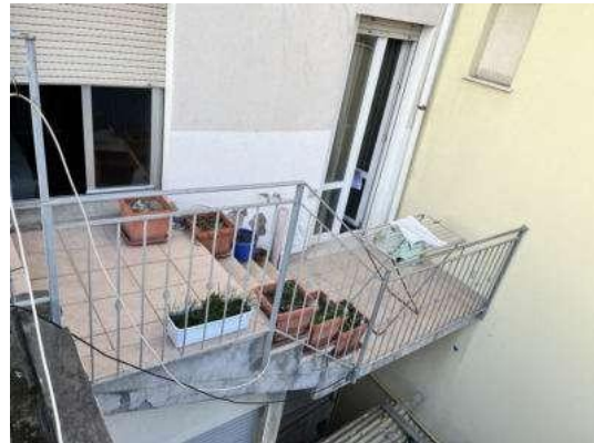
Foto 48 e 49: Camera 2 ad uso cucina con porta finestra e balcone non legittimato per collegamento a terrazza (Sub. 7)