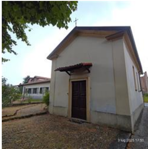
Oratorio di S.Vincenzo