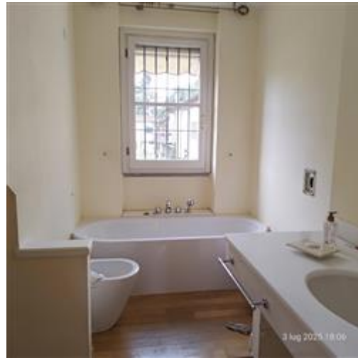
bagno Piano 1