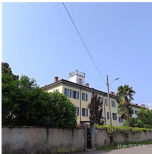
Villa ex Buttafava

I beni sono ubicati in zona fuori dal centro abitato in un'area residenziale, le zone limitrofe si trovano in un'area agricola. Il traffico nella zona è locale, i parcheggi sono sufficienti. Sono inoltre presenti i servizi di urbanizzazione primaria e secondaria, le seguenti attrazioni storico paesaggistiche: Villa Buttafava oratorio di San Vincenzo.