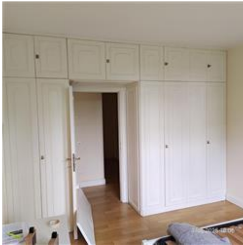
camera Piano 1