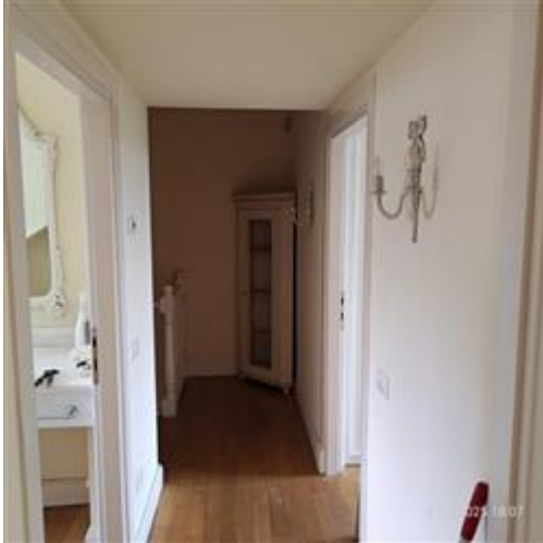
disimpegno Piano 1