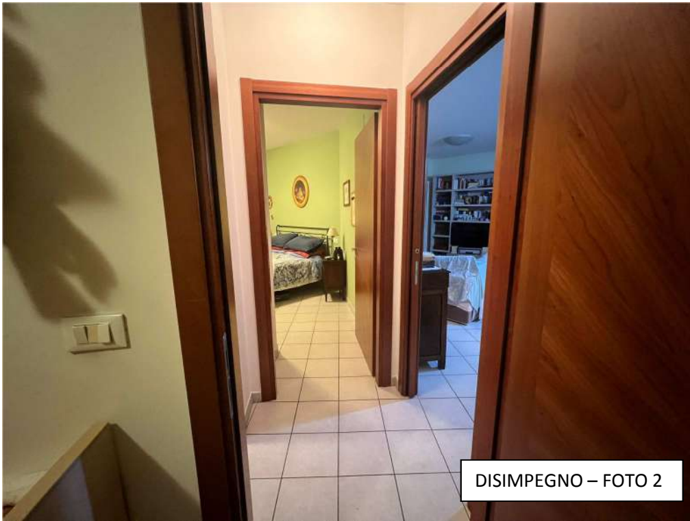
DISIMPEGNO – FOTO 2