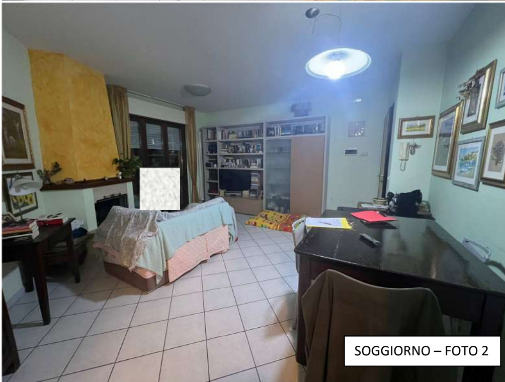
SOGGIORNO – FOTO 2