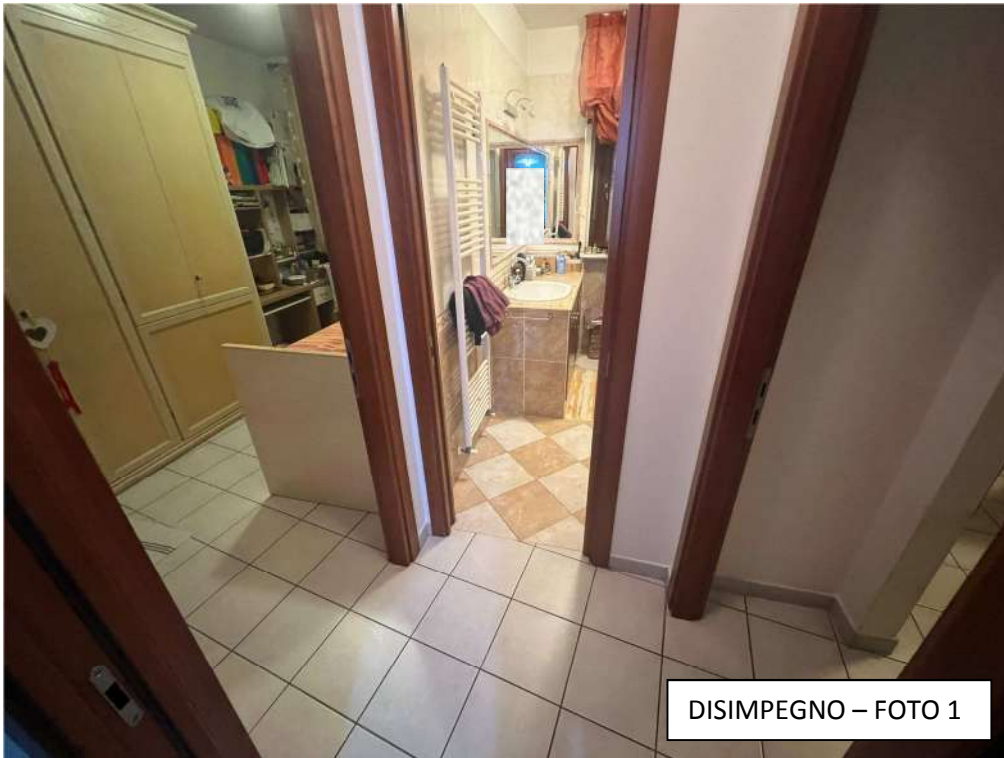
DISIMPEGNO – FOTO 1