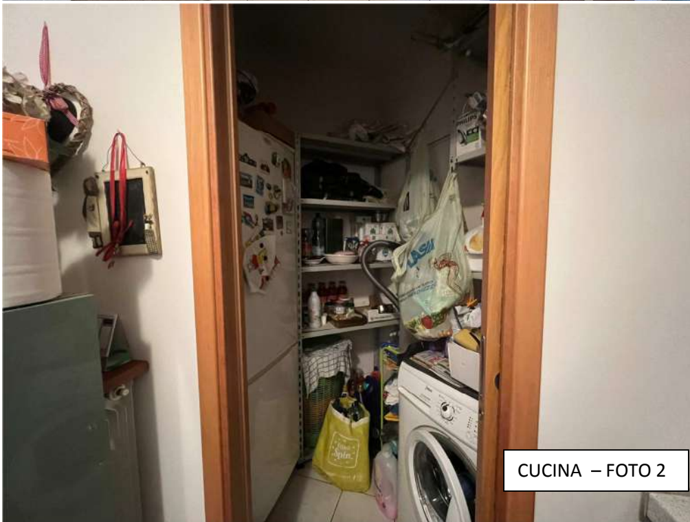
CUCINA – FOTO 2