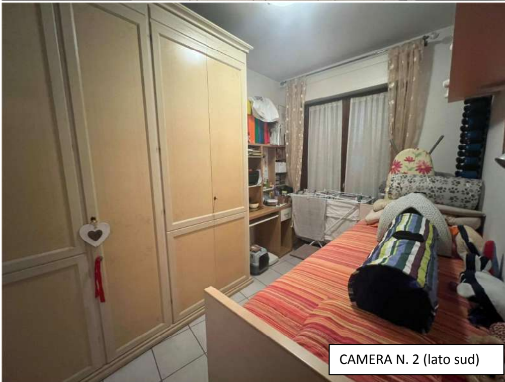
CAMERA N. 2 (lato sud)