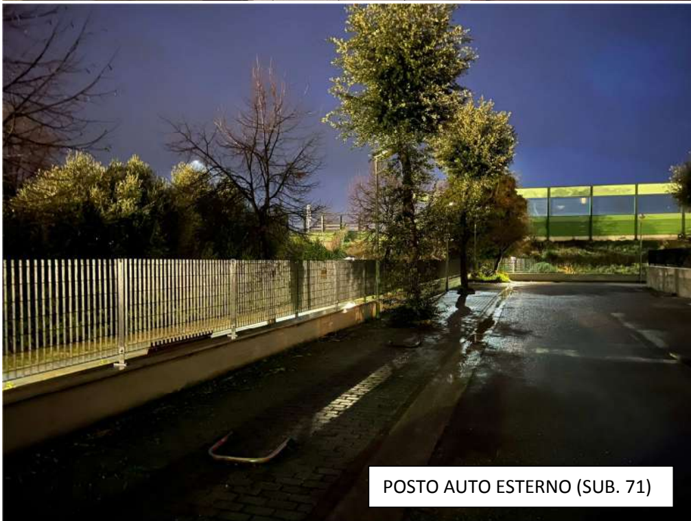
POSTO AUTO ESTERNO (SUB. 71)