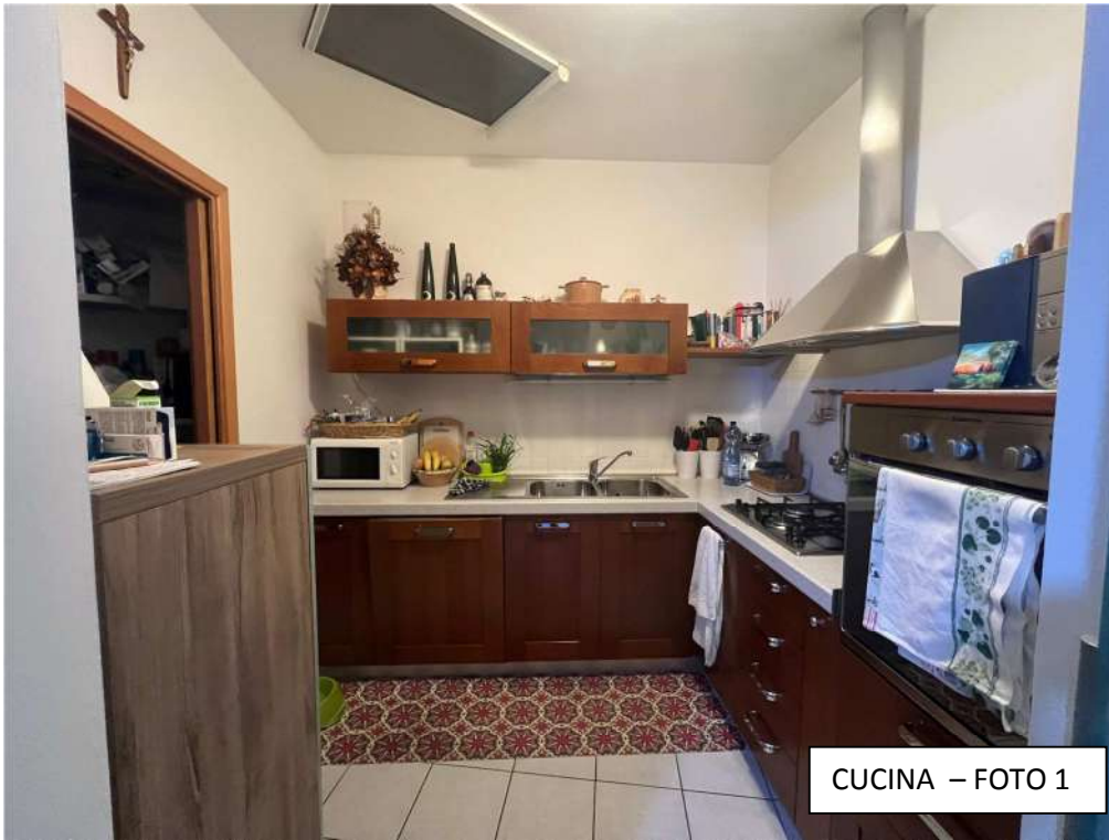
CUCINA – FOTO 1