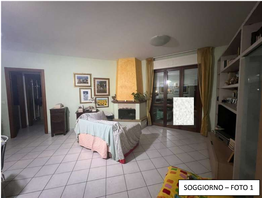
SOGGIORNO – FOTO 1