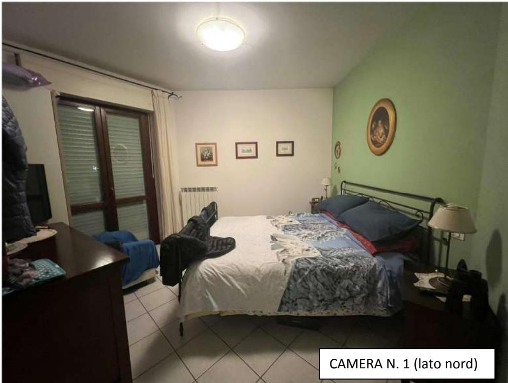
CAMERA N. 1 (lato nord)