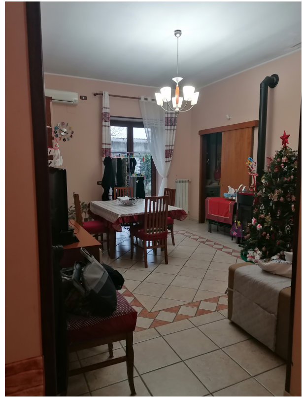
FOTO 6 - 7 - cucina e sala pranzo