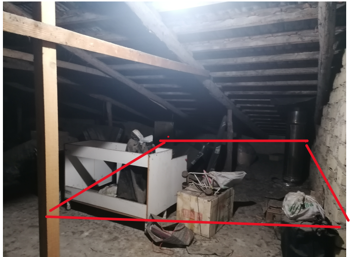
FOTO 10 -11 – porzione di cortile ( sub. 7 ) – porzione di sottotetto (sub. 4)