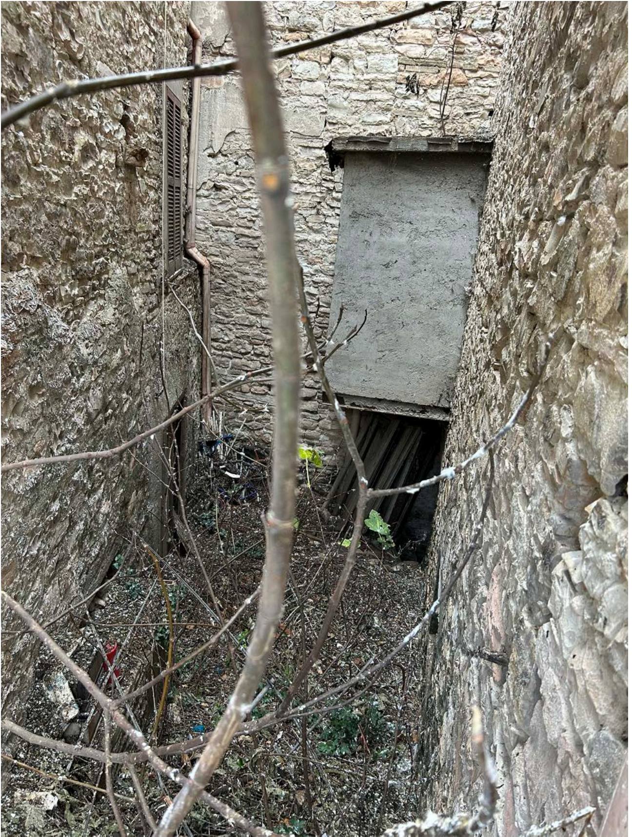
ACCESSO PIANO SEMINTERRATO