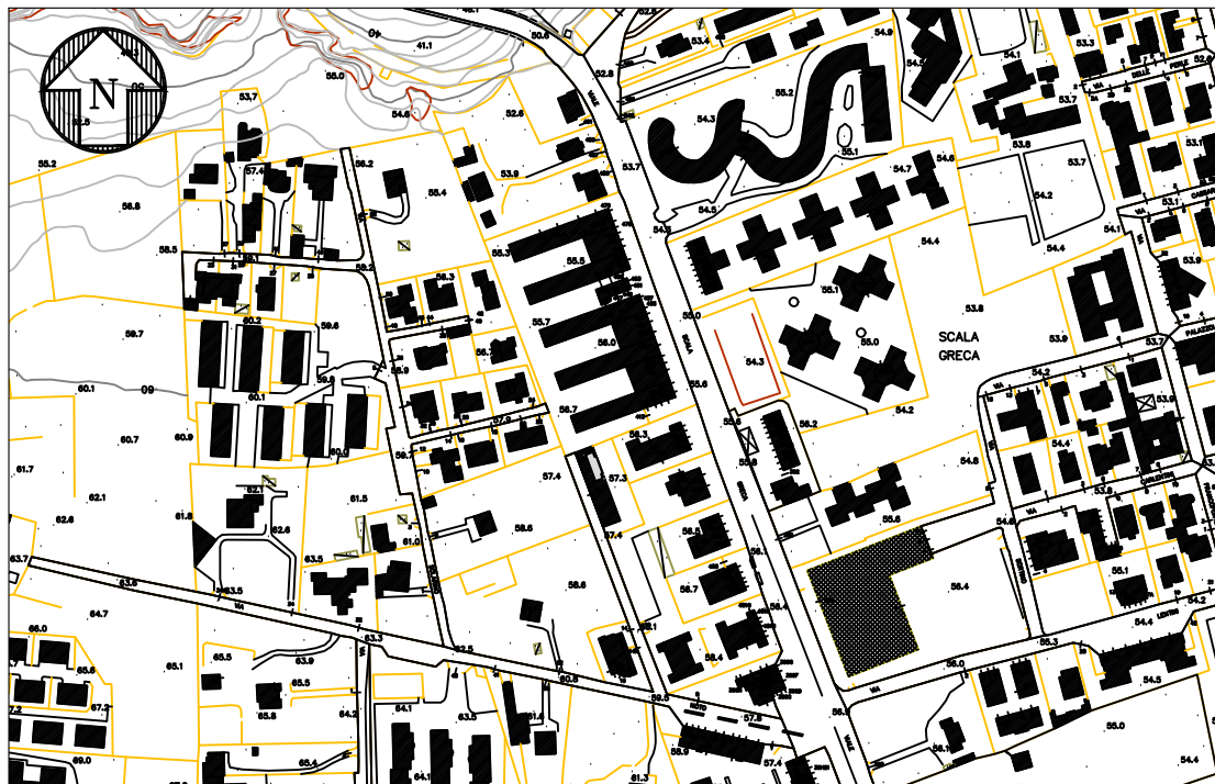
STRALCIO AEROFOTOGRAMMETRICO - 1:5.000