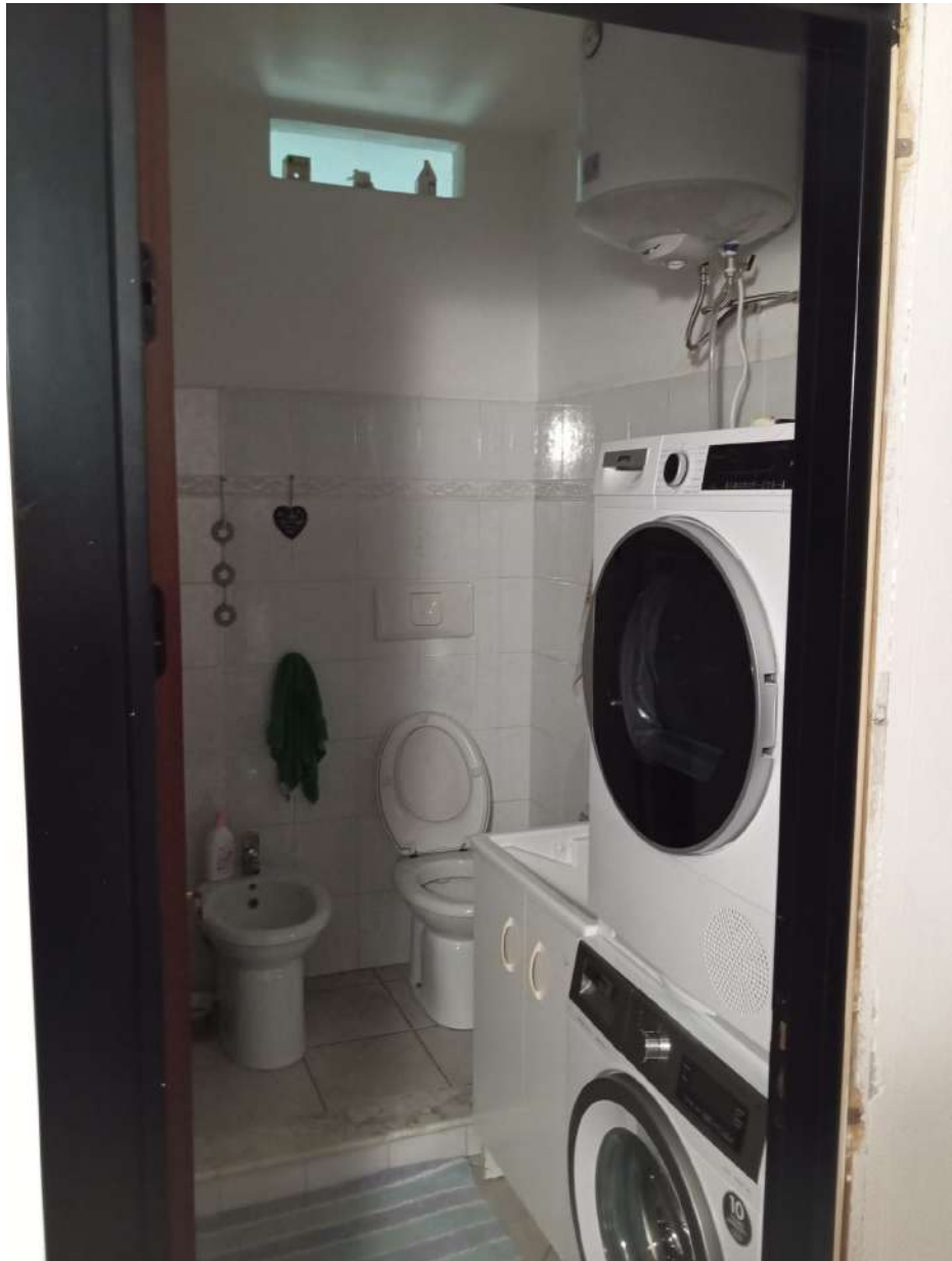
BAGNO DI SERVIZIO E ZONA LAVANDERIA