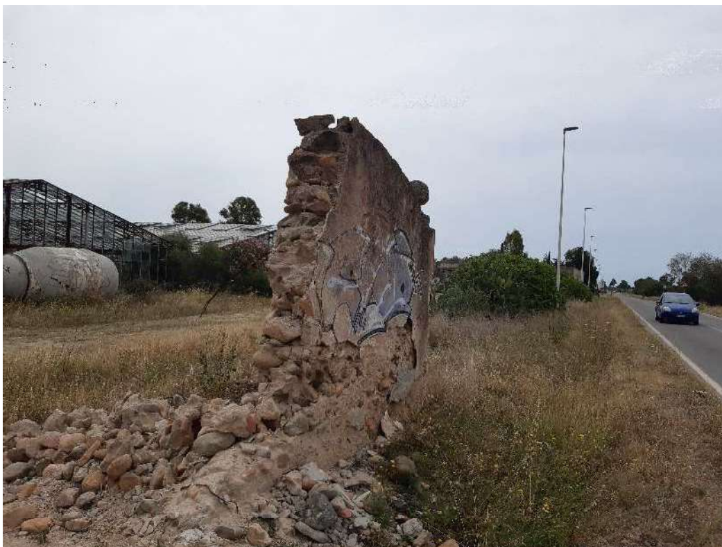
Foto 35 – mappale 689 (confine con via dell’Autonomia Regionale Sarda