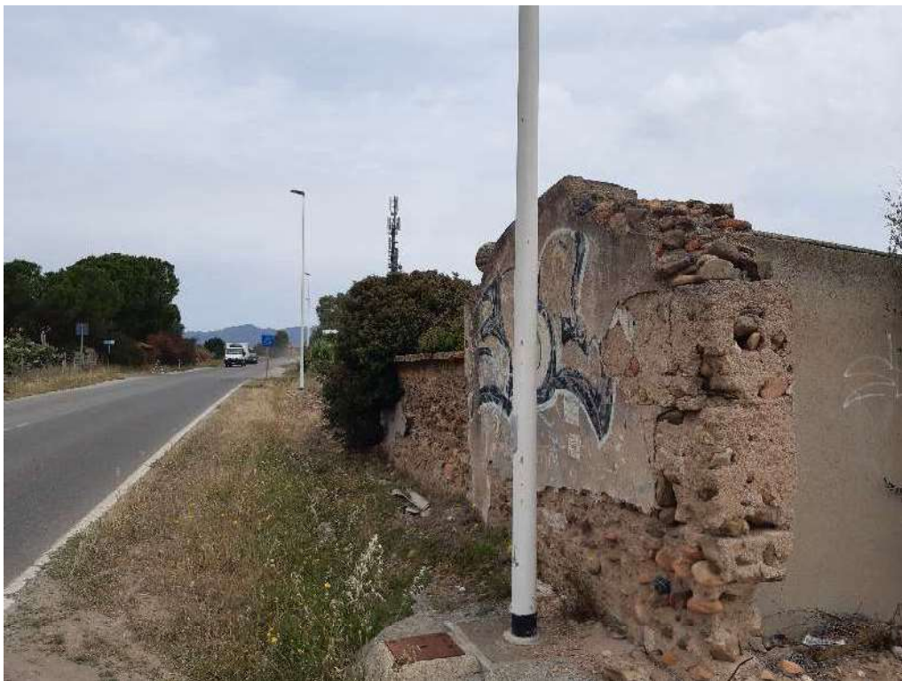
Foto 34 – mappale 689 (confine con via dell'Autonomia Regionale Sarda)