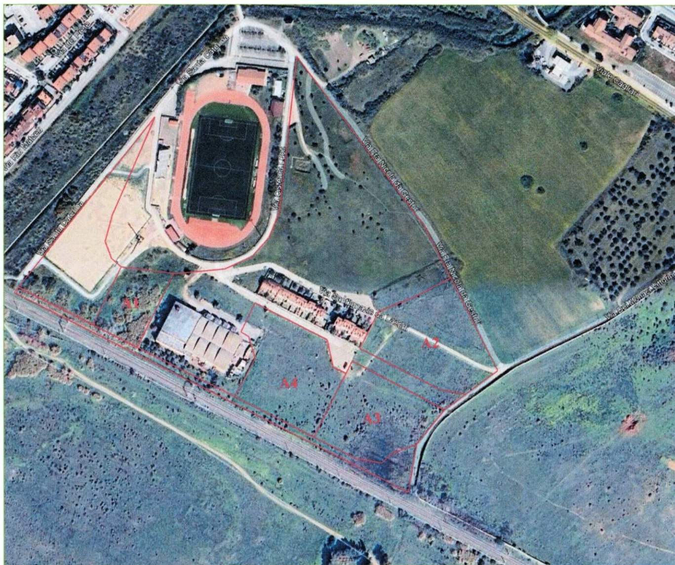
Foto n° 1: Vista aerea degli immobili e del Comparto G1.13 cui appartengono

La presente immagine, con indicazione del perimetro corretto dell'Immobile A4, sostituisce la Foto n° 2 presente nell'Allegato fotografico della perizia precedentemente depositata.