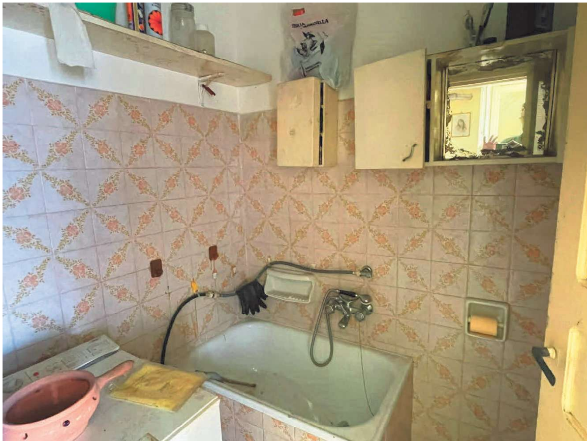
BAGNO PIANO PRIMO