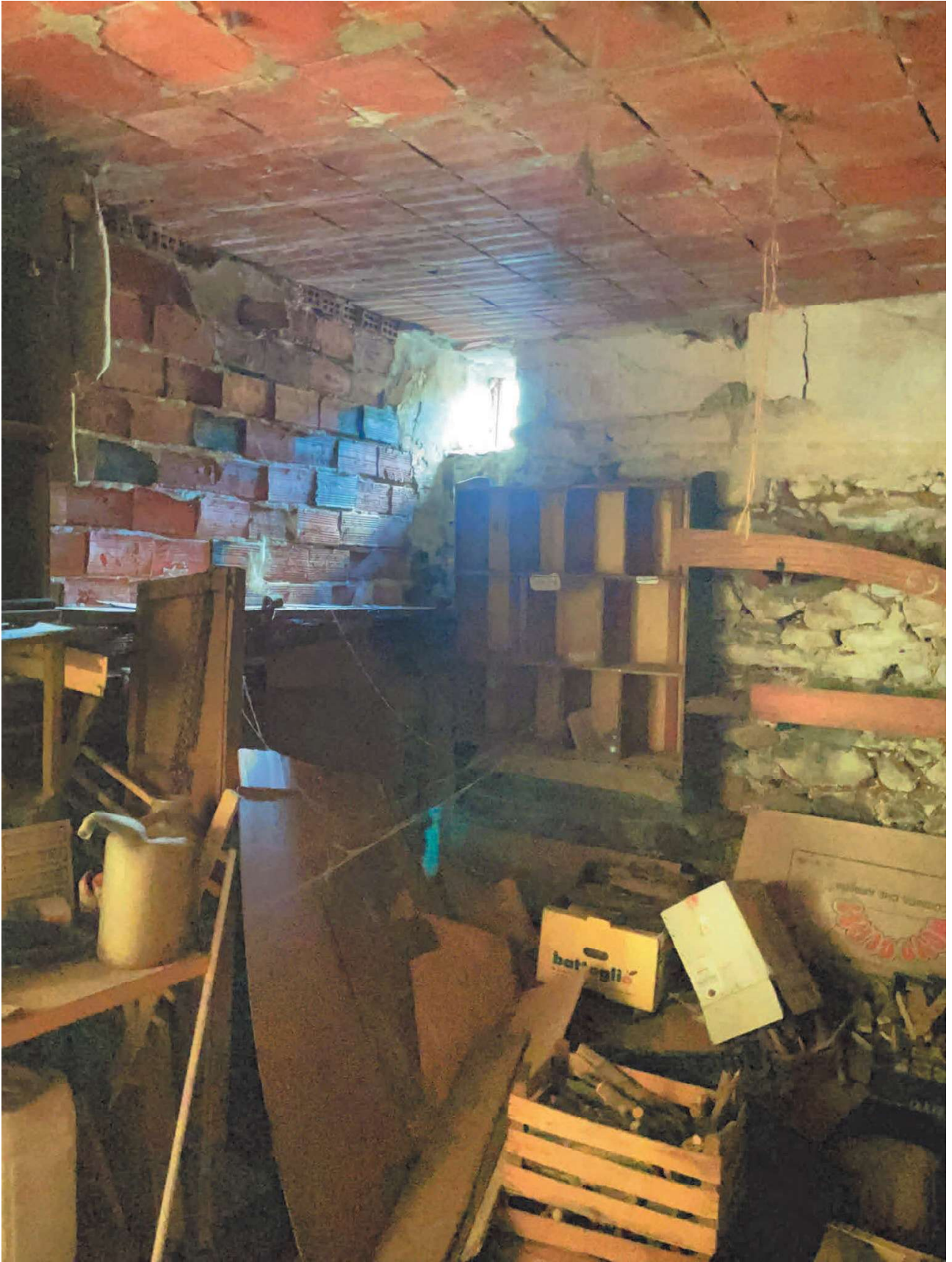
VANO DEPOSITO N.2 PIANO TERRA