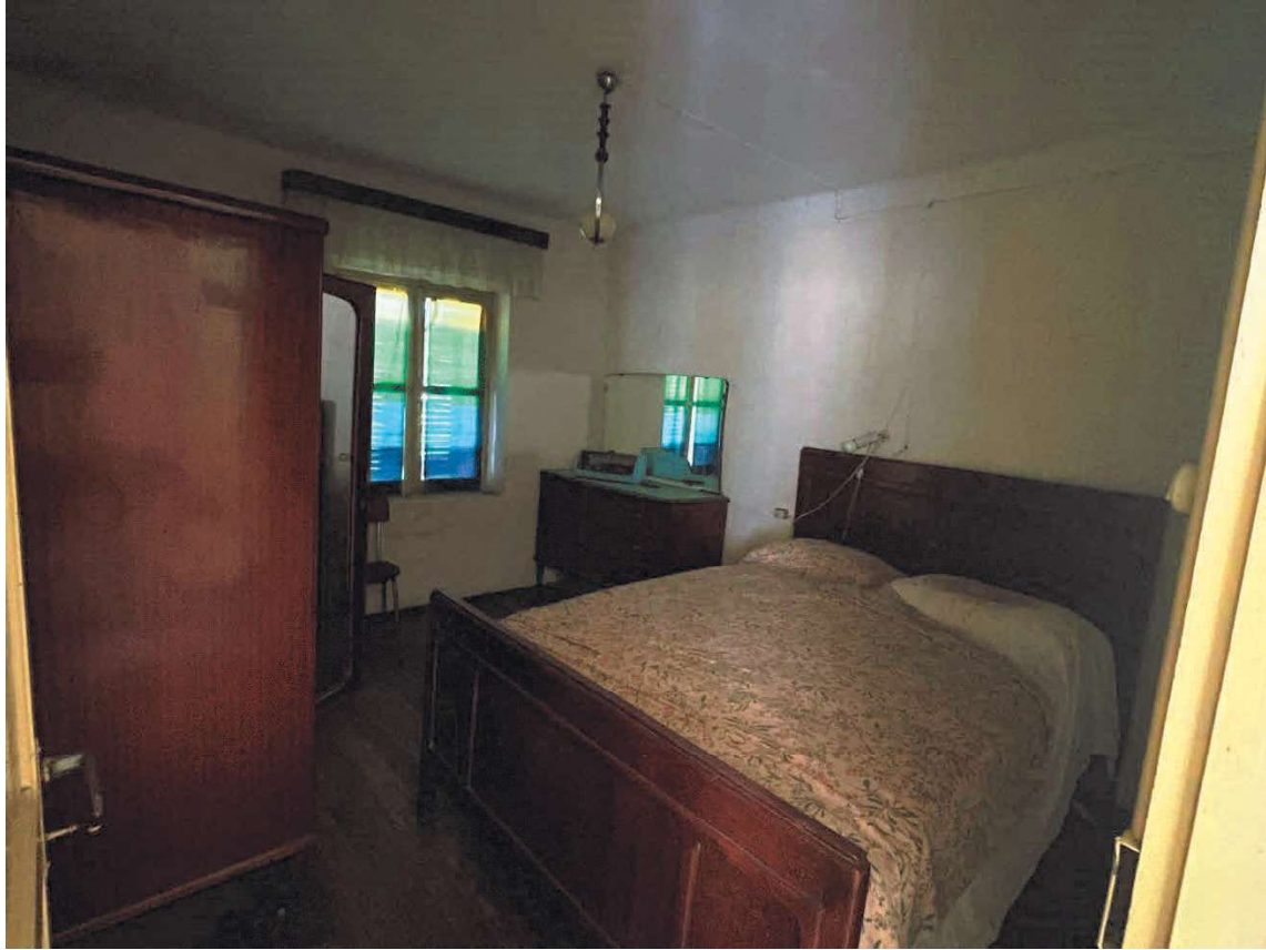
CAMERA LETTO PIANO PRIMO