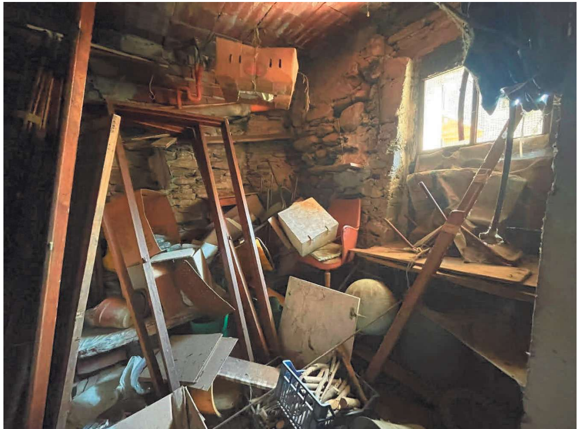
VANO DEPOSITO N.3 PIANO TERRA