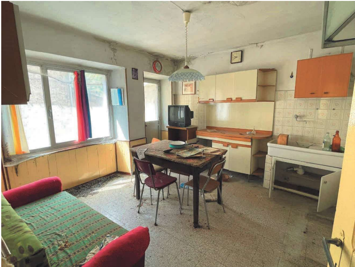
CUCINA AL PIANO PRIMO