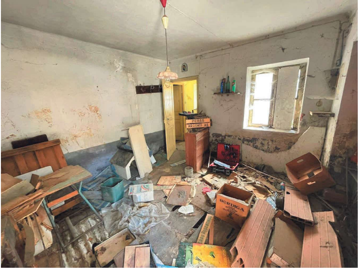
VANO DEPOSITO N.1 PIANO TERRA