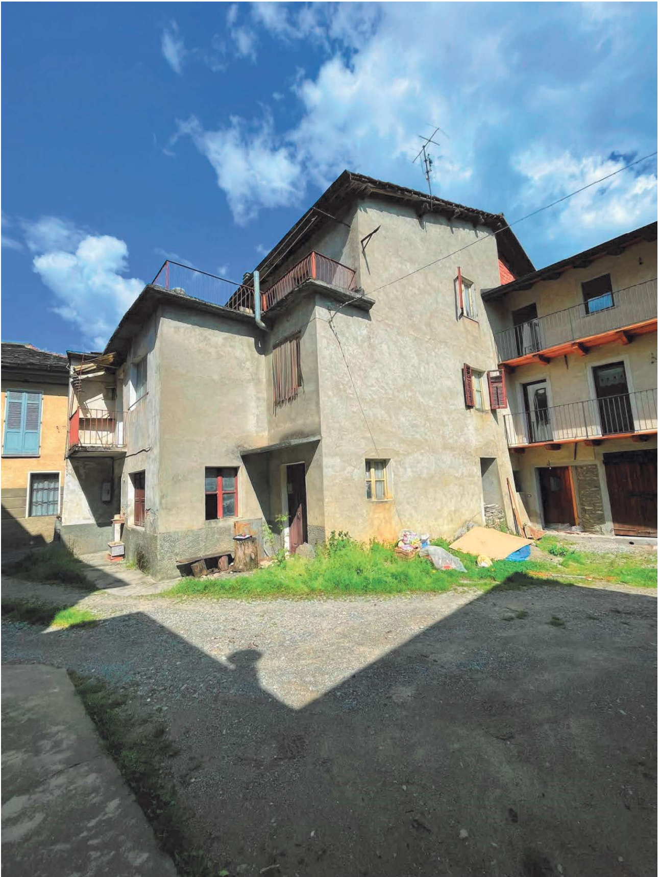
PROSPETTO DA CORTILE/AREA DI MANOVRA COMUNE