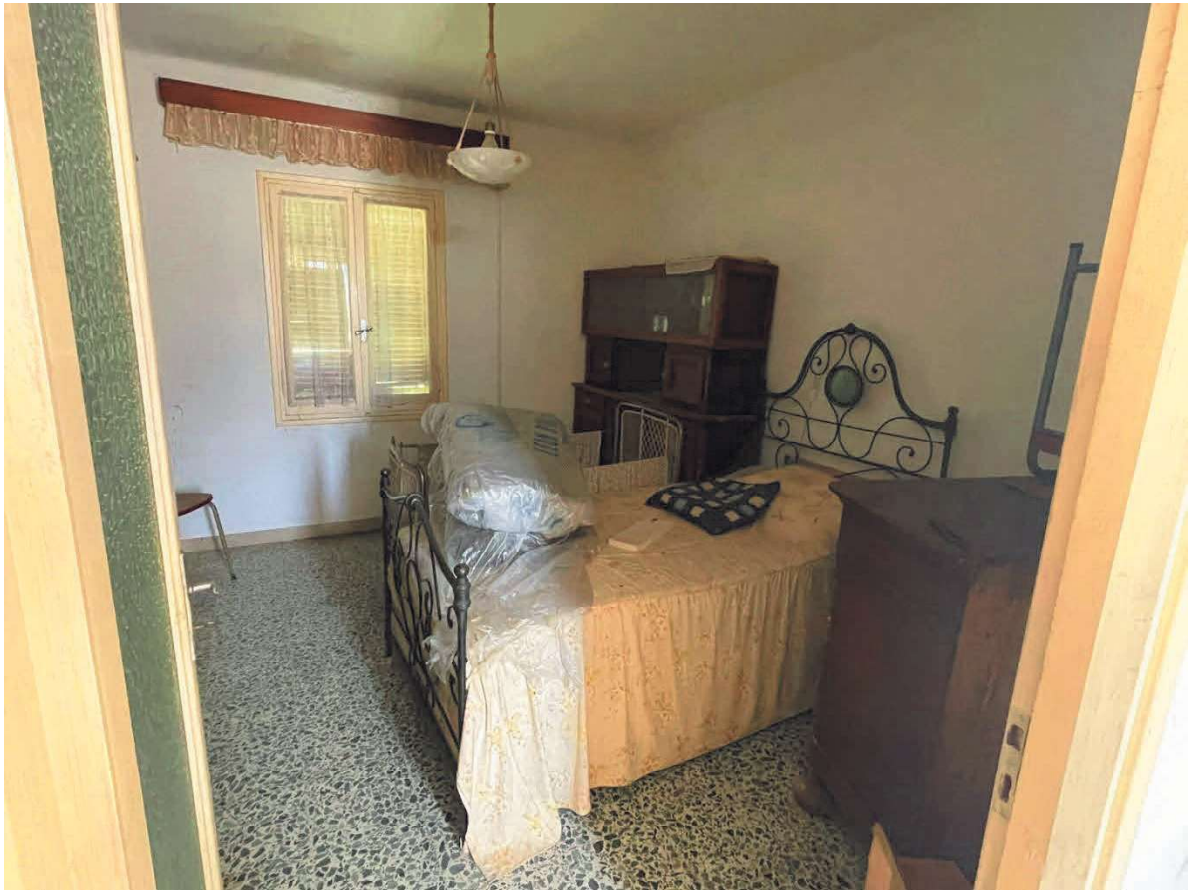
CAMERA LETTO PIANO 2°