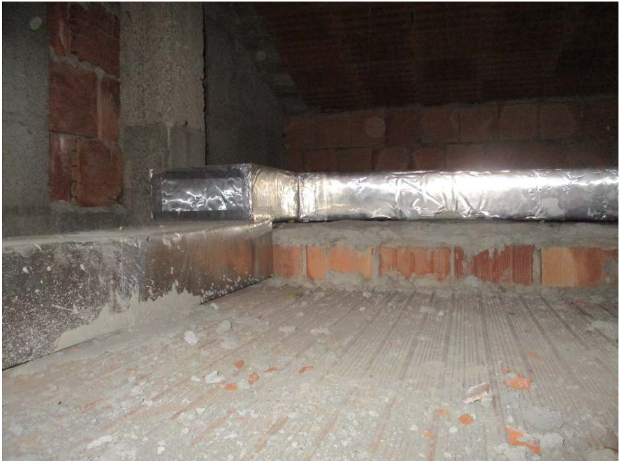
Fig. 29 – Vista interna del ripostiglio nel sottotetto