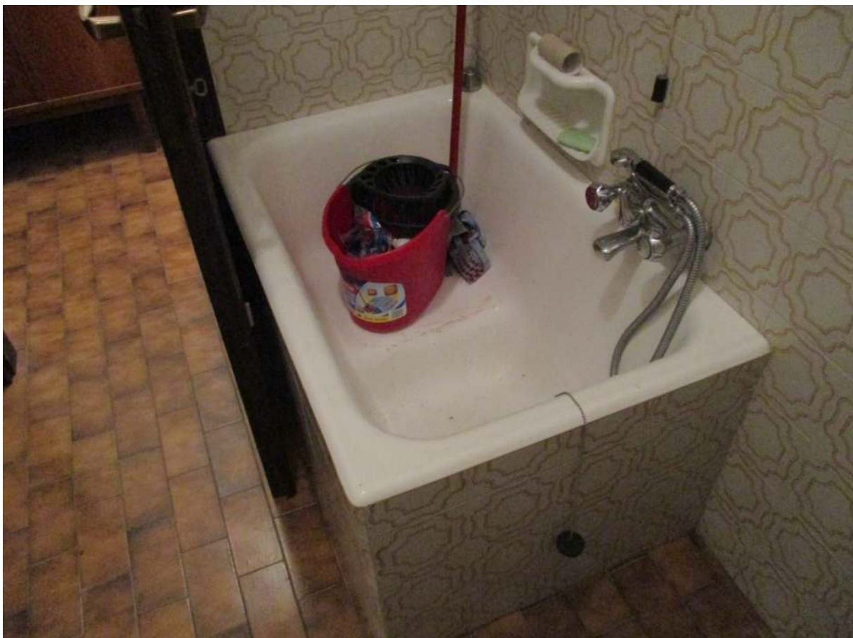
Fig. 25 – Vista della vasca installata nel bagno al P.T.