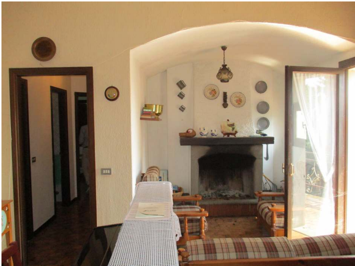
Fig. 18 – Vista del soggiorno/pranzo (zona caminetto)