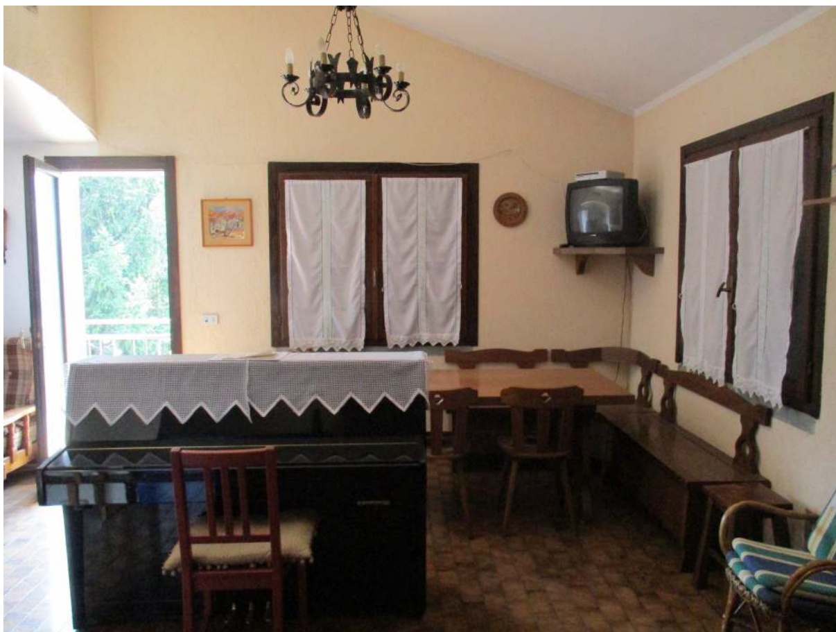
Fig. 17 – Vista del soggiorno/pranzo dalla zona cottura