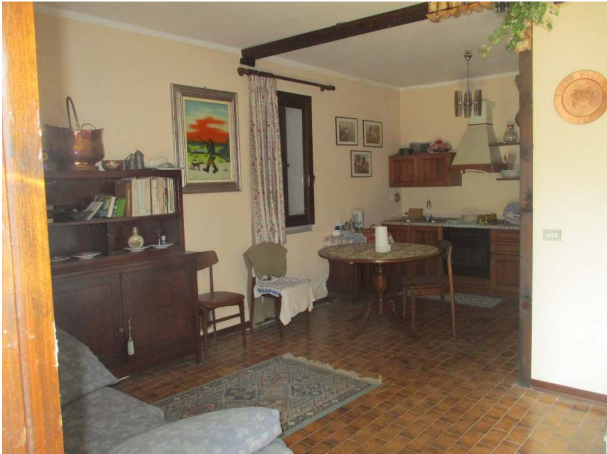
Fig. 33 – Vista del soggiorno/pranzo al P. seminterrato dalla porta d'ingresso sul cortile