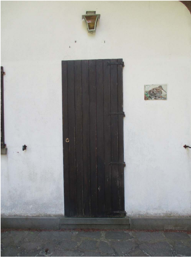
Fig. 13 – Vista esterna porta d'ingresso al P.T.