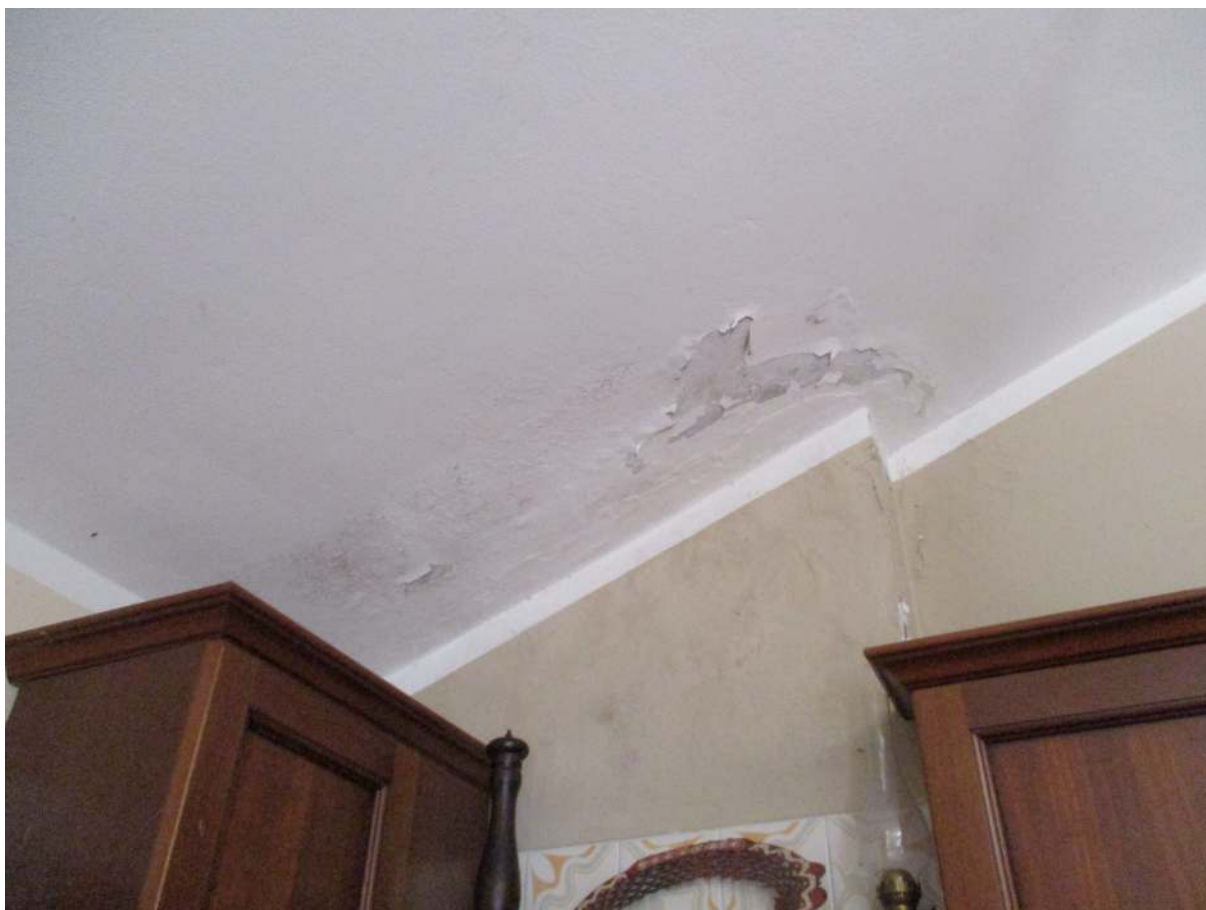
Fig. 16 – Vista di un'infiltrazione d'acqua dalla copertura sul soffitto della cucina