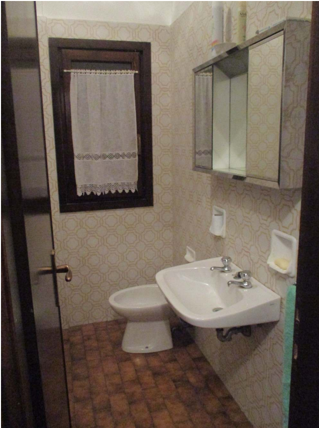
Fig. 23 – Vista del bagno al P.T.