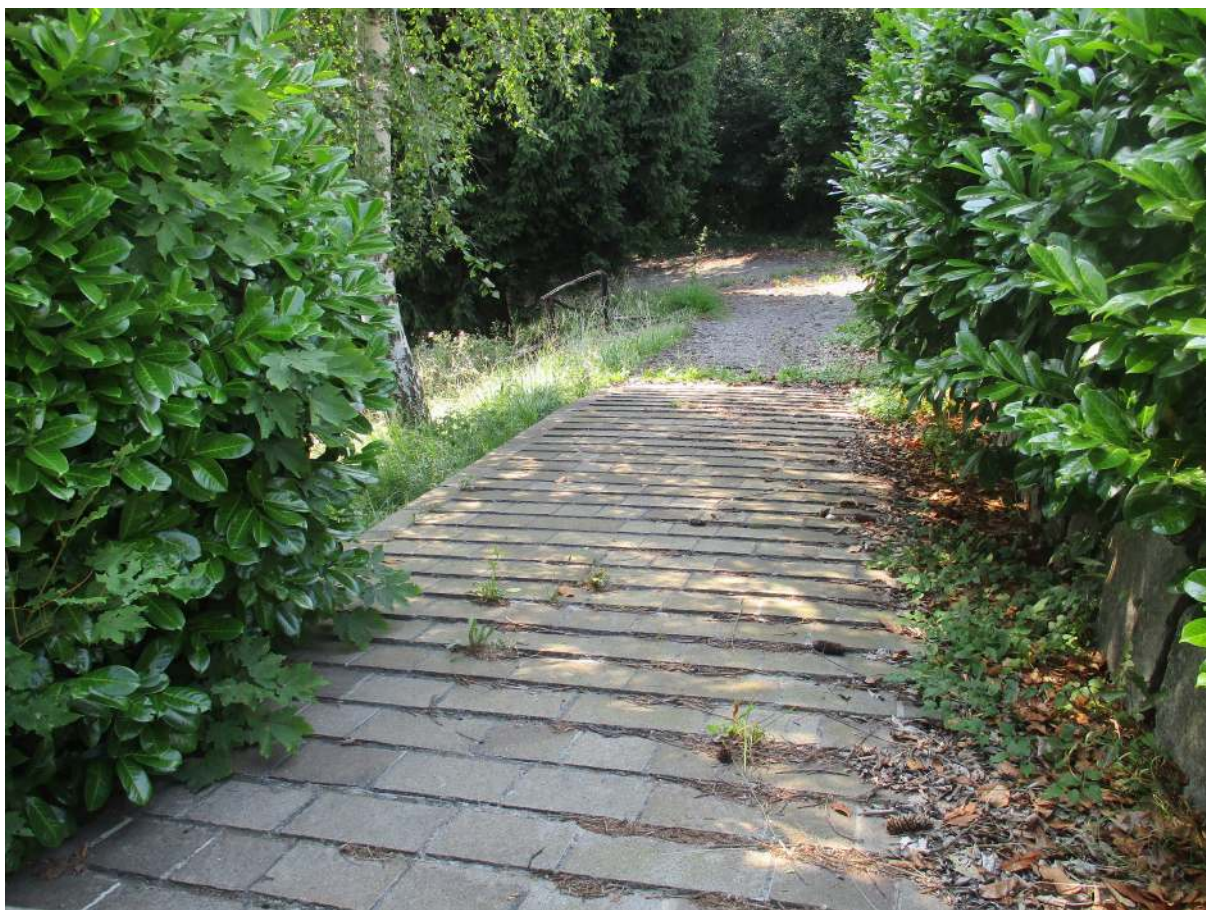
Fig. 3 – Vista della rampa carrabile (lato est)