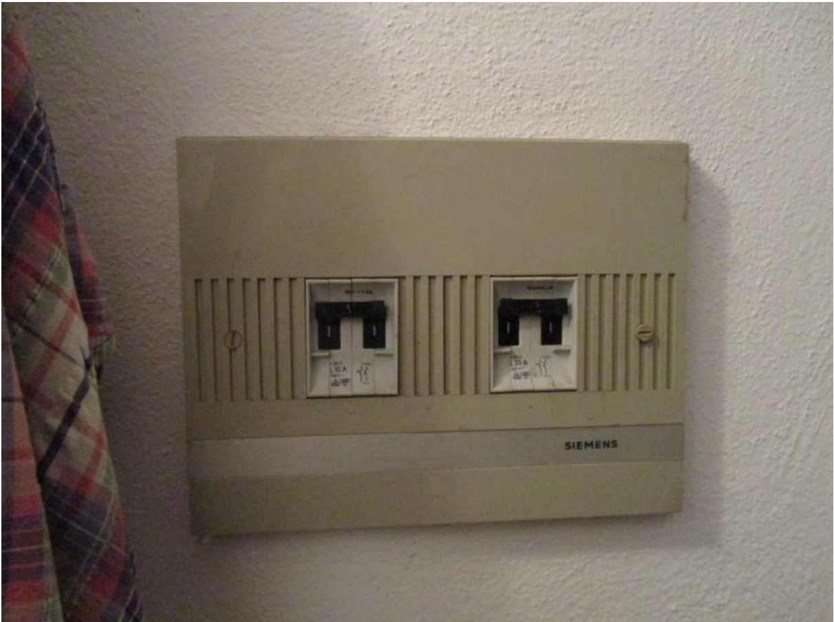
Fig. 42 – Vista del quadro elettrico installato nel disimpegno al P. terra