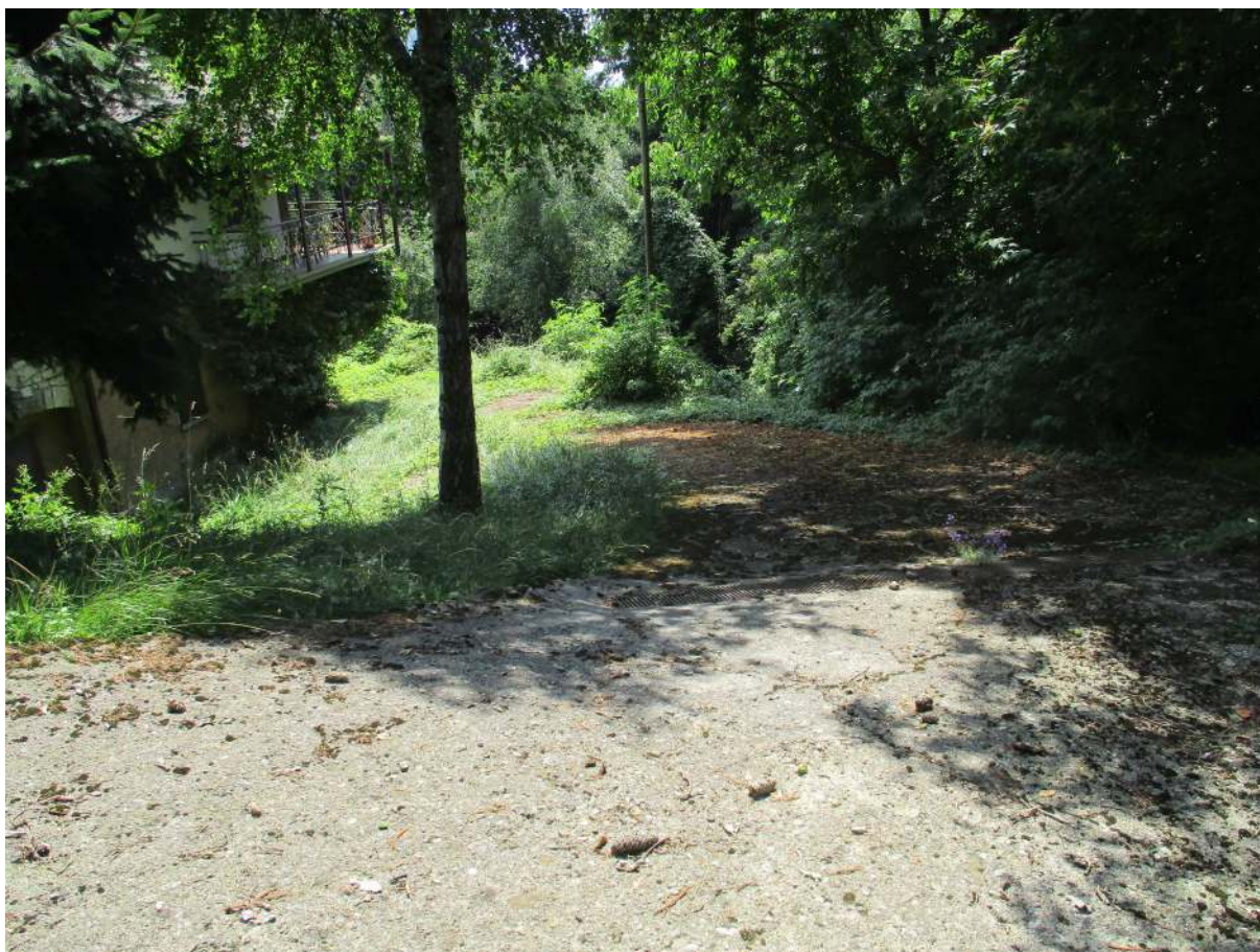
Fig. 4 – Vista della rampa carrabile (lato est)