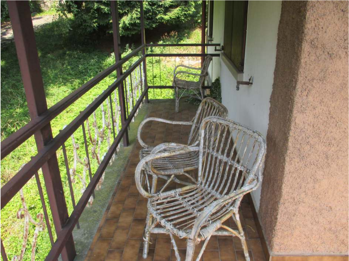
Fig. 20 – Vista del balcone con accesso dal soggiorno/pranzo (lato nord)