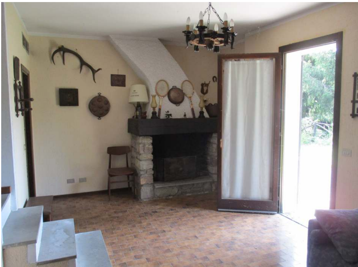
Fig. 32 – Vista del soggiorno/pranzo al p. seminterrato con accesso al cortile esterno