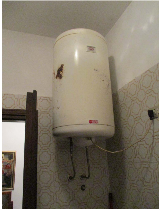
Fig. 24 – Vista del boiler nel bagno al P.T.