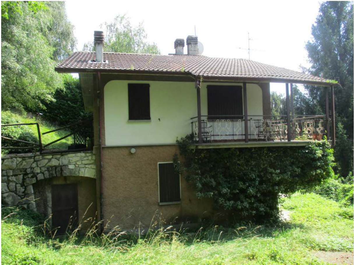
Fig. 9 – Vista esterna dell'edificio oggetto di stima (prospetto nord)