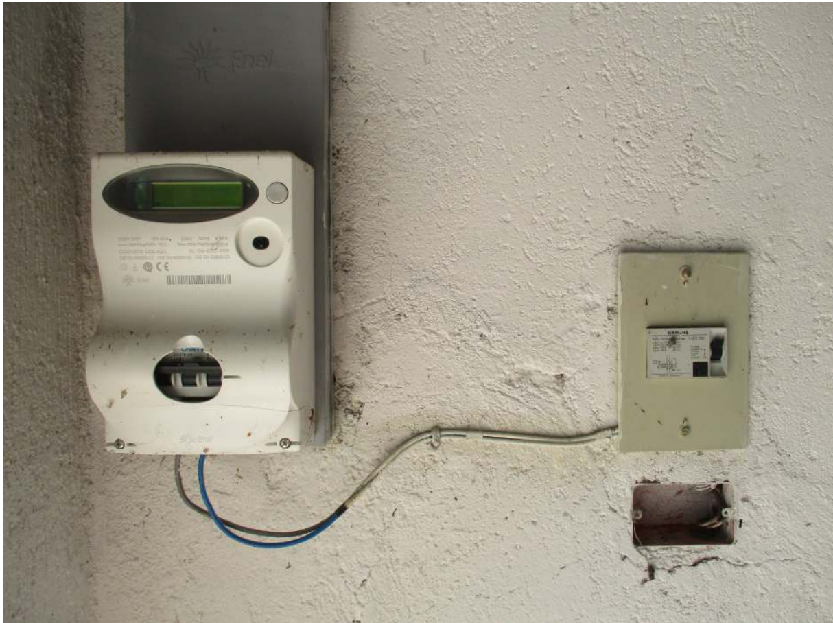
Fig. 43 – Vista del contatore Enel installato nel box al P. seminterrato