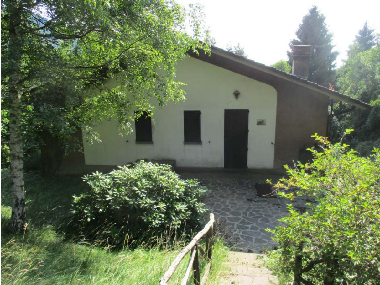
Fig. 7 – Vista esterna dell'edificio oggetto di stima (prospetto est)