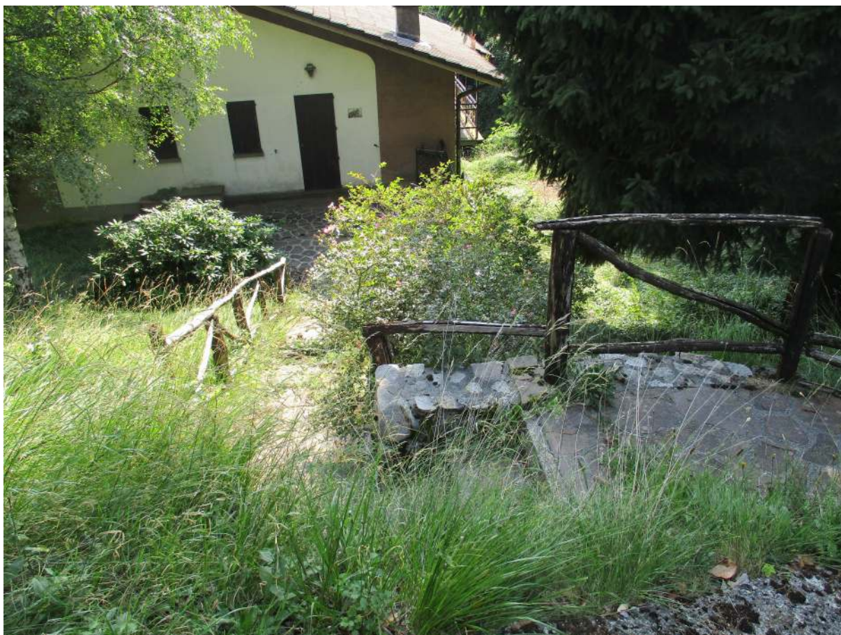
Fig. 6 – Vista della scala di accesso esterna posta sul lato est dell'edificio