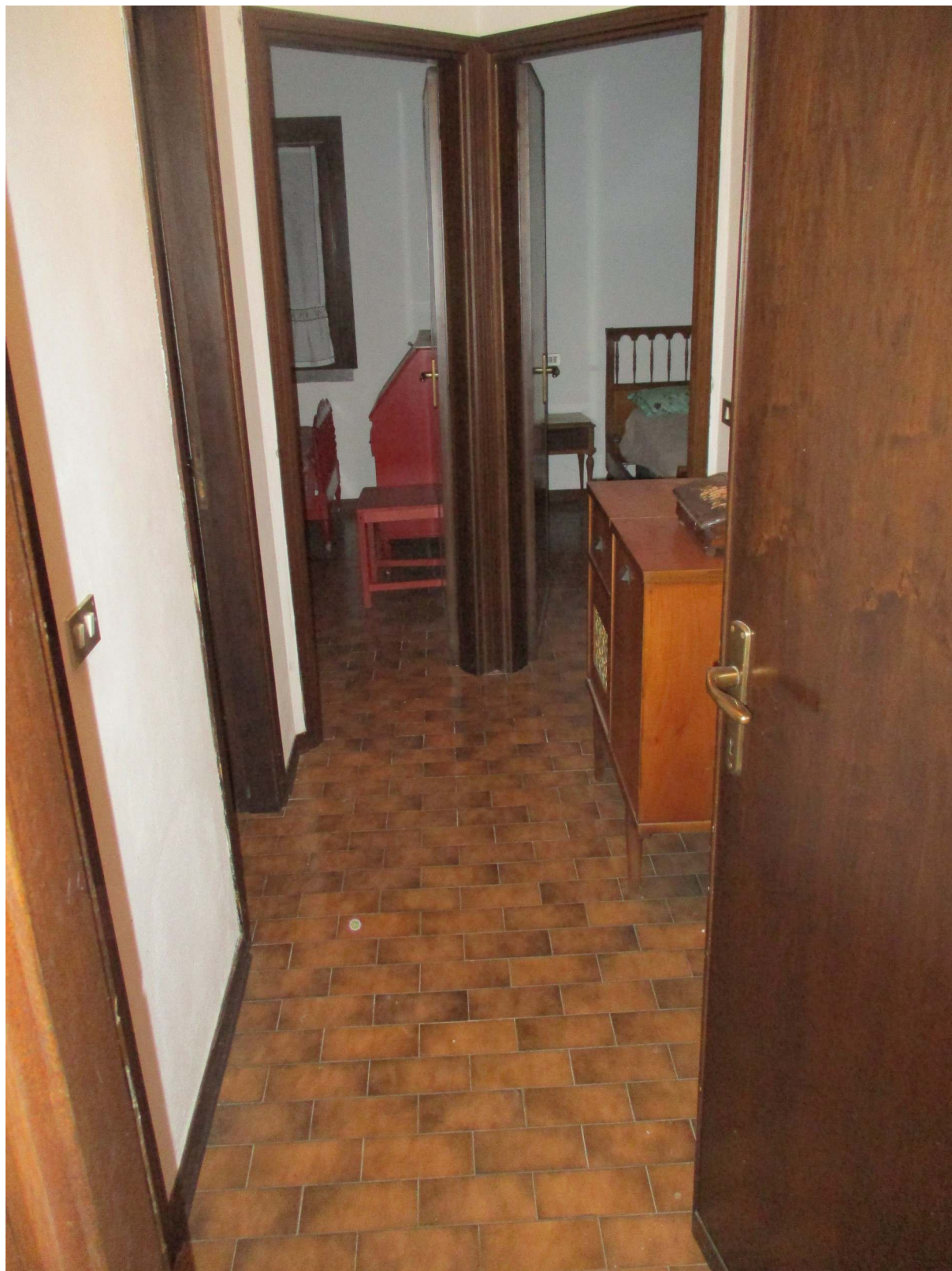
Fig. 22 – Vista del disimpegno con sullo sfondo le due camere