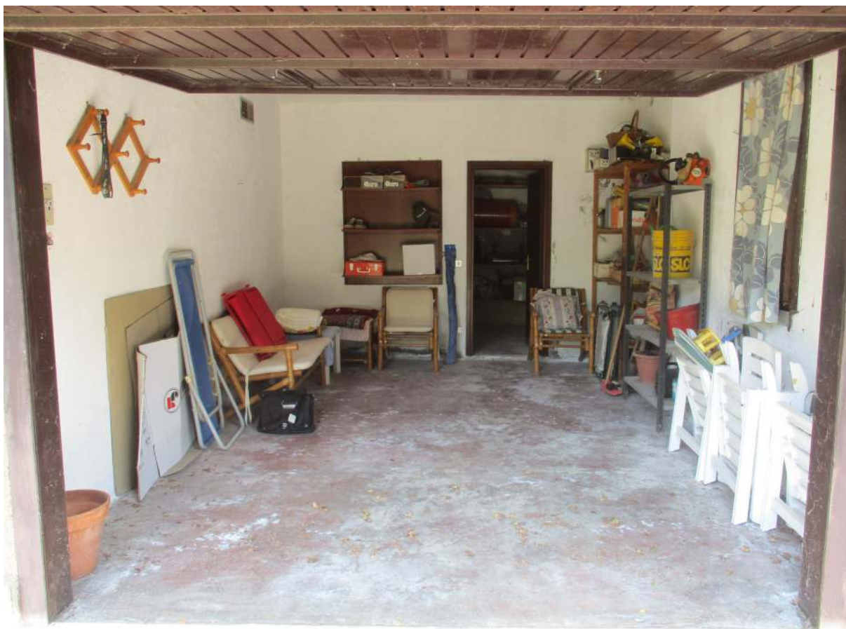
Fig. 40 – Vista interna del box con accesso dal cortile esclusivo (lato ovest)