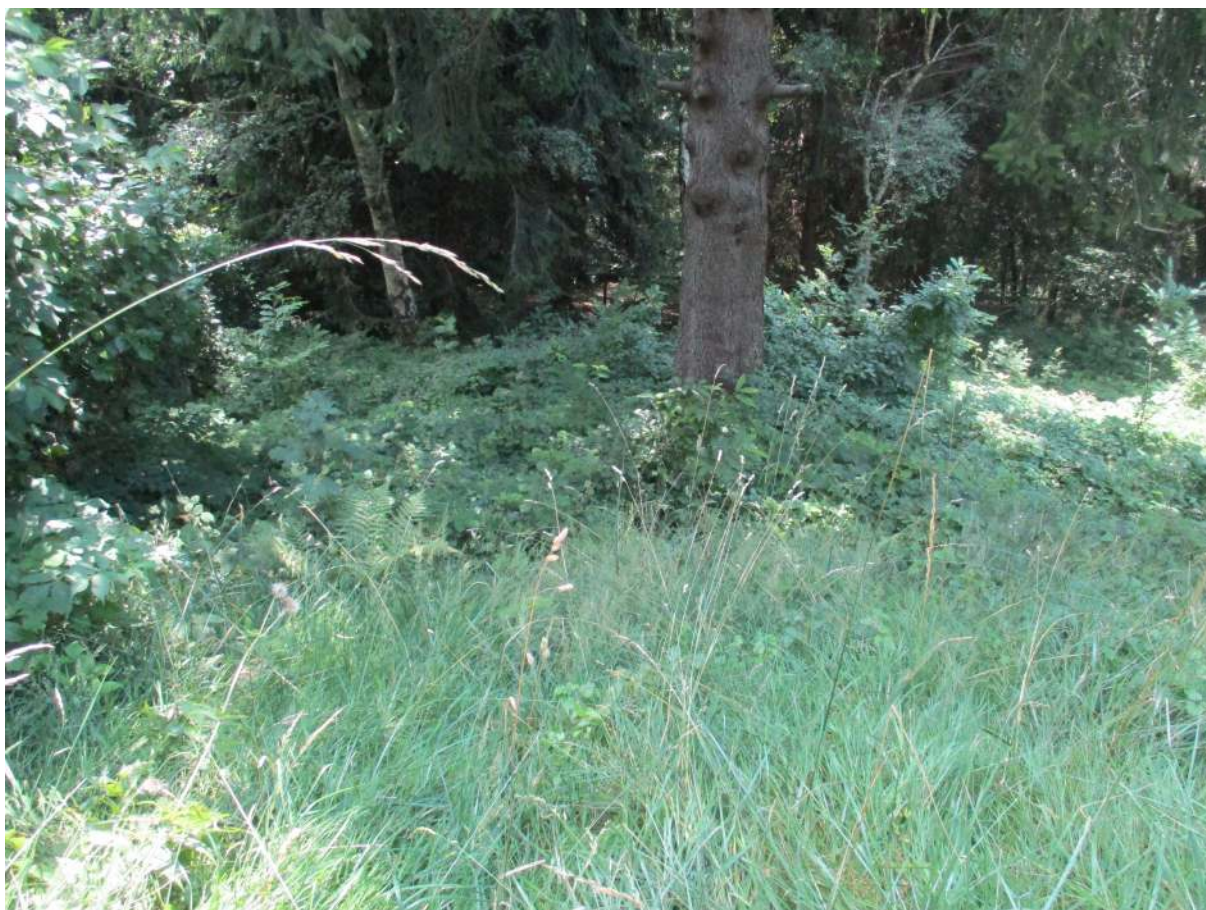
Fig. 11 – Vista del giardino di proprietà posto sul lato ovest