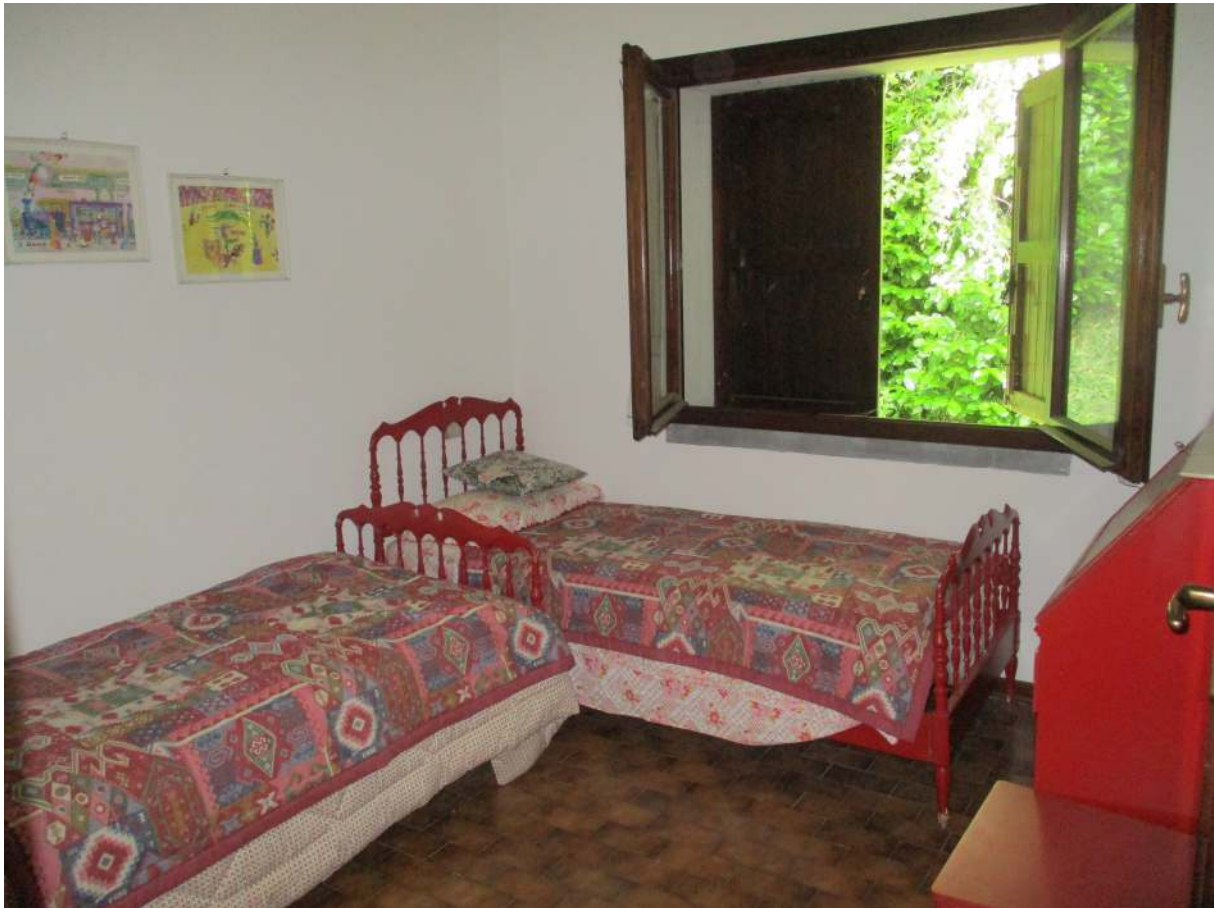
Fig. 26 – Vista della prima camera da letto (angolo sud-est)