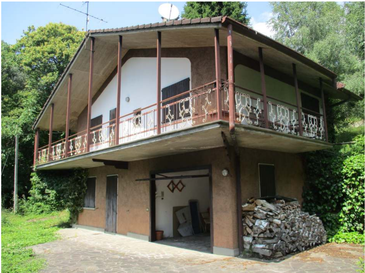
Fig. 10 – Vista esterna dell'edificio oggetto di stima (angolo sud-ovest)