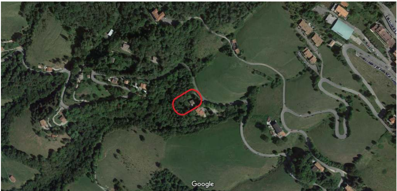
Fig. 1 – Immagine satellitare con l'edificio in cui è inserito l'appartamento cerchiato in rosso