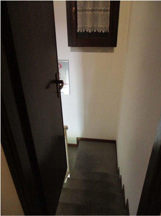
Fig. 30 – Vista scala che conduce al p. semint.