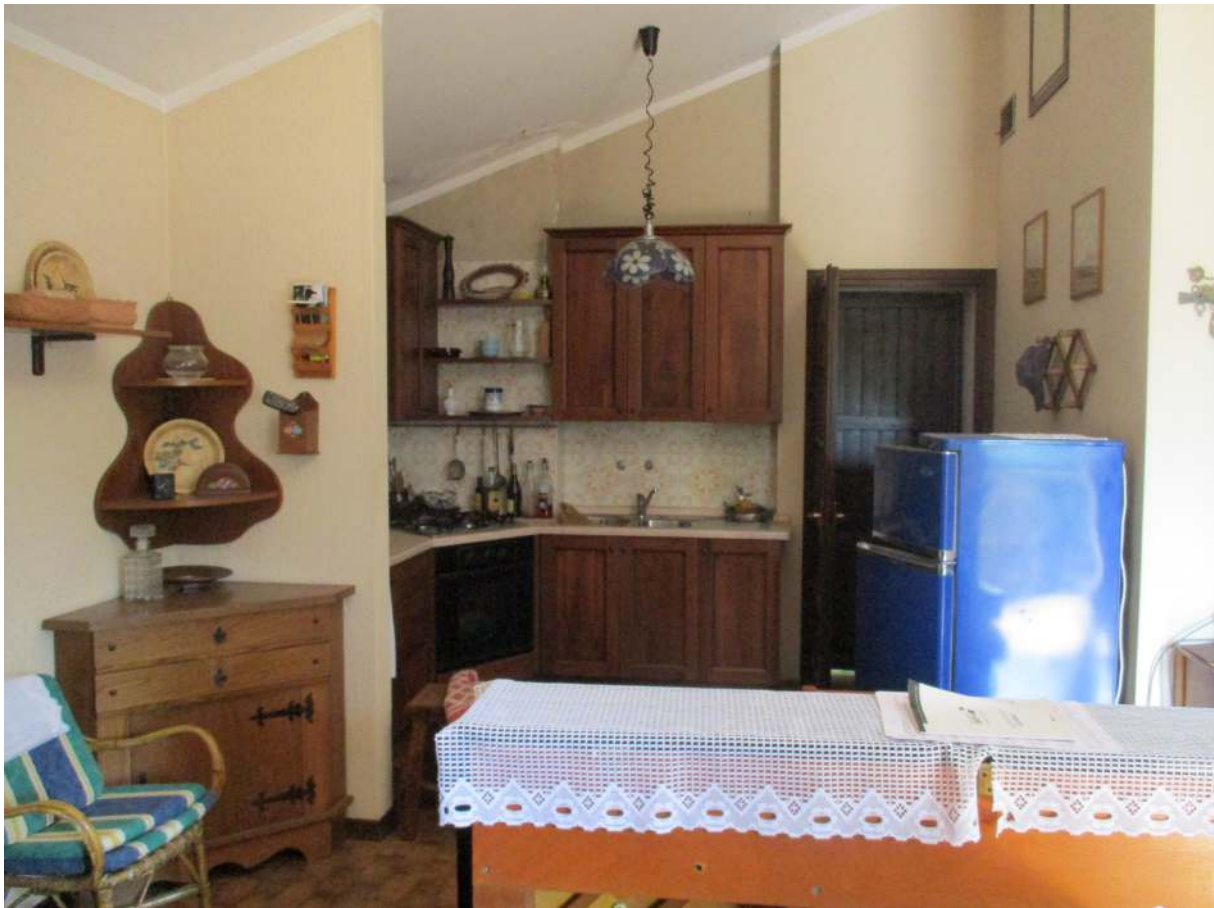
Fig. 15 – Vista della cucina con sulla destra la porta d'ingresso