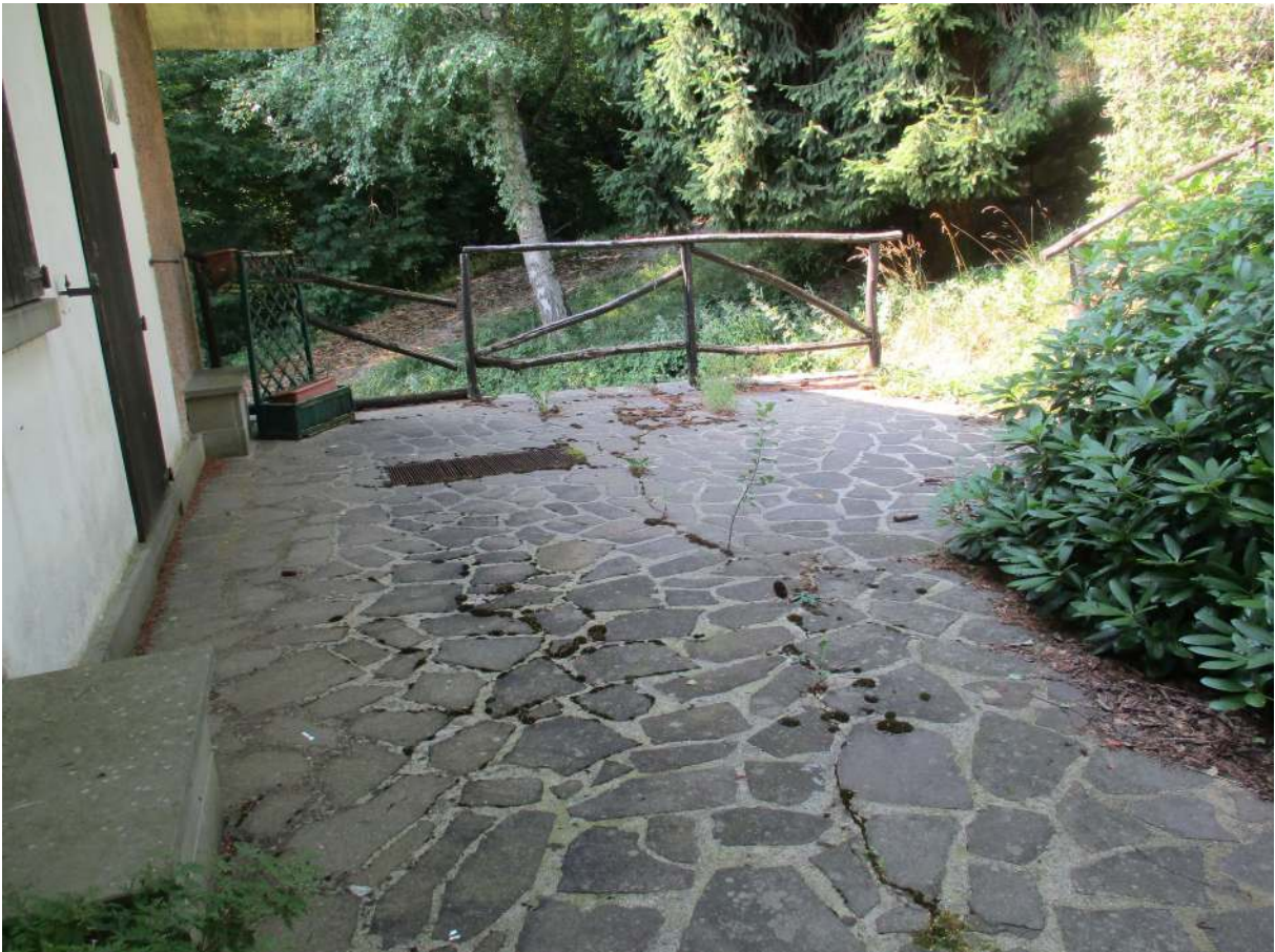
Fig. 8 – Vista del lastricato sul lato est dell'edificio