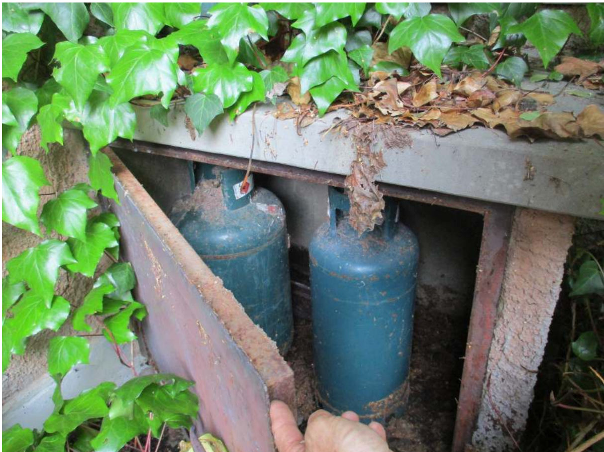
Fig. 44 – Vista del vano esterno delle bombole del gas