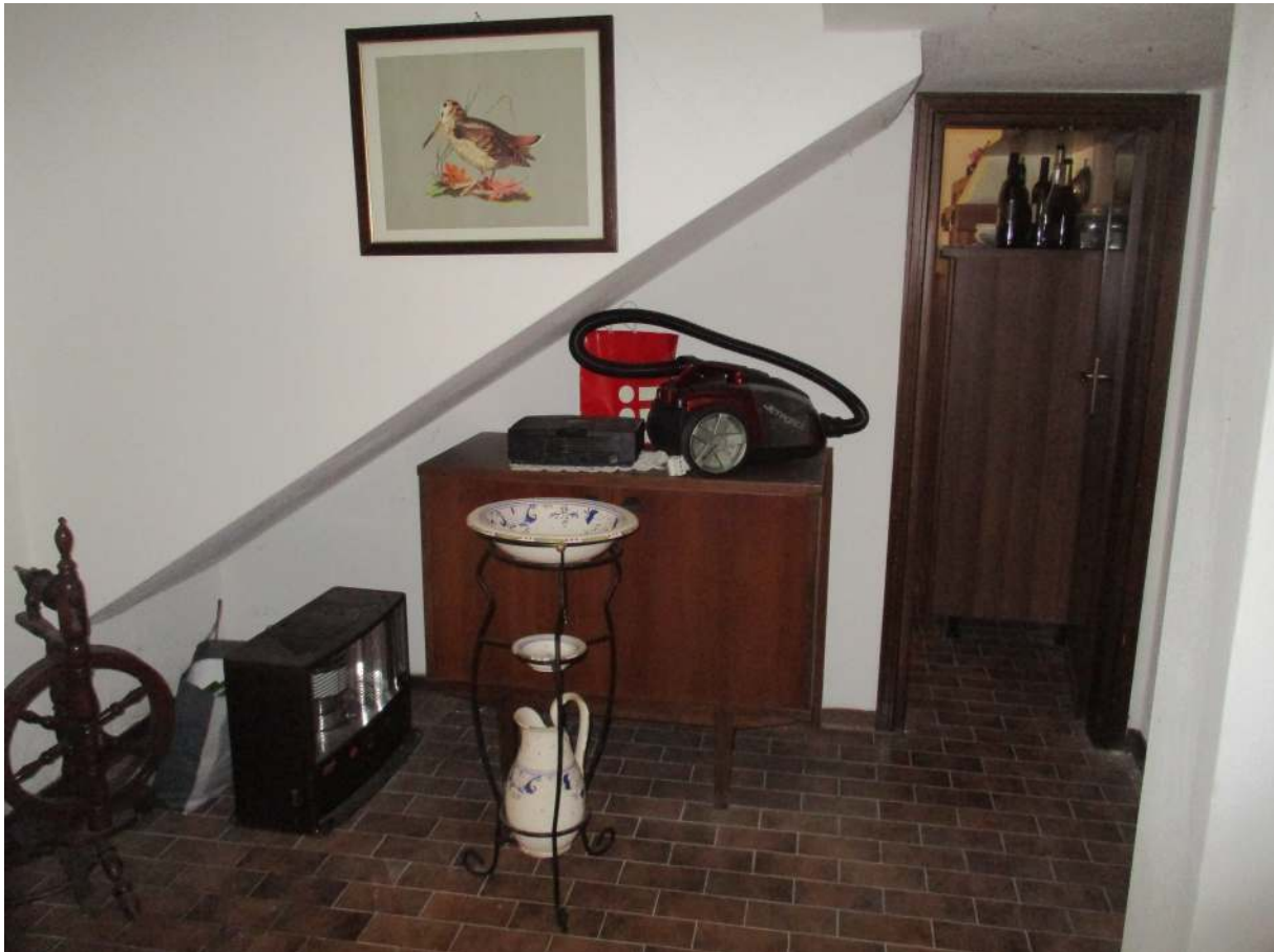
Fig. 35 – Vista del disimpegno al P. seminterrato