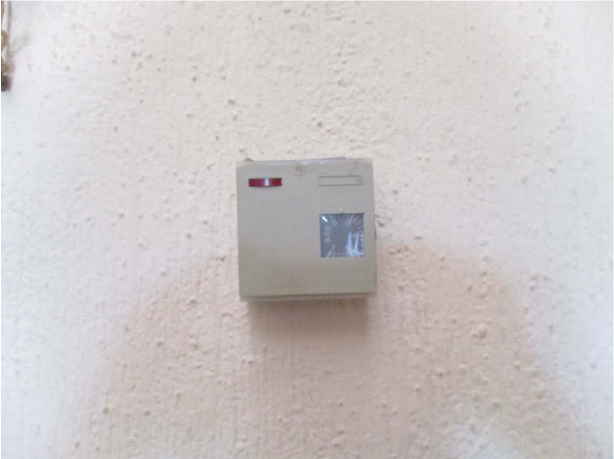
Fig. 41 – Vista del termostato installato nel soggiorno/pranzo al P. terra