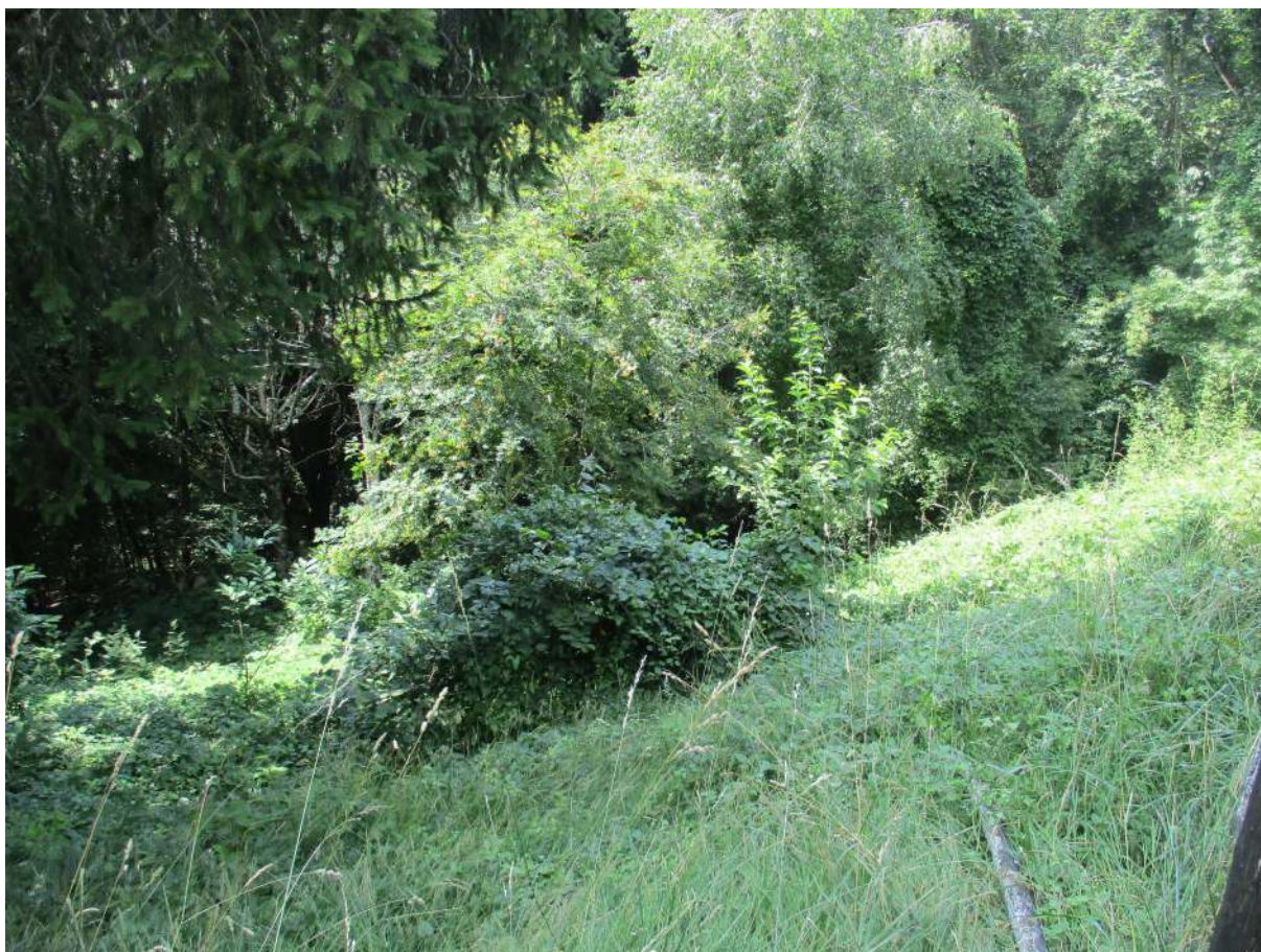
Fig. 12 – Vista del giardino di proprietà posto sul lato ovest