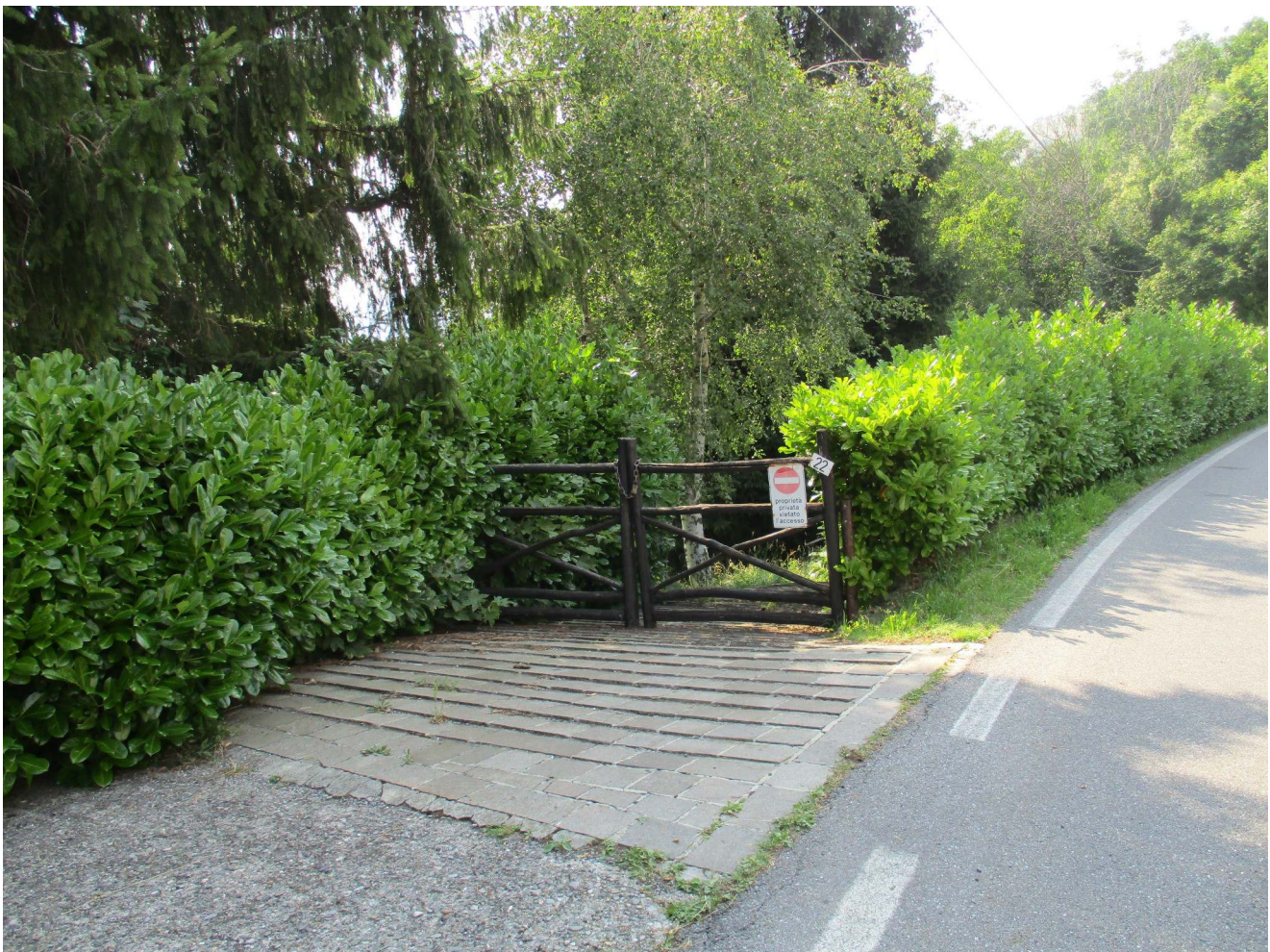
Fig. 2 – Vista del cancello d'accesso alla proprietà oggetto di perizia posto su Via San Fermo