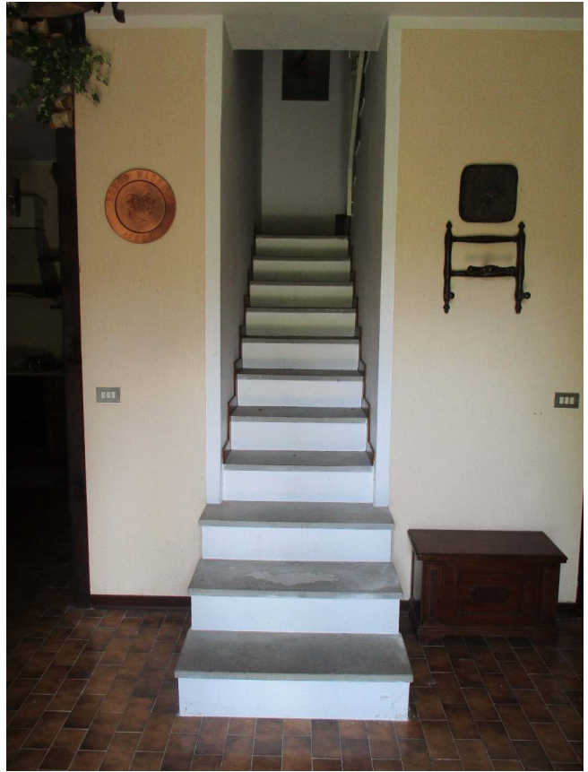
Fig. 31 – Vista scala che conduce al p. semint.