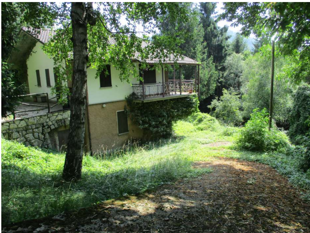
Fig. 5 – Vista del tratto terminale della rampa carrabile