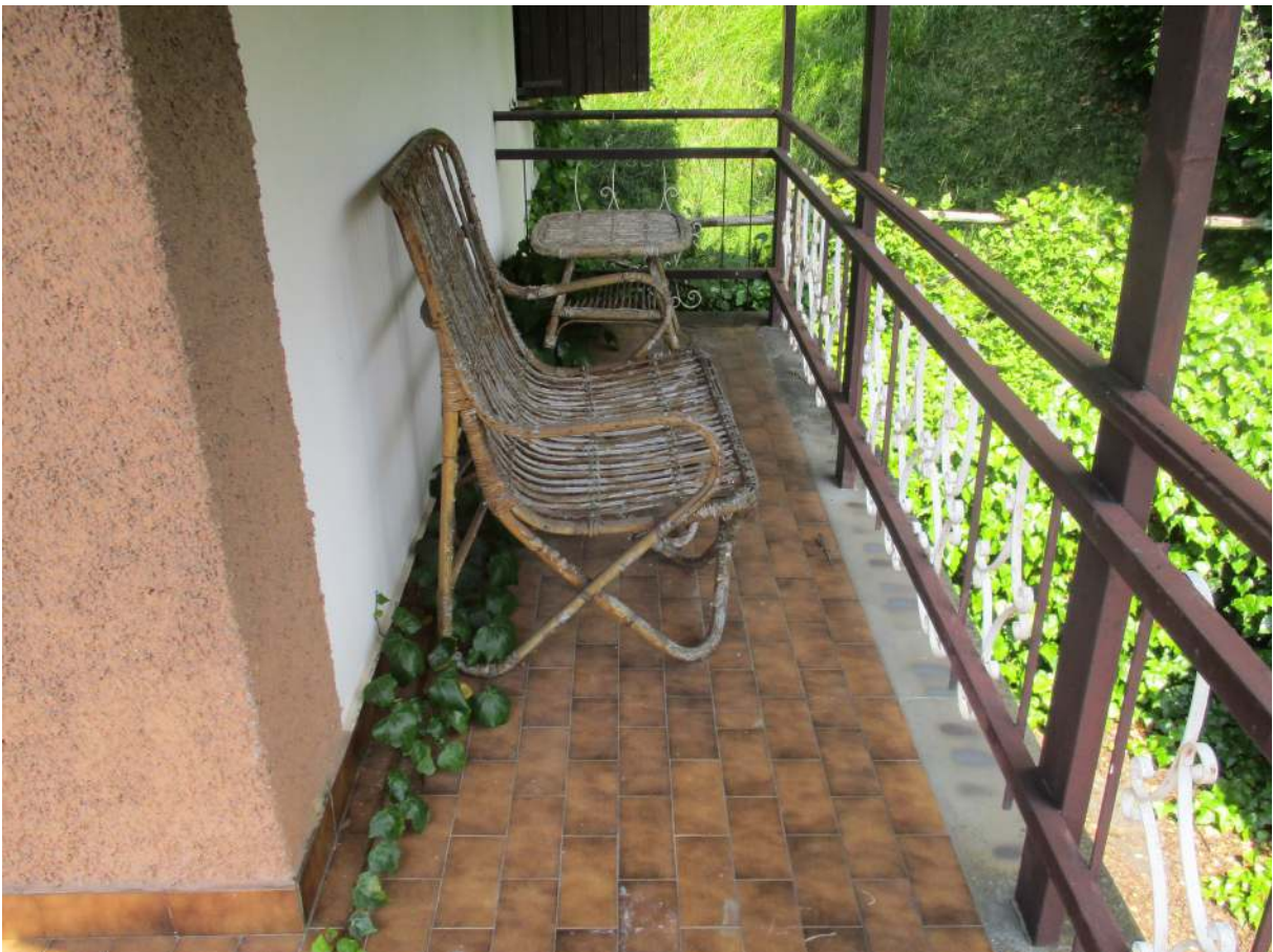
Fig. 21 – Vista del balcone con accesso dal soggiorno/pranzo (lato sud)