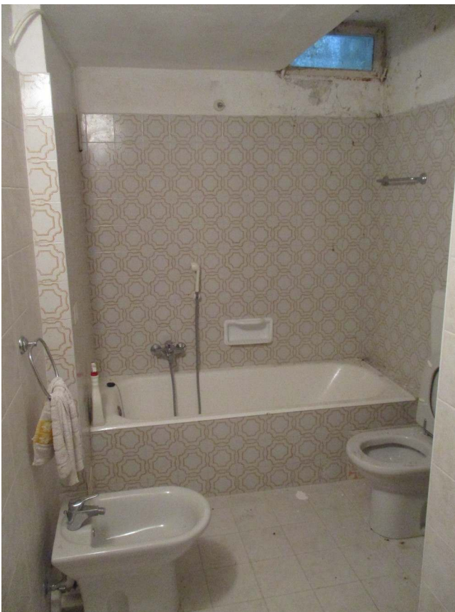
Fig. 36 – Vista del bagno al P. seminterrato