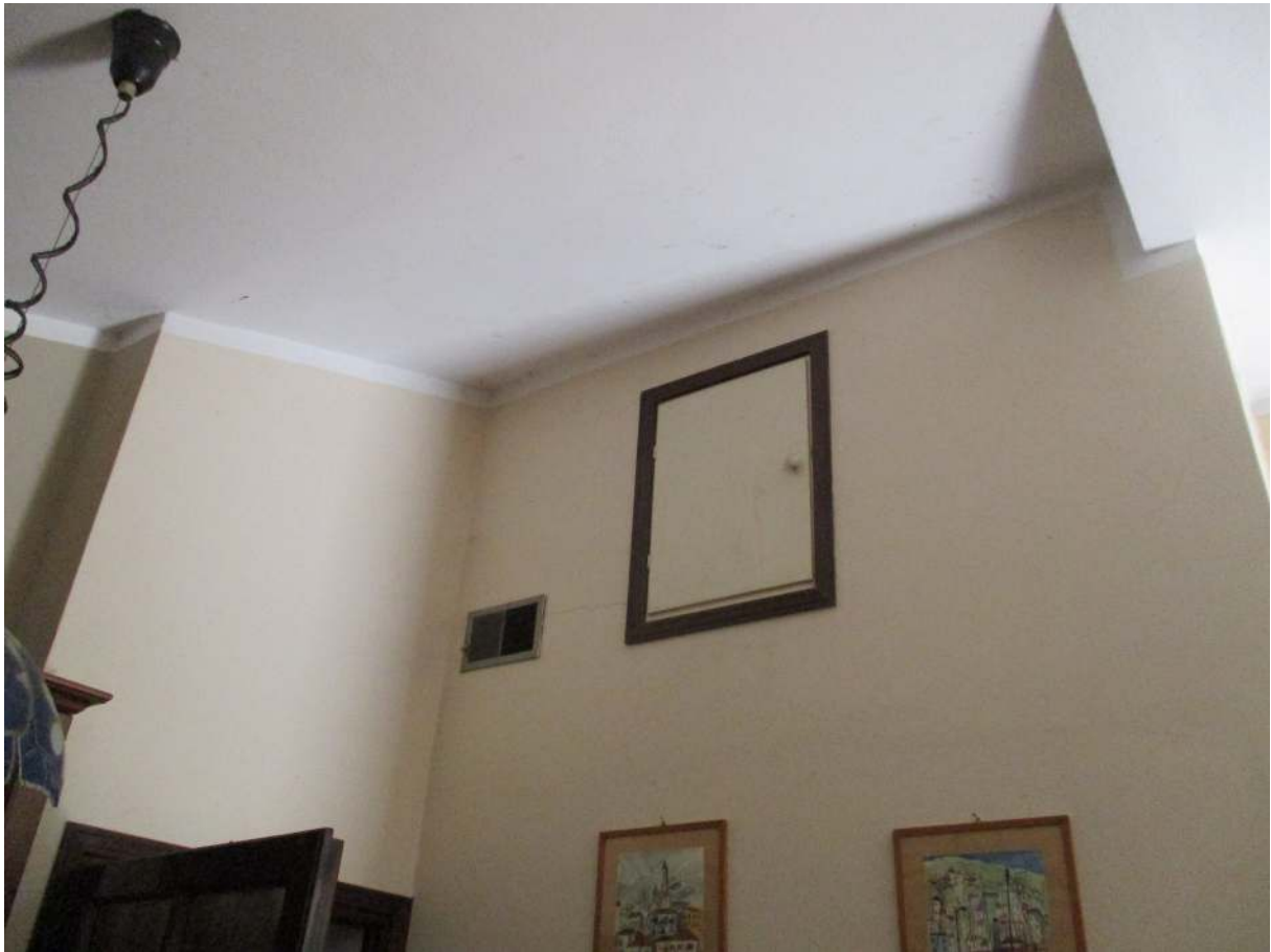
Fig. 28 – Vista dell'accesso al ripostiglio nel sottotetto