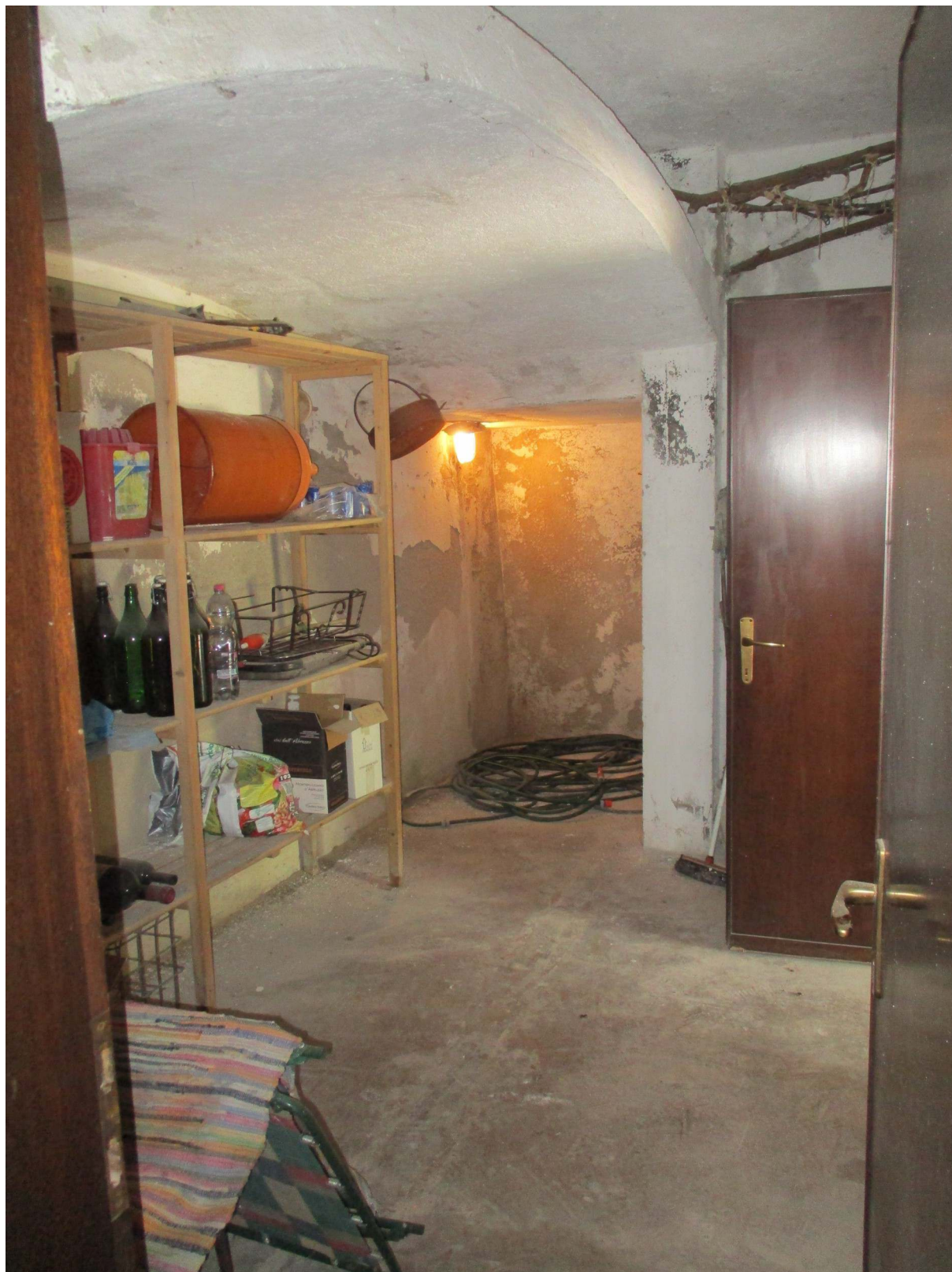
Fig. 38 – Vista del locale cantina con accesso dal disimpegno e dal box