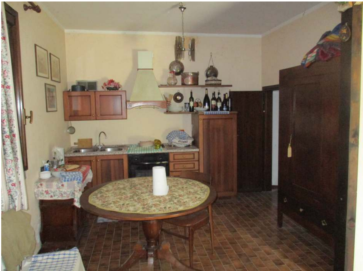
Fig. 34 – Vista della cucina al P. seminterrato