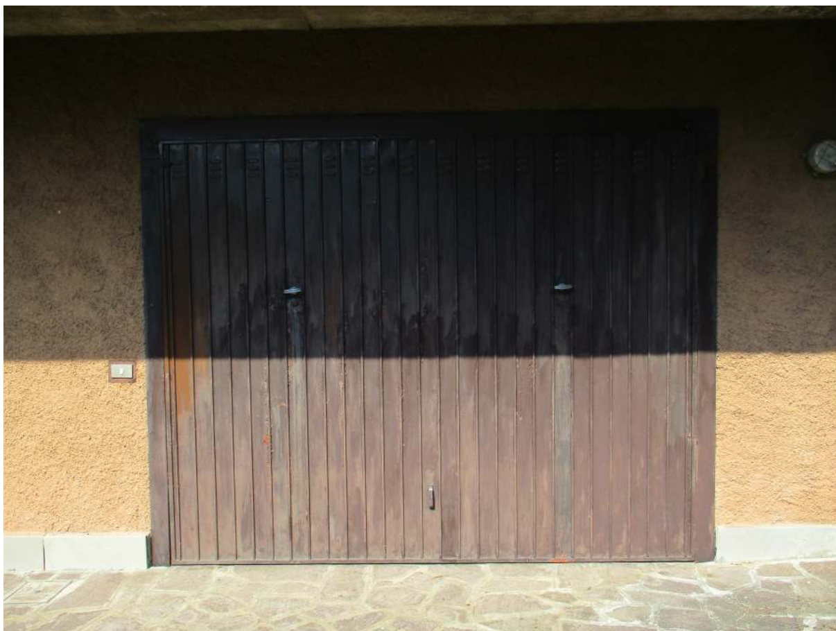
Fig. 39 – Vista esterna della basculante del box