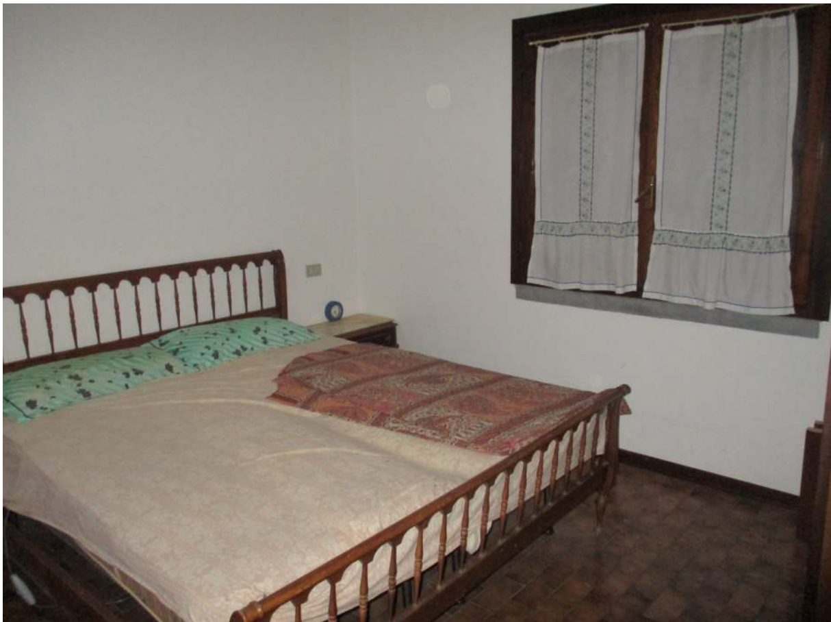
Fig. 27 – Vista della seconda camera da letto con affaccio sul balcone (angolo sud-ovest)