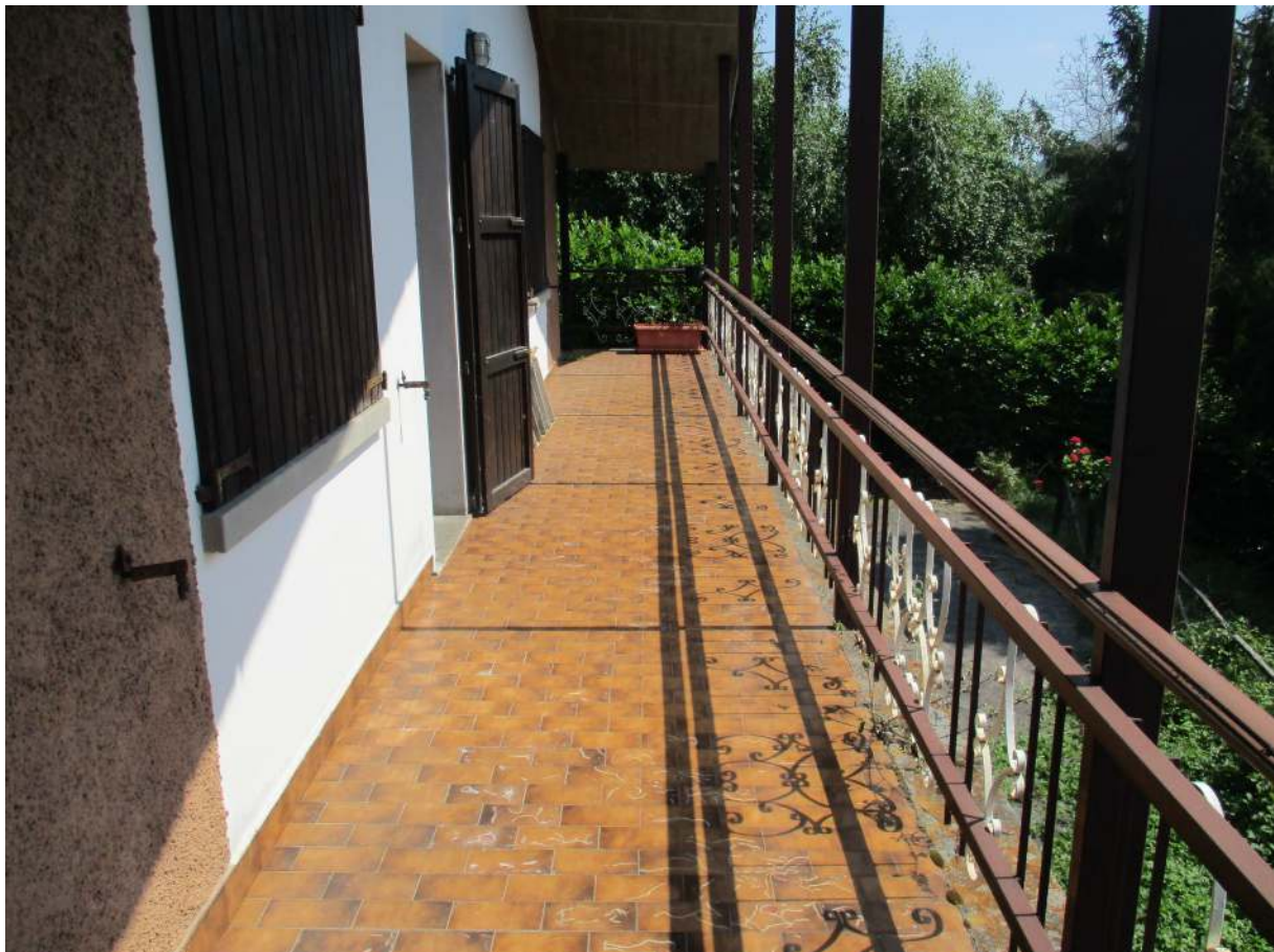
Fig. 19 – Vista del balcone con accesso dal soggiorno/pranzo (lato ovest)