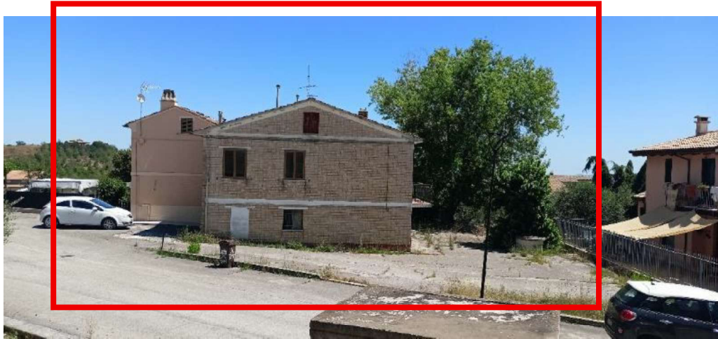
1 - Fronte Ovest edificio da Strada Faleriense