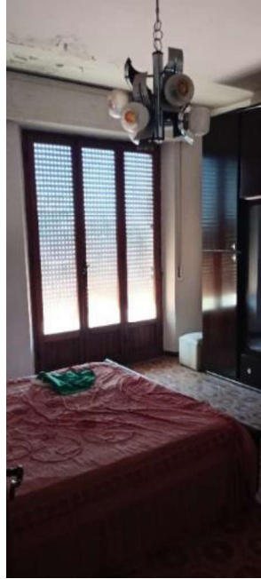
12. Camera Piano Primo fronte Sud