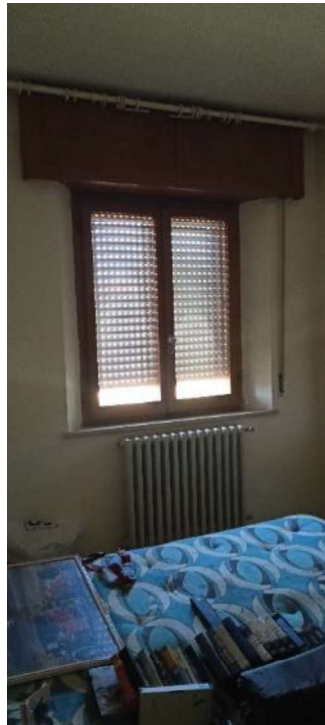
15. Camera sul lato