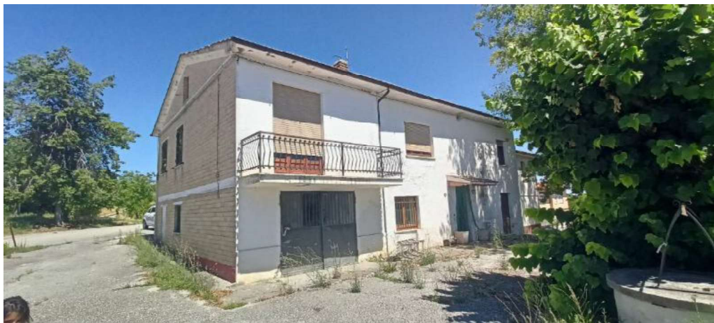
2- Fronte Sud da corte Particella 72 (Sub. 8-B.C.N.C.)