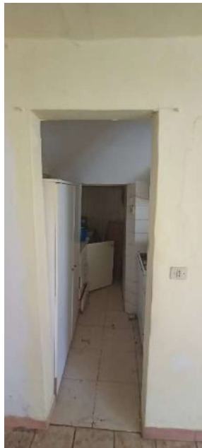
7- Sotto scale