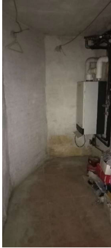
10. Centrale Termica