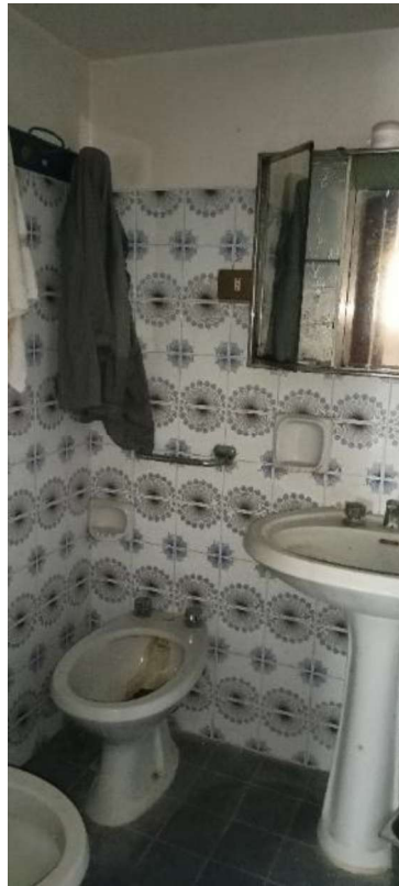
9. Bagno piano terra