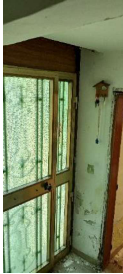
4- Porta ingresso