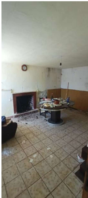
5- Cucina piano terra