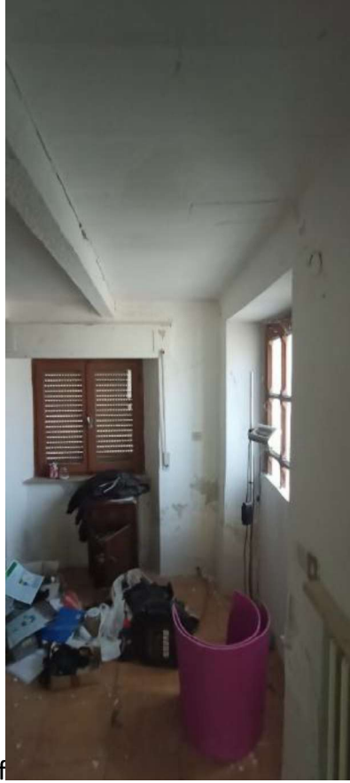
6- Dispensa Piano Terra