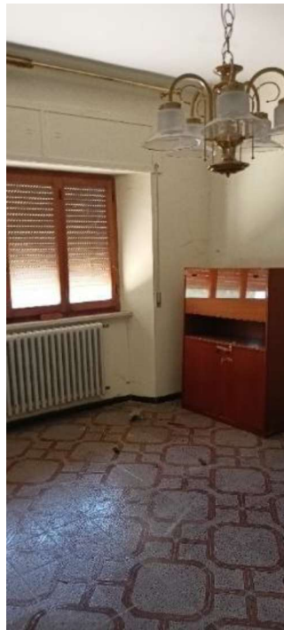
11.Salotto piano primo