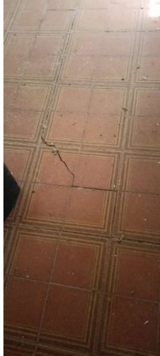
16.Lesioni solaio piano primo