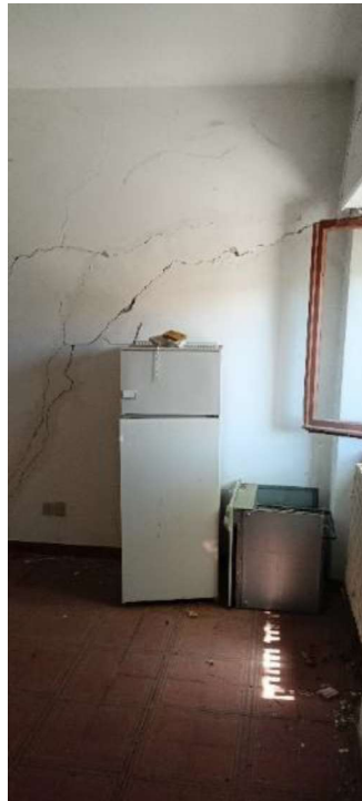
16.Lesioni verticali sui paramenti murari