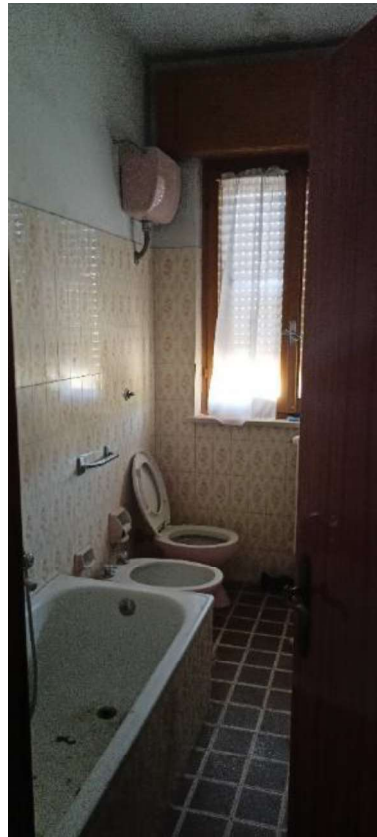
13. Bagno Piano Primo