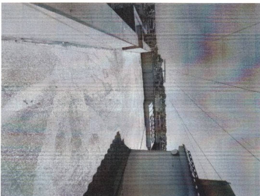
Foto n.4 - Particolari del Terrazzo di copertura P.2° con visione della porta di accesso al vano scala e del pozzo luce