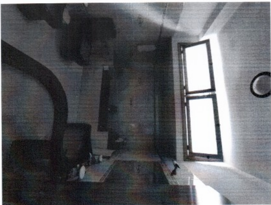
Foto n. 7 – Bagno P.1° con finestrina alta a sostituzione del pozzo luce che immette sul terrazzo di copertura