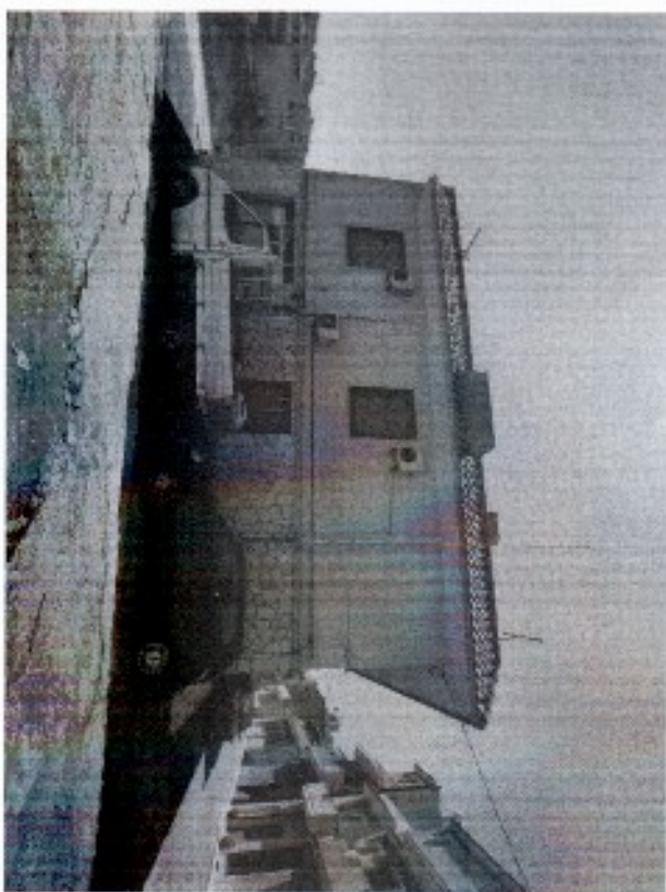
Foto n.1 - Visione dell'esterno dell'immobile - Via Venezia