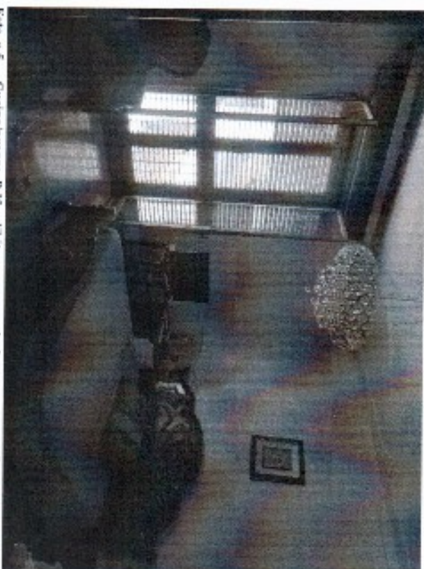
Foto n.5 - Cucina/pranzo P.1° adibita a camera da letto con porta finestra su Via C. D'Agata