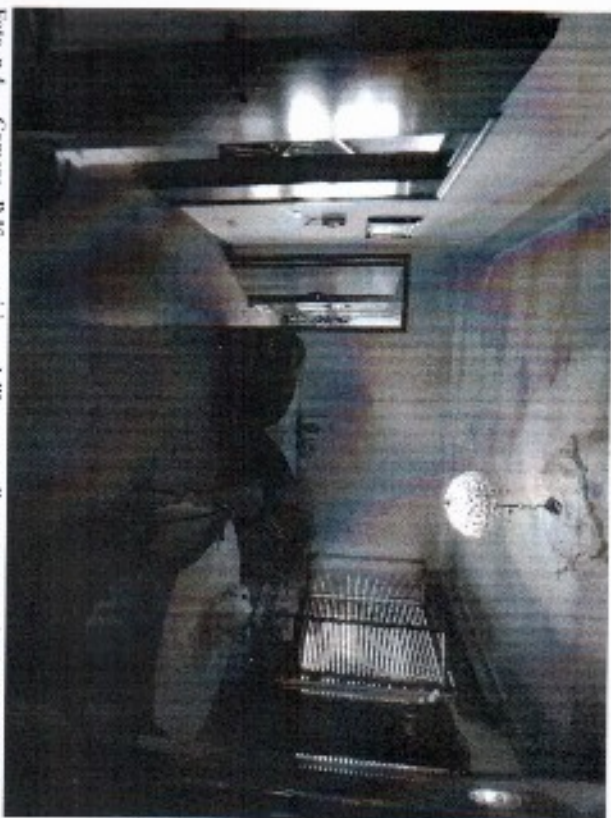
Foto n.4 - Camera P.1° con visione dell'accesso alla camera cucina/pranzo adibita a camera da letto con finestra su Via Venezia