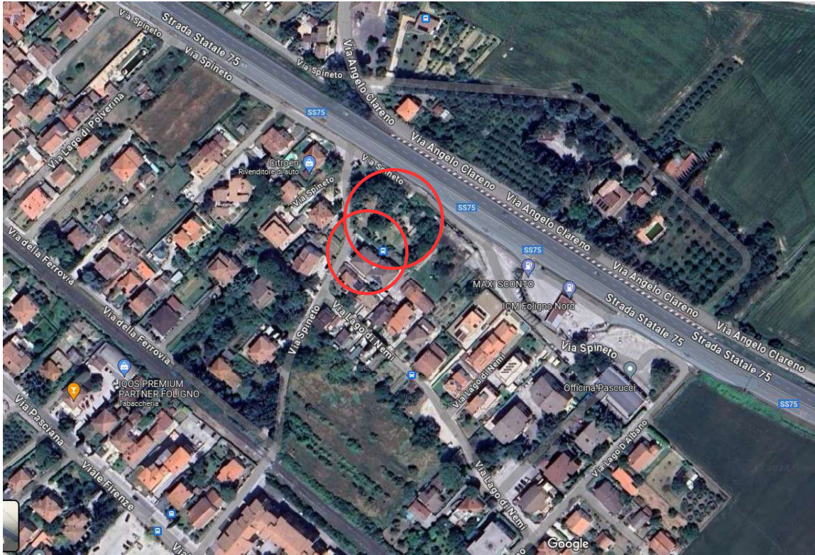
COMPENDIO IMMOBILIARE SITUATO IN LOC. SPINETTO