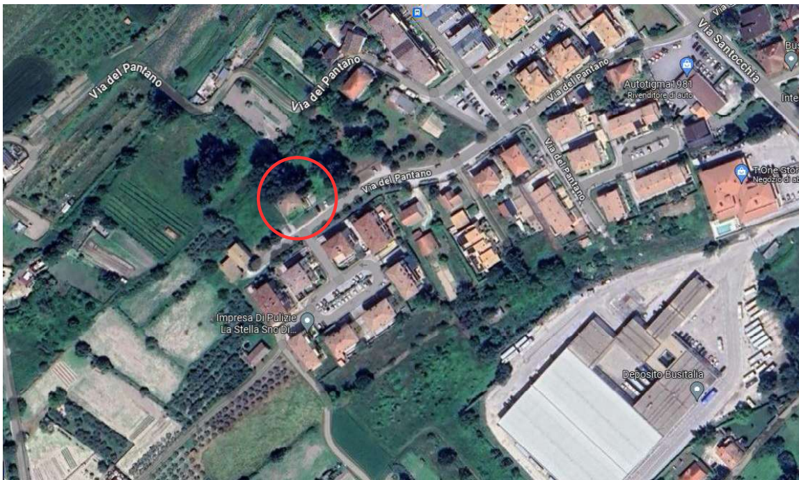
COMPENDIO IMMOBILIARE SITUATO IN VIA DEL PANTANO