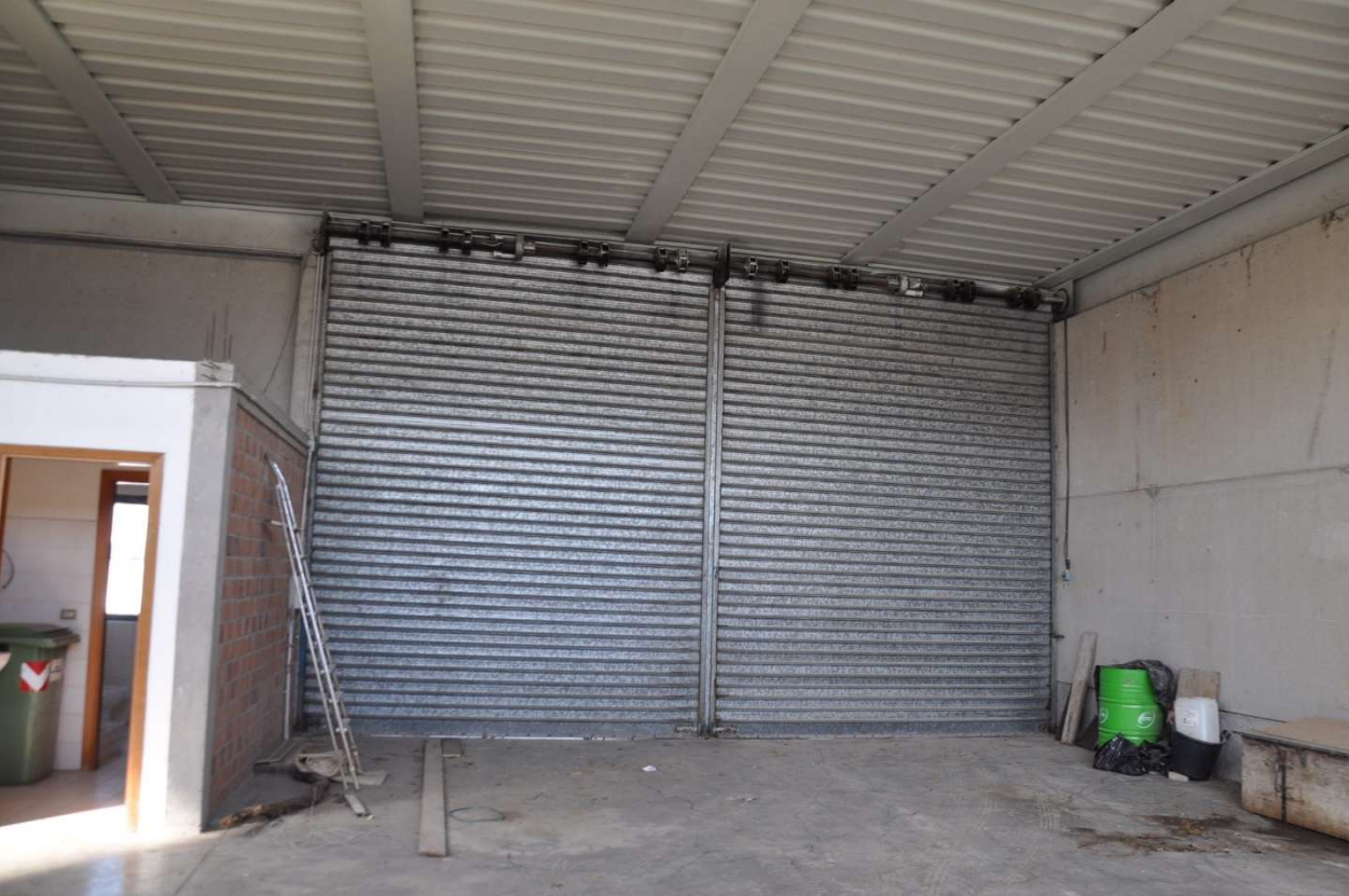
FOTO 10 ZONA INTERNA FABBRICATO