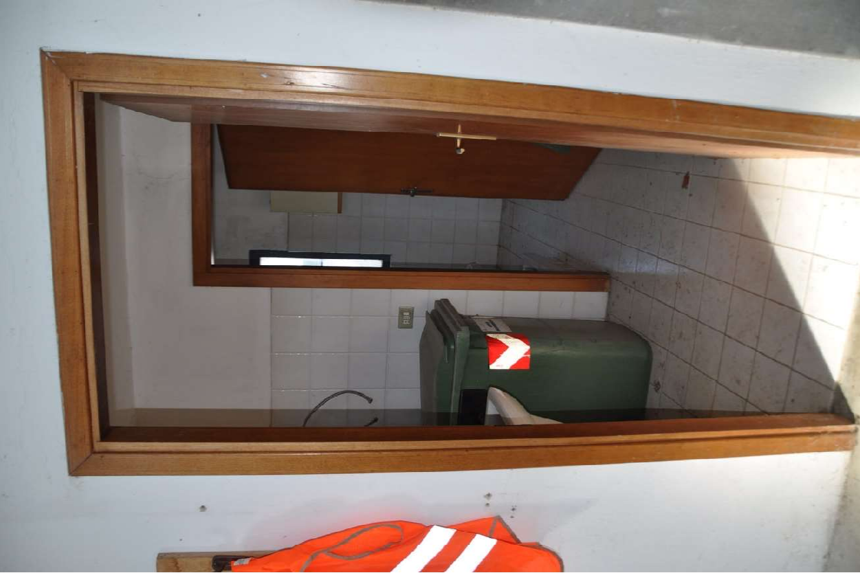
FOTO 12 LOCALE WC