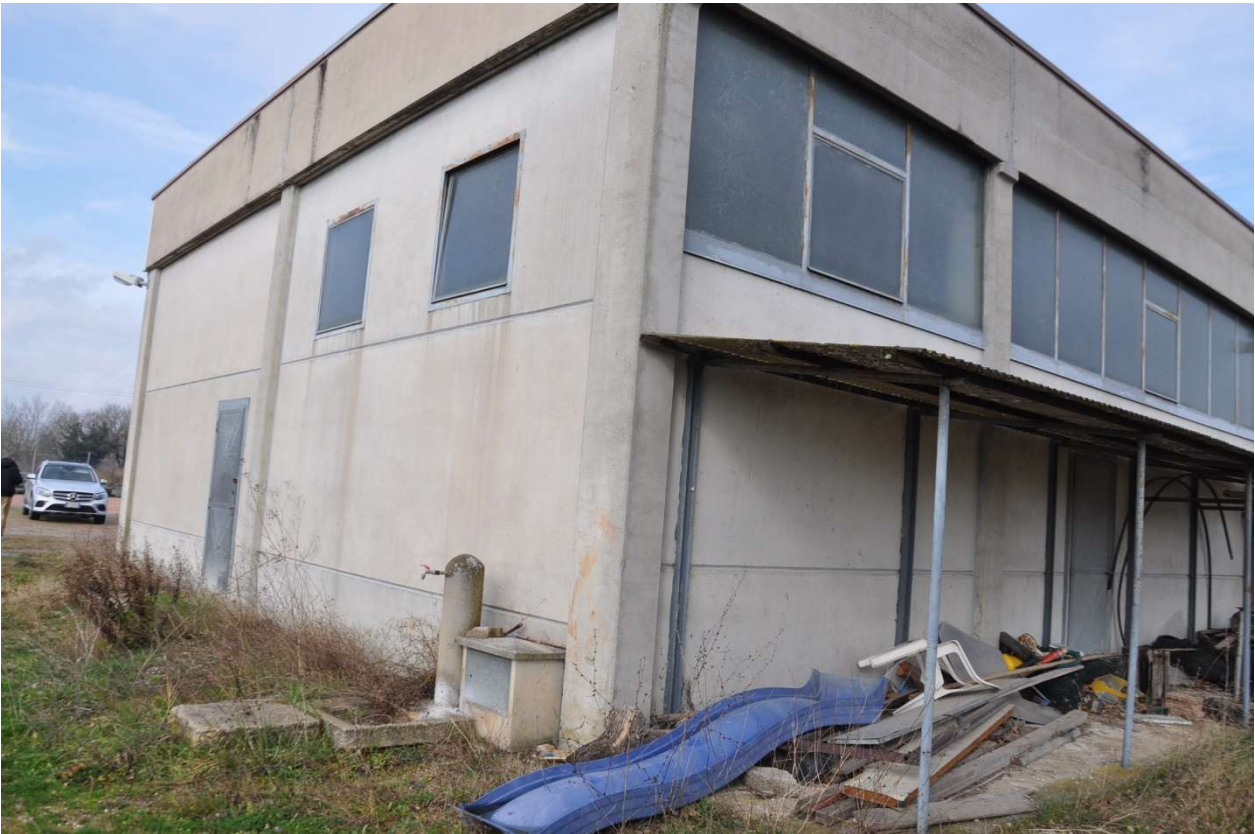
FOTO 4 PROSPETTO POSTERIORE