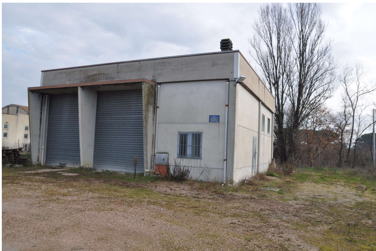
FOTO 2 PROSPETTO FABBRICATO LATERALE DX