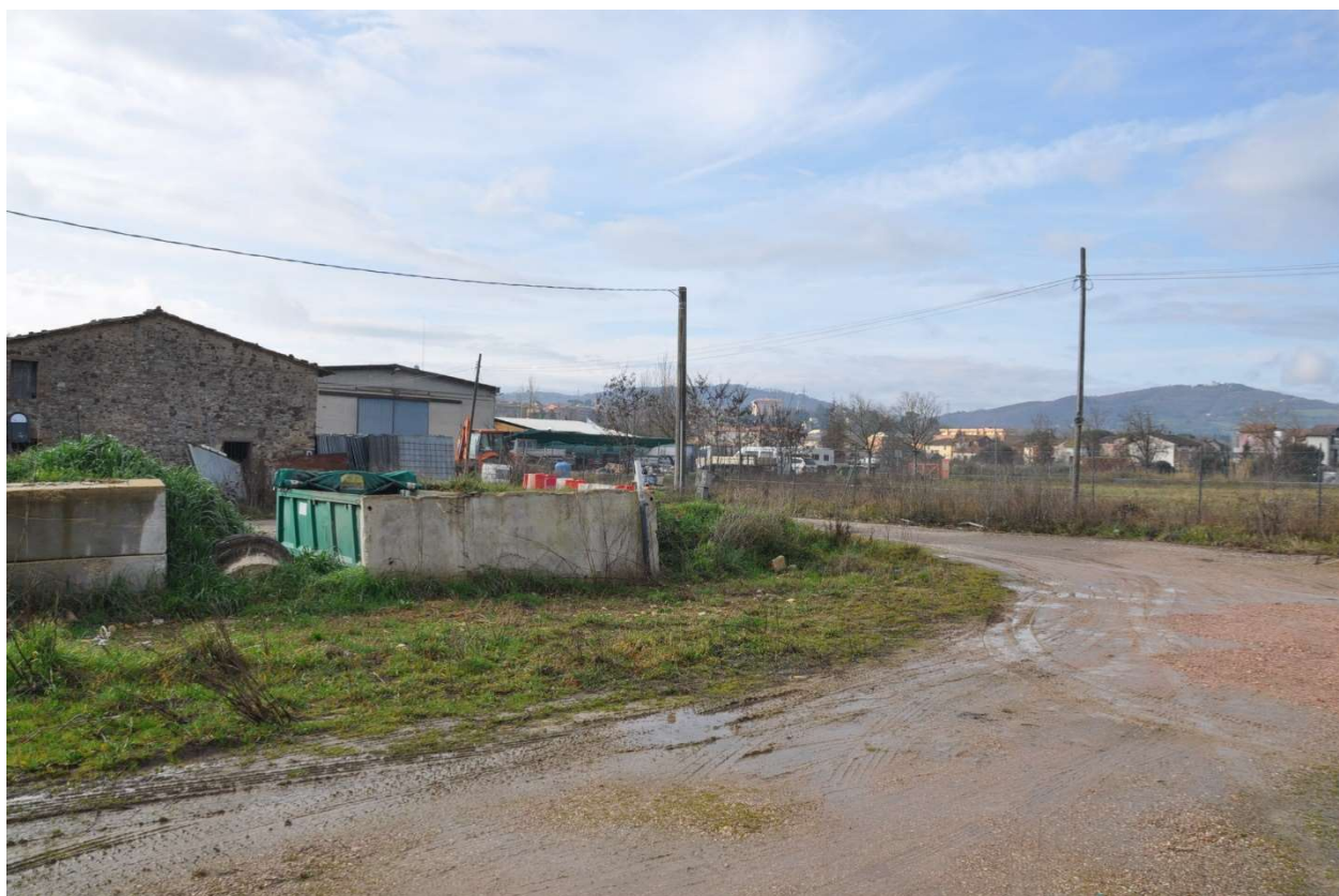
FOTO 8 ZONA INTERNA FABBRICATO