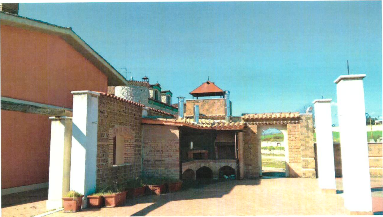
FOTO N. 25 - PIANO TERRA - PATIO A SERVIZIO DELL'INTERO COMPENDIO