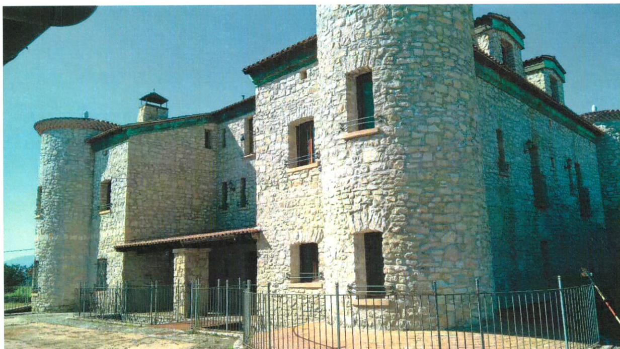
FOTO N. 8 - PROSPETTO - FABBRICATO A