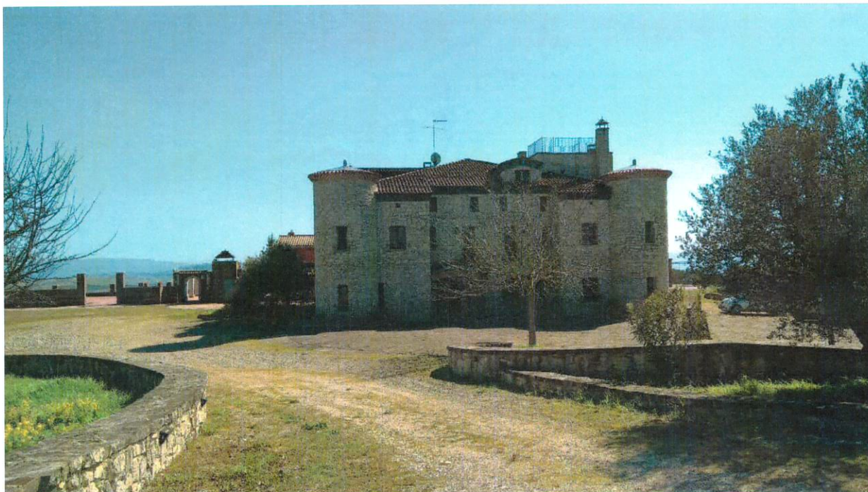
FOTO N. 3 - FABBRICATO A - PRINCIPALE - PROSPETTO ANTERIORE