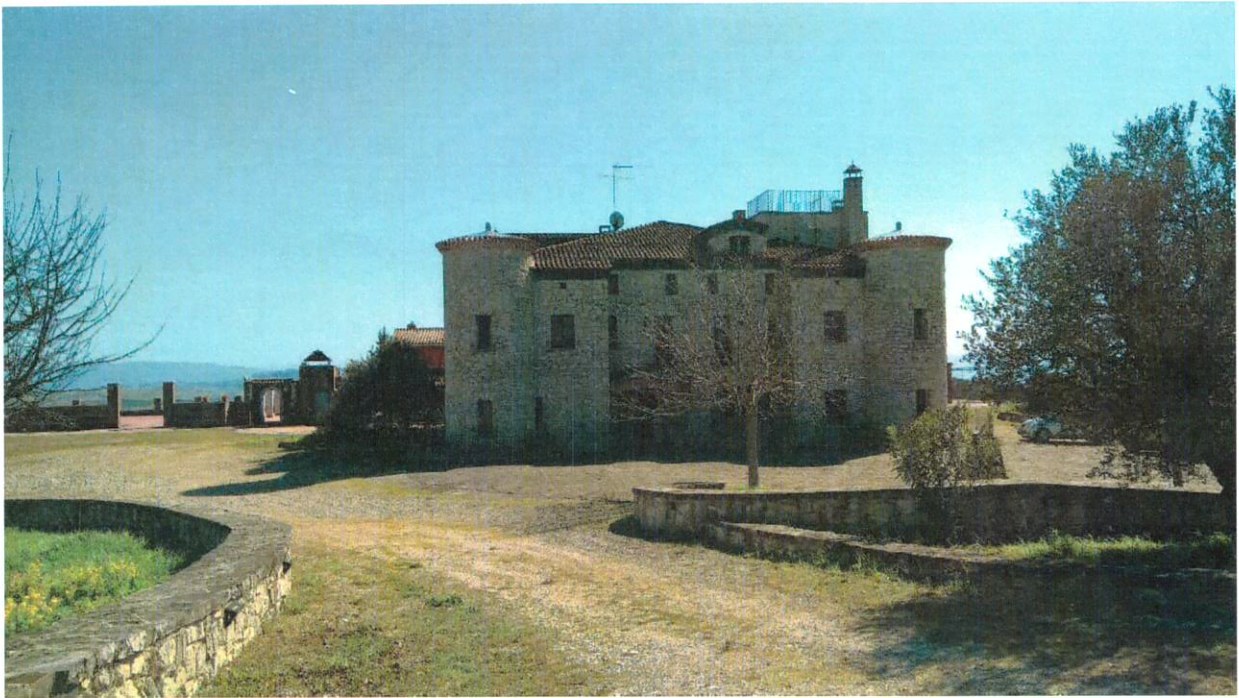
FOTO N. 3 - FABBRICATO A - PRINCIPALE - PROSPETTO ANTERIORE