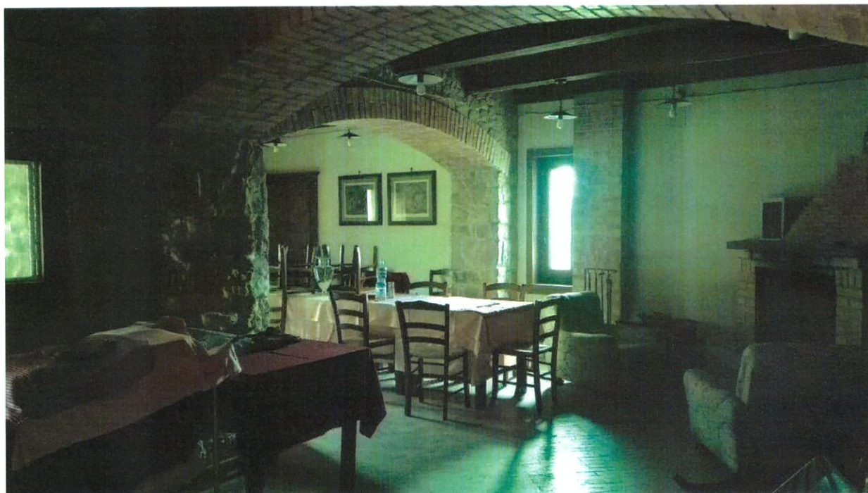
FOTO N. 13 - PIANO TERRA - SALA RISTORO -