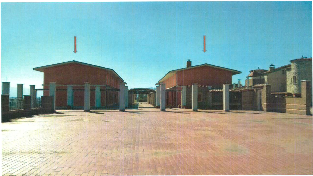
FOTO N. 26 - FABBRICATO B –TERRAZZON. 1 E CORPI DI FABBRICA ADIBITI A CONFEZIONAMENTO PRODOTTI E MENSA AZIENDALE