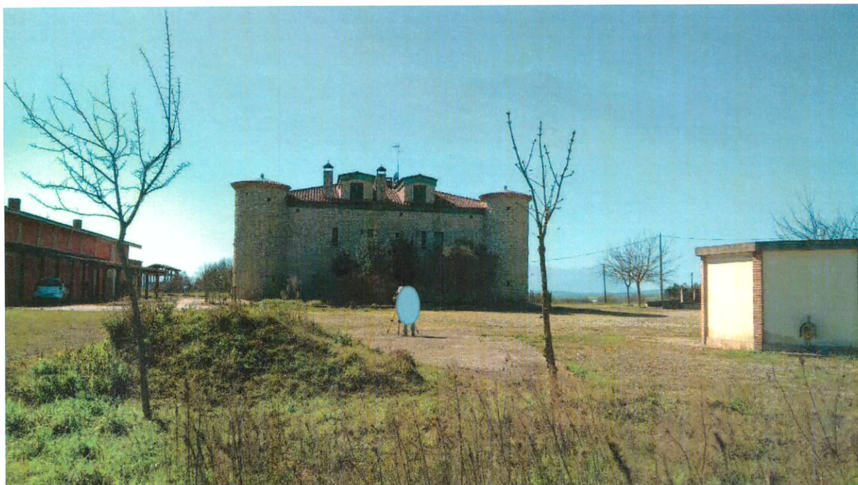
FOTO N. 7 - PROSPETTO LATERALE - FABBRICATO A-