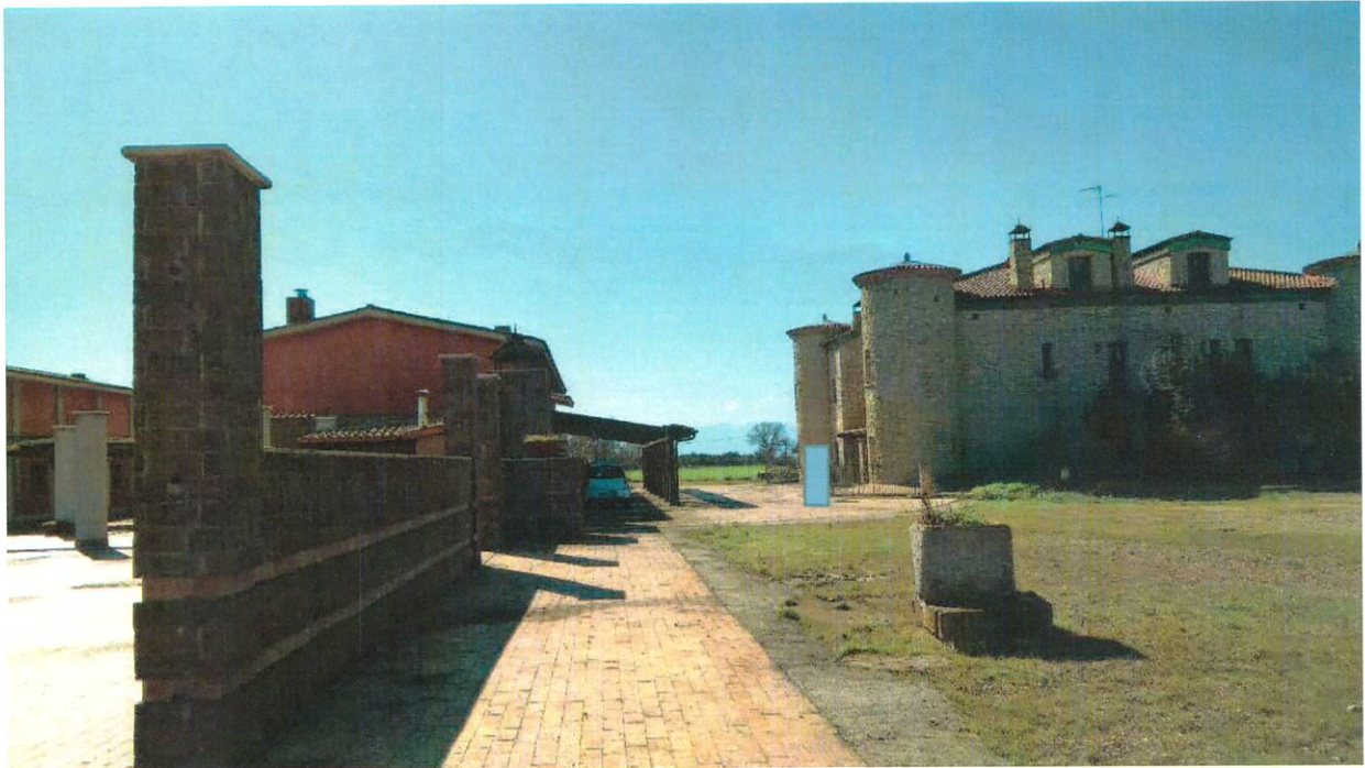
FOTO N. 21 - INGRESSO TERRAZZO E AREA PERTINENZIALE A SERVIZIO DEL COMPENDIO IMMOBILIARE