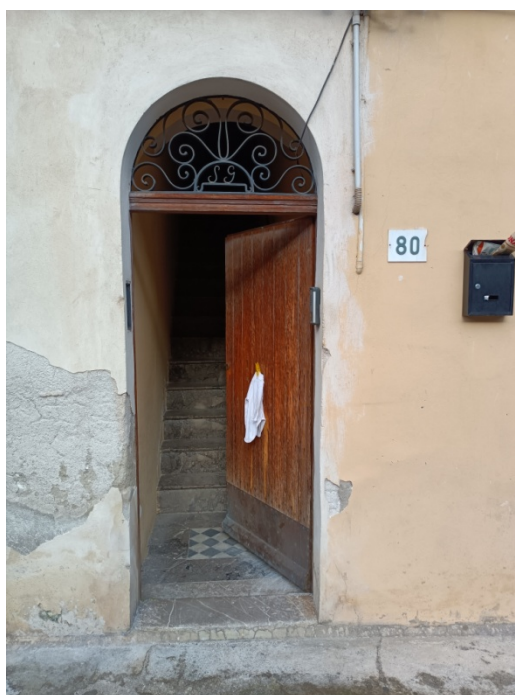
Foto n. 2 – Vista del portoncino di ingresso e del relativo numero civico