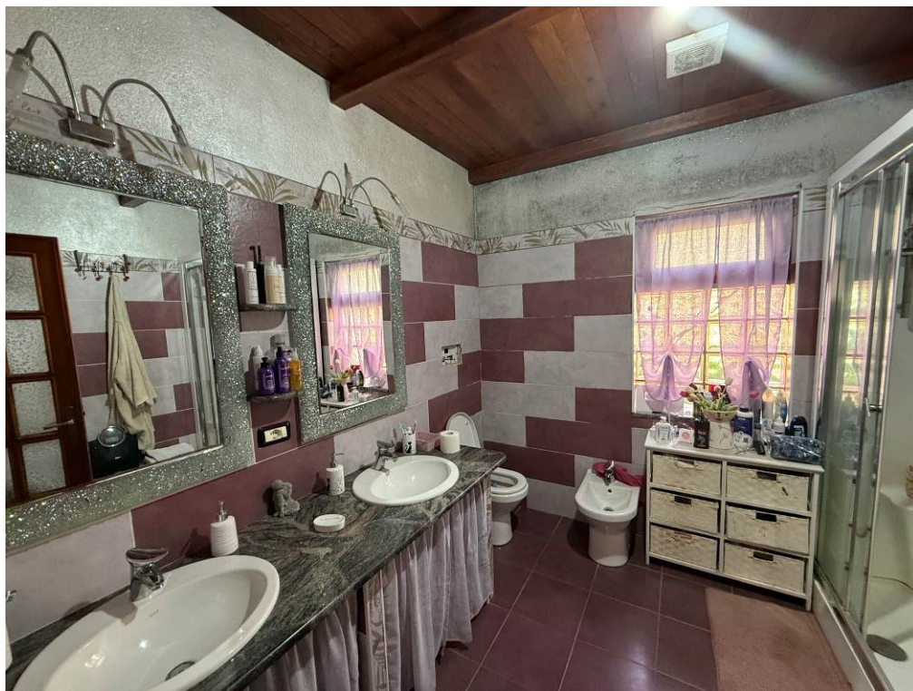
↪ Foto 2, piano terra - vista interna bagno