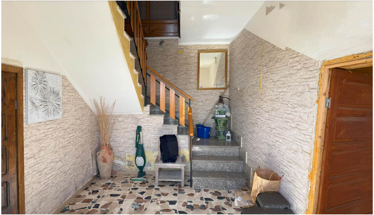
→ Foto 1, piano seminterrato - vista ingresso particolare scala comunicante con il piano terra (subaltrni 2)