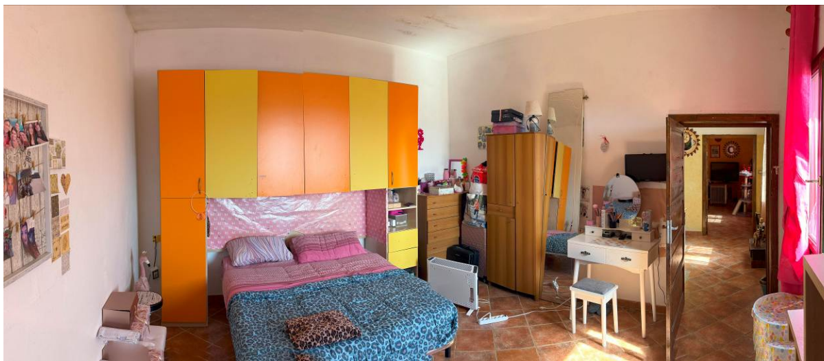
↳ Foto 2, piano terra - vista interna camera