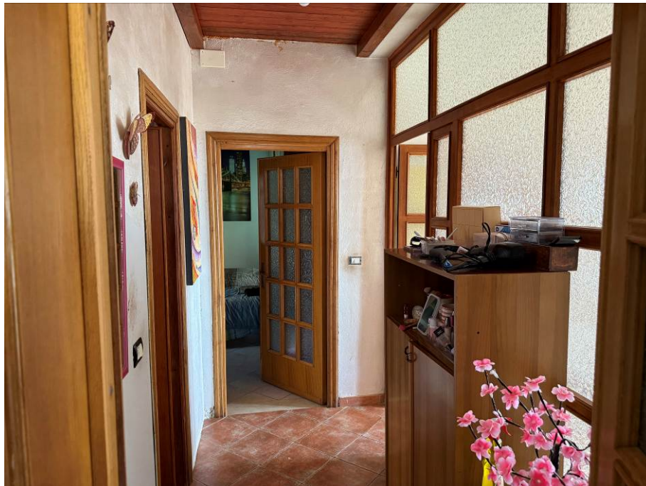
↪ Foto 1, piano terra - vista disimpegno comunicante con subalterno 2