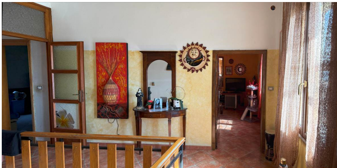
↳ Foto 1, piano terra - vista disimpegno comunicante con il piano terra (subaltern 1) e il subalterno 3