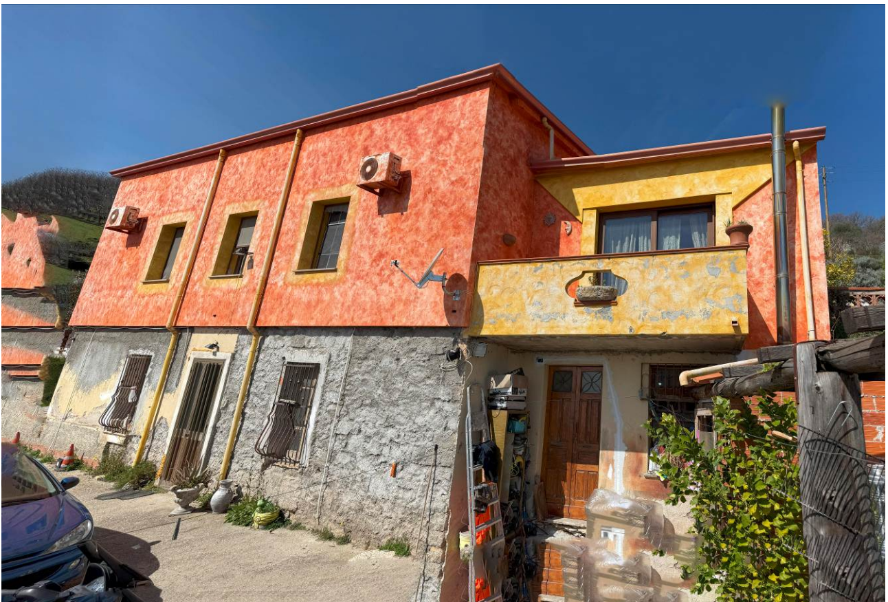
↪ Foto 4, vista esterna immobile, dalla corte dalla corte di pertinenza