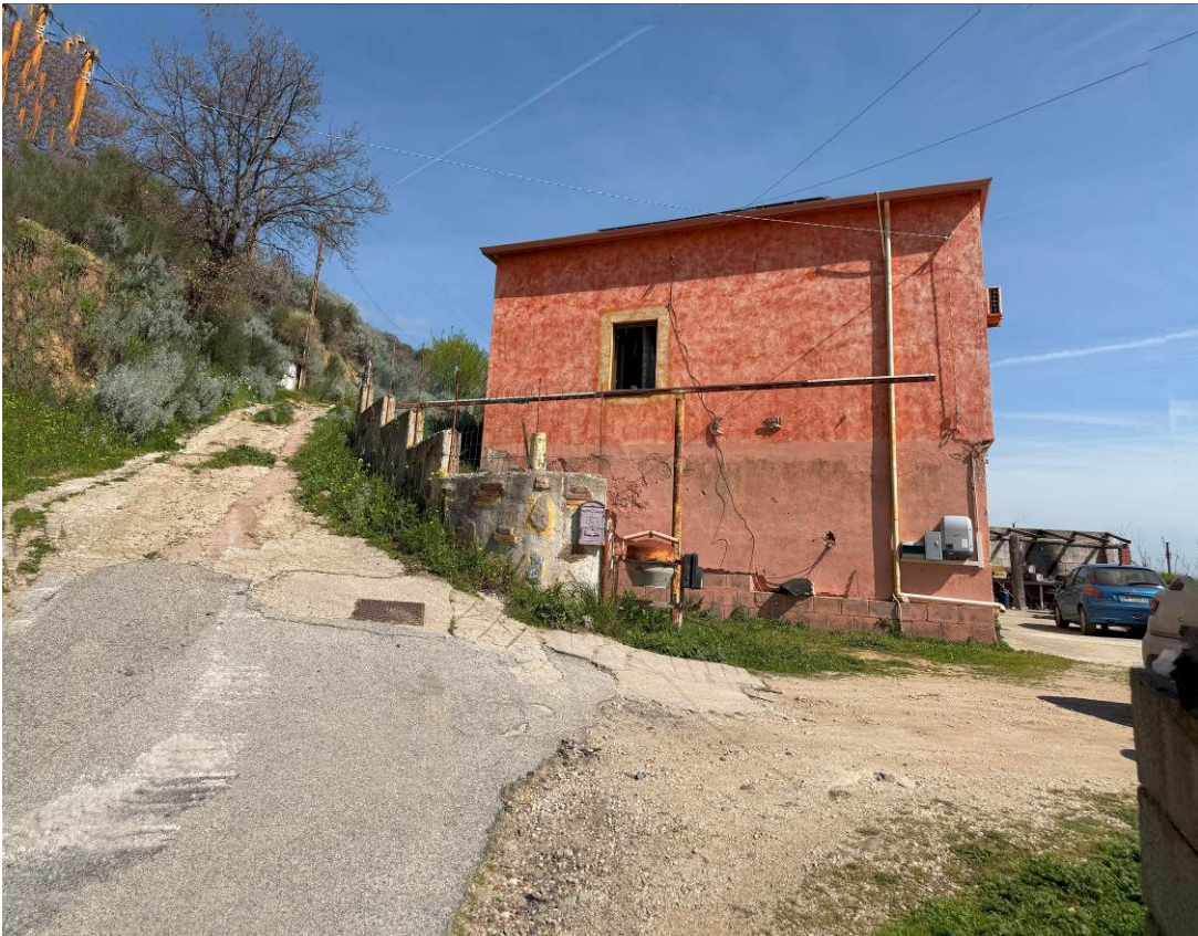
— Foto 1 e 2, vista esterna immobile dalla corte e dalla via Papa Giovanni XXIII