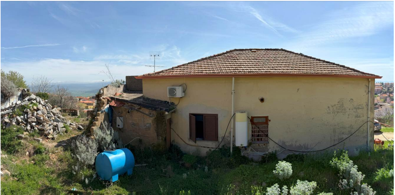
↪ Foto 3, vista esterna immobile, dalla via Papa Giovanni XXIII