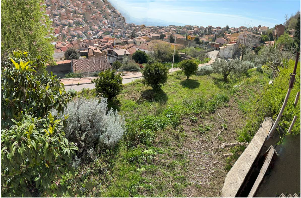
→ Foto 5, vista esterna – spaccato cortile esclusivo e di pertinenza