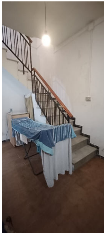
FOTO 10 - SCALE DAL DISIMPEGNO