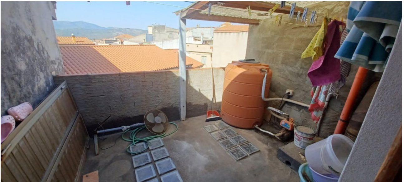
FOTO 27- TERRAZZO PIANO PRIMO