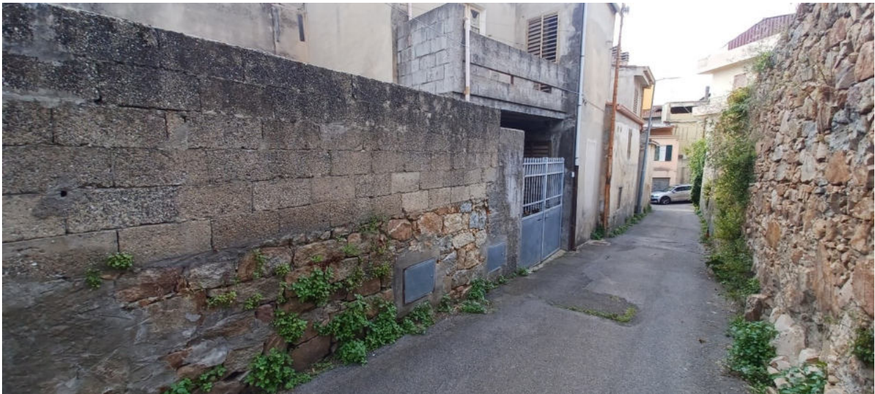
FOTO 04 - VISTA EDIFICIO DA SUD-EST