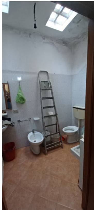
FOTO 14 - BAGNO PIANO TERRA E LUCERNAI