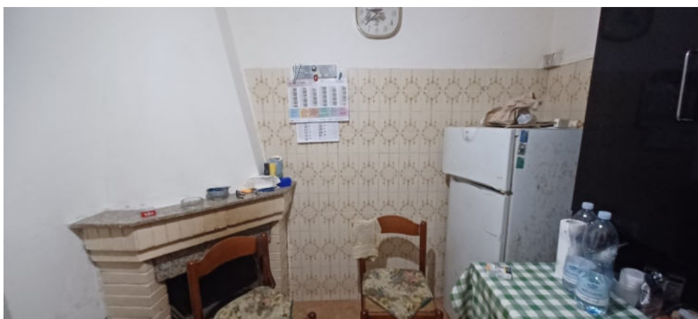
FOTO 12 - CUCINA