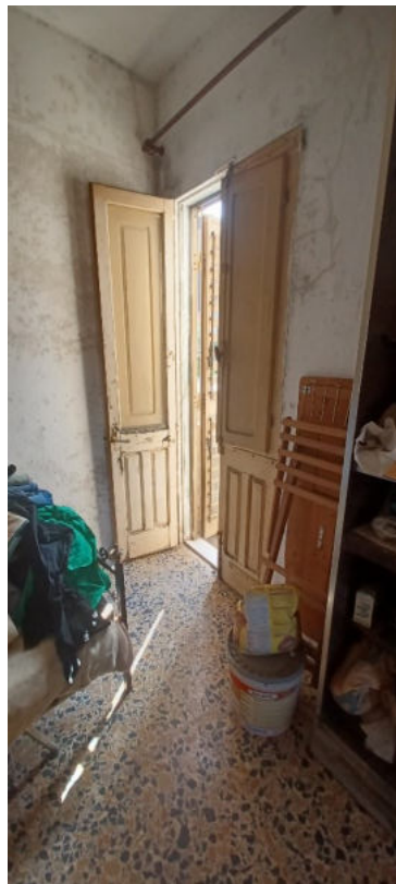
FOTO 20 - LETTO 2 ACCESSO AL BALCONE