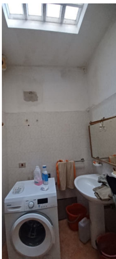
FOTO 15 - BAGNO PIANO TERRA