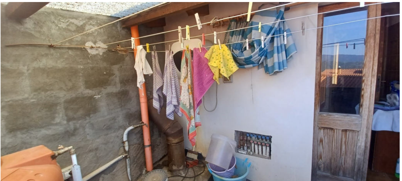
FOTO 28 - TERRAZZO PIANO PRIMO