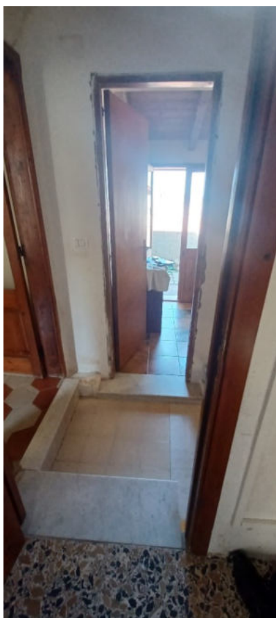
FOTO 17 - DISIMPEGNO PIANO PRIMO