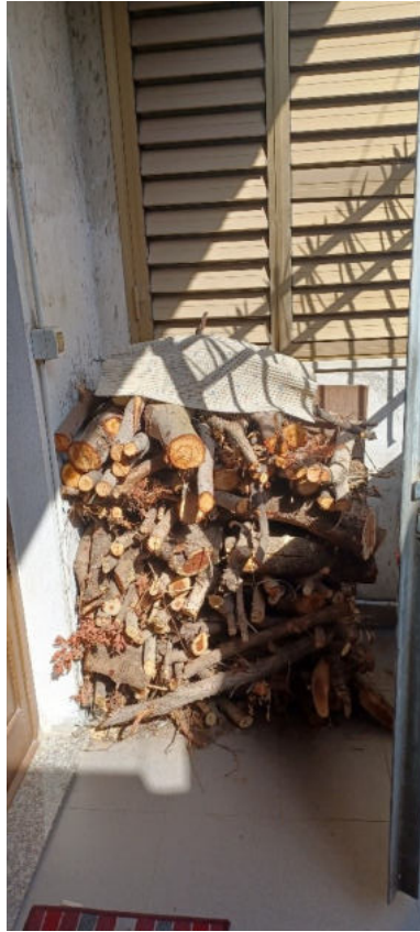
FOTO 07 - CORTILE INGRESSO