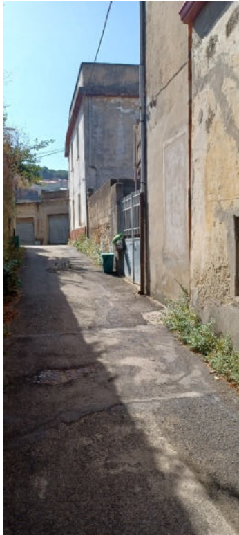
FOTO 05 - VISTA EDIFICIO DA NORD-OVEST