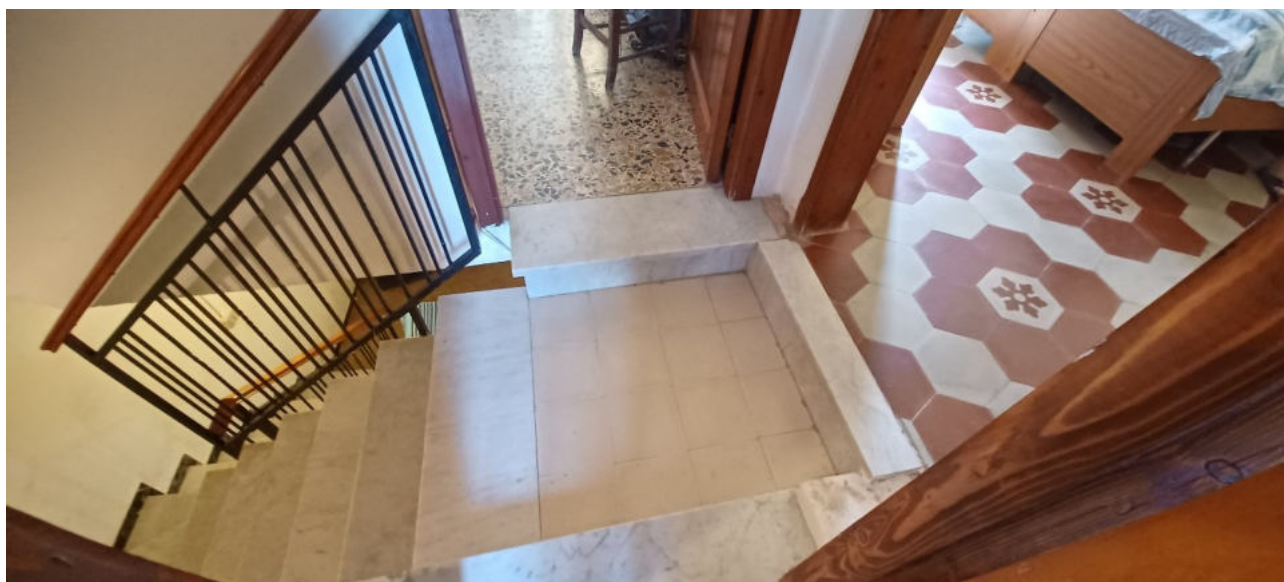
FOTO 16 - ARRIVO SCALE AL PIANO PRIMO