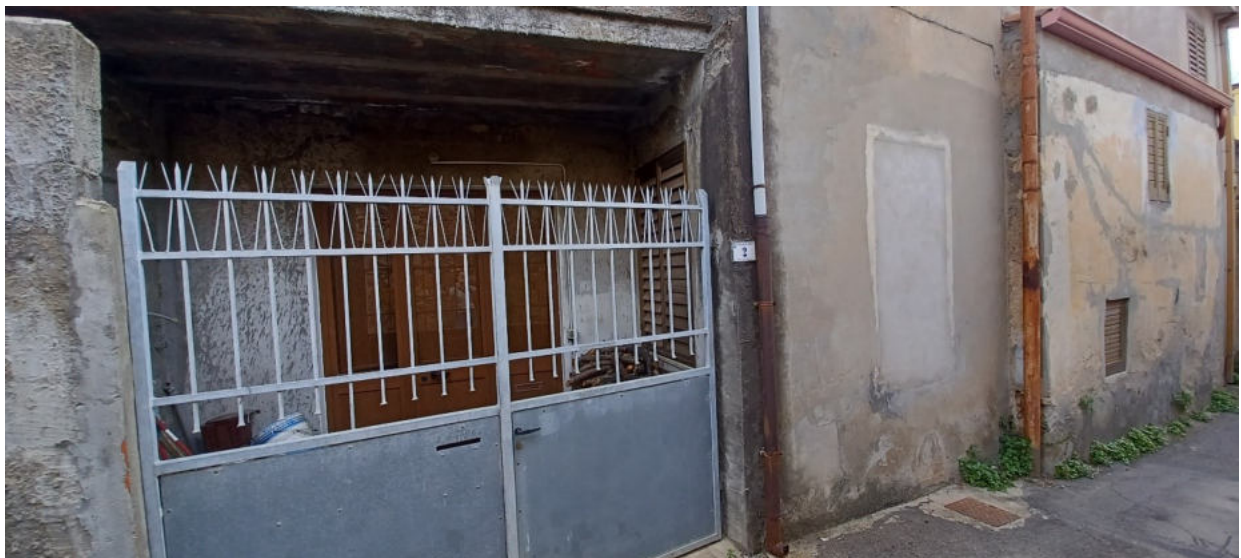
FOTO 06 - CANCELLO D'INGRESSO