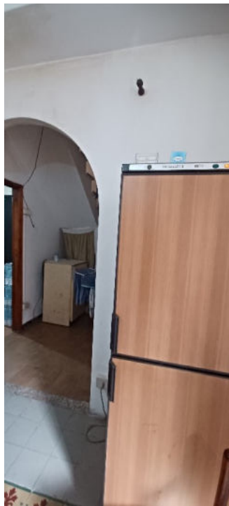
FOTO 08 - SOGGIORNO INGRESSO