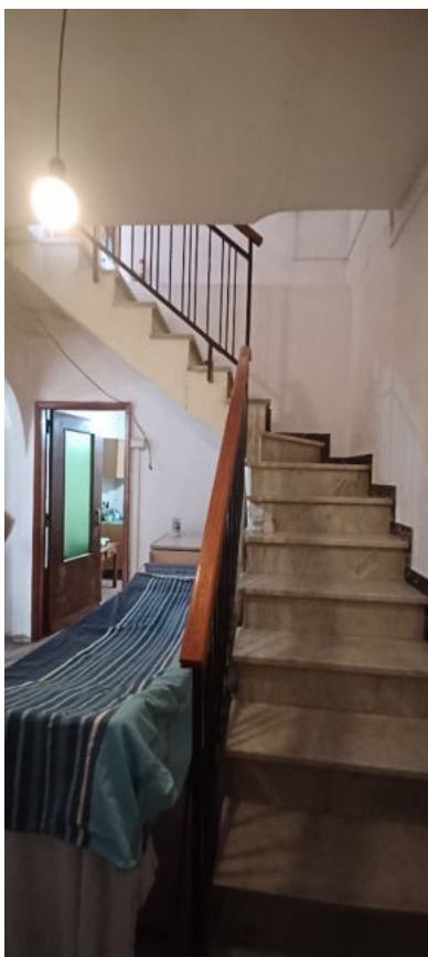
FOTO 11 - SCALE E PORTA ALLA CUCINA