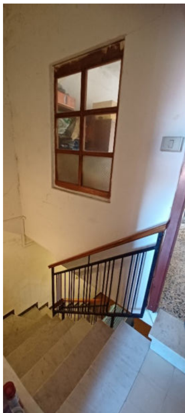
FOTO 18 - LUCE SCALE DAL LETTO 2