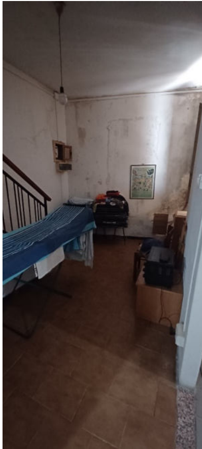
FOTO 09 - DISIMPEGNO E SCALE