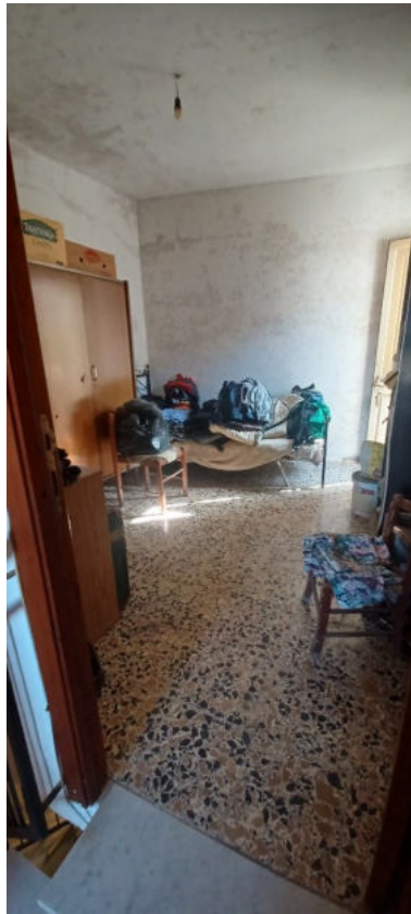
FOTO 19 - LETTO 2