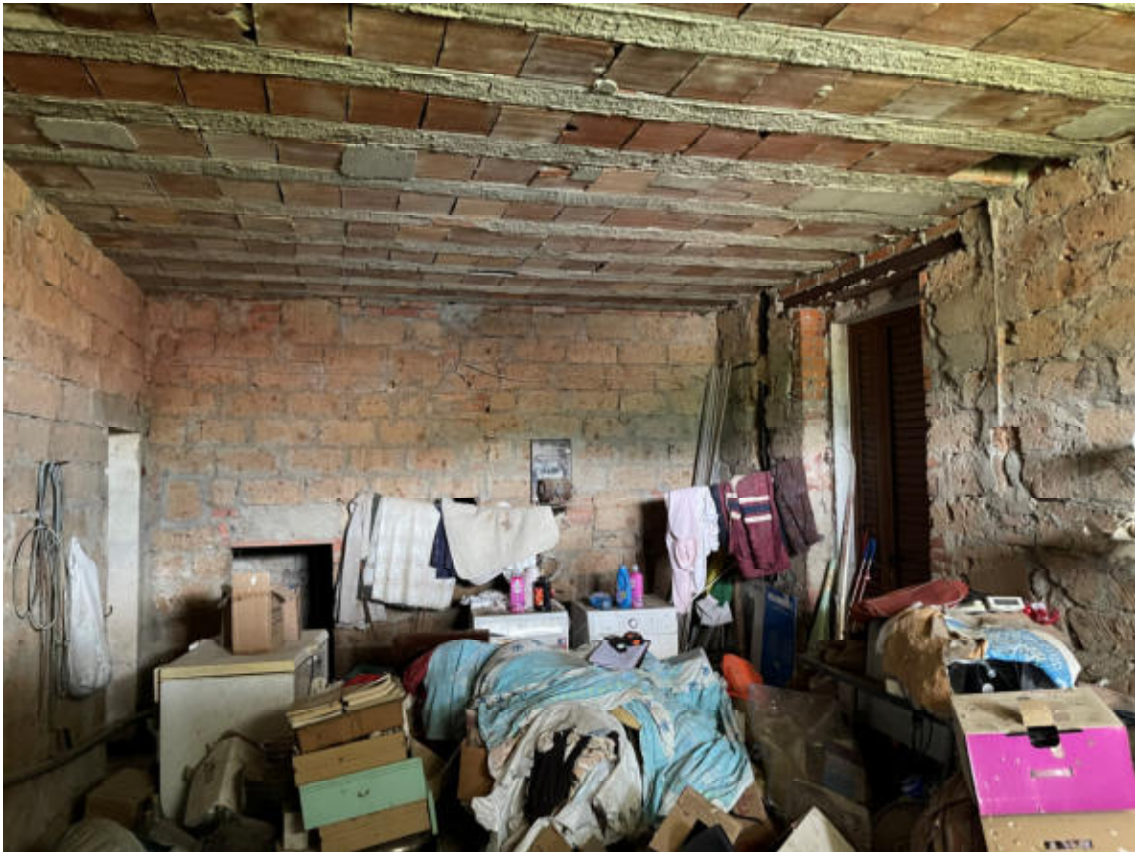
U.I. PT-Parte da adibire a zona giorno come da progetto, lato opposto