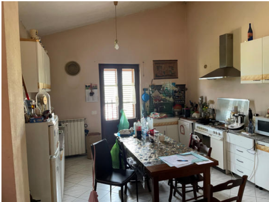
U.I. P1° - Soggiorno e Cucina, con porta di accesso al terrazzo