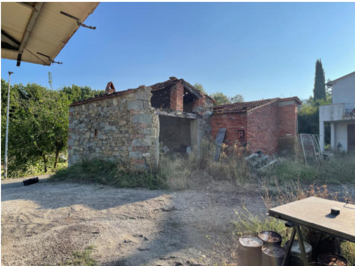
EDIFICIO SECONDARIO GRANDE