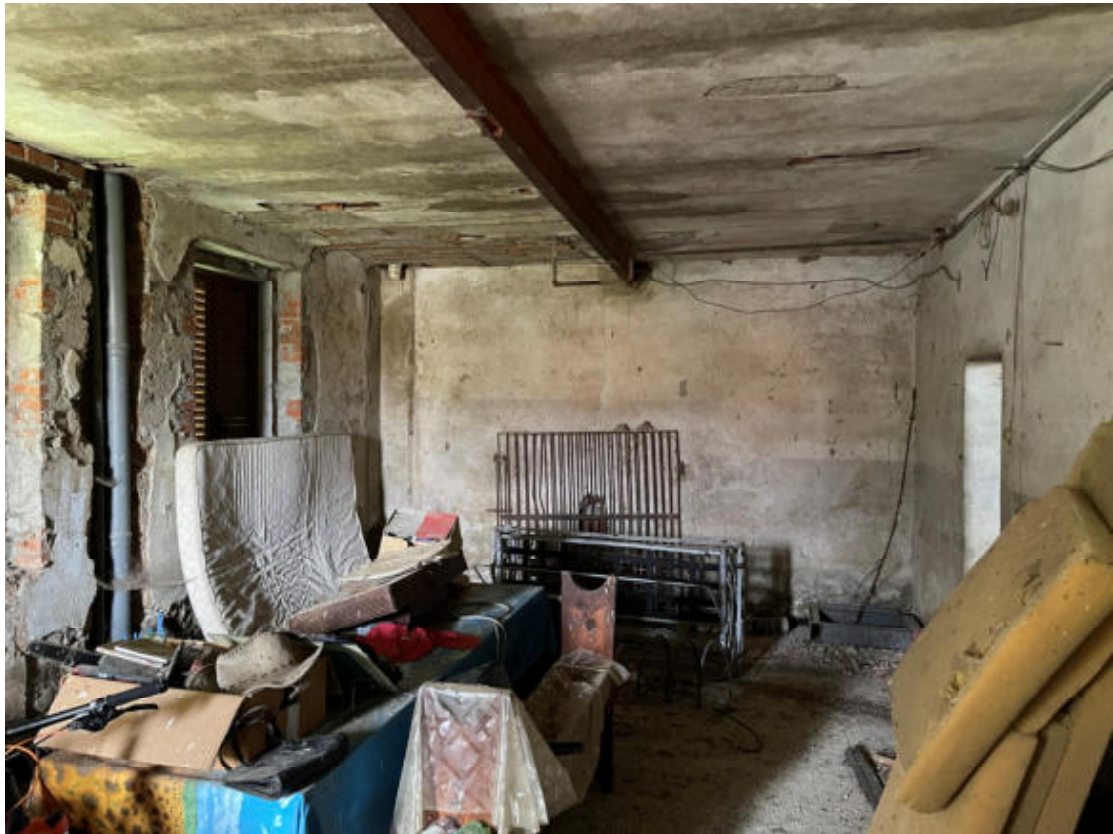
U.I. PT - Parte da adibire a zona notte/servizi come da progetto, lato opposto