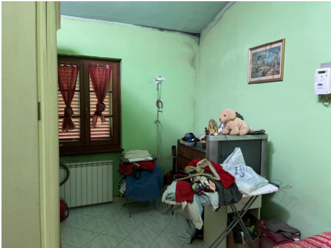
U.I. P1° - Camera/Pluriuso grande