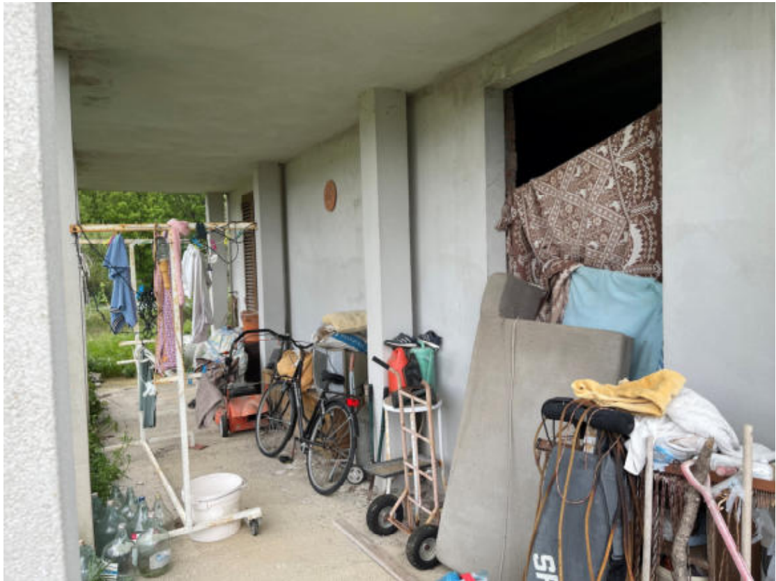
Portico Appartamento PT (ingresso u.i.)