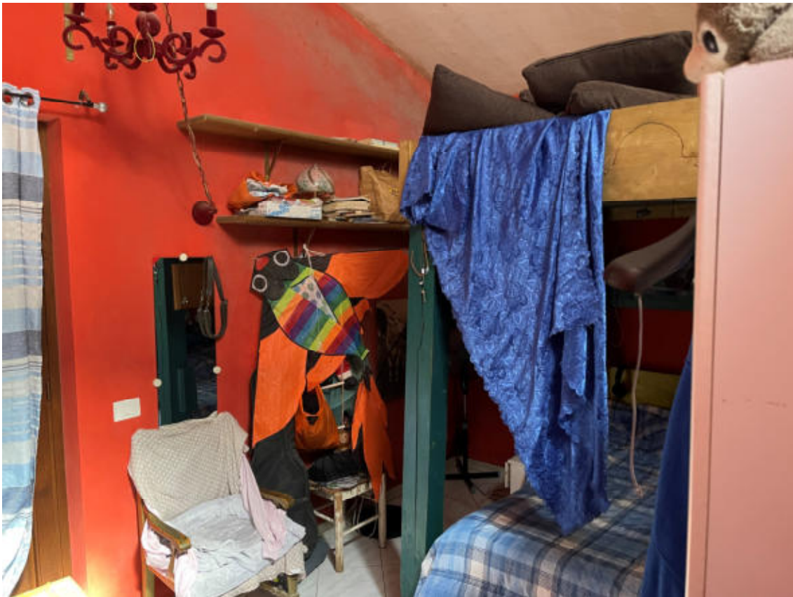
U.I. P1° - Camera piccola