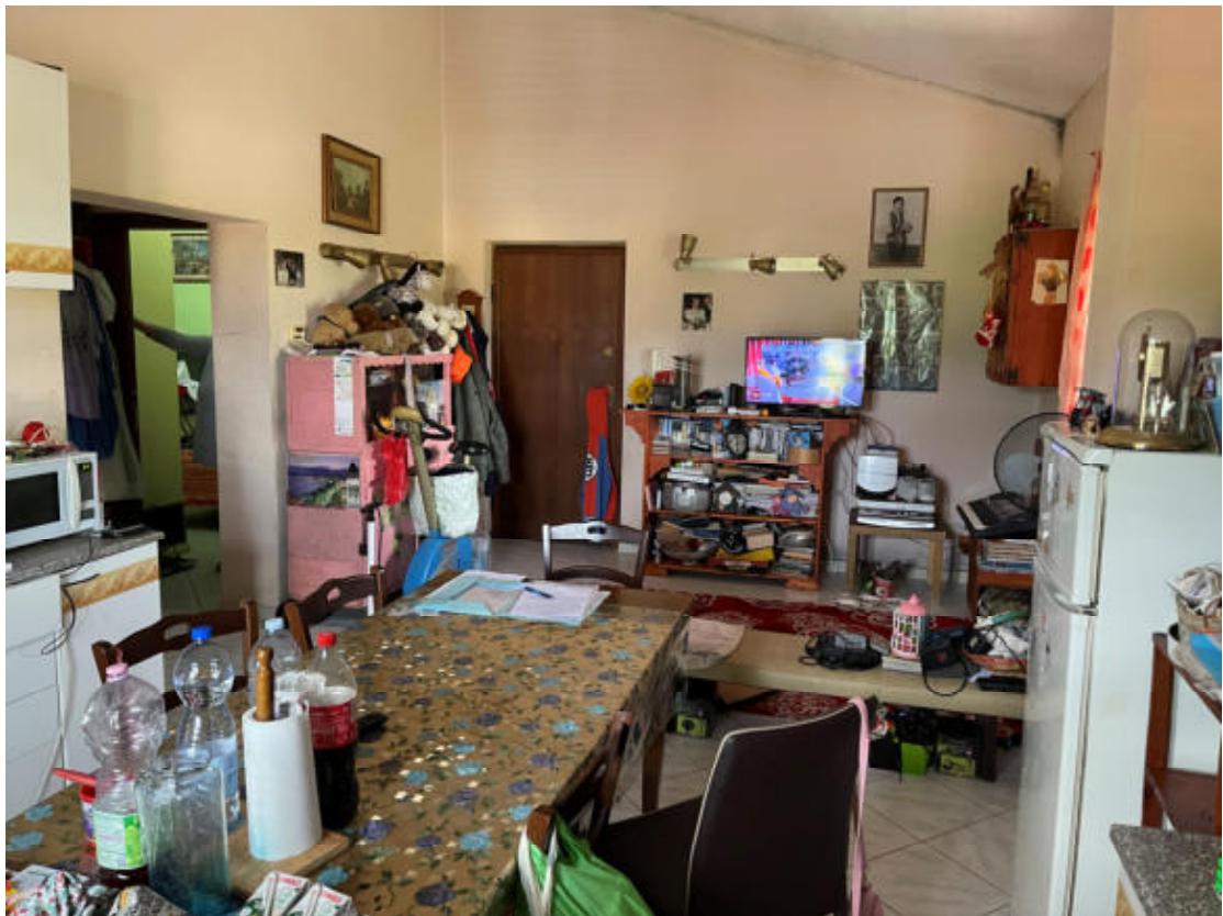
U.I. P1° - Soggiorno e Cucina