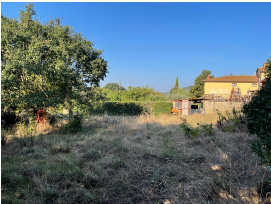
TERRENO AGRICOLO vista ovest