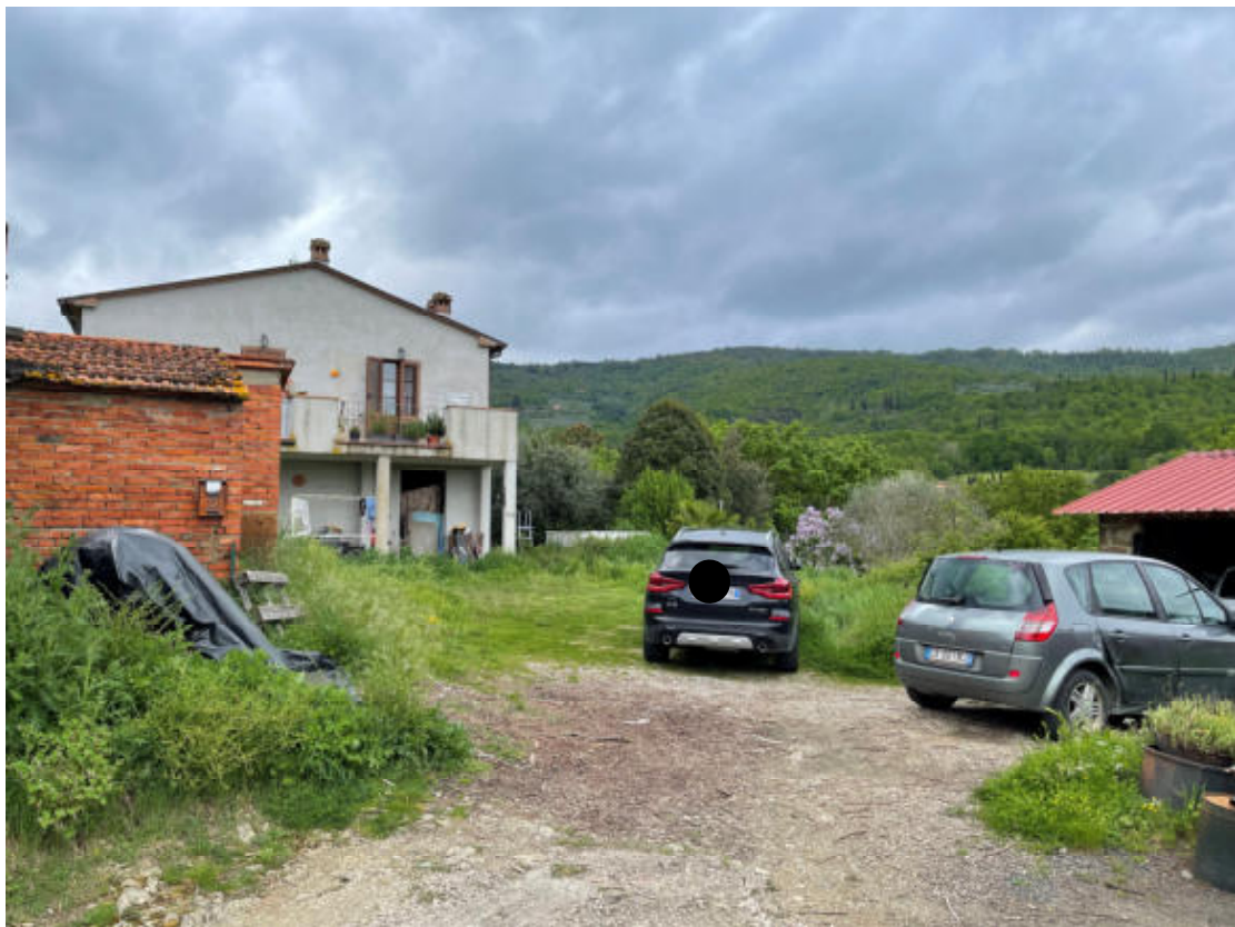
Fronte e Resede immobile