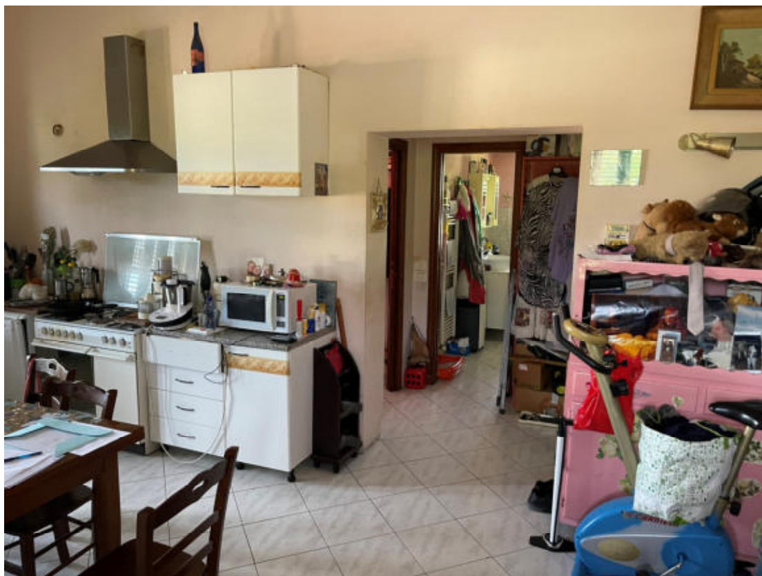
U.I. P1° - Soggiorno e Cucina, con vista disimpegno notte