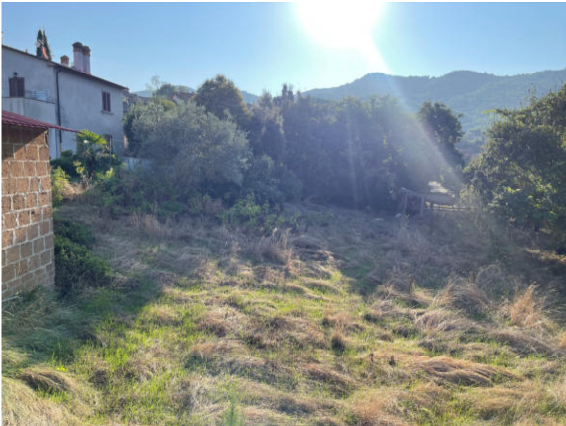
TERRENO AGRICOLO vista est