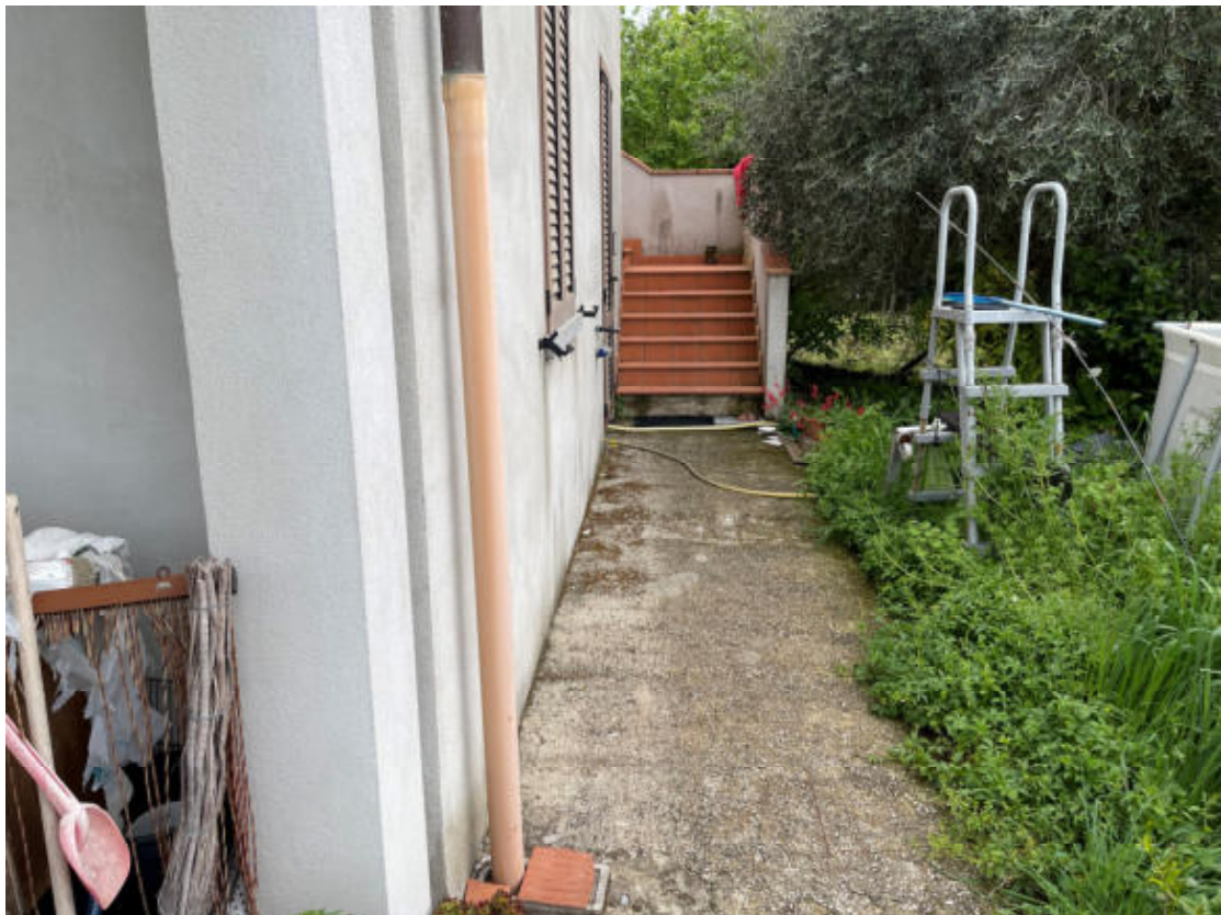
U.I. P1° - Scala scoperta di accesso appartamento P1°