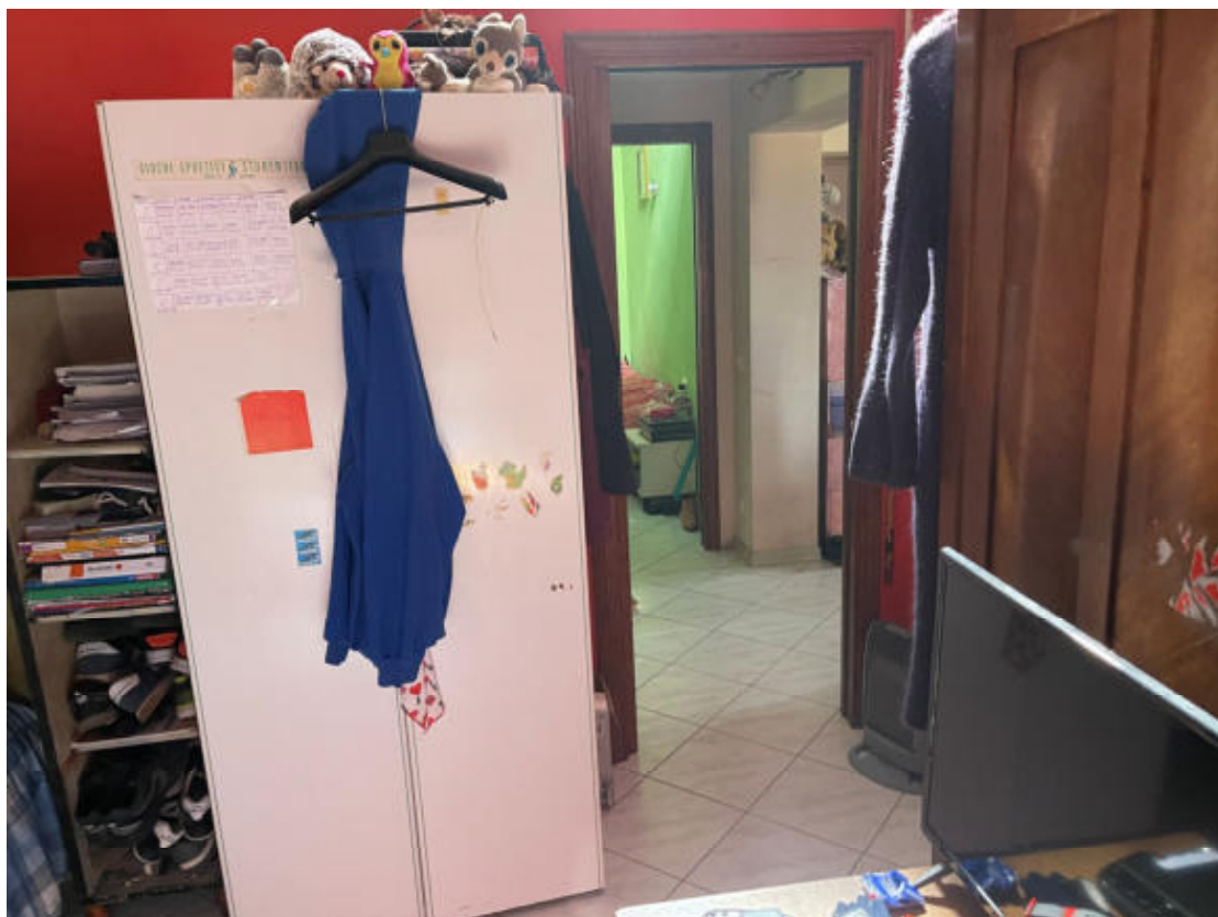
U.I. P1° - Camera piccola