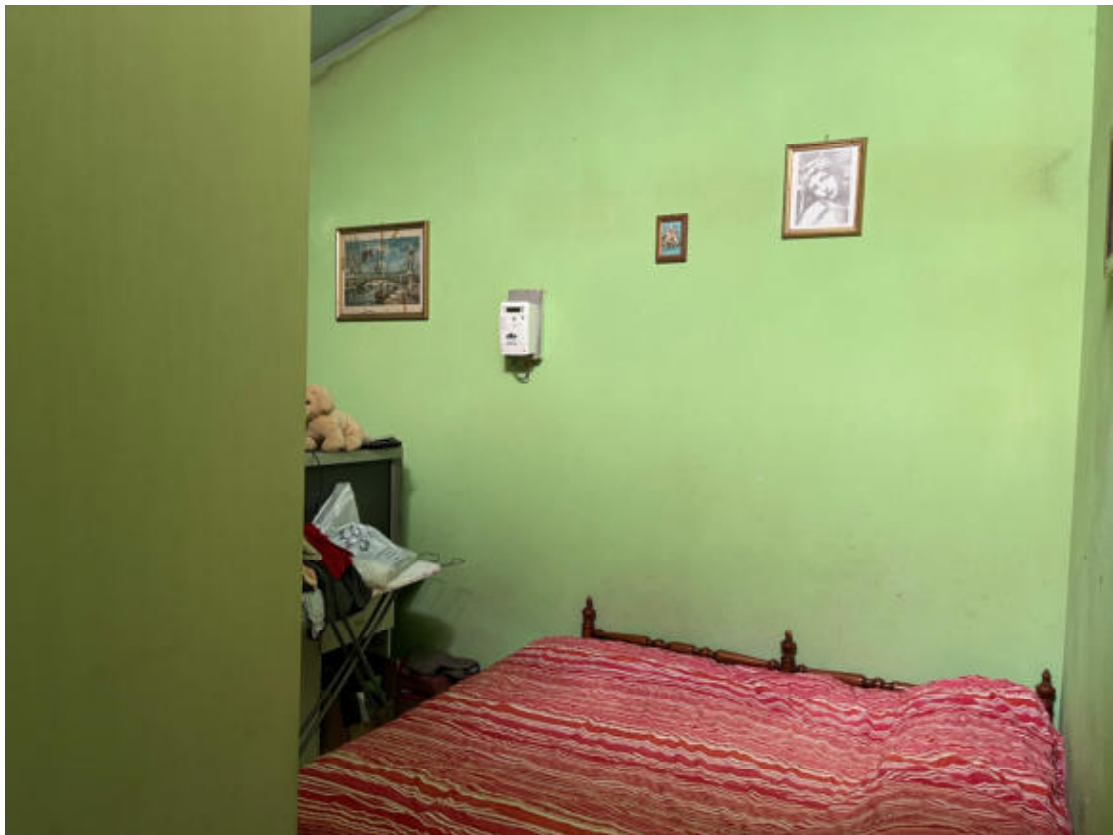
U.I. P1° - Camera/Pluriuso grande