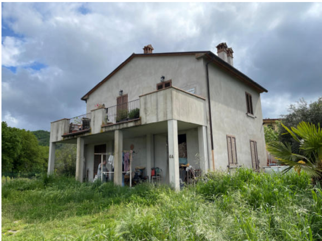
Fronte e lato destro