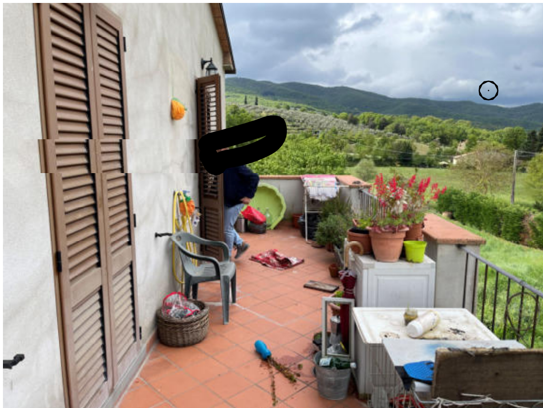
U.I. P1° - Terrazzo esclusivo sopra portico