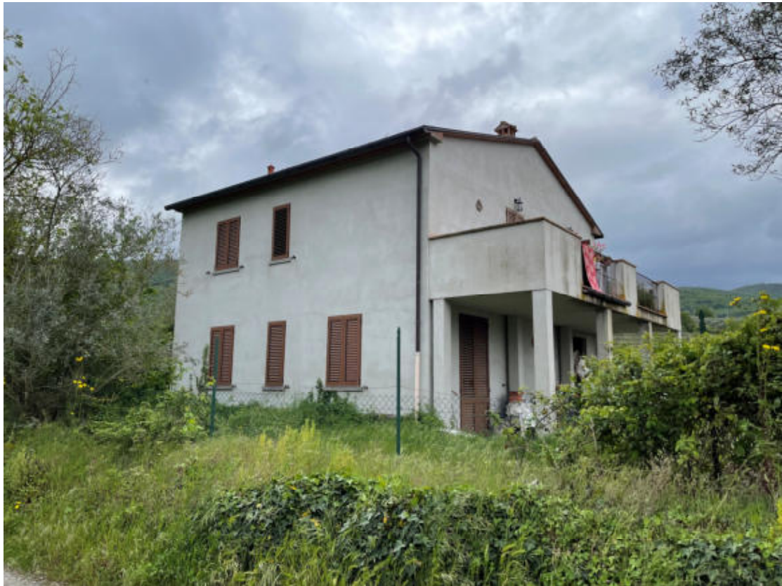
Lato sinistro e Fronte visti dalla Strada Comunale