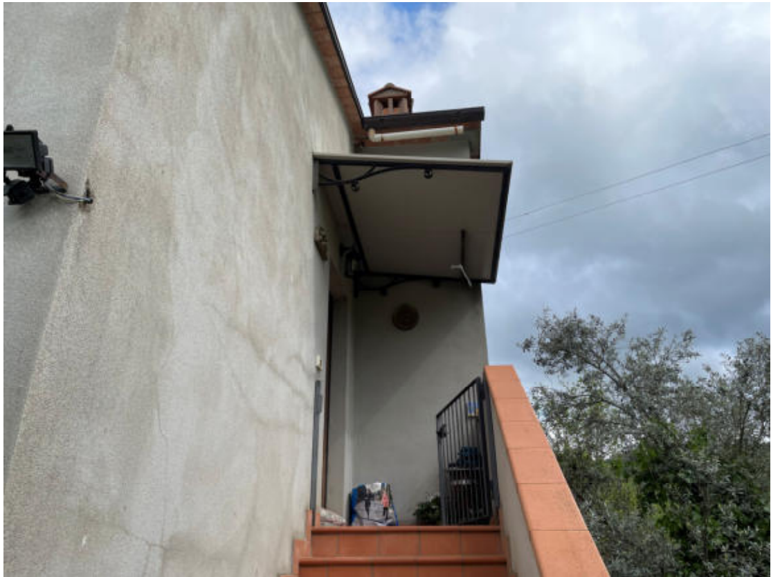
U.I. P1° - Scala Esterna/Ingresso appartamento