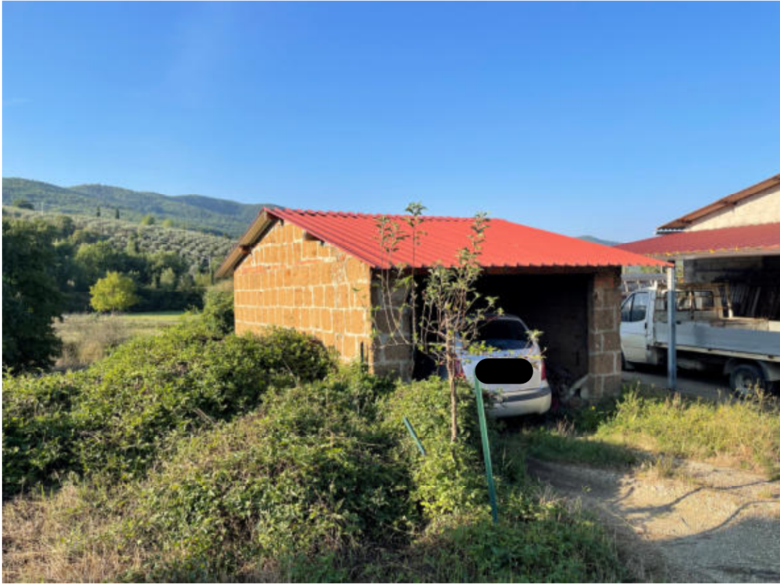
EDIFICIO SECONDARIO PICCOLO