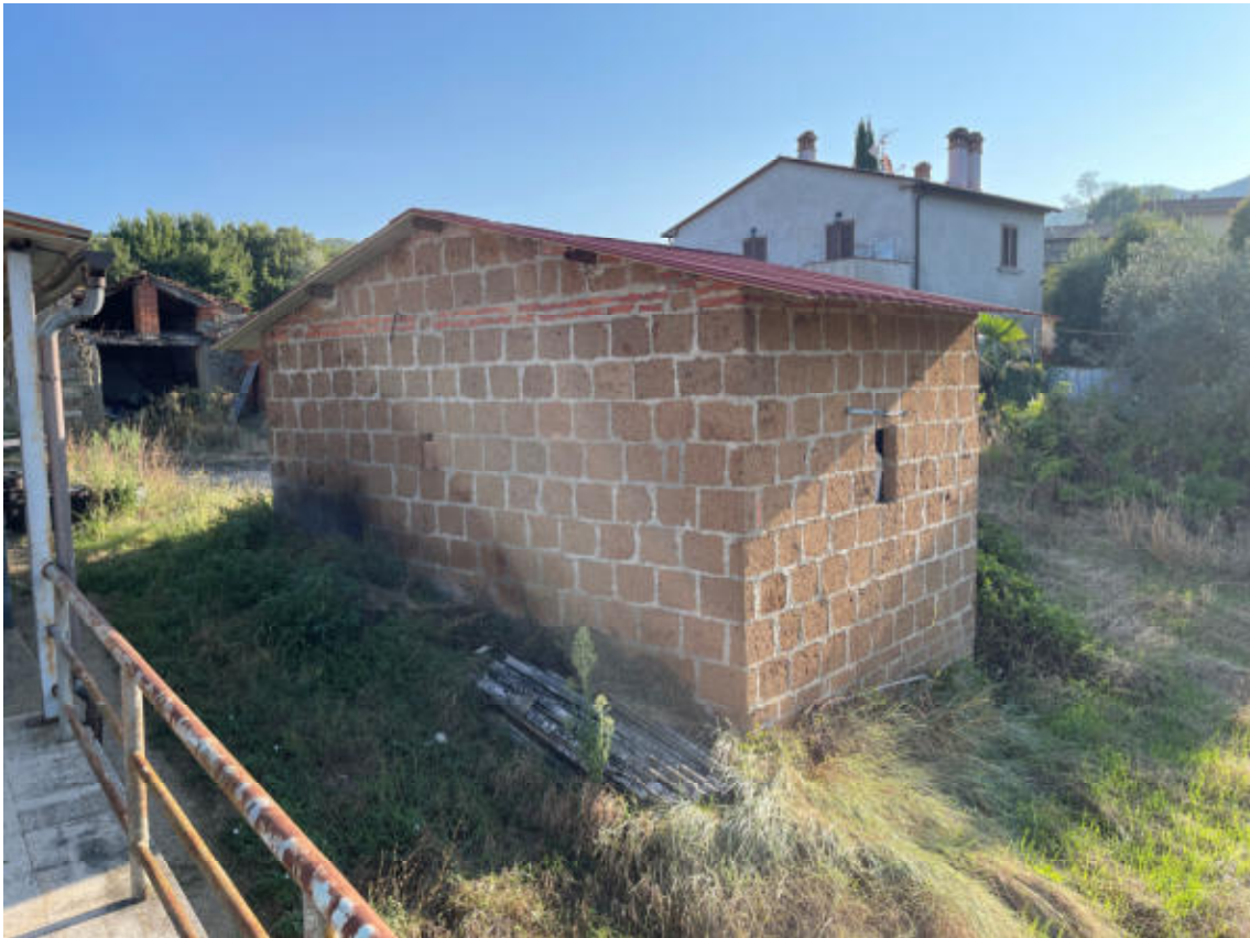
EDIFICIO SECONDARIO PICCOLO