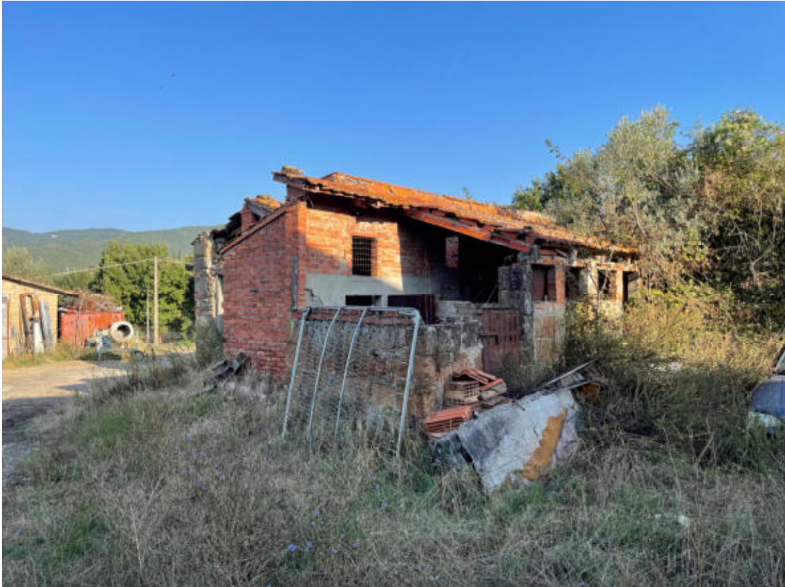
EDIFICIO SECONDARIO GRANDE