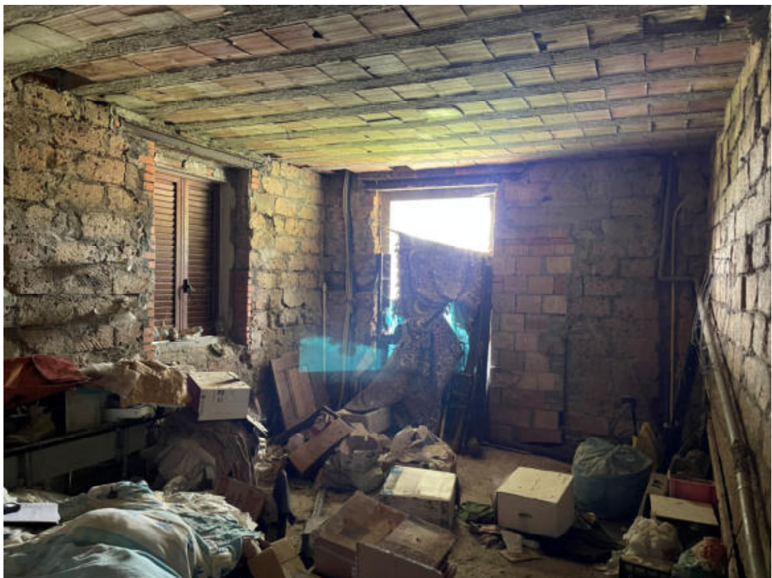
U.I. PT-Parte da adibire a zona giorno come da progetto