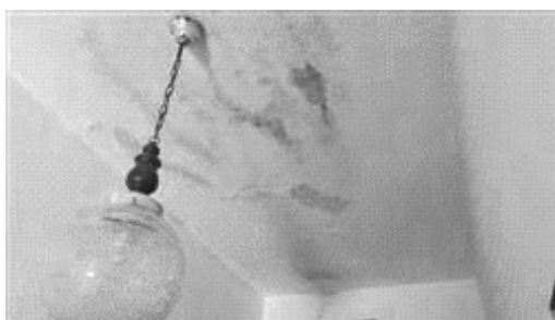
Segni di umidità nel corridoio.