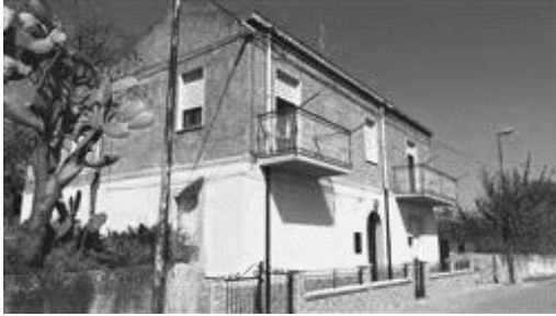
Vista esterna del fabbricato.

L'intero edificio sviluppa 2 piani, 2 piani fuori terra, .