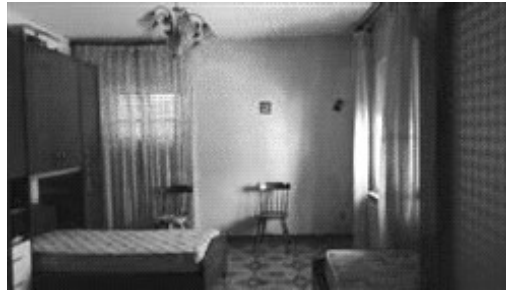
Camera indicata con il numero 1 nella planimetria catastale.