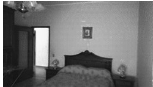
Camera indicata con il numero 2 nella planimetria catastale.