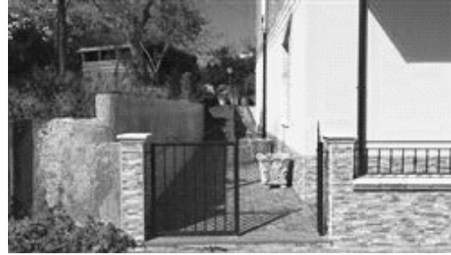
Ingresso dalla via pubblica.